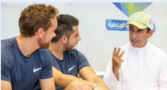
سعيد بن مكتوم مع لاعبي فريقه

التي ولدت بشكل مميز في دورة ند الشبا الرياضية. وأكد الشيخ سعيد بن مكتوم أن منافسات النسخة الحالية من الدورة شهدت مستويات قوية لجميع الفرق واللاعبين ما يؤكد التطور المستمر لها، وأضاف: نأمل أن يستمر تطور اللاعبين المواطنين والأجانب من أجل الارتقاء بالعبة