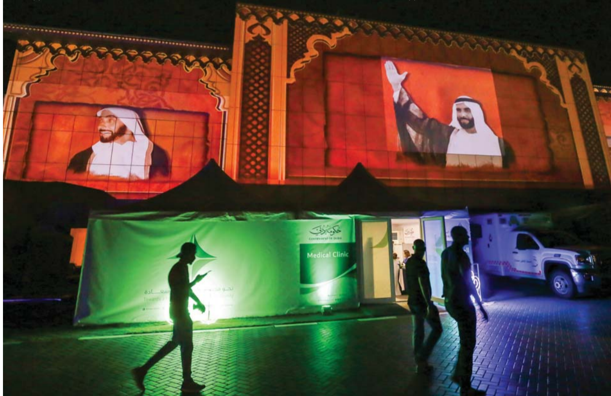
صور الشيخ زايد تزين مجمع ند الشبا | البيان

طيب الله ثراه، في كل عام، والتي يتفاعل معها جميع زوار المجمع من مختلف الجنسيات والأعمار، وكونها تحمل رسالة وفاء وتقدير لا ينضب للقائد الراحل الذي أفنى عمره في بناء الوطن وترسيخ قواعد الرخاء والازدهار والتعليم والأمن والتعايش بسلام في هذا الوطن فحوله إلى ما هو عليه الآن واحة سلام وازدهار منهجه السعادة والإبداع، ووضع نهجا ترجمته القيادة الرشيدة سيرا على خطى الوالد المؤسس.