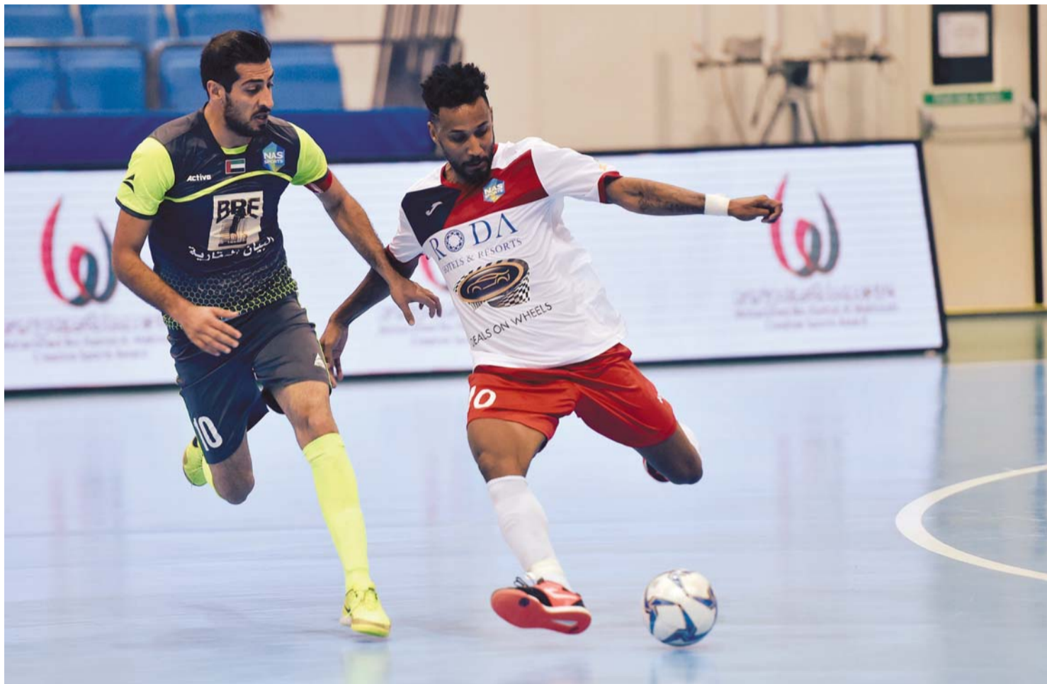
جيفرسون (رقم 10) أحد أبرز نجوم كرة الصالات في العالم