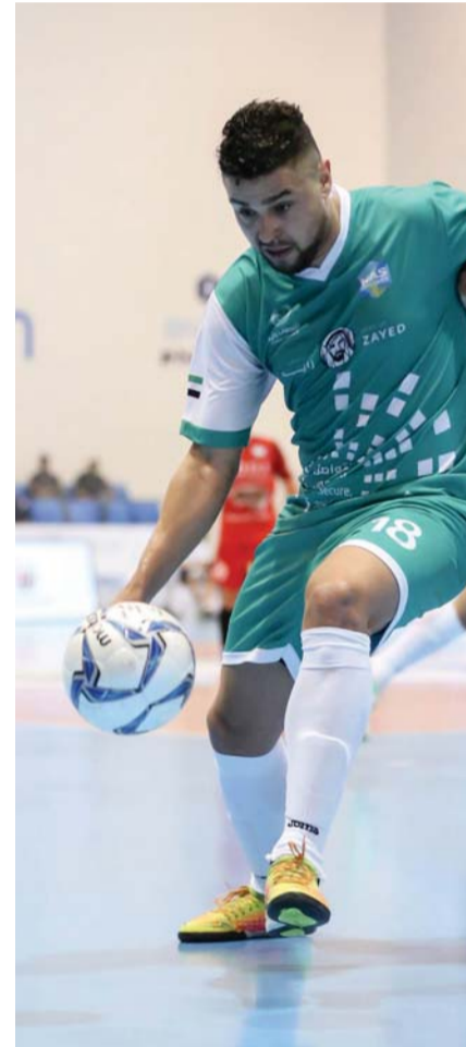
خضر | البيان

ومقابل بروز هؤلاء النجوم، لم يحالف الحظ الأسباني بول باجيكو غوانزاليس لاعب فريق «ام كي أس» وسانت كولوما الأسباني، في الظهور بأداء لافت في مستوى نجومته وغادر البطولة مطروداً بالبطاقة الحمراء.