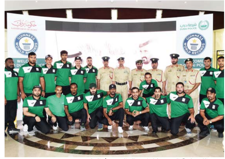
عبدالله خليفة المري خلال استقبال الفريق

استقبل اللواء عبدالله خليفة المري، القائد العام لشرطة دبي، فريق شرطة دبي المشارك في بطولة كرة قدم الصالات بدورة ند الشبا، التي انطلقت فعالياتها تحت رعاية كريمة من سمو الشيخ حمدان بن محمد بن راشد آل مكتوم، ولي عهد دبي رئيس مجلس دبي الرياضي، وينظمها مجلس دبي الرياضي، وذلك في مقر القيادة العامة بحضور اللواء الدكتور السلال سعيد بن هويدى الفلاسي، مساعد