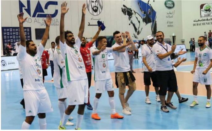
فرحة لاعبي «الإمارات للسياقة» بالتأهل إلى النهائي | البيان