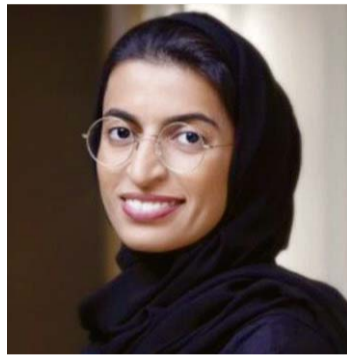
■ نورة الكعبي