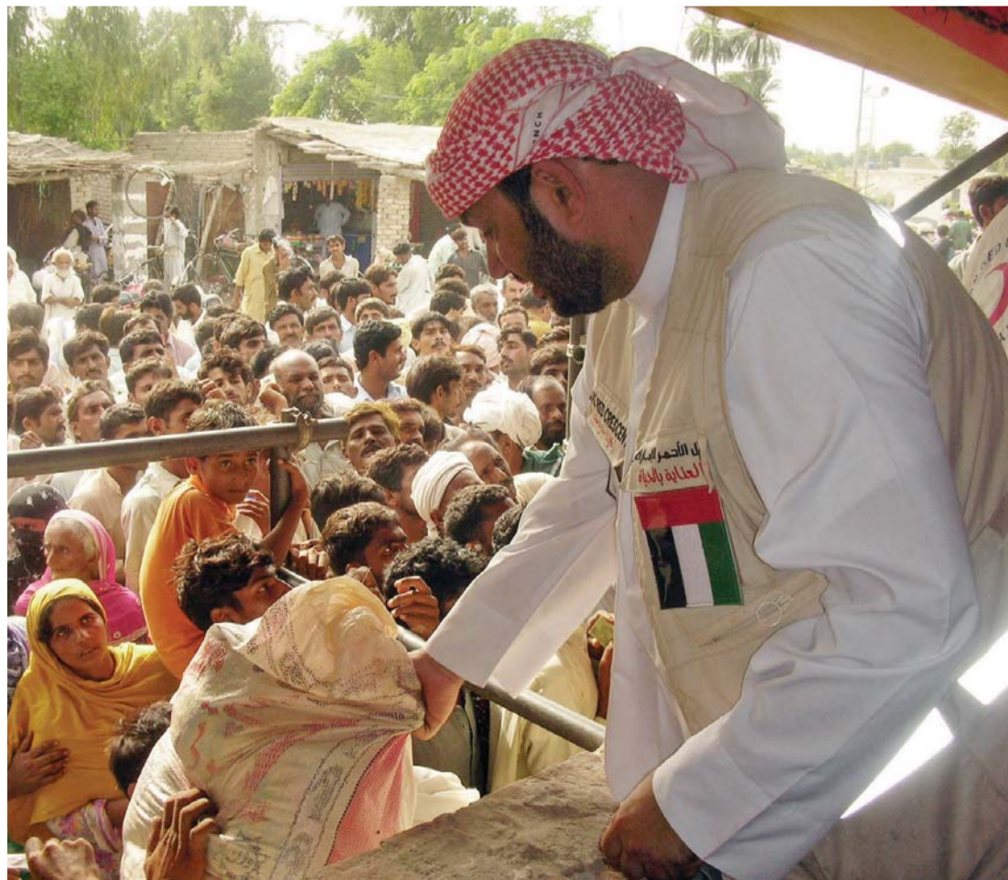
■ الهلال الأحمر حظي بدعم ورعاية خاصة من المغفور له بإذن الله الشيخ زايد | وام

وخارجياً وضع المغفور له دولة الإمارات في مصاف الدول العصرية المتقدمة من خلال منجزاتها الحضارية في المجال الإنساني واستطاع توجيه ما تنعم به من إمكانيات جهاها الله بها لمساعدة الشعوب الشقيقة والصديقة وفتح أمامها آفاقاً عراضاً ومد جسور المحبة والسلام معها من خلال ما نفذته هيئة الهلال الأحمر من مشاريع خيرية رائدة تعود عليها بالخير العميم وانتشرت مشاريع زايد الخير