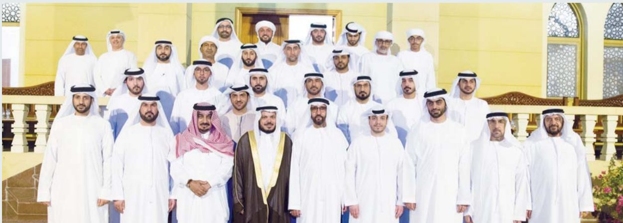
المشاركون في ندوة الشباب وتحديات العصر | من المصدر

وأشار إلى أن الإنسان يسأل يوم القيامة عن شبابه فيما أفاء، مؤكداً أن مرحلة الشباب هي من أهم وأخطر المراحل العمرية التي يجب أن نوليها الاهتمام والرعاية، حيث يواجه الشباب تحديات كثيرة وخطيرة، يجب أن يتبناه إليها في ظل التحديات التي تتمحور عبر تحدي إدارة الذات، وكيف يحمل الشباب رسالة إنسانية؟ وكيف يخطط الشباب ويضع أهدافه المستقبلية المبنية على أسس سليمة؟ وكيف تكون الصحة النفسية الفاعلة الخالية من العقد والسلوكيات السلبية التي تصيب الشباب بالإحباط؟ ويجب أن يكون للشباب رسالة في الحياة، تتشكل عبر تربية تحميهم من التدايعات ومواجهة الأفكار والتيارات المتطرفة، من خلال التوعية الوطنية الشاملة، واتخاذ النماذج الإيجابية في الحياة، كي تكون قودته في طاعة الله وولي الأمر.