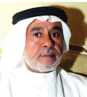
■ زايد المزروعى

إلى ذلك، أكد سيف المطوع المزروعى، أن يوم زايد للعمل الإنساني يمثل محطة يقف عندها الجميع اجلالاً وتعظيماً لذكرى باني مسيرة دولتنا العجيبة، حيث لم يقتصر اهتمام المغفور له بإذن الله الشيخ زايد على أبناء الإمارات بل تجاوزه ليحيط باهتمامهم ورايته جميع شعوب العالم، حيث سخر الثروات لأبناء الدولة والمقيمين وجعل من دولة الإمارات أكثر المجتمعات أمناً وسعادة ووفر لها الرخاء الاقتصادي والاجتماعي.