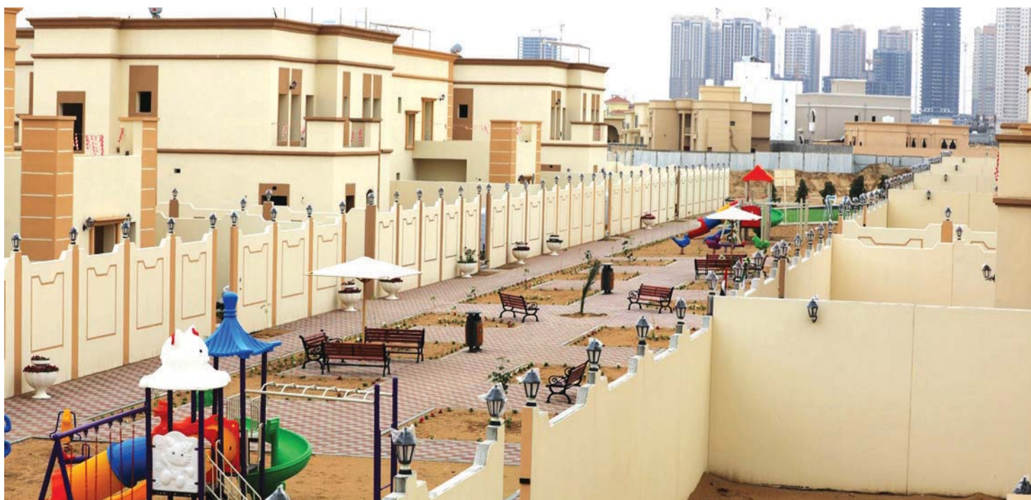
استحوذت فئة «بناء جديد» على غالبية قرارات برنامج الشيخ زايد للإسكان