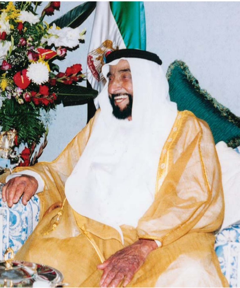
■ زايد قائد ملهم أرسى دعائم الاتحاد وسار بالإمارات نحو الريادة | أرشيفية