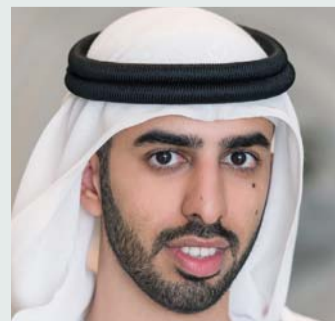
■ عمر العلماء

بمتابعة حثيثة من صاحب السمو الشيخ خليفة بن زايد آل نهيان رئيس الدولة، حفظه الله، وإخوانه أصحاب السمو الحكام، الذين أكملوا الدرب على نهج زايد الخير، وقدموا العالي والنفيس في سبيل إيصال كافة أنواع الدعم والرعاية للشعوب والأمم الأقل حظاً حول العالم. وقالت معاليها: «بعد يوم زايد للعمل الإنساني علامة فارقة في تاريخ دولة الإمارات، لأنه يلخص الإنجازات والمكتسبات التي حققتها دولة الإمارات - ممثلة بقيادتها الرشيدة - على صعيد العمل الإنساني والخيري، من خلال منظومة المساعدات الإنسانية التي قدمتها وما تزال تقدمها للدول والشعوب.