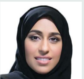
■ حصة بوحميد

فخر للجميع، بأعماله الإنسانية الخالدة، وأياديه البيضاء التي عززت دور دولة الإمارات الرائد في العطاء.