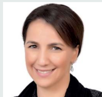
■ مريم المهيري

فخر للجميع، بأعماله الإنسانية الخالدة، وأياديه البيضاء التي عززت دور دولة الإمارات الرائد في العطاء.