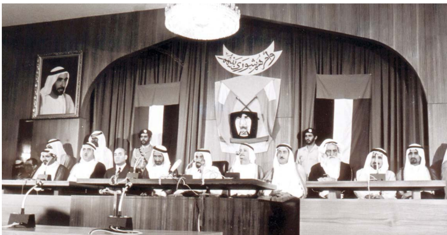
■ علاقة تعاون تعززت بين القيادة الرشيدة والمجلس الوطني الاتحادي في عهده | البيان

وحرصاً من المجلس على أن يرتبط اسم المغفور له بإذن الله الشيخ زايد بن سلطان آل نهيان، طيب الله ثراه، بمناقشاته وطرحة لمختلف القضايا الوطنية، قرر إطلاق اسم الشيخ زايد على قاعة الاجتماعات الكبرى للمجلس بتاريخ 2000/12/5 م، وهي القاعة الرئيسية للمجلس «تحت القبة»، التي تجسد فيها معاني الحرص على مناقشة القضايا الوطنية والشورى والتعاون بين مختلف السلطات.