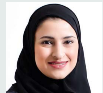
■ سارة الأميري

بمناسبة يوم زايد للعمل الإنساني، والذي يصادف 19 رمضان من كل عام بأن شعلة الخير والعطاء الذي أضاءها الأب