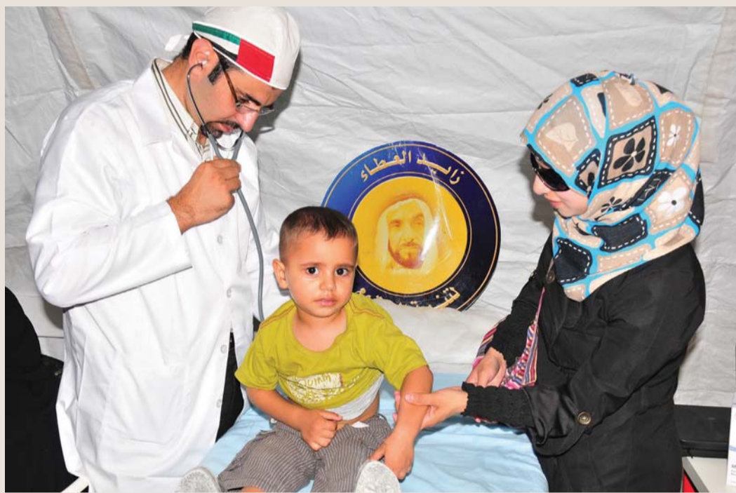
تتزامن إنجازات الدولة في المساعدات الخارجية مع احتفالات الإمارات بمئوية زايد