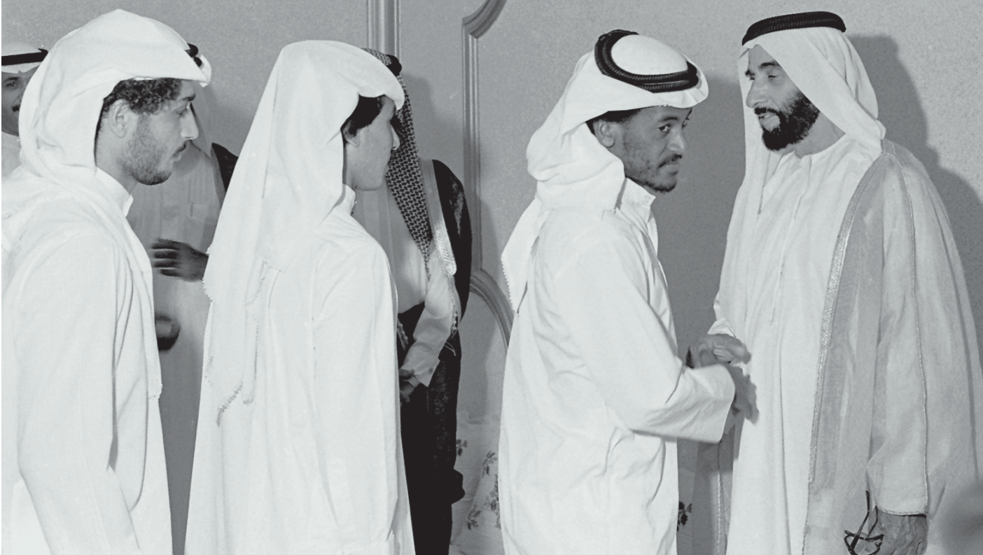
■ الشيخ زايد خلال استقبال بعثة الإمارات المشاركة في دورة الخليج السابعة لكرة القدم - مارس 1984

السعودية، عندما أحرز المنتخب في كل منهما المركز الثاني. ولضمان استكمال النجاح تعاقد الاتحاد مع البرازيلي الشهير ماريو زاجالو في الفترة من 1988 إلى 1990 التي عاد فيها كارلوس البرتو لقيادة المنتخب في المونديال، لكن زجالو يحسب له انه قاد المنتخب خلال التصفيات النهائية لكأس العالم 1990 في سنغافورة خلال شهر أكتوبر 1989، وفيها تأهل المنتخب للمونديال.