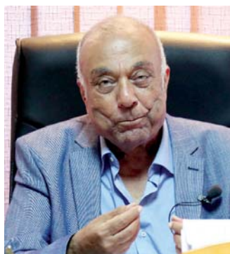
■ محمد علي بلال

يذكر أن أعمال المغفور له بإذن الله تعالى الشيخ زايد بقيت شاهداً على عصر الإنجازات الكبرى والهمم والشهامة والمرورة العربية، لا سيما أن تلك الإنجازات التي شُيدت في كثير من البلدان العربية، ومن بينها مصر جاءت جميعها في عصر التحديات الكبرى التي شهدت أفضل فترات التقارب العربي العربي بفضل القيادة الحكيمة والعاقلة المدركة لأهمية دور الأمة وما يحيطها من مخاطر، التي كان في مقدمتهم زايد الذي سطر بأحرف من نور إنجازات على المستوى الاجتماعي والاقتصادي.