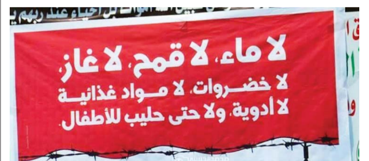
لافتة في تعز تندد بالحصار الحوثي | البيان

وقال مشاركون في اللجنة المنظمة، إنهم سيحملون عبوات المياه كونها شعاراً تعبيريًا للمسيرة الإغاثية، وسيقدمون شاحنات تحمل خزانات مليئة بمياه الشرب لسكان تعز، الذين لجأوا الأيام الماضية لشرب المياه المالحه. واستبق الحوثيون الفعاليه، التي تندد بحصارهم لمدينة تعز، بشن حملة اعتقالات للجنة المنظمة، في مدينة إب، مساء أول من أمس. وذكر ناشطون أن دوريات عسكرية للحوثيين، داهمت مقر اجتماع اللجنة المنظمة للمسيرة، واعتقلت نحو 30 ناشطاً