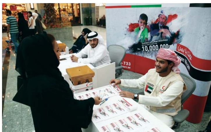
■ تفاعل مجتمعي كبير شهدته حملة «عونك يا يمن» | البيان

وذكر تقرير لهيئة الهلال الأحمر الإماراتي أنه تنفيذاً لتوجيهات سمو الشيخ حمدان بن زايد آل نهيان ممثل حاكم أبوظبي في المنطقة الغربية رئيس هيئة الهلال الأحمر تم تنفيذ مشاريع إعادة إعمار وصيانة عدد من المشاريع التنموية والتعليمية والصحية التي تكفل الهلال الأحمر الإماراتي تنفيذها في محافظة عدن ومديرياتها الثماني، ليستفيد منها أبناء الشعب اليمني الذين تضرروا من جراء الأحداث التي يشهدها اليمن. ويواصل الهلال الأحمر تنفيذ عدد من