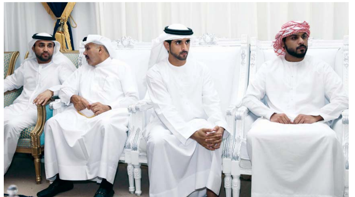
■ حمدان بن محمد ومصبح الفتان وخليفة سليمان خلال تقديم العزاء