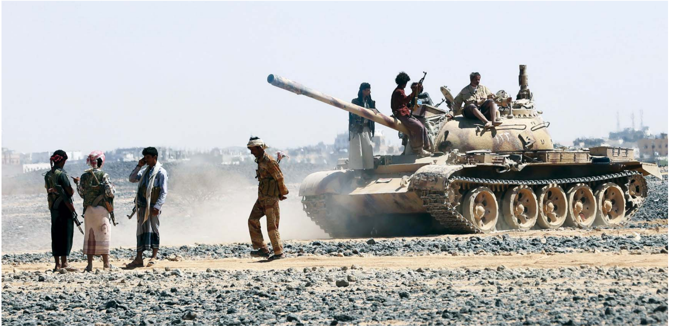
مقاتلون من المقاومة على خط الجبهة في مأرب على مشارف صنعاء