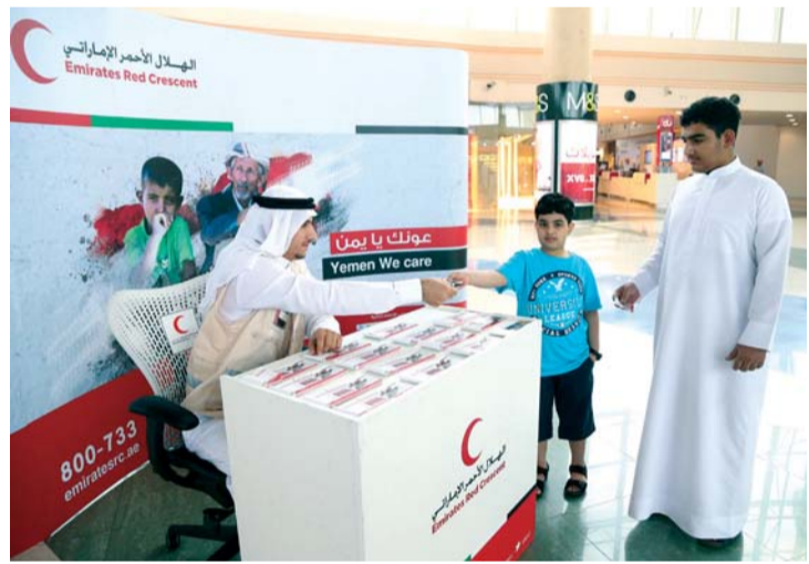
■ الصغار قبل الكبار تسابقوا على التبرع لليمن