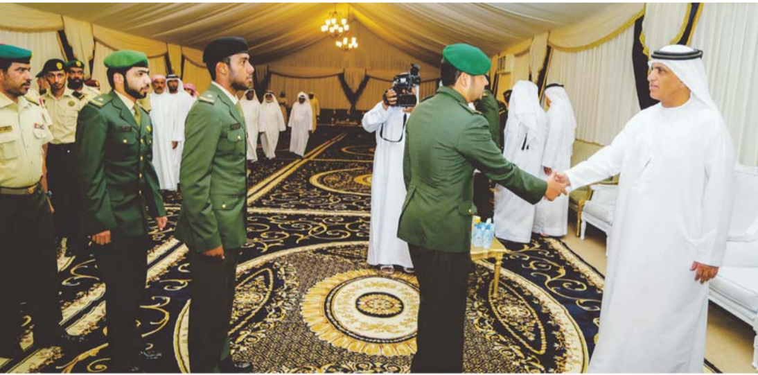
■ .. ويصافح رجال القوات المسلحة