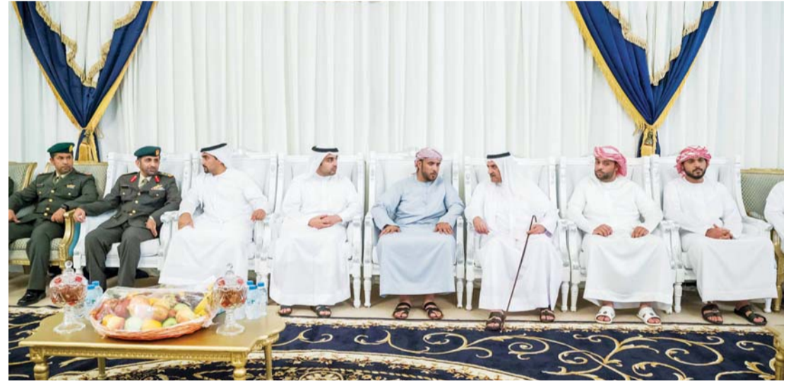
■ حمد الشرقي خلال تقديم العزاء بحضور راشد ومكتوم بن حمد