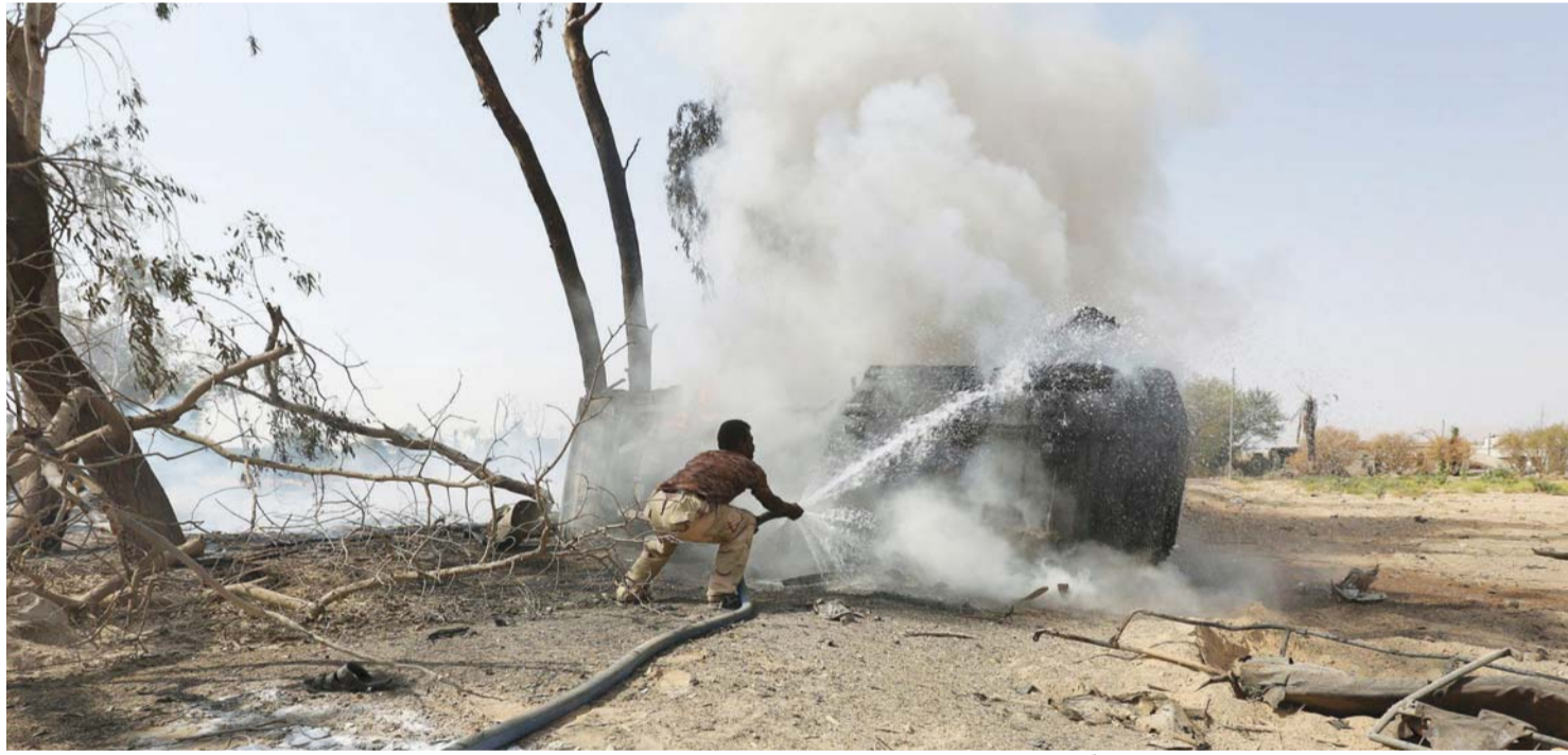
عنصر من المقاومة يطفئ النيران شبت في عربة بمأرب

وكان عدد كبير من سكان عدن أبدوا ضيقهم من تفشي مظاهر الانفلات الأمني في المدينة، ووقوع عدد من عمليات الاغتيال، التي طالت مسؤولين بارزين في المدينة، وناشدوا القيادة الشرعية متمثلة في الرئيس عبدربه منصور هادي التدخل وتعيين شخصية أمنية لتولي مهمة محافظة عدن.