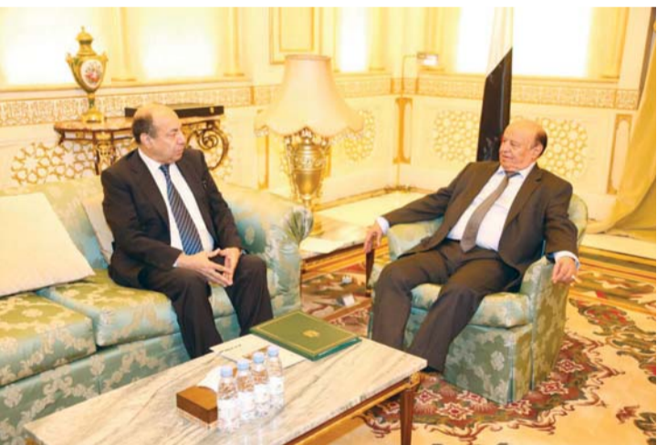
ولدى استقباله السفير المصري لدى اليمن

ونقل السفير المصري تحيات الرئيس عبد الفتاح السيسي لأخيه عبدربه منصور هادي.. مجدداً موقف مصر المساند لليمن قيادة وشعباً.