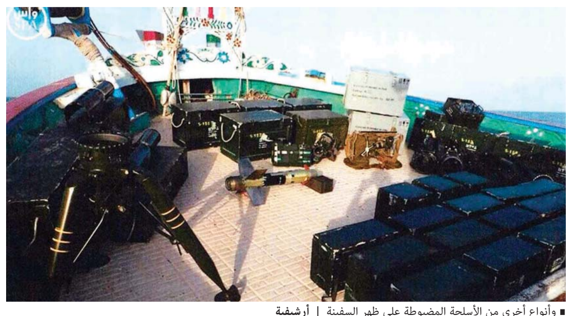
■ وأنواع أخرى من الأسلحة المضبوطة على ظهر السفينة | أرشيفية

بيان وذكر بيان للتحالف العربي لدعم الشرعية في اليمن أن الزورق كان على متنه 14 إيرانياً وأسلحة بينها قذائف مضادة للدروع والدبابات، إضافة إلى قاذفات ومعدات حربية أخرى، وقد تم ضبطه السبت على بعد