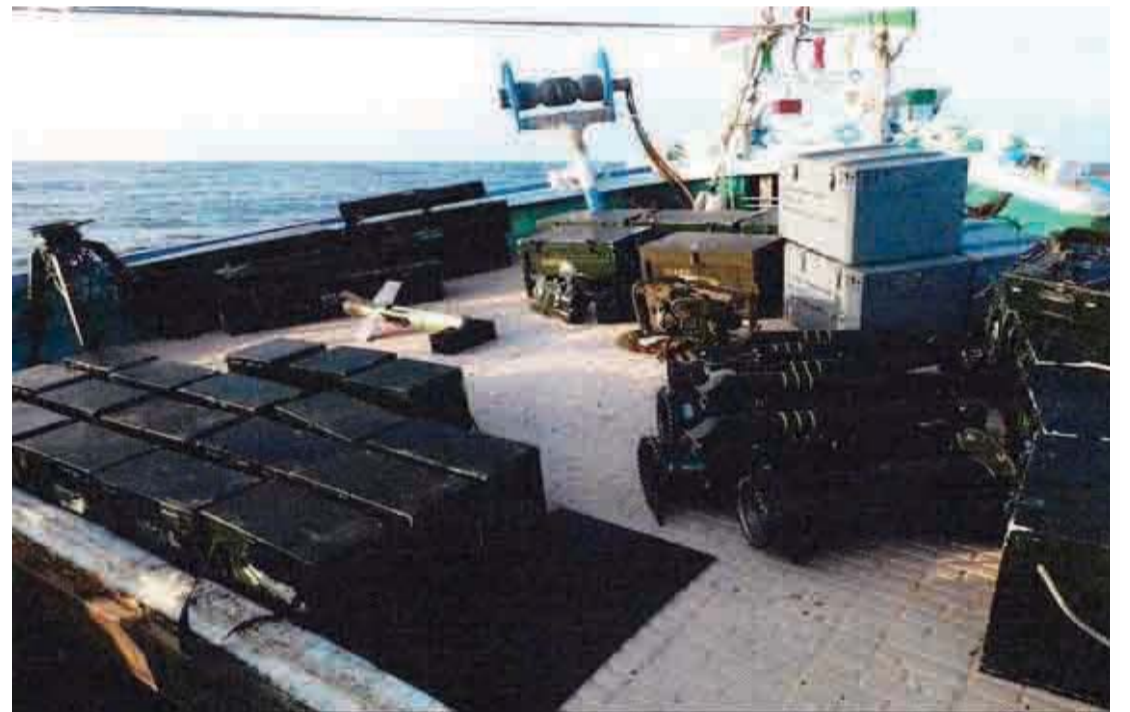
أسلحة على سفينة إيرانية تم ضبطها على سواحل البحر الأحمر | أرشيفية

وقالت مصادر سياسية إن القائم بأعمال وزير المالية فضل الشيعبي استقال من منصبه بعد أن تعرض لضغوط من الانقلابيين للموافقة على صرف مبلغ 100 مليار ريال يمني للحوثيين، بينما اصدر الرئيس اليمني عبدربه منصور هادي عدة قرارات رئاسية أعفى من خلالها وزير دولة لشؤون البرلمان وشؤون تنفيذ مخرجات الحوار غالب عبدالله مسعد مطلق وحسن محمد زيد من مناصبهما بسبب ارتباطهما بالتمردين الحوثيين، كما قام بتعيين وكيل ووكلاء مساعدين لمحافظة حضرموت.