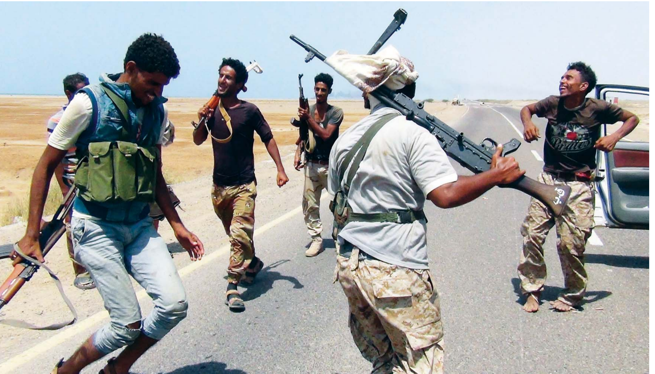
مقاتلون من الشرعية على أطراف مدينة تعز

السياسية مع تواجد أكبر للاتماء القومي واليساري. لكن برغم التنوع يبقى التوجه المدني هو المهيمن والطاغي حتى في أوساط المنتسبين إلى الأحزاب الدينية. ويضيف الأستاذ الجامعي: «المعروف عن أبناء هذه المحافظة رفضهم لكل أشكال الانتماءات العصبوية التي تعود لما قبل الدولة وخاصة الروابط القبلية، بل أن منظري الدولة المدنية في اليمن جلهم من أبناء هذه المحافظة، والتي ينظر أبنائها إلى أن الولاءات والثقافة العصبوية المتجذرة في الشمال الجغرافي لليمن هي المعيق الأول لبناء الدولة اليمنية المدنية الحديثة التي يتطلعون إليها، وعملوا لأجلها عقوداً من الزمن، لذلك فإن تعز بثقافتها المدنية تمثل الحامل الحقيقي لمشروع الدولة المدنية في اليمن».