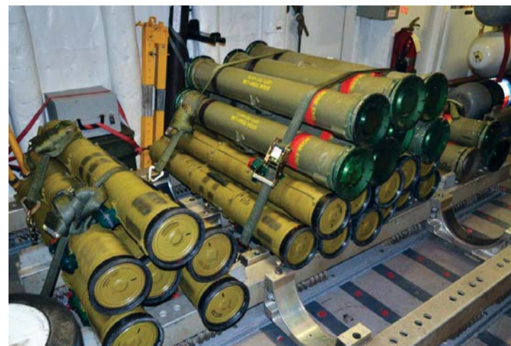
أسلحة تم ضبطها على السفينة | أرشيفية

150 ميلاً جنوب شرقي مدينة صلالة العمانية. وأشار تقرير سري لخبراء في الأمم المتحدة رفع إلى مجلس الأمن الدولي العام الجاري، أن إيران تقدم أسلحة إلى المتمردين الحوثيين في اليمن، منذ عام 2009 على الأقل.