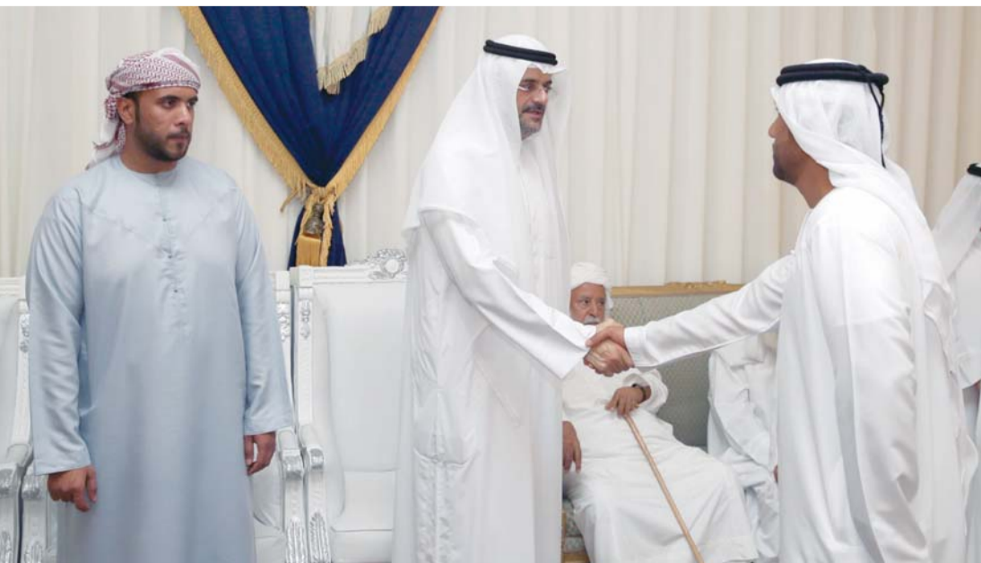
■ ولي عهد الشارقة يتقبل التعازي إلى جانب ذوي الشهيد | وام