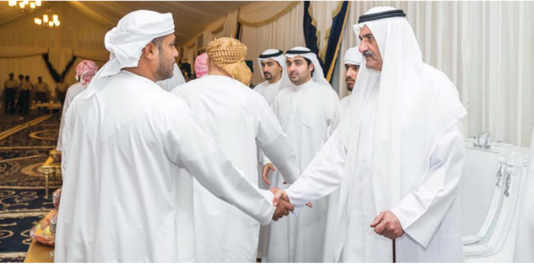
■ .. ويصافح المعزين

قدم صاحب السمو الشيخ حمد بن محمد الشرقي عضو المجلس الأعلى حاكم