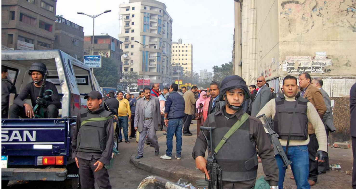
■ الانتشار الأمني جزء من خطة شاملة | البيان

وقالت المصادر الأمنية، إن المرحلة النهائية من خطة تأمين الاحتفال بافتتاح قناة السويس الجديدة تشمل 3 محاور رئيسية، الأول تأمين محيط منصة الاحتفال بمحافظة الإسماعيلية بالتنسيق مع القوات المسلحة، والمحور الثاني يتمثل في تأمين خطوط سير الوفود المشاركة في الاحتفال منذ لحظة وصولهم إلى مطار القاهرة الدولي، مروراً بانتقالهم من مقر إقامتهم ثم إلى موقع الاحتفال، والمرحلة الثالثة والأخيرة وتمثل في إحكام الرقابة على المعابر الحدودية من وإلى سيناء.