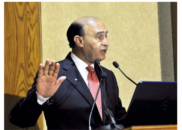
■ ممي شرف على المشروع وواكبه منذ البداية | البيان