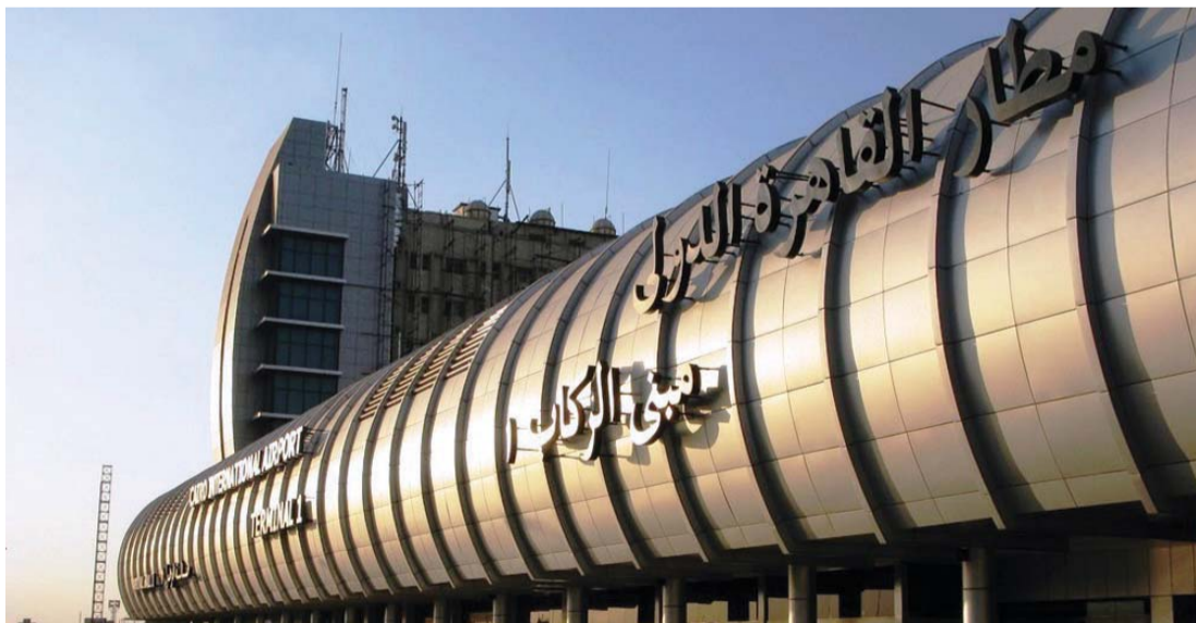
■ مطار القاهرة الدولي سيستقبل المشاركين من 102 دولة | البيان

جين بينغ ورئيس الوزراء الإيطالي ماتيو رينزي، ورئيس وزراء اليونان ألكسيس تسيبراس، ومشاركة على أرفع مستوى من دولة الإمارات والمملكة السعودية ودولة الكويت ومملكة البحرين، فضلا عن رئيس جمهورية السودان الرئيس عمر البشير، ورئيس جنوب السودان سلفا كير، ورئيس الحكومة الجزائرية عبد المالك سلال، والرئيس اليمني عبد ربه منصور هادي، ورئيس الحكومة اللبناني تمام سلام.