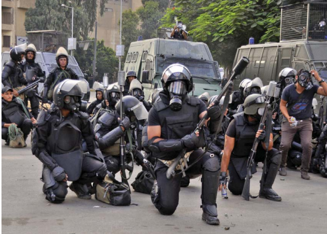
■ وحدات قتالية مدربة قادرة على تضييق أي تهديد محتمل

وأضاف كامل في تصريحات لـ«البيان»، أن المخططات التي تعلنها هذه الجماعات لاستهداف الدولة خلال الافتتاح هي مجرد تهديدات لإحباط الروح المعنوية للمصريين فقط لا غير، كما حدث خلال المؤتمر الاقتصادي الذي عقد في شرم الشيخ شهر مارس الماضي.