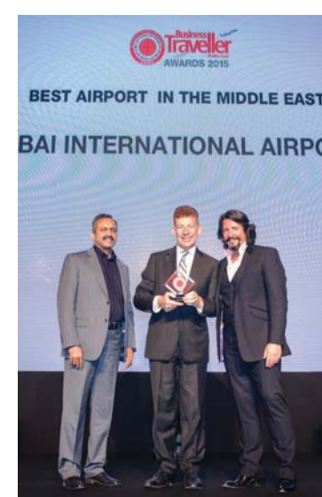
ممثلو المطار يستلمون الجائزة

فاز مطار دبي الدولي، بجائزة أفضل مطار في الشرق الأوسط لعام 2015، في خطوة تؤكد مدى الأهمية والثقة التي يتمتع بها لدى المسافرين. ويأتي فوز مطار دبي بالجائزة ضمن استفتاء أجرته مجلة «بزنس ترافلر» ذات الشهرة الواسعة، شمل الآلاف من قرائها، الذين استخدموا مطار دبي خلال رحلاتهم، وقاموا بتقييم مستوى الخدمة التي وفرها لهم المطار أثناء سفرهم. ويبرز هذا الإنجاز، أهمية الجهود العظيمة التي تبذلها مطارات دبي للحفاظ على سمعة مطار دبي، وضمان بقائه ضمن قائمة أهم مطارات العالم، على الرغم من المنافسة الشديدة التي تشهدها صناعة الطيران وخدمات النقل الجوي الدولية.