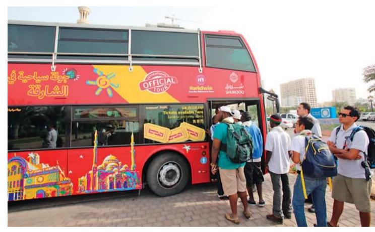
حافلات الجولات السياحية في الشارقة

ومن جانبه، قال مروان السركال، المدير التنفيذي لهيئة الشارقة للاستثمار والتطوير «شروق»: «إن توقيع مذكرة التفاهم يأتي تماشياً مع رؤية «شروق» في أن تكون عاملاً مساعداً وطرفاً معززاً لمختلف القطاعات على صعيد إمارة الشارقة بشكل