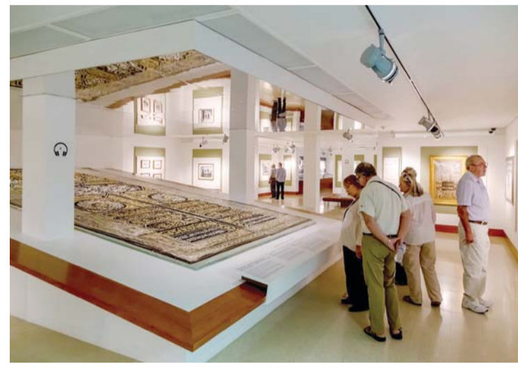
متحف الشارقة الإسلامي داخل سوق السفر العربي