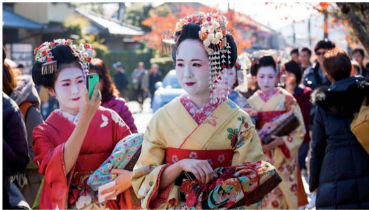
عروض يابانية تتحدث عن التراث والاصالة من المصدر

من ناحيته، أشار شوهي أكاهوشي، المدير التنفيذي لمكتب كيوتو للمؤتمرات والزوار في اليابان، إلى أن السوق السياحي في دولة الإمارات بشكل عام، ودبي على وجه