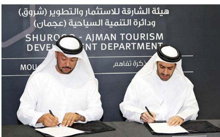
سياحة عجمان وشروق أثناء توقيع الاتفاقية

وأضاف السركال أن الحافلات السياحية أدت دوراً مؤثراً في تعزيز وعي المقيم والزائر بالوجهات السياحية والثقافية والتراثية بالإمارة. وأشار إلى أنه سيتم توفير عدد من مراكز بيع التذاكر في أماكن حيوية ضمن إمارة عجمان من ضمنها المنشآت الفندقية بالإمارة. وقد تم تصميم الحافلات خصوماً للتكيف مع الظروف المناخية في المنطقة، مع سقف قابل للتحويل يمكن إزالته خلال النهار لتصبح الحافلة مكشوفة من الأعلى، مع الإبقاء عليه خلال أيام الصيف للمحافظة على برودة الجو داخل الحافلة. وتتيح تذكرة الحافلة لمستخدامها النزول من الحافلة في أي محطة توقف للتجول في الموقع السياحي هناك، وصعود حافلة أخرى عند انتهاء جولتهم بالتذكرة نفسها طوال اليوم.