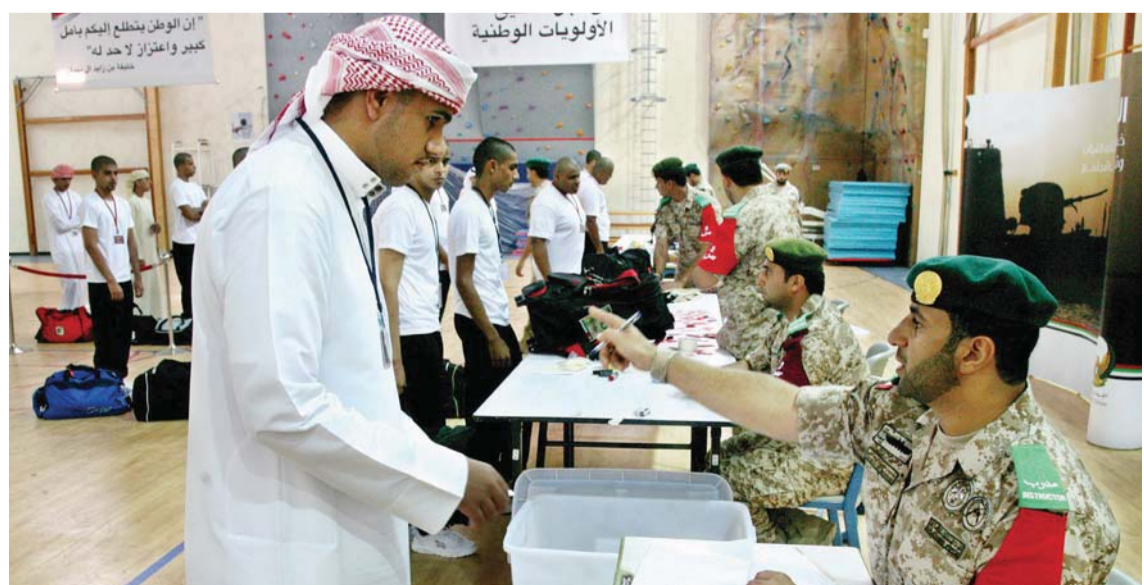
استقبال الدفعة الأولى من طلبة الخدمة العسكرية الوطنية في معسكر المنامة

وعلى الرغم من قصر فترة التجربة التي مرت منذ إصدار القانون وحتى التحاق الدفعة الثالثة من المجندين إلى الخدمة الوطنية، إلا أن النتائج المبهرة التي تحققت حتى الآن تؤكد بما لا يدع مجالاً للشك أننا لسنا أمام تجربة حديثة دولة فنية، بل تجربة لدولة ناهضة