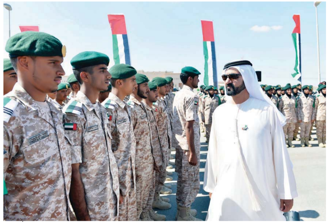
محمد بن راشد خلال زيارة تفقدية لقواتنا المسلحة

التي تمكنه من تنفيذ ما يوكل إليه من واجبات بوعي وفهم وإدراك للأمور، وتهتم الكلية أيضاً بالثقافة الأكاديمية واللياقة البدنية لأنها ركيزة الكفاءة القتالية والوسيلة الفعالة لإعداد المقاتل الوائق من نفسه وقدراته، القادر على إعداد مهامه بكفاءة وتميز.