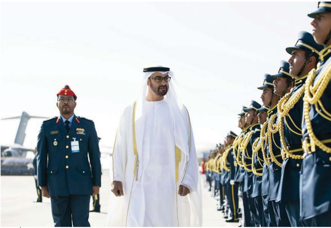
محمد بن زايد خلال تفقده لوحدات من القوات المسلحة