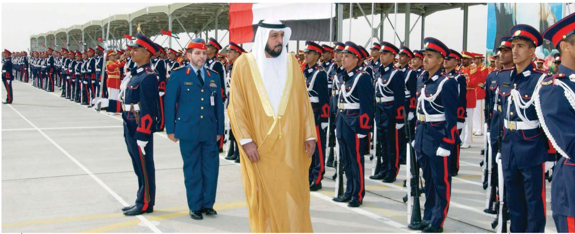
خليفة يستعرض ثلة من أبناء قواتنا المسلحة