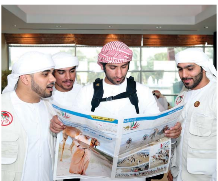
ملحق البيان ومتابعة من عشاق الهجن