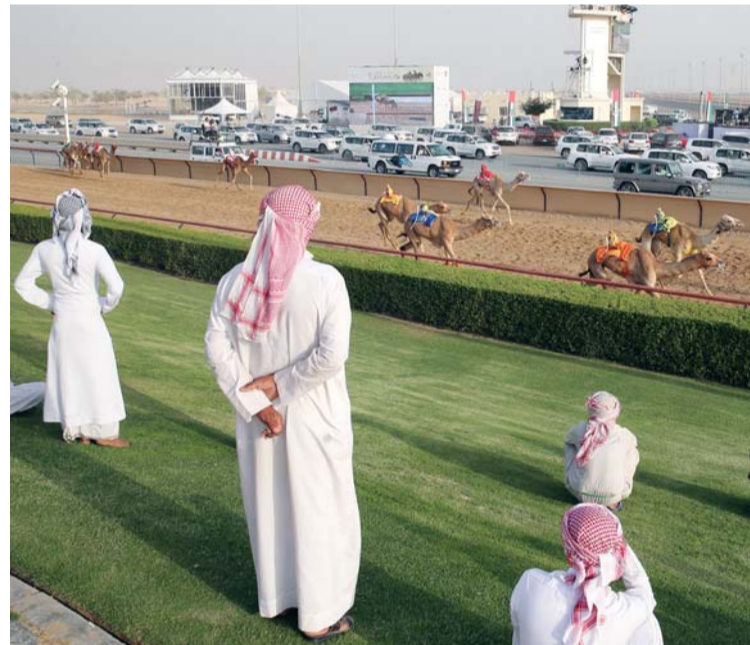
متابعة لأشواط السباق