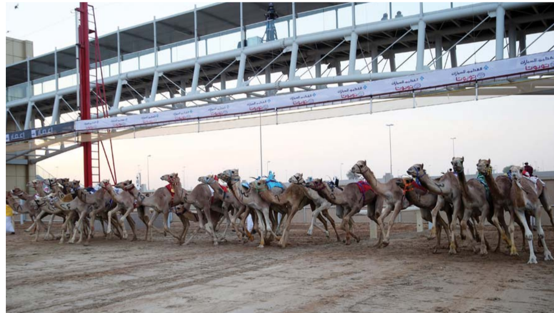
تحفز قبل الانطلاقة