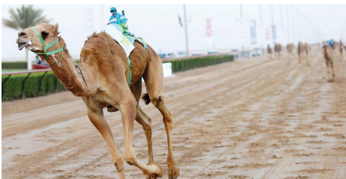
تفرد وحيدة في المقدمة