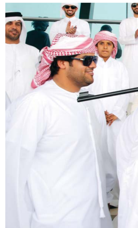
الفترة المسائية منافسة وإثارة بلا حدود