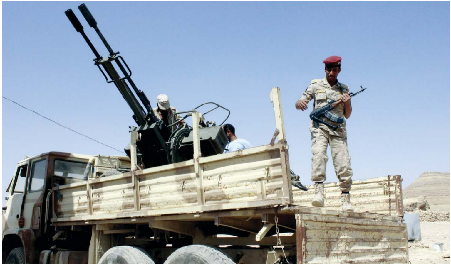
مسلحون انقلابيون على مدفع مضاد للطائرات في صعدة

المديرية خصوصاً، من قتل وسلب ونهب واختطاف وتجاوز لكل القيم والأعراف. وطالب البيان مليشيا الحوثي بالتوقف الفوري عن الاعتداءات في تعز وكافة المحافظات الجنوبية، وأعلنوا تأييدهم للجيش المتمسك بالشرعية، والذي لم يتخل عن مهمته في الحفاظ على أمن الوطن وحمايته، كما أطلقوا نداء عاجلاً لأنبائهم في المؤسسات العسكرية للوقوف في وجه الميليشيا المسلحة وفاء لإخوانهم الشهداء.