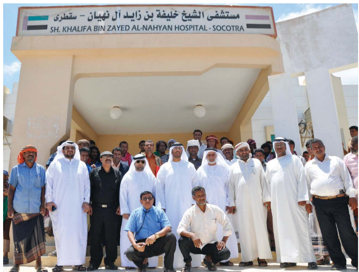
وفد مؤسسة خليفة الإنسانية بعد توزيع المساعدات في سقطرى