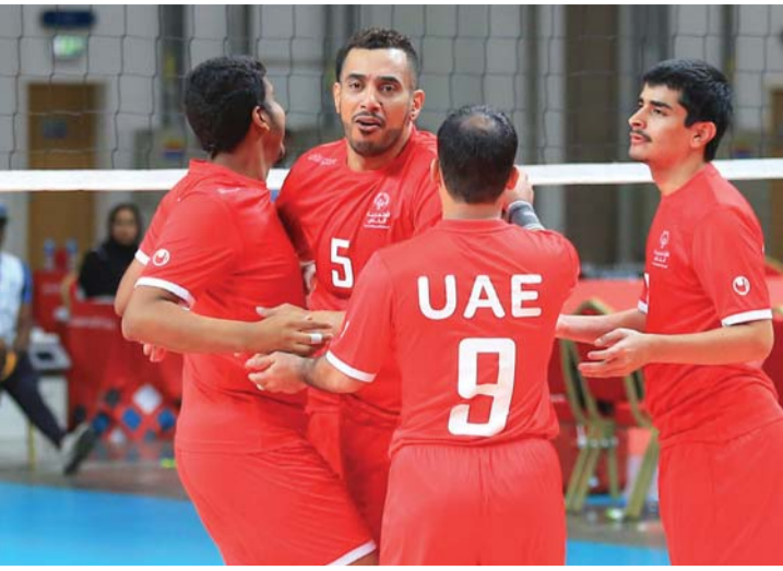
■ من منافسات اليوم الأول في الكرة الطائرة | البيان