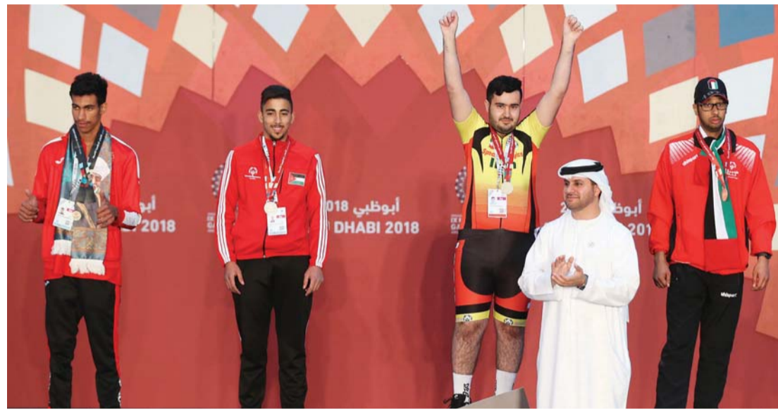
أبطالنا يتألقون في منافسات اليوم الأول | البيان

تقدم أكثر من 3 آلاف شاب وشابة لخدمة ضيوف الدولة والمساهمة في صناعة النجاح للحدث العالمي، وكان العدد الأول قد وصل إلى 5 آلاف فرد مع انتهاء فترة التسجيل قبل 3 أسابيع من انطلاق الأولمبياد عقداً اجتماعاً مشتركاً لكن البعض منهم لم يتمكن من مواصلة مهمته الخدمية التطوعية، ليبليغ العدد الفعلي الذي تواجد في الساحات المختلفة المحتضنة للبطولة 3 آلاف متطوع من كل قارات العالم تم توزيعهم على مجموعات