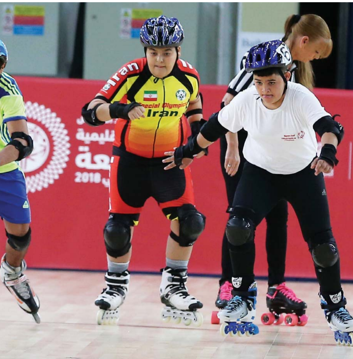
أبطال التزلج يتألقون في منافسات اليوم الأول | البيان