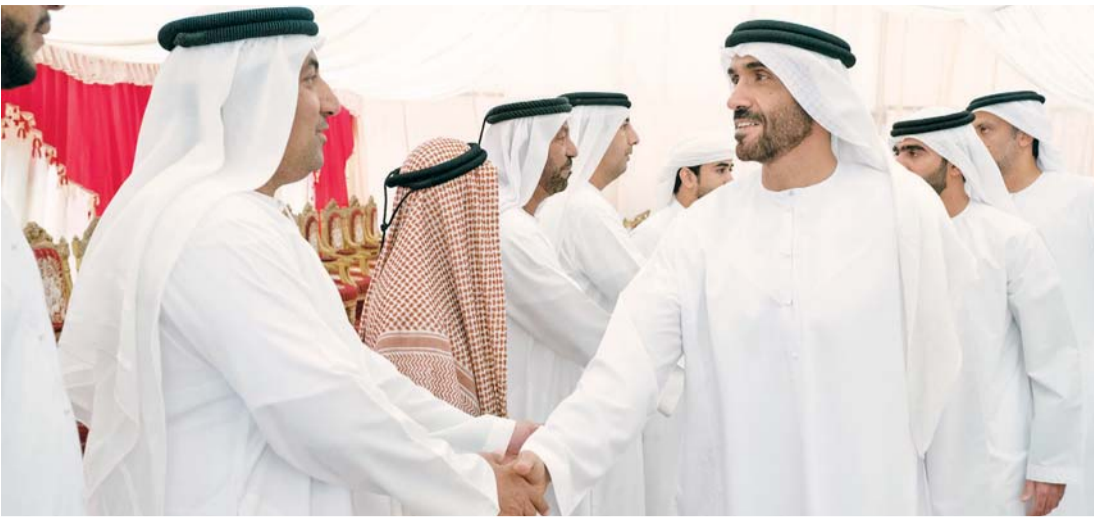
■ نهيان بن زايد خلال تقديمه واجب العزاء إلى أسرة الفقيدة