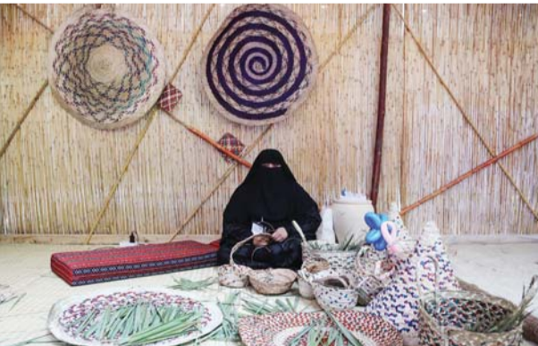
اهتمام من البعثات المشاركة بمظاهر التراث الإماراتي | البيان