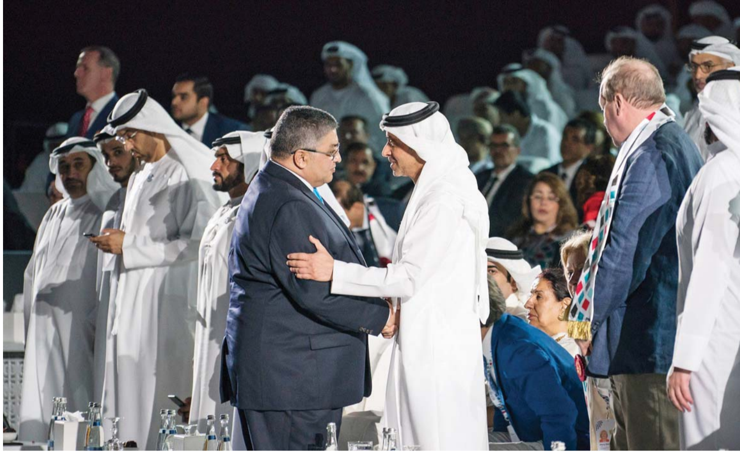
■ هزاع بن زايد يصفح أيمن عبد الوهاب خلال افتتاح الألعاب الإقليمية التاسعة | وام

وقال عبدالوهاب في تصريحات خاصة لـ «البيان الرياضي» إن الهدف من إقامة الألعاب الإقليمية في الإمارات هو أن العاصمة أبوظبي تمثل منارة تميز قادتها على جميع المستويات، وعندما تقدم الإمارات وعاصمتها أبوظبي بملف لاحتضان مسابقة دولية، فتأكد أن ملفها سوف يفوز ويلاقى قبولاً وموافقة من اتحاد هذه الرياضة، ومجلسه التنفيذي، وذلك يرجع إلى الإرادة القوية التي يتمتع بها مسؤولو دولة الإمارات في الطرح، وتكامل الملف من حيث الدراسة والتصوير والتنفيذ، وهذا الملف مدعم ببنية تحتية رياضية متقدمة، ووفق أعلى المعايير العالمية، بالإضافة إلى توافر الأمور اللوجستية الأخرى من فنادق الإقامة والمواصلات وشبكة طرق على أعلى مستوى، ويقود هذا العمل طاقم إداري مدرب ولديه خبرات واسعة، ولذلك تميزت الإمارات وعاصمتها أبوظبي في احتضان كبرى الأحداث الرياضية،