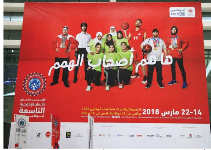
أبو ظبي توجه رسالة إلى العالم من خلال الألعاب الإقليمية | البيان

«ها هم أصحاب الهمم»..عبارة سطرتها اللجنة المنظمة على صورة تحمل الشعار الرئيس للأولمبياد الخاص، وكانت العبارة المعبرة والرسالة ذات المعاني السامية في استقبال ضيوف الدولة الذين توقفوا عندها كثيراً، لتكون رسالة واضحة تدعو العالم للسير على درب الإمارات بعد أن وجدت إشادة كبيرة من دول العالم المختلفة التي تواجدت في البطولة.