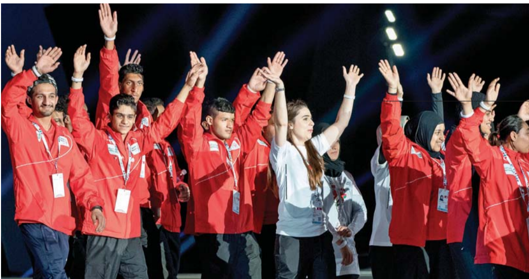
■ الرياضيون خلال عرض الافتتاح للألعاب الإقليمية