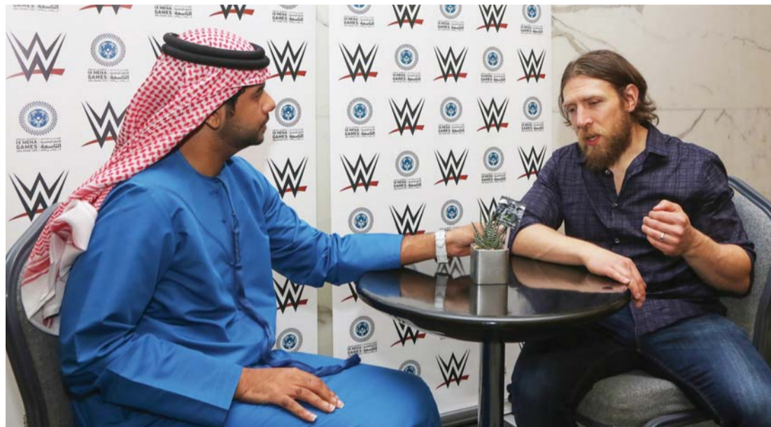
■ دانيال براين يتحدث لـ «البيان الرياضي» | البيان

أكد دانيال براين أنه من الصعب التوفيق بين عمله وأسرته، خاصة أنه أصبح أباً منذ مدة قريبة، ولكنه محظوظ بالزواج من نجمة المصارعة الحرة بري بيلا، التي دائماً ترسل صورة ابنته التي تبلغ من العمر 10 شهور في غيابها، مضيفاً أنه لا يشعر بالغربة أثناء السفر بسبب التكنولوجيا التي سهلت عملية التواصل مع أسرته.