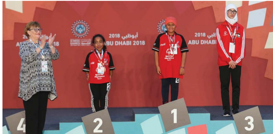
السباحة تحصد 4 ذهبيات | البيان

حيث ستقدم تجربة شاملة ومتكاملة للرياضيين من ذوي الإعاقة الفكرية وغيرهم.