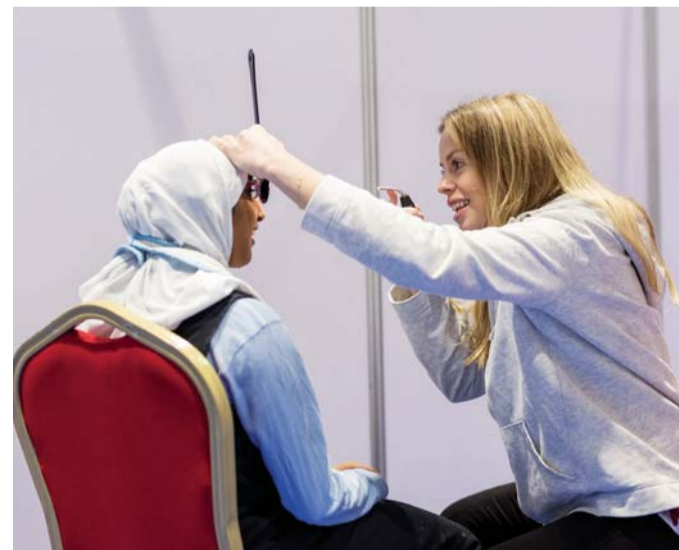
■ الرياضيون يخضعون للفحوص الطبية المجانية | البيان

فسنقدم لهم النظارات، كما أننا نوفر مجموعة من محطات الترويج للصحة والتي تقدم النصائح من أجل نشر نمط حياة صحي وسليم.