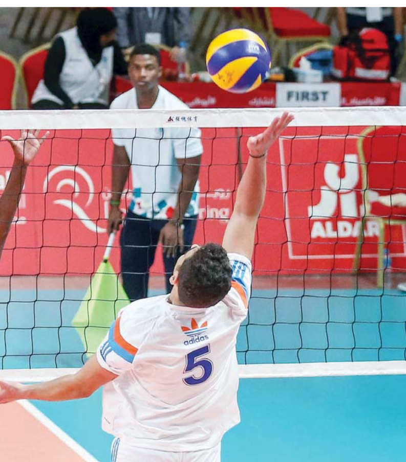
■ من منافسات كرة الطائرة في اليوم الأول | البيان

قالت نشرة أخبار الساعة إن دولة الإمارات تؤكد وتبججها من قيادتها الرشيدة، بدعم اندماج أصحاب الهمم في المجتمع، وممارسة حياتهم اليومية بشكل طبيعي، سعياً إلى تحقيق القيم النبيلة التي أرساها الأب المؤسس، المغفور له بإذن الله تعالى، الشيخ زايد بن سلطان آل نهيان، طيب الله ثراه، في دعم أصحاب الهمم، مؤمناً بقدراتهم وإمكاناتهم في البناء والنهضة، ومشدداً على أهمية توفير الإمكانيات اللازمة كافة لتحفيز طاقاتهم الإيجابية، وابتكاراتهم الخلاقة، التي