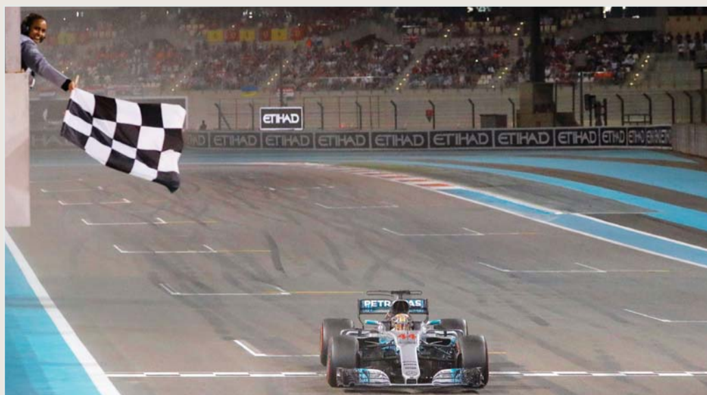
■ بوتاس يعبر خط النهاية | البيان

الفوز يمنحني الدافع القوي من لتحقيق نتائج أفضل في 2018. وأضاف: اللقب ختام رائع لعام 2017، وساعدتني انطلاقتي من المركز الأول على الفوز ما منحتني السيطرة على السباق رغم المنافسة مع هاميلتون الذي حاول الضغط علي في نهاية السباق. وتابع: ختام الموسم بهذه الطريقة يعد إيجابياً، حيث حققت فوزين في النصف الأول من الموسم ولكنني واجهت صعوبات بعد ذلك إلا أنني ركزت على حل جميع المشاكل مما ساهم في تحسن النتائج في الجولات النهائية.