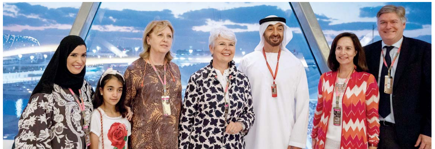
■ محمد بن زايد وصورة تذكارية مع ضيوف الحدث بحضور أمل القبيسي