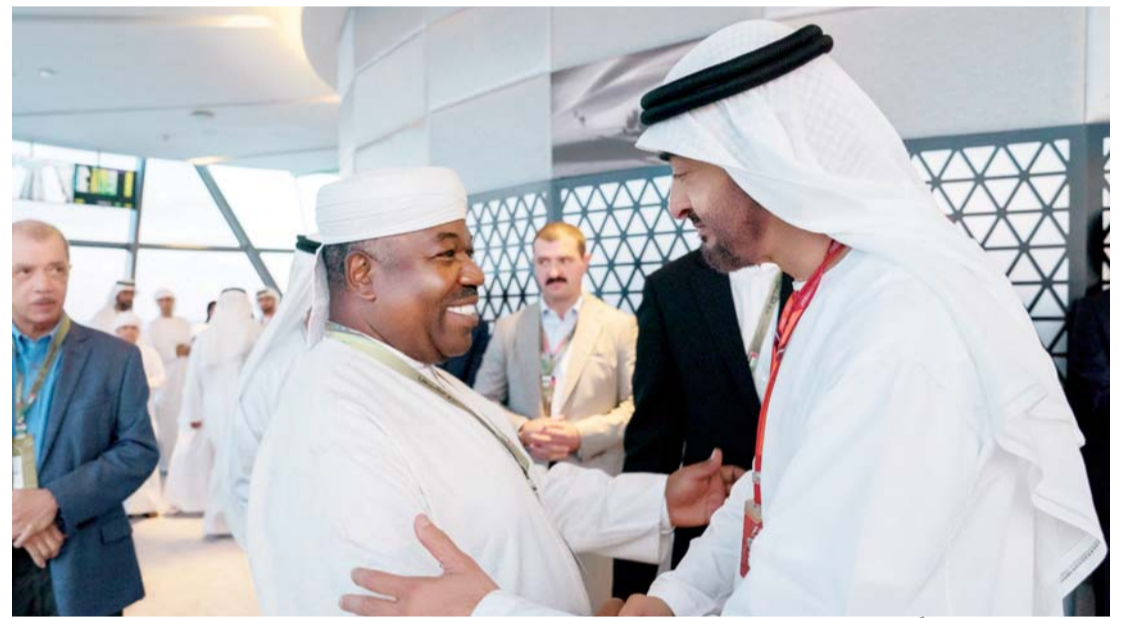
■ محمد بن زايد مرحباً بضيوف الحدث