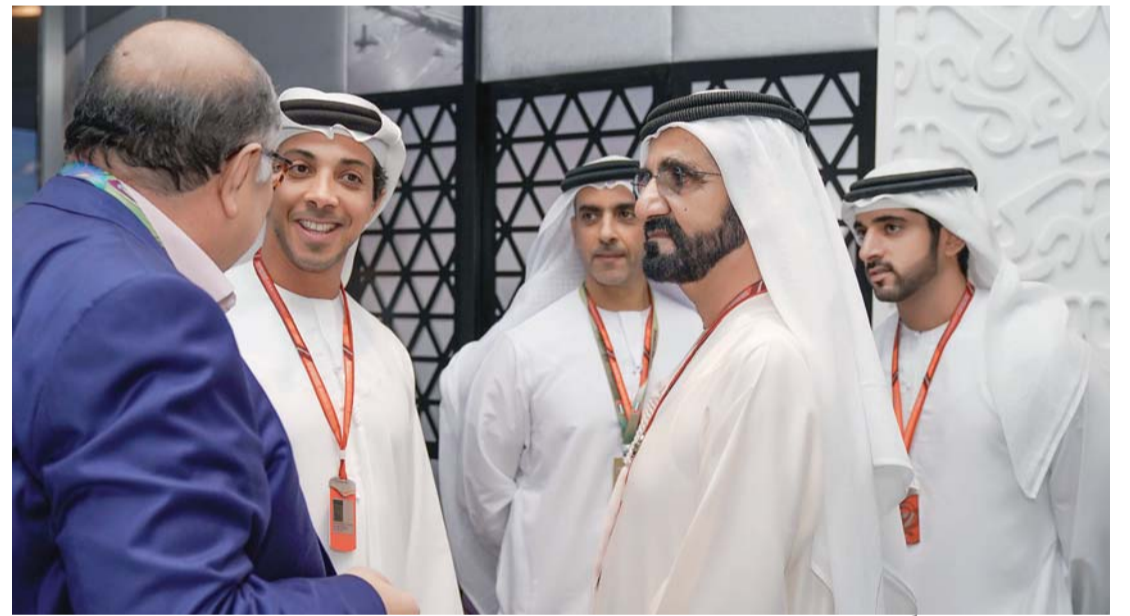
محمد بن راشد مرحباً بالضيوف بحضور حمدان بن محمد وسيف ومنصور بن زايد

أبوظبي - وام شهد صاحب السمو الشيخ محمد بن راشد آل مكتوم نائب رئيس الدولة رئيس مجلس الوزراء حاكم دبي «رعاه الله»، وصاحب السمو الشيخ محمد بن زايد آل نهيان ولي عهد أبوظبي نائب القائد الأعلى للقوات المسلحة، بحضور بعض الضيوف من رؤساء الدول والوفود الشقيقة والصديقة وسمو أولياء العهود والسيوخ، أمس، الجولة الختامية لسباق جائزة الاتحاد للطيران الكبرى للفورمولا 1 «أبوظبي 2017» على مضمار حلبة مرسى ياس في أبوظبي. كما شهد السباق الرئيس بول كاغامي رئيس جمهورية رواندا، والرئيس فيليب فويانوفيتش رئيس جمهورية مونتينيغرو، والرئيس رمضان قديروف رئيس الشيشان، وجمهورية تاتارستان، والرئيس علي بونغو رئيس جمهورية الغابون، والأمير أندرو دوق يورك، وخوان كارلوس ملك مملكة إسبانيا السابق، ورشيد الطالب العلمي، وزير الشباب والرياضة المغربي، وديس ماتوروف وزير الصناعة والتجارة الروسي، وفكتور لوكاشينكو مساعد رئيس جمهورية بيلاروسيا لشؤون الأمن القومي، وازاد رحيموف وزير الرياضة والشباب لجمهورية أذربيجان. كما شهد ختام السباق سمو الشيخ حمدان بن محمد بن راشد آل مكتوم ولي عهد دبي، وسمو الشيخ عمار بن حميد النعيمي ولي عهد عجمان، وسمو الشيخ محمد بن حمد بن محمد الشرقي