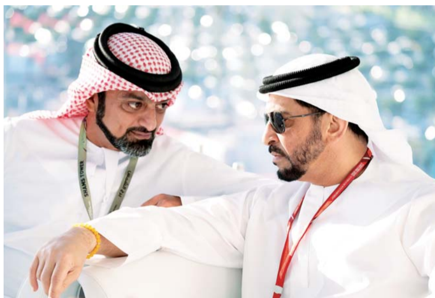
■ عمار النعيمي وحمدان بن زايد

الرياضية الإبداعية خاصة فئة الشباب وتقدر المتسابقين من أنحاء العالم، مؤكدة أهمية المسابقات الرياضية في تعزيز السلام والتواصل والتقارب بين الشعوب. وقدمت سموها التهنية لكل المتسابقين والمنظمين في منافسات الجولة الختامية لهذا الحدث الرياضي الكبير، متمنية لهم مزيداً من النجاح والتقدم في هذا السباق وغيره من السباقات والمهرجانات، شهد السباق عدد من الشيوخ والوزيرات وقيادات العمل النسائي في الدولة.