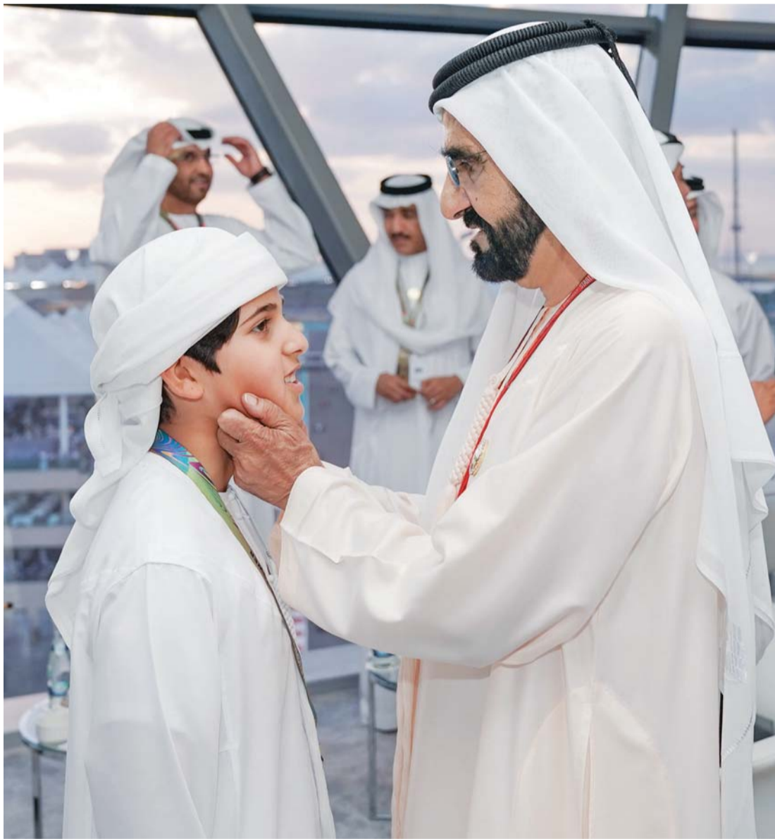
محمد بن راشد يداعب حفيده محمد بن منصور