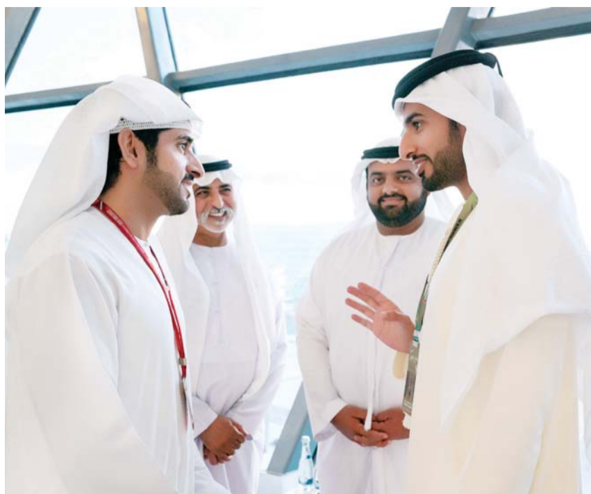
■ حمدان بن محمد متحدثاً إلى راشد بن حميد بحضور محمد الشرقي ونهيان بن مبارك