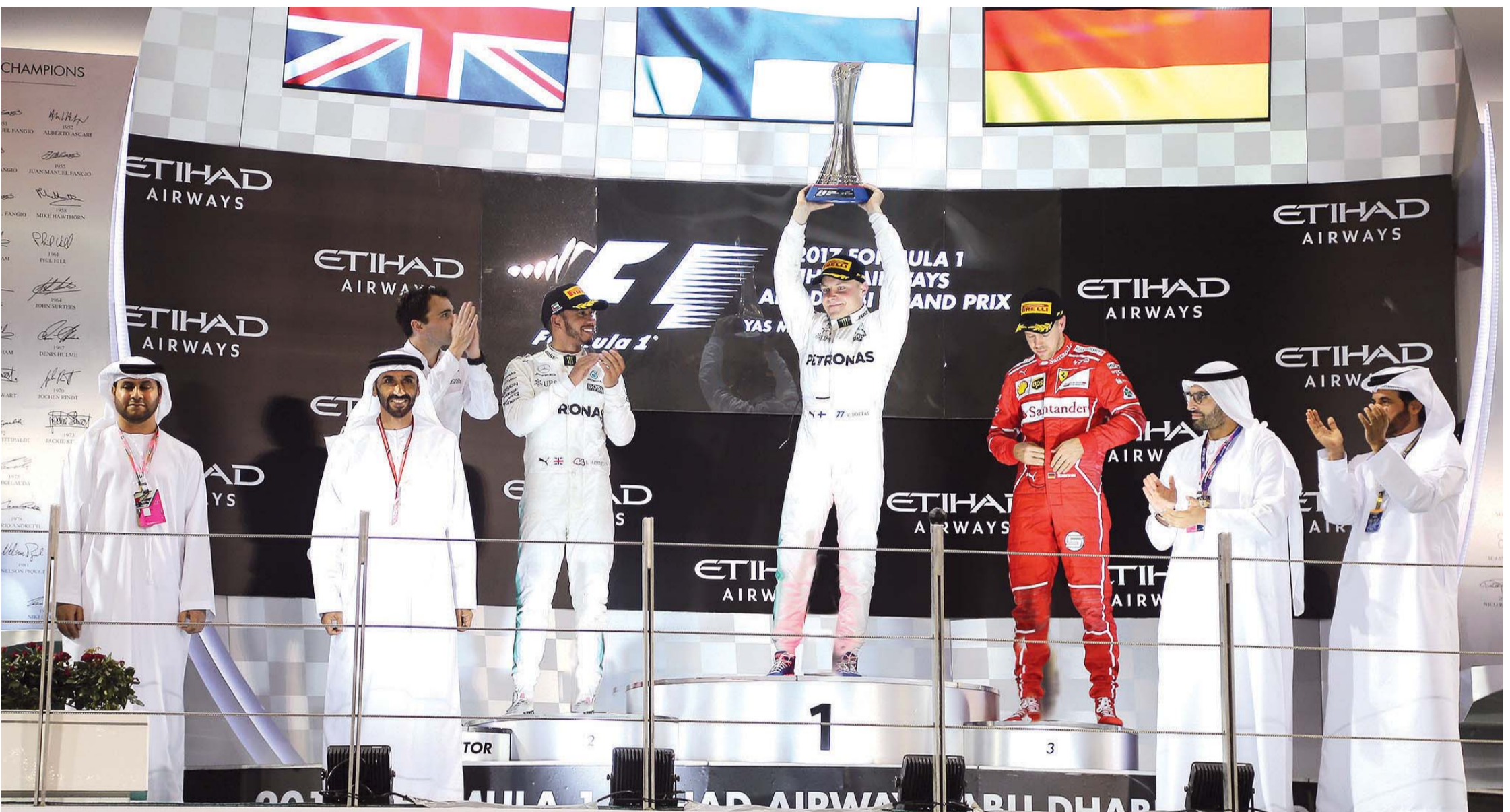
■ نهيان بن زايد خلال تتويج بوتاس بلقب سباق جائزة الاتحاد للطيران الكبرى للفورمولا 1

في طليعة المدن العالمية، ونجحت في تعزيز النواحي السياحية والاقتصادية، مشيراً سموه إلى أن تلك المكتسبات تحققت بفضل الدعم السخي للقيادة الرشيدة ودورها الريادي واهتمامها الكبير بتنمية الرياضة لتعزيز أوجه التعارف والتلاقي بين شعوب العالم.