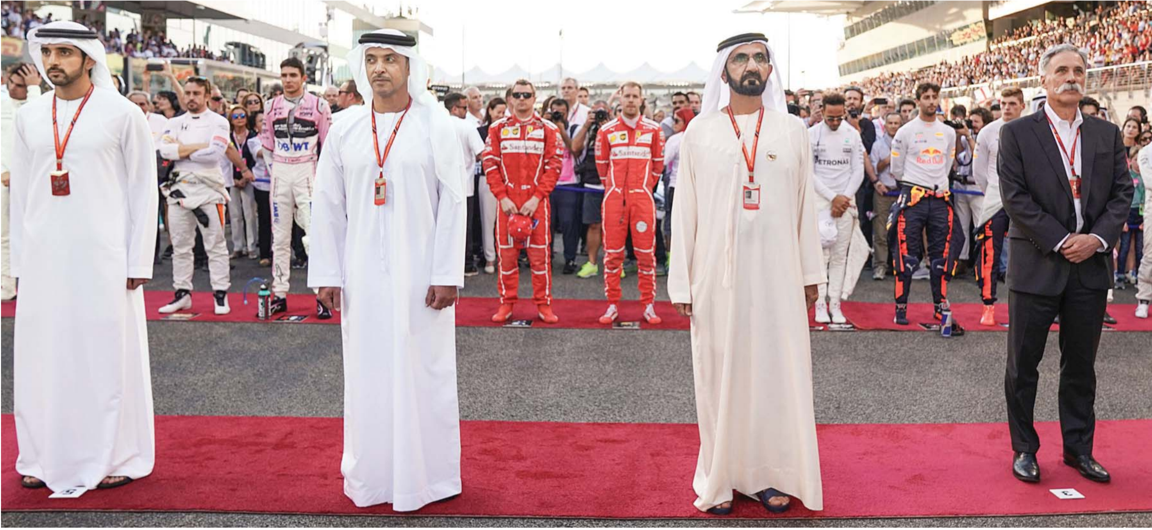
■ محمد بن راشد خلال افتتاح الحدث بحضور حمدان بن محمد وهزاع بن زايد