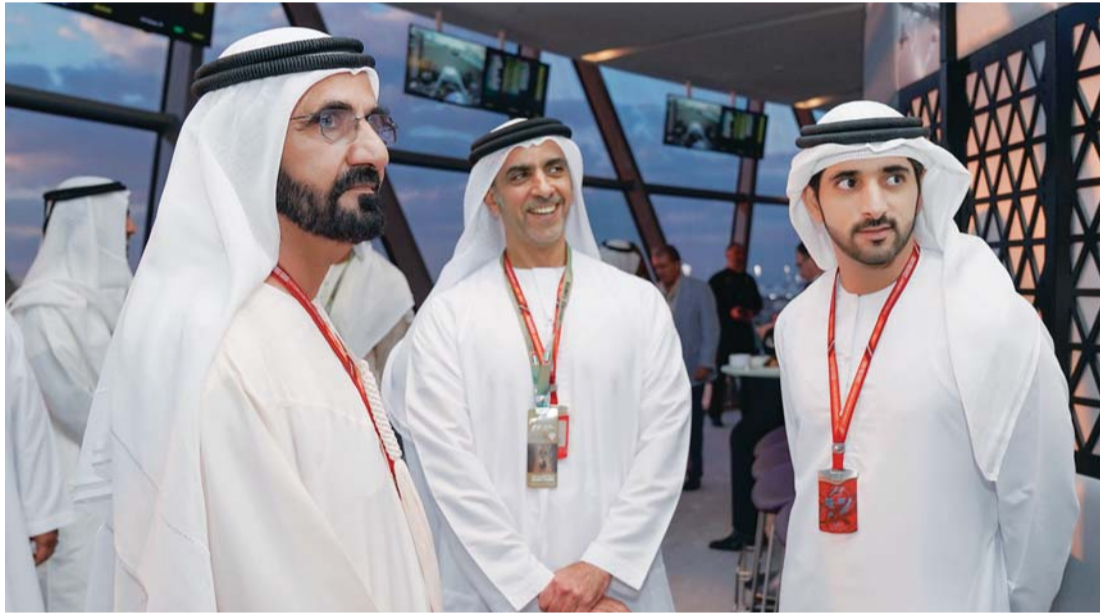
سموه خلال السباق بحضور حمدان بن محمد وسيف بن زايد