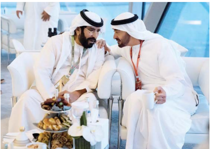
■ سموه متحدثاً إلى طحون بن محمد

والإنسانية، والفريق سمو الشيخ سيف بن زايد آل نهيان نائب رئيس مجلس الوزراء وزير الداخلية، وسمو الشيخ منصور بن زايد آل نهيان نائب رئيس مجلس الوزراء وزير شؤون الرئاسة، وسمو الشيخ حامد بن زايد آل نهيان رئيس ديوان ولي عهد أبوظبي، وسمو الشيخ عبدالله بن زايد آل نهيان وزير الخارجية والتعاون الدولي، وسمو الشيخ خالد بن زايد آل نهيان رئيس مجلس إدارة مؤسسة زايد العليا للرعاية الإنسانية وذوي الاحتياجات الخاصة، وسمو الشيخ منصور بن محمد بن راشد آل مكتوم، ومعالي الشيخ نهيان بن مبارك آل نهيان وزير التسامح، ومعالي الشيخ حمدان بن مبارك آل نهيان، وعدد من الشيوخ ومعالي الوزراء وكبار المسؤولين في الدولة.