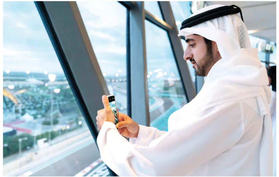
■ حمدان بن محمد يتابع السباق