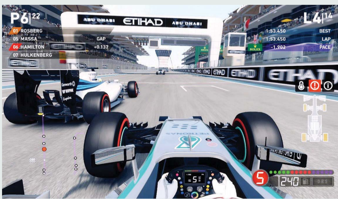
■ لعبة الفورمولا 1 الإلكترونية التي تحاكي بطولة جائزة الاتحاد في «ياس» | أرشيفية

مرشحين للفوز باللقب بعد سلسلة من التصفيات التي شهدتها حلبة مونترال في كندا وحلبة سبا فرانكورشان في بلجيكا، وكان يكفي أي من المرشحين الأربعة الفوز في المنافسات التي تقام على حلبة مرسى ياس لرفع الكأس والتتويج في أبوظبي. سطر نجم بريندون ليه في حلبة مرسى ياس منذ السباق التأهيلي الأول الذي أقيم يوم الجمعة، لكنه واجه بعض الصعوبات في السباق التأهيلي الثاني وحل السائق التركي سيم بولوكباسي بالمركز الأول في المراحل التأهيلية الثانية. وشهد السباق الثالث والنهائي لبطولة سلسلة الألعاب الإلكترونية «أي سبورتز» منافسات محتدمة، انطلق بريندون ليه الذي تركز في الصف الثاني، وبدت سيطرة التشيلي فابريزو دونوسو على مجريات السباق منذ انطلاقه وحتى بداية اللفة الأخيرة التي شهدت نهاية دراماتيكية اتساع بريندون ليه من خطي فابريزو دونوسو ببراعة وحسم اللقب ضمن أجواء حماسية ومميزة وبحضور ومتابعة السائق المخضرم فرناندو ألونسو.