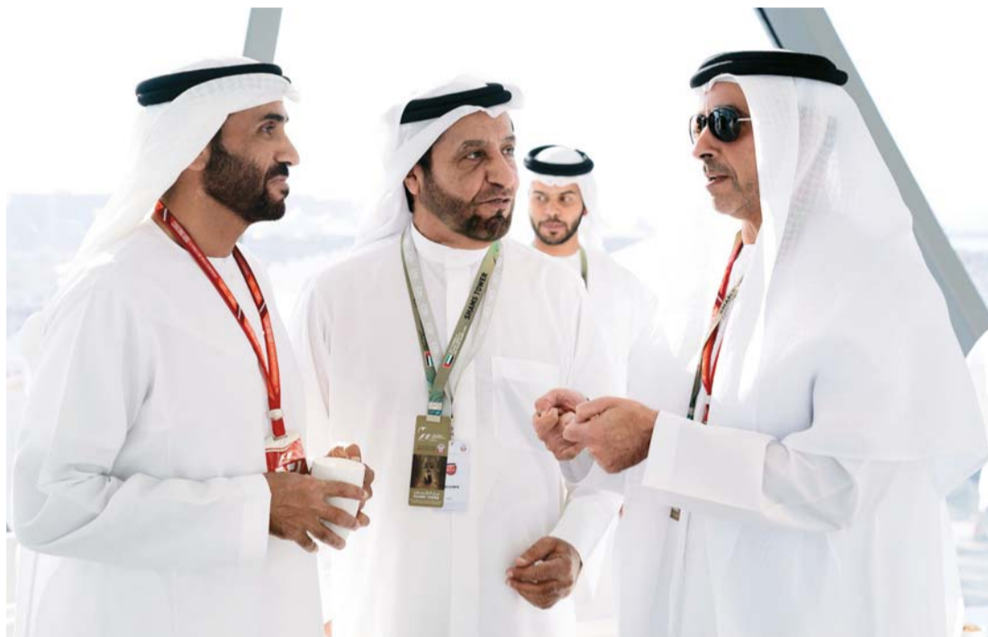
■ سيف بن زايد في حوار مع نهيان بن زايد