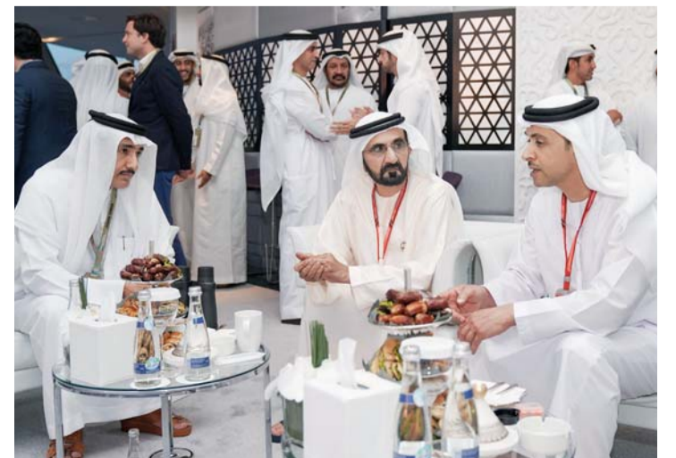
محمد بن راشد خلال حديثه مع هزاع بن زايد بحضور أحمد الزعابي