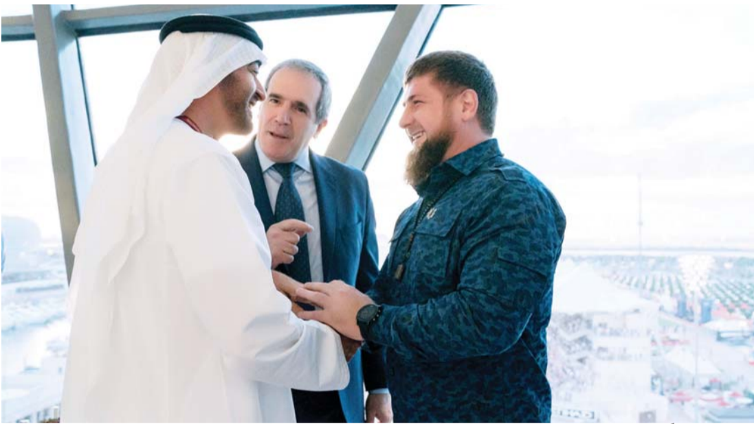
■ سموه ملتقىاً رئيس الشيشان