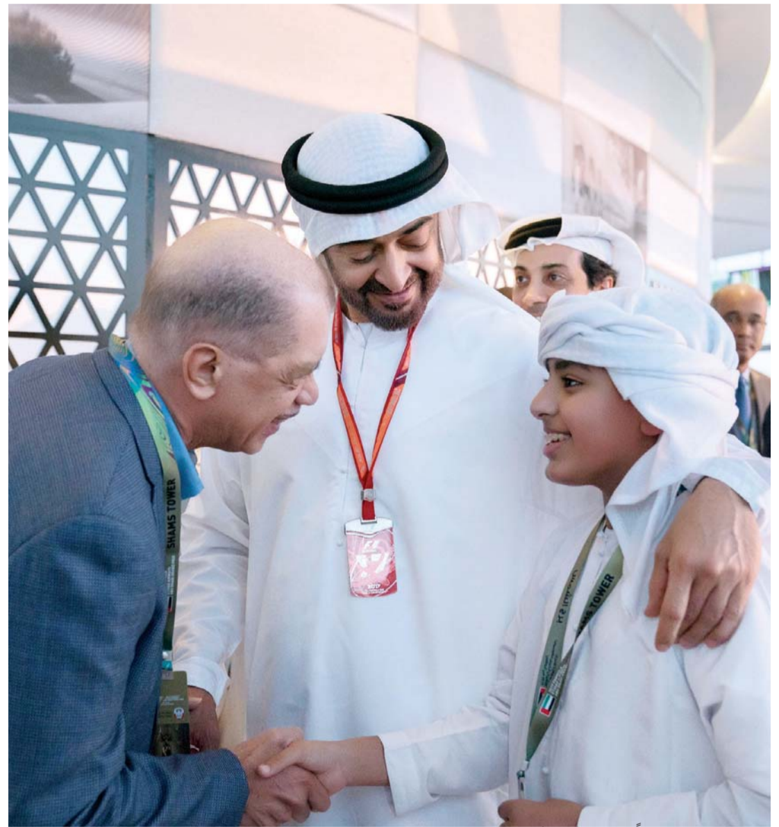
■ محمد بن زايد متابعاً حديث جيمس أليكس وزايد بن محمد بن حمد

الشؤون التنفيذية، وتشيس كاري رئيس مجموعة سباقات الفورمولا 1. وقد فاز في الجولة الختامية لسباق جائزة الاتحاد للطيران الكبرى للفورمولا 1 أبوظبي 2017، المتسابق الفنلندي فالتييري بوتاس بعد فوزه الثالث هذا الموسم، حيث استطاع إحكام سيطرته على مجريات سباق جائزة أبوظبي الكبرى الجولة الختامية لموسم 2017، متفوقاً على زميله لويس هاميلتون وسط سيطرة مطلقة لمرسيدس.