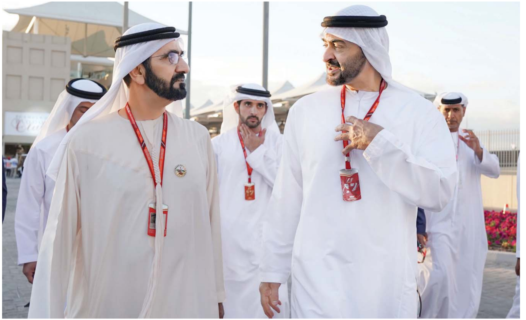
محمد بن راشد ومحمد بن زايد خلال حضورهما السباق