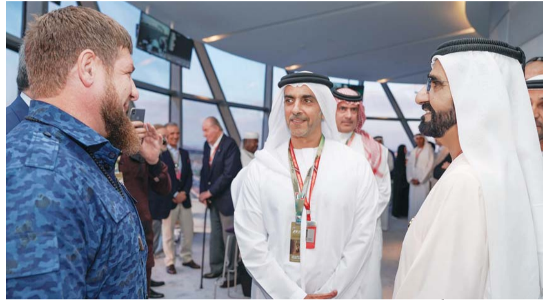
محمد بن راشد متحدثاً إلى رئيس الشيشان بحضور سيف بن زايد