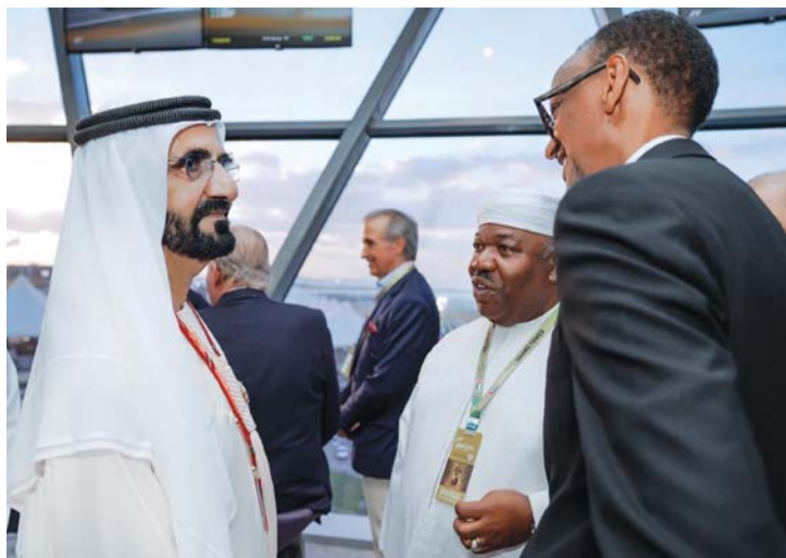
... ويتجاذب الحديث مع أحد الضيوف

أبوظبي - وام شهد صاحب السمو الشيخ محمد بن راشد آل مكتوم نائب رئيس الدولة رئيس مجلس الوزراء حاكم دبي «رعاه الله»، وصاحب السمو الشيخ محمد بن زايد آل نهيان ولي عهد أبوظبي نائب القائد الأعلى للقوات المسلحة، بحضور بعض الضيوف من رؤساء الدول والوفود الشقيقة والصديقة وسمو أولياء العهود والسيوخ، أمس، الجولة الختامية لسباق جائزة الاتحاد للطيران الكبرى للفورمولا 1 «أبوظبي 2017» على مضمار حلبة مرسى ياس في أبوظبي. كما شهد السباق الرئيس بول كاغامي رئيس جمهورية رواندا، والرئيس فيليب فويانوفيتش رئيس جمهورية مونتينيغرو، والرئيس رمضان قديروف رئيس الشيشان، وجمهورية تاتارستان، والرئيس علي بونغو رئيس جمهورية الغابون، والأمير أندرو دوق يورك، وخوان كارلوس ملك مملكة إسبانيا السابق، ورشيد الطالب العلمي، وزير الشباب والرياضة المغربي، وديس ماتوروف وزير الصناعة والتجارة الروسي، وفكتور لوكاشينكو مساعد رئيس جمهورية بيلاروسيا لشؤون الأمن القومي، وازاد رحيموف وزير الرياضة والشباب لجمهورية أذربيجان. كما شهد ختام السباق سمو الشيخ حمدان بن محمد بن راشد آل مكتوم ولي عهد دبي، وسمو الشيخ عمار بن حميد النعيمي ولي عهد عجمان، وسمو الشيخ محمد بن حمد بن محمد الشرقي