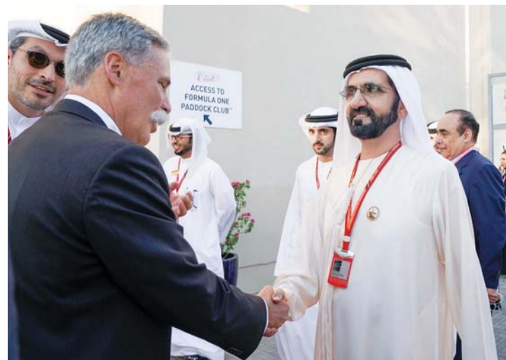
سموه مرحباً بضيوف السباق