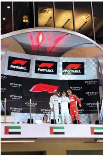
■ شعار الفورمولا 1 يزين منصة الأبطال