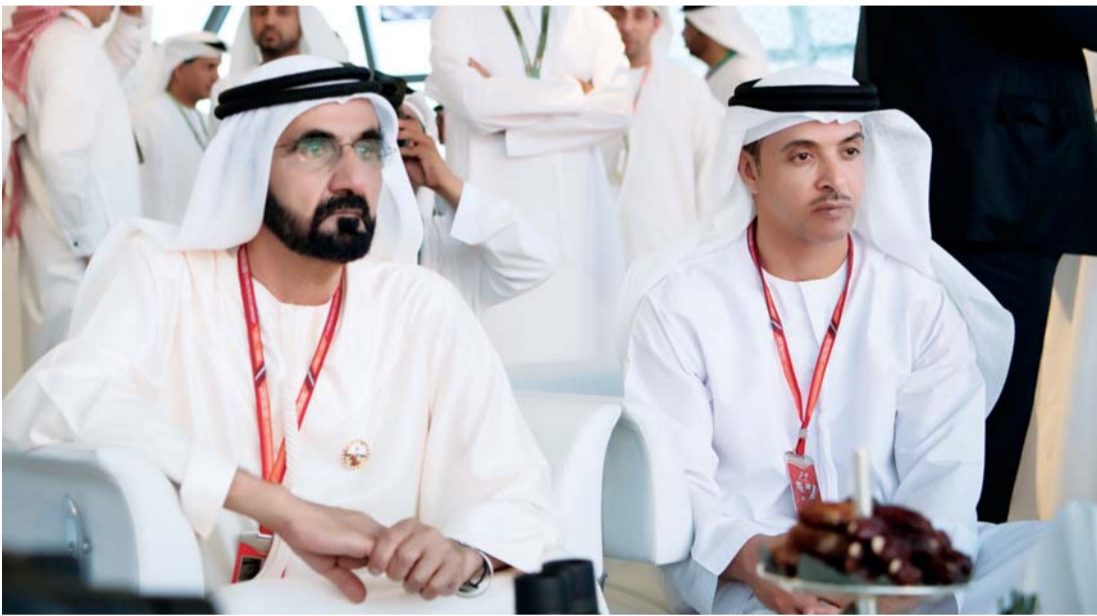
■ محمد بن راشد يتابع السباق بحضور هزاع بن زايد