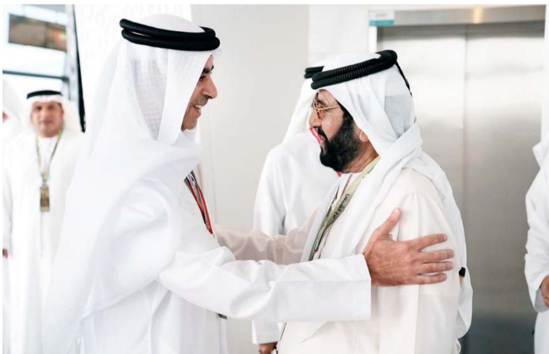
■ سموه مستقبلاً طحنون بن محمد