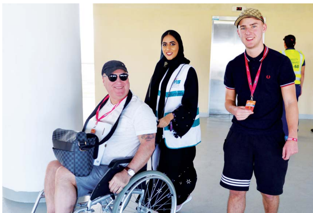
■ متطوعو برنامج تكاتف و«ساند» ساهموا في ضمان سلامة وأمن ضيوف السباق | البيان

الذي يتابعه الملايين من جماهير ومحبي رياضة السيارات. وقدمت مؤسسة الإمارات إضافة نوعية للعمل التطوعي هذا العام وذلك من خلال تقديم 40 سيارة برعاية مجموعة الفطيم، يقودها متطوعون إماراتيون من مختلف أنحاء الدولة «شباب وشابات» لتسهيل حركة التنقل لضيوف الدولة من عائلات وكبار السن وأصحاب الهمم. تقوم هذه السيارات التي أطلق عليها «سيارات الضيافة» باستقبال الضيوف والزائرين وتوصيلهم إلى أماكنهم والحلبة، وأثناء الرحلة من فندق إقامتهم إلى الحلبة قام المتطوعين بإخبار الضيوف عن الإمارات العربية المتحدة وعاداتها وتقاليدها وثقافتها والأماكن السياحية التي تستوجب الزيارة خلال مدة إقامتهم في الدولة. والجدير بالذكر أن بعض السيارات التي استخدمها متطوعو تكاتف وساند هي سيارات مجهزة تجهيزاً كاملاً لأصحاب الهمم لتنتقلهم أينما يريدون براحة تامة ودون صعوبة، كما توافرت سيارات مخصصة للسيدات تقودها فتيات متطوعات. كما قام شباب برنامجي تكاتف وساند