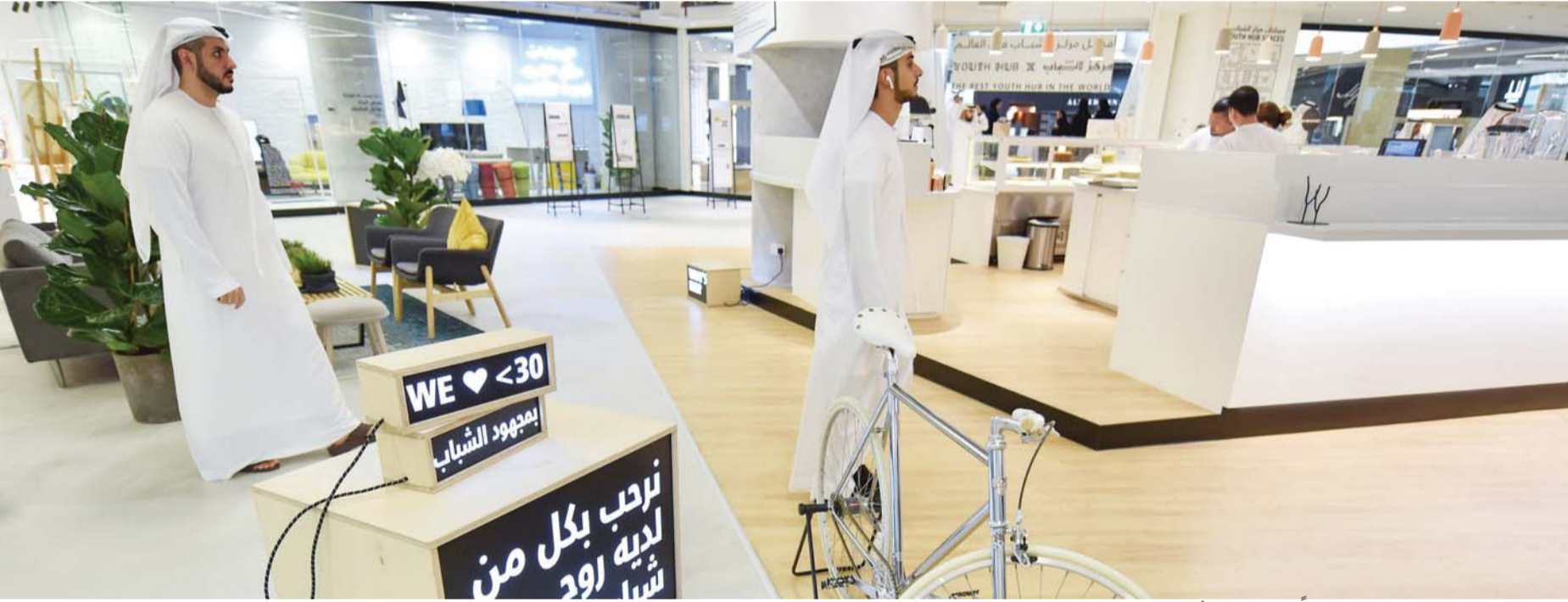
المركز صممه شباب دون الـ 30 عاماً وجاء نتيجة لأفكارهم