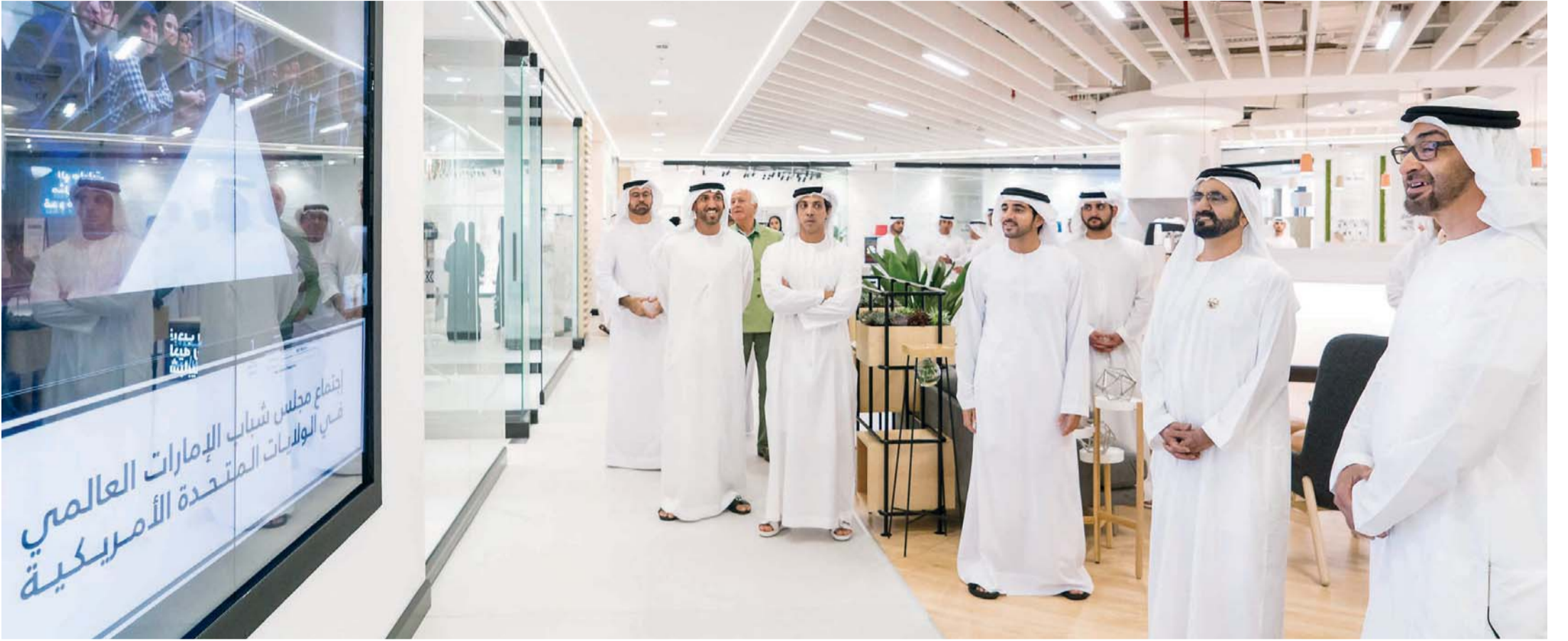
محمد بن راشد ومحمد بن زايد وحمدان ومكتوم بن محمد ومنصور بن زايد ومحمد القرقاوي ومحمد المزروعى في حديث مع مجلس شباب الإمارات في الولايات المتحدة عبر الدائرة التلفزيونية المغلقة

أكدوا ضرورة مواكبة مرحلة جديدة من الازدهار الاقتصادي والرخاء الاجتماعي