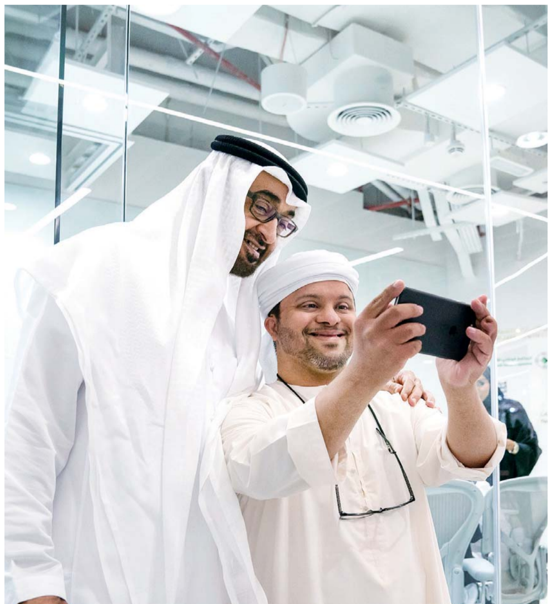
محمد بن زايد في صورة سيلفي خلال افتتاح المركز

ويمكن أن تخدم المساحات والخدمات الذي يضمها مركز الشباب، الطلاب والموظفين والفنانين ورواد الأعمال والمهندسين والكتاب، وغيرهم من الشباب الذين يرغبون بتطوير قدراتهم. وتم تصميم المركز والأثاث والمحتوى والأفكار والبناء، بمجهود الشباب، لتجسيد رؤية قيادة الإمارات في بناء جيل هو الأفضل في العالم، والأكثر احترافاً، وسيكون المركز مجاناً لكافة الشباب.