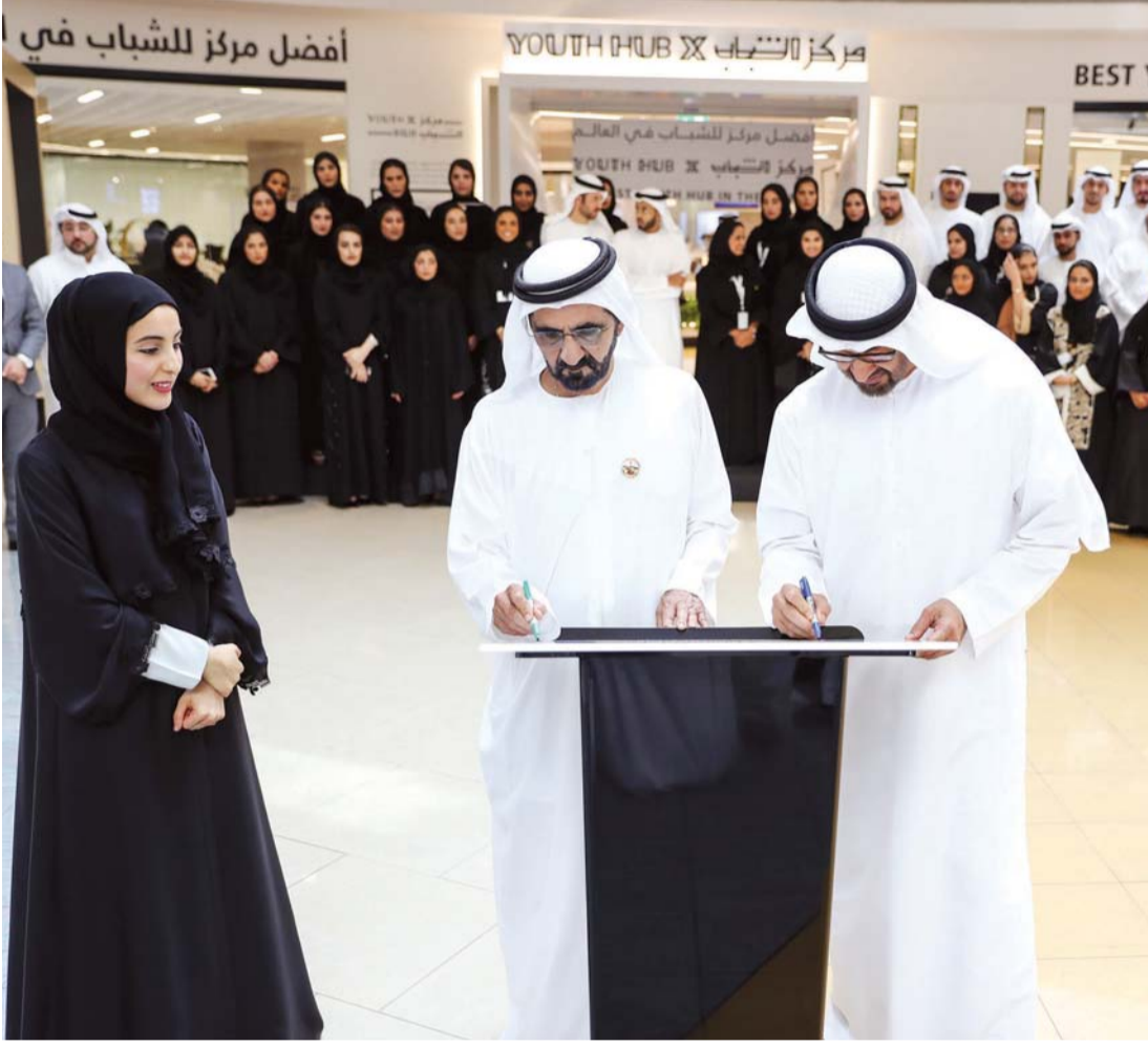
محمد بن راشد ومحمد بن زايد خلال إطلاقهما المركز بحضور شما المزروعى