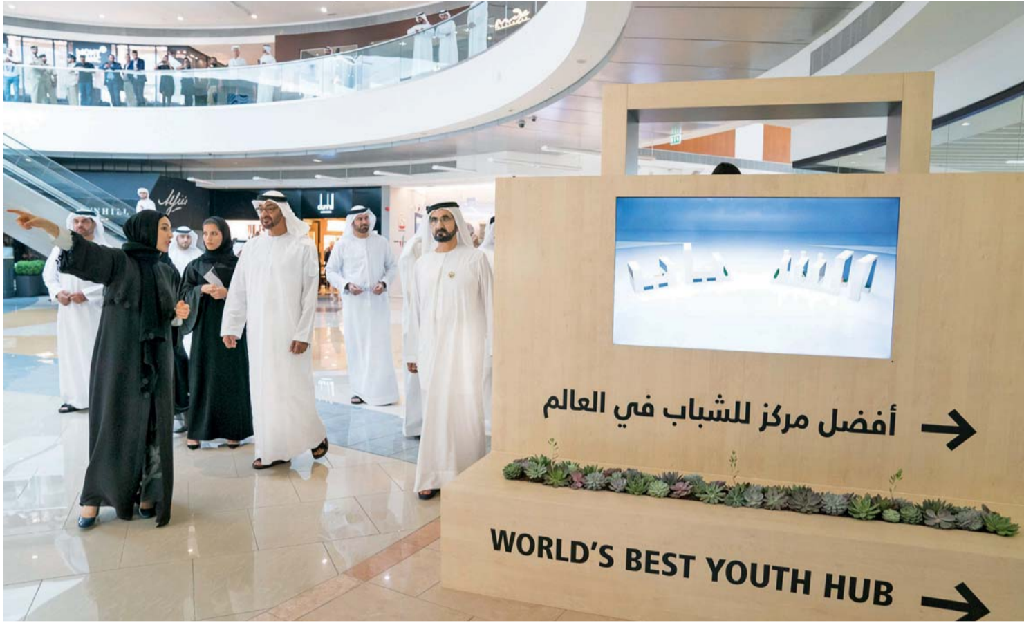
محمد بن راشد ومحمد بن زايد خلال جولتهما في المركز بحضور محمد القرقاوي وشما المزروعى

ولي عهد أبوظبي: أبنائنا المبتعثون يؤدون واجبهم ويحملون مستقبل وطن