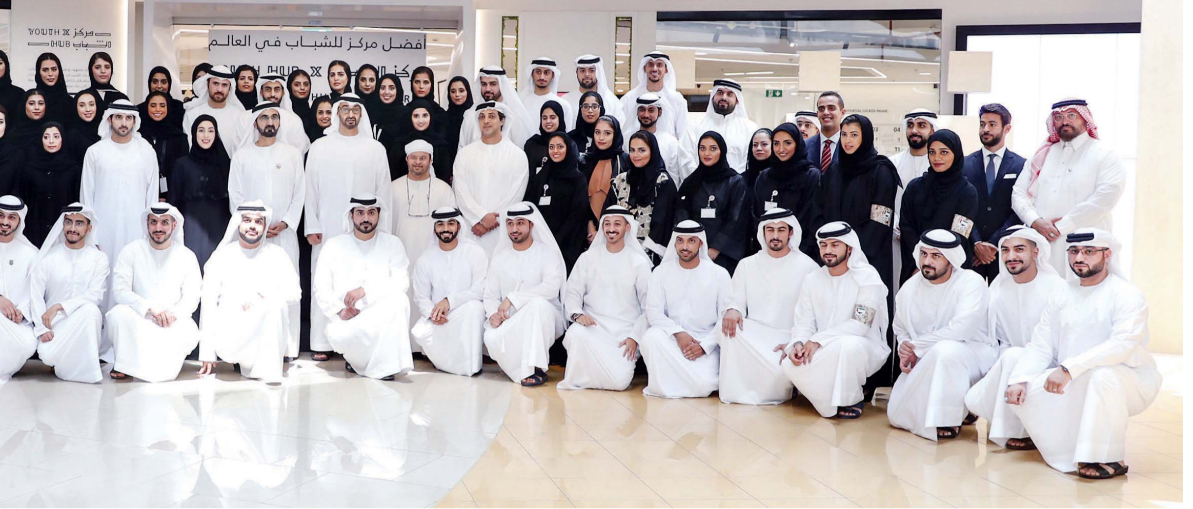
■ محمد بن راشد ومحمد بن زايد وحمدان بن محمد ومنصور بن زايد وشما المزروعى في لقطة جماعية مع شباب المركز