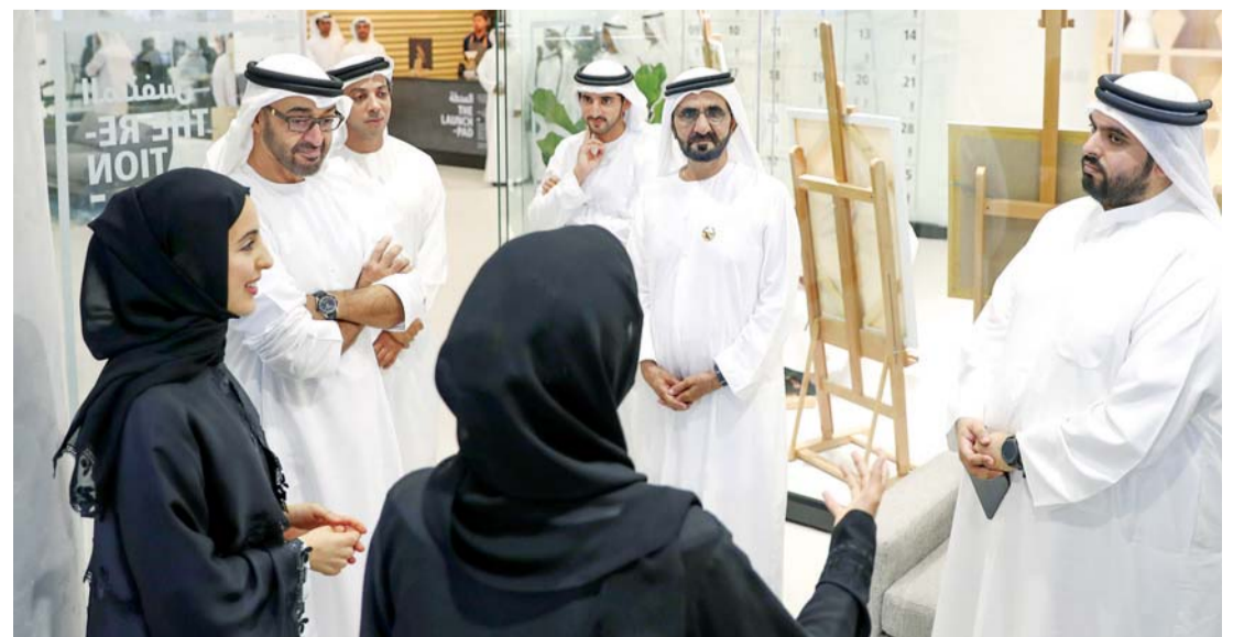
■ محمد بن راشد ومحمد بن زايد وحمدان بن محمد ومنصور بن زايد وشما المزروعى