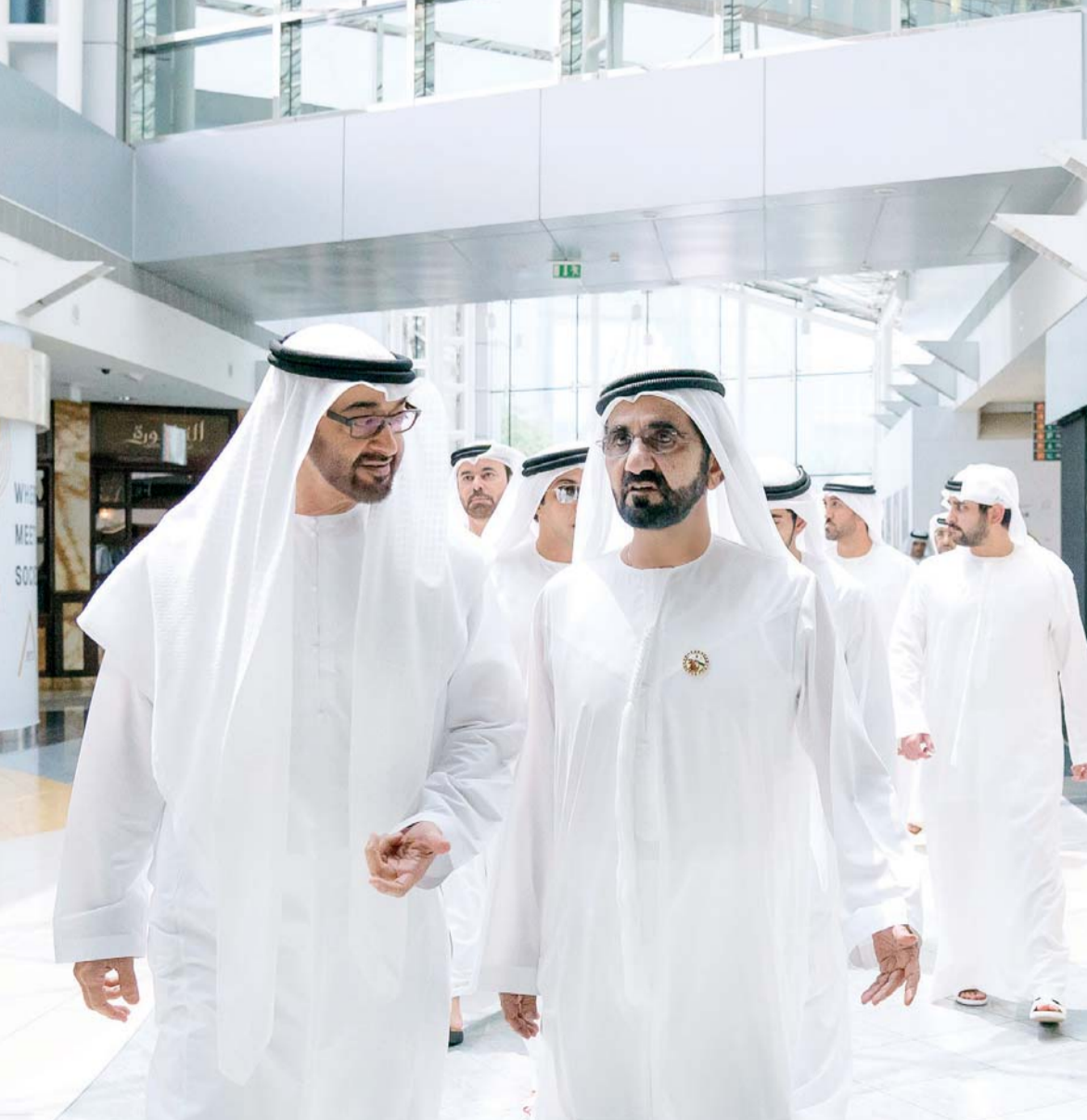
■ محمد بن راشد ومحمد بن زايد وحمدان ومكتوم بن محمد ومنصور بن زايد ومحمد القرقاوي ومحمد المزروعى

وأوضح سموه أن سر نجاح التجربة التنموية الوطنية، يتجلى بما نوفره من بيئة داعمة، وإمكانات وأدوات تكرس الإبداع والإنجاز والابتكار لعنصر الشباب، وهذا المركز وغيره من مراكز الشباب، يمثلون محطات أساسية في هذا النهج، وتتمنى سموه لجميع أبناء الوطن، التوفيق والنجاح، وبذل المزيد من العمل والجهد، والمشاركة في تعزيز مسيرة الخير من أجل رفعة وطننا الغالي.