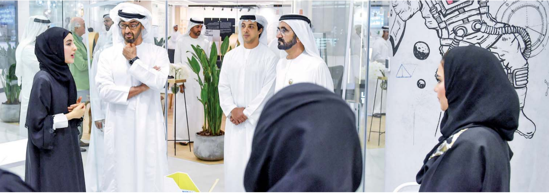
■ محمد بن راشد ومحمد بن زايد ومنصور بن زايد وشما المزروعى

ويوفر المركز، الذي يقع في أبراج الإمارات، حصصاً وورش عمل في مختلف مهارات الحياة، ومساحات لاحتضان مشاريع رواد الأعمال الشباب، ويضم مكاتب للشباب، وفرصاً للتطوع والتدريب، ومختبراً لابتكار الحلول، وعقد جلسات العصف الذهني، ومقهى شبابياً يتغير كل عام، ومنصة ومسرحاً للفعاليات الشبابية. ووجه صاحب السمو الشيخ محمد بن راشد آل مكتوم، رعاه الله، وصاحب السمو الشيخ محمد بن زايد آل نهيان، بتعميم نموذج المركز على كافة أنحاء الدولة، لتكون مراكز الشباب الجديدة، ملتقيات لتنمية الشباب، ومنصات ينطلقون منها لخدمة الوطن، ومساحات تساعد في بناء مستقبلهم، وصناعة إبداعات ومشاريع تغير مستقبل وطنهم.