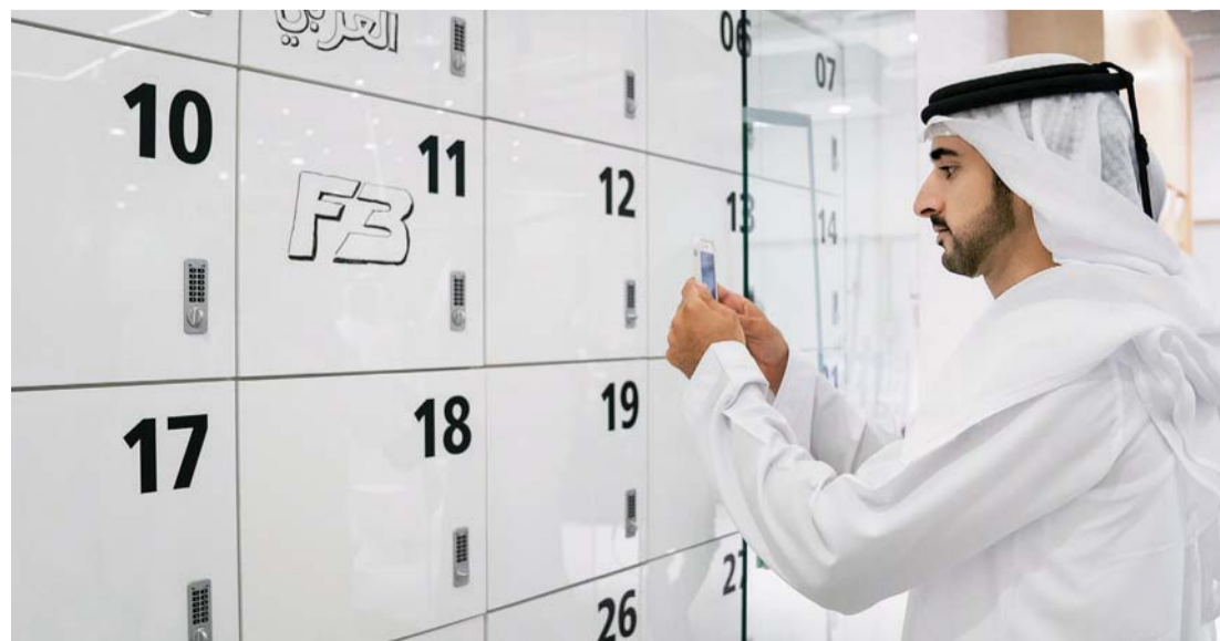
حمدان بن محمد خلال حفل تدشين المركز

ويوفر المركز أيضاً مساحة لانطلاق المشاريع الإماراتية، بحيث تتيح للشباب تجربة أدائهم خلال ثلاثة أشهر، كما يضم منصة ومسرحاً للشباب، تقام فيهما مختلف الفعاليات الشبابية، وتتيح للشباب فرصة عرض تجاربهم وإبداعاتهم. وسيعمل المركز أيضاً على توفير مكاتب للشباب، وفرص للتطوع والتدريب في المركز، وستتم إدارة المركز وحجز مساحاته عبر منصة إلكترونية، توفر أجندة سنوية مليئة بالفعاليات والبرامج.