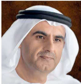
علي بن تميم

وطنية مطر الشامسي بأجمل صورها، فتغريداته صافت قادة الإمارات بكل حب، وأكد على تضامن الشعب والقيادة تحت علم واحد، وحول خطاب تميم علق بقوله: «خطاب تميم خطاب شخص يجهل ما يقول نظراً لعدم وجود مراجعين من حيث اللغة، وتناقض الأفكار والمعطيات، أستغرب من كونه أميراً لدولة قطر». وعن دماء شهداء الوطن قال «دماء شهدائنا لن تذهب هدرًا، سنأخذ بثأرها من كل غادر».