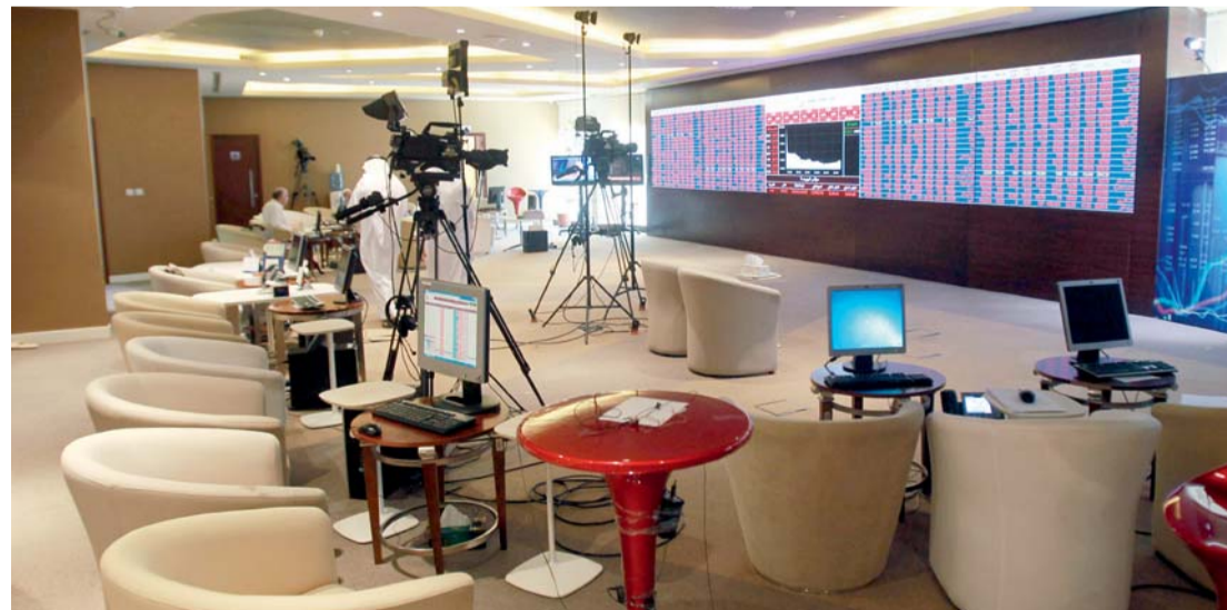
■ بورصة قطر تنكسي بالأحمر والاقتصاد يتهاوى

في قطر ويمكن أن يسبب زيادة المديونية، وأوضح «ستاندرد اند بورز جولويل» أن الجدارة الائتمانية السلبية تترتب عليها العديد من المخاطر السلبية لتصنيفها كنتيجة لأحداث الأخيرة، ما يعكس احتمال لجوء الوكالة إلى خفض التصنيف في حال ازدياد المخاطر السياسية المحلية أو زيادة مديونية الحكومة بشكل أسرع من المتوقع حالياً. وأضاف التقرير أن من الممكن أيضاً تخفيض