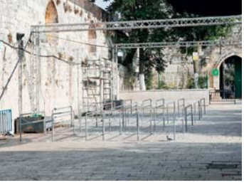
ماسحات ضوئية بدل بوابات «الأقصى»