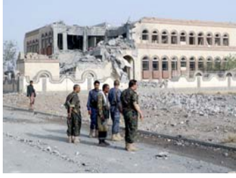
70 غارة تدمر مواقع للانقلابيين في اليمن