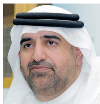
جمال بن حويرب

خطاب تميم يلقي الاستهجان.. وبين حويرب يؤكد: حسابات عمرها 5 دقائق تهاجم منتقديه