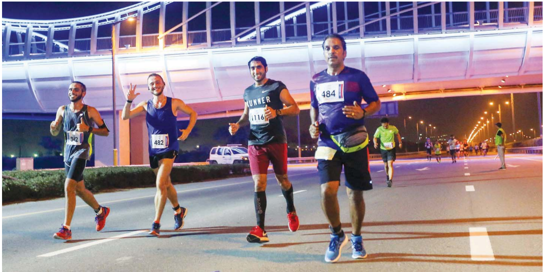
مشاركة من مختلف الجنسيات

والاسترخاء، وتقديم خدمات المياه، والطاقم الطبي من أطباء ومساعدين أطباء على جانبي منطقة نهاية السباق، بالإضافة إلى توفير سيارات إسعاف متخصصة.