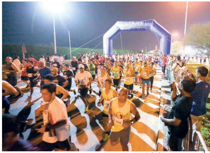
اجواء مميزة في بطولة الجري

تقام الجولة الثانية في كرة السلة على الكراسي المتحركة الليلية، وتشهد 4 مباريات ساخنة، ويشارك في البطولة 10 فرق هي: هيئة الصحة بدبي، القيادة العامة لشرطة دبي، هيئة الطيران المدني، النيابة العامة، هيئة الطرق والمواصلات، مؤسسة دبي لخدمات الإسعاف، الأنصاري للصرافة، نقوة، هيئة كهرباء ومياه دبي ونادي دبي لأصحاب الهمم. دبي - البيان الرياضي