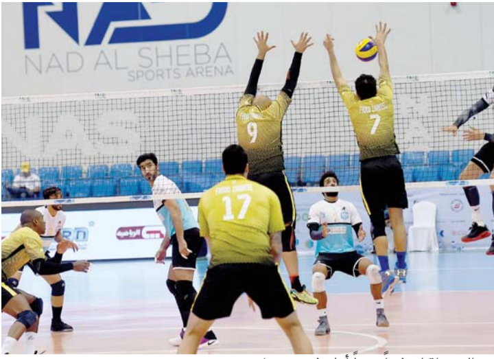
■ الحزم اقتلع فوزاً مهماً أمام فهود زعبيل