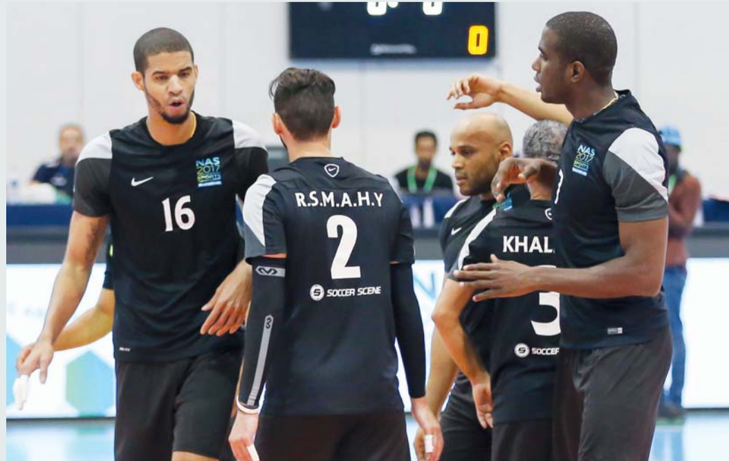
■ المفاجأة يتصدر المجموعة الأولى

وتصدر المفاجأة المجموعة بعد فوزه على سبائدرتيم بثلاثة أشواط نظيفة،