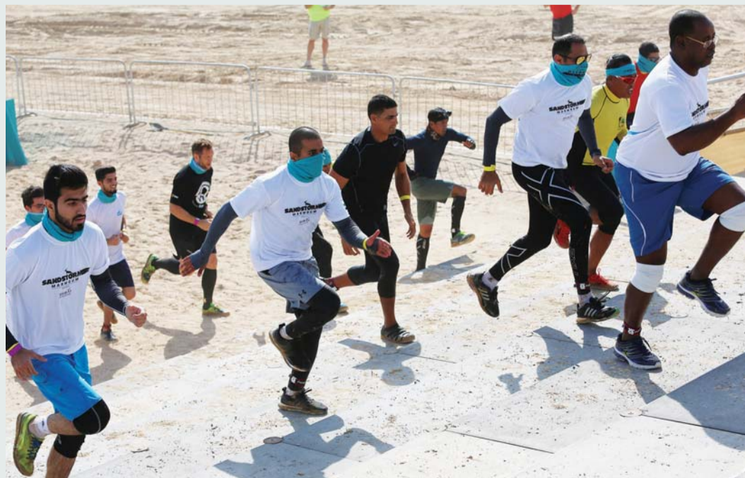
مشاركة مكثفة في سباقات التحدي

وتقام اليوم بطولة الفردي، التي يشارك فيها متنافسون من مختلف الجنسيات من داخل وخارج الدولة، حيث تنتظرهم 13 عائقاً متخصصة لهذا النوع من المسابقات، تم إقامتها بالمنطقة