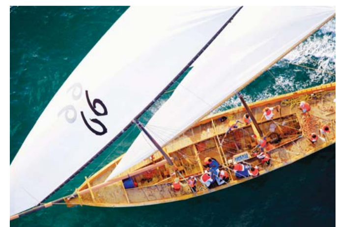
«العاصفة 99» توج بناموس سباق دلما | البيان

بحرياً. وقال: الفوز الأخير في سباق دلما يمنحه دافعاً قوياً للتألق في القفال وإهداء لقبه إلى سمو الشيخ حمدان بن محمد بن راشد آل مكتوم ولي عهد دبي رئيس مجلس دبي الرياضي مالك السفينة لأسرة الفريق.