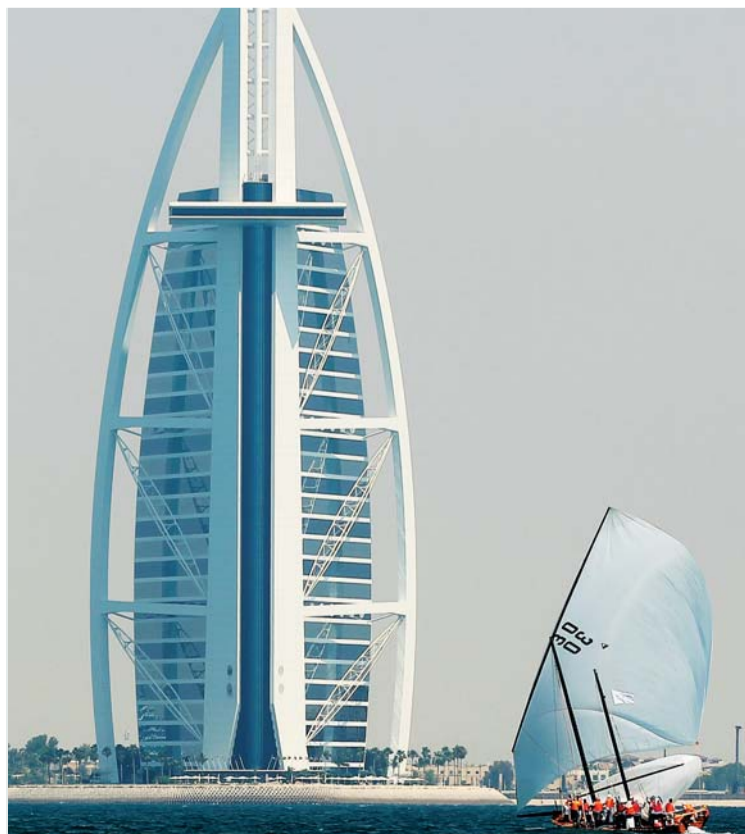
السباق يبرز معالم دبي السياحية | البيان

رحلة القفال، بالإضافة إلى لقاءات، تحت عنوان «شاهد على القفال» عبر عدد من النواخذة يحكون قصة الغوص والقفال، إضافة إلى 5 برامج في السهرة تشمل ذكريات عن السباق. وتقدم القناة اليوم من جزيرة صير بونعير، برنامجاً مع المشاركين والمنظمين ومسؤولي الجزيرة وهيئة السياحة. وتشارك قناة الشارقة الرياضية في نقل فعاليات السباق، من خلال استوديو خاص من جزيرة صير بونعير، كما يسלט الضوء على فعاليات المهرجان البيئي.