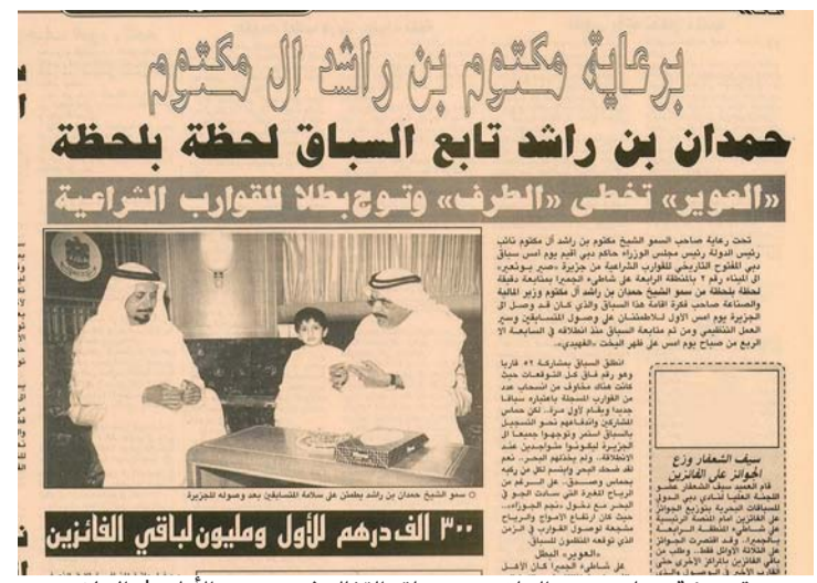
صورة ضوئية مما نشرته «البيان» عن سباق القفال في نسخته الأولى

ما بين الماضي واليوم.. ذكريات طويلة عاشها سباق القفال عبر 27 عاماً لم يتوقف خلالها في أية سنة، وتواصلت احتفالات البحارة والنواخذة، عبر هذه الملحة التاريخية، وتم نقلها عبر الأجيال، لتذكر أبناء اليوم بتضحيات الآباء والأجداد في سعيهم لإيجاد لقمة العيش والبحث عن الرزق في البحر، ومازال الجميع يتذكر النسخة الأولى في 23 مايو 1991، وشهدت