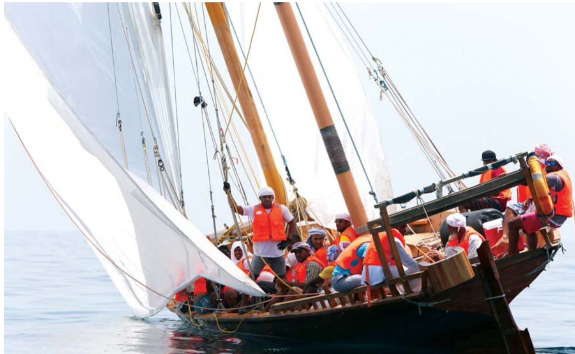
■ لمحة القفال فخر الأجيال | البيان