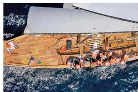
«القفال» رحلة طويلة من النجاح | البيان