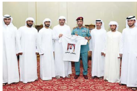
الشامسي يعلن مشاركة شرطة الشارقة في السباق | البيان

أعلن العميد سيف الزري الشامسي، القائد العام لشرطة الشارقة عن مشاركة القيادة العامة لشرطة الشارقة في (القفال 27)، عبر المحمل «سلطان الخير» التابع للقيادة وتحمل الرقم 32 بقيادة النوخة ناصر المرزوقي، وذلك لأول مرة على مستوى وزارة الداخلية، وقال: المشاركة بمحمل اسم «سلطان الخير» تيمناً بمقام صاحب السمو حاكم الشارقة، الذي قدم ويقدم الكثير للإمارة في مختلف المجالات، وتعد أقل تقدير من شرطة الشارقة لصاحب السمو حاكم الشارقة وتتمنى أن تكون مشاركتنا في السباق متميزة.