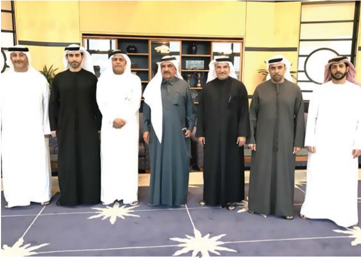
حمدان بن راشد مع سعيد حارب وأعضاء إدارة دبي البحري | البيان