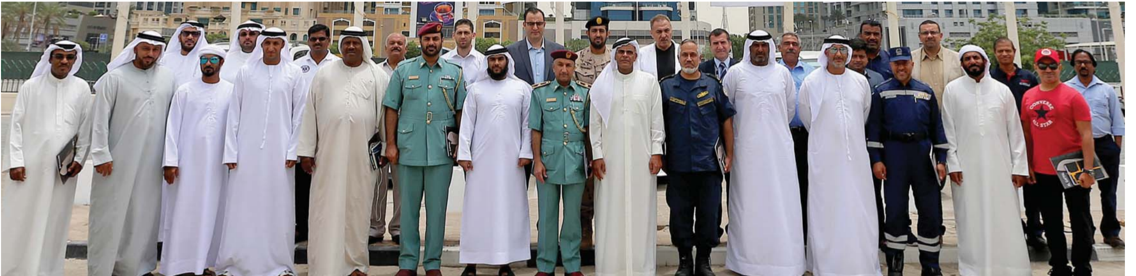
اللجنة المنظمة العليا مع الشركاء | البيان

السباق من الانطلاقة ونقطة البداية وحتى خط النهاية قبالة شواطئ دبي، وأكد أن التنسيق سيكون مهماً وقائماً بين جميع الوحدات المشاركة من مختلف الإدارات ومن جهاز حماية المنشآت الحيوية والسواحل (قيادة السرب الرابع).