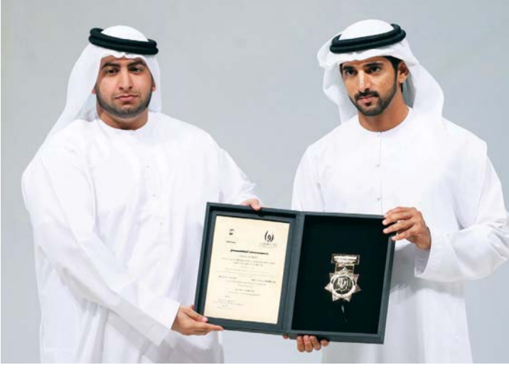
■ حمدان بن محمد خلال تسليمه جائزة حمدان بن راشد إلى نجله راشد | البيان