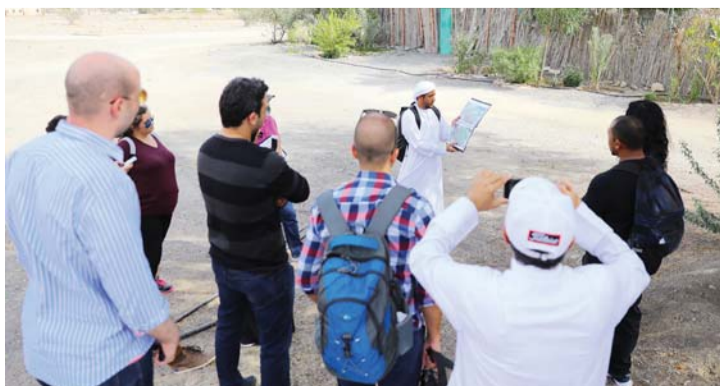
■ مرشد سياحي مواطن يقود فريقاً سياحياً في جولة

متميزة بالنسبة للمواطنين الإماراتيين، الذي يعتبر بمثابة سفير أمام الوفود السياحية الزائرة، مشيراً إلى أن سياحة دبي قادرة على استيعاب أكبر عدد ممكن من المواطنين في هذه الدورات، وأوضح كاظم أن النظرة المجتمعية للعاملين في القطاع السياحي شهدت تطوراً لافتاً مقارنة بالسنوات الماضية، بحيث بات المواطنون يدركون أهمية هذا القطاع وما الذي يعنيه العمل بالقطاع السياحي لا سيما مهنة المرشد السياحي، مشيراً إلى أن الدائرة تعمل بشكل متواصل على رفع نسبة الوعي بين المواطنين من خلال تنظيم الدورات