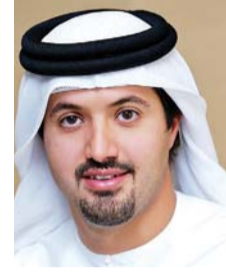
■ هلال المري

أكد هلال سعيد المري، مدير عام دائرة السياحة والتسويق التجاري في دبي أن الدائرة حريصة على طرح العديد من البرامج التدريبية لتعزيز القطاع السياحي من خلال الاعتماد على كوادر وطنية مؤهلة وقادرة على إضافة قيمة حقيقية في هذا المجال، مشيراً إلى أن هذه الكوادر هي الأقدر على تقديم تجارب مبتكرة وجديدة للزوار ونابعة من الفهم العميق للبيئة الإماراتية، كما أن ذلك من شأنه فتح آفاق تمكنهم من التعرف على ثقافات وجنسيات مختلفة وإيصال الصورة الصحيحة عن دبي.