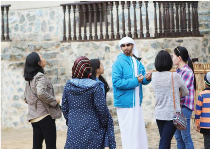
مرشد سياحي خلال جولة في أحد المعالم الأثرية