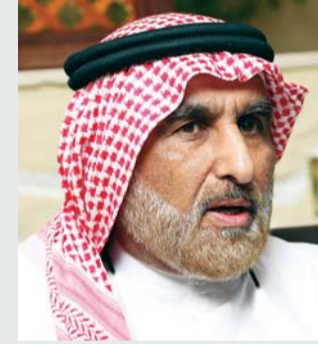
محمد بن صقر القاسمي

وأضاف العامري: لكن يبقى السؤال، ما المعايير التي سيتم الاستناد عليها حتى يحدد مراقب المباراة، ليقول إن هذا قصته مخالفة وذلك لا،؟، هذه واحدة من النقاط التي يجب أن تكون واضحة، حتى لا يكون هنالك أي تأويل أو تحريف. وقال المتحدث الرسمي باسم نادي الوصل، إنه إذا توفرت الآلية