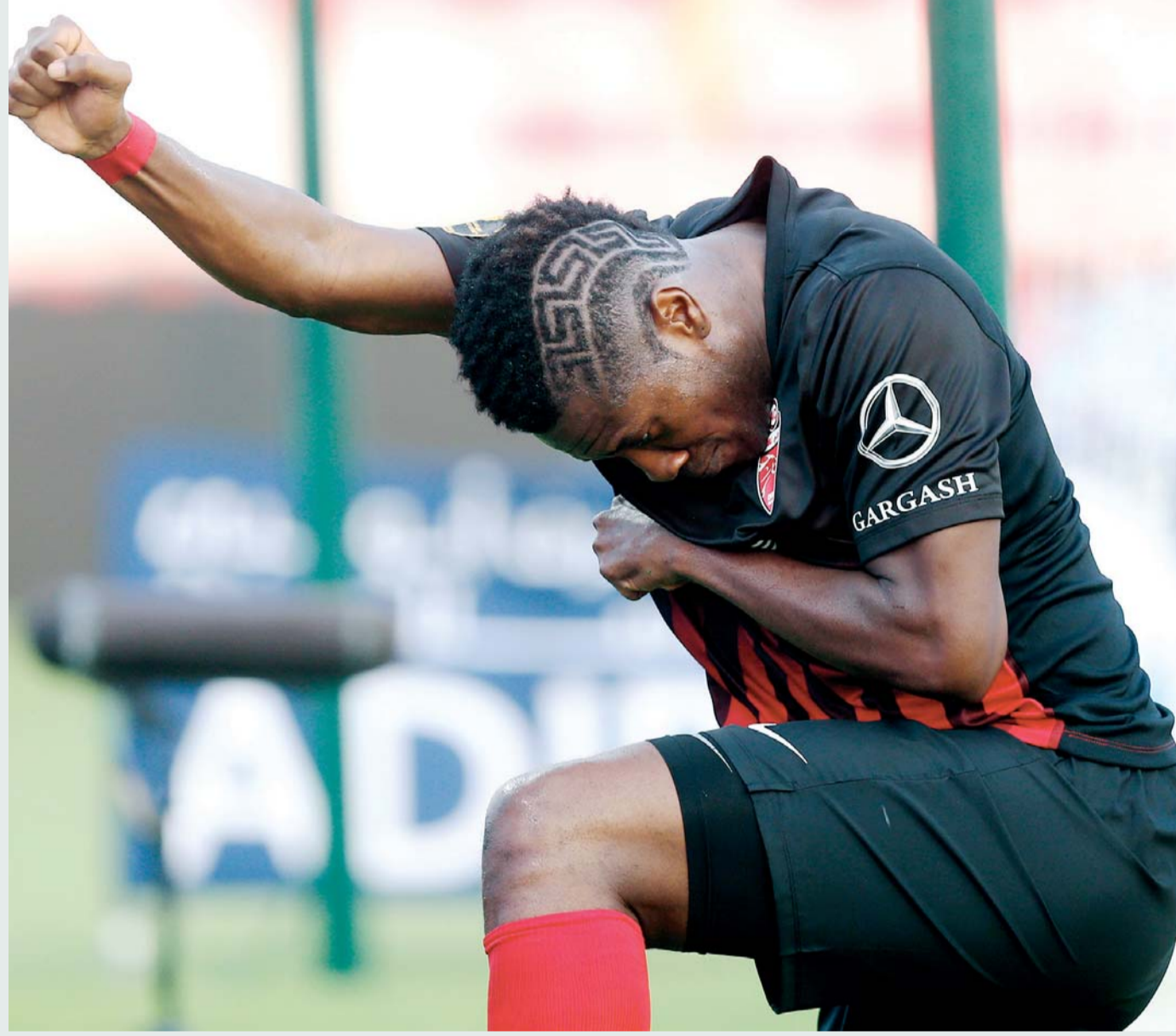
قصات شعر غريبة تثير جدلاً في دورينا