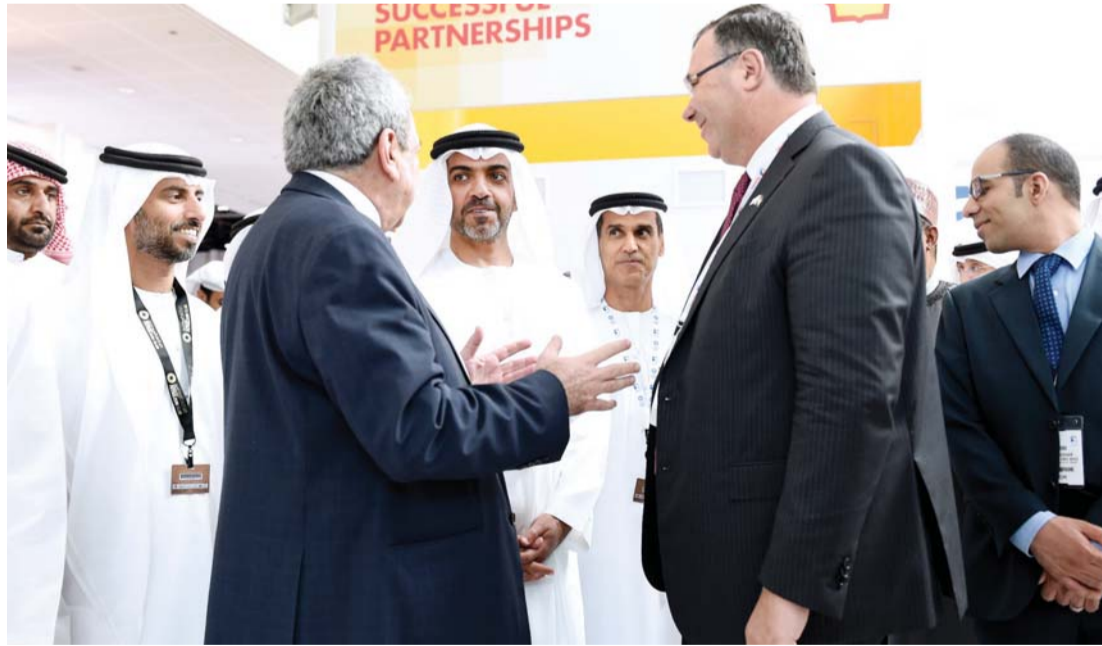
حامد بن زايد يستمع إلى أحد العارضين بحضور سهيل المزروعي

يقام «أديبك 2016» بدعم من وزارة الطاقة وشركة أدنوك وغرفة تجارة وصناعة أبوظبي وهيئة أبوظبي للسياحة والثقافة وبتنظيم من «دي إم جي للفعاليات»، ويعتبر ملتقى عالمياً ومنبراً رفيعاً لتبادل المعرفة بين الجهات المؤثرة في القطاع يجمع المتخصصين في صناعة النفط والغاز حول العالم تحت مظلة واحدة وقد استطاع أديبك ترسيخ مكانته كأبرز حدث في مجتمع شركات النفط والغاز العالمي.