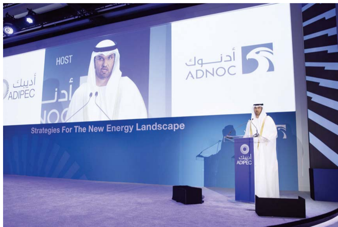
سلطان الجابر يلقي كلمته الافتتاحية لمعرض ومؤتمر «أديبك»

أكد الدكتور سلطان الجابر على ضرورة قيام قطاع النفط بالمشاركة في جهود حماية البيئة جنباً إلى جنب مع توفير إمدادات الطاقة المطلوبة لتحريك عجلة الاقتصاد العالمي، في إشارة إلى التزام أديبك مع أعمال مؤتمر الأطراف المشاركة في اتفاقية الأمم المتحدة لتغير المناخ في مراكش. وأوضح أن أدنوك تعمل على إنتاج وقود أنظف وتقوم بتطبيق أحدث ابتكارات التكنولوجيا النظيفة مشيراً إلى تشغيل أول مشروع لالتقاط الكربون واستخدامه وتخزينه على مستوى الشرق الأوسط السبت الماضي.