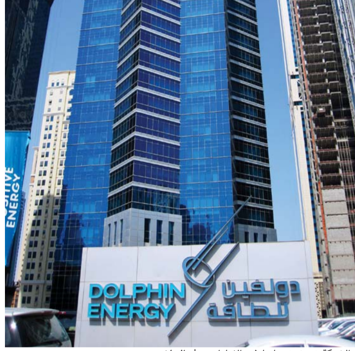
الشركة تعزز خدماتها في الإمارات | البيان

الشركة تطرح مناقصات بشكل دوري لصيانة وإصلاح الأعطال الطارئة في خط أنابيب دولفين للغاز، لافتاً إلى أن الشركة تقوم بعمل صيانة دورية (عمرة) لخط غاز دولفين، وتتم هذه الصيانة للتأكد من سلامة الخط ومعالجة