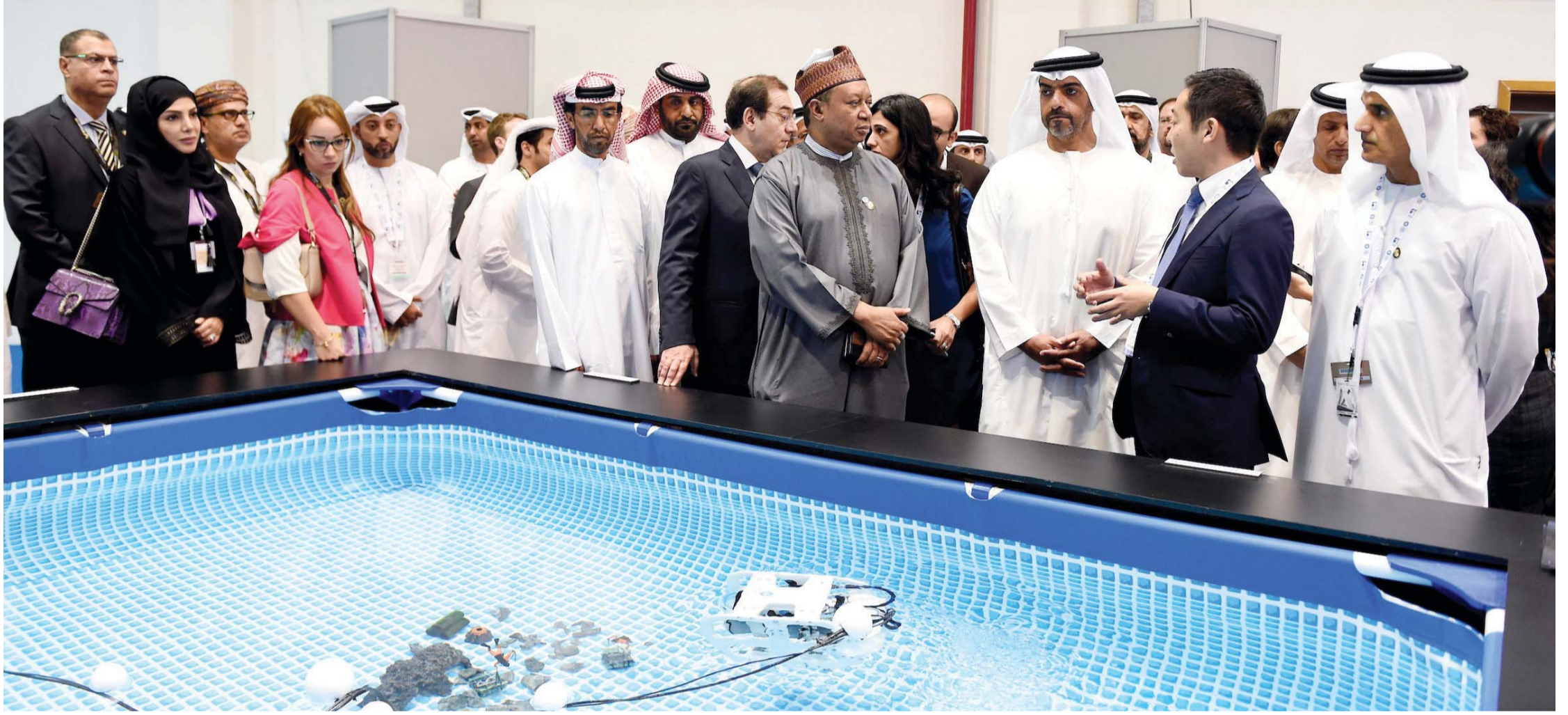
حامد بن زايد لدى تفقده أجنحة «أديبك 2016» | وام