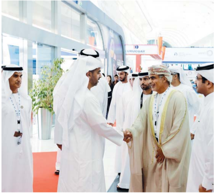
سموه خلال الجولة بين أجنحة المعرض