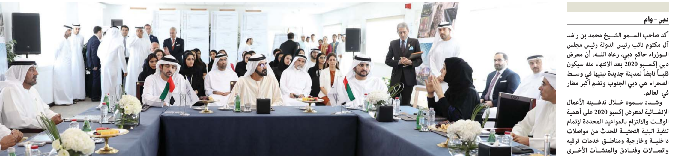
محمد بن راشد خلال الاجتماع بحضور حمدان ومكتوم بن محمد وأحمد بن سعيد وريم الهاشمي ومحمد العبار

■ توجيه اللجنة العليا بالتحلي بالصبر والإيجابية والتفاؤل لتنجح في عملها وتؤدي واجبها