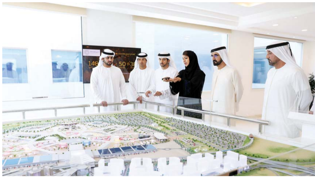
محمد بن راشد بحضور حمدان ومكتوم بن محمد وأحمد بن سعيد يطلع على مستجدات المشروع