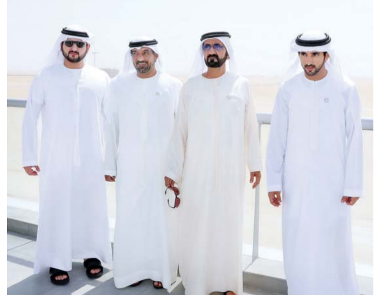
■ محمد بن راشد وحمدان ومكتوم بن محمد وأحمد بن سعيد

الشيخ محمد بن راشد آل مكتوم، من على شرفة المبنى المؤقت للأعمال الإنشائية التي تجري بغرض إعداد وتسوية وتمهيد أرض الموقع، ثم التقطت لسموه ورئيس وأعضاء اللجنة العليا، الصور التذكارية، ثم قام سموه بعد ذلك بجولة تفقدية للمكاتب، وتبادل التحية مع فرق العمل، وحثهم سموه على الجهد والاجتهاد والابتكار، مشيداً بجهودهم، ومواصلتهم دون كلل وللتحضير لهذا الحدث العالمي، الذي يريده سموه أن يكون أيقونة للتسامح والتلاقح من ثقافة دولتنا وشعبنا القيم النبيلة والمثل الإنسانية العليا، إلى جانب المودة والمعاملة الطيبة وكرم الضيافة العربية، متمنياً سموه للجميع النجاح والتوفيق. وقبيل مغادرته المكان، وقع سموه في أول صفحة من سجل الشرف الخاص بإكسبو دبي 2020، ليكون فاتحة خير وتفاؤل في المستقبل المنشود.