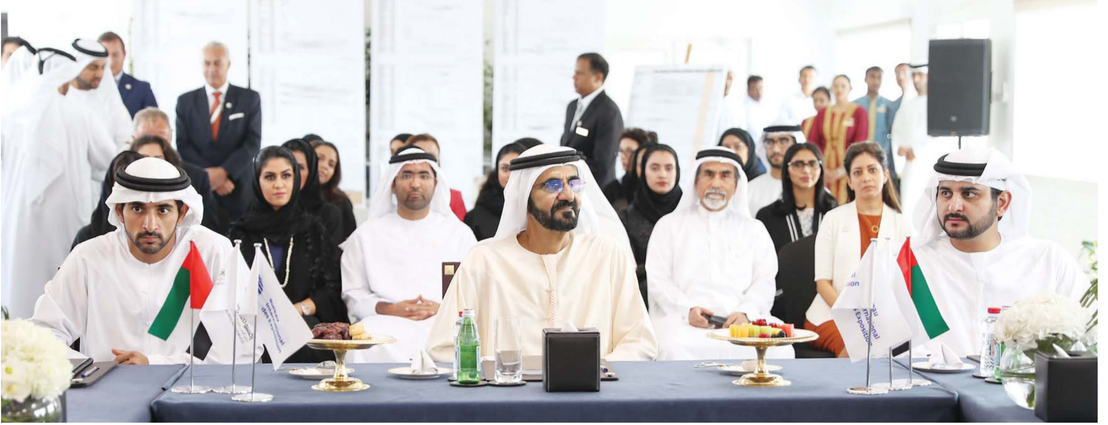
محمد بن راشد وحمدان ومكتوم بن محمد خلال الزيارة

■ سموه يشدد على أهمية الوقت والالتزام بالمواعيد المحددة لإتمام تنفيذ البنية التحتية للحدث