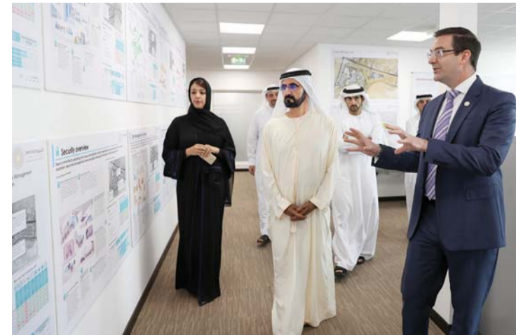
محمد بن راشد خلال جولته في مكتب إكسبو بحضور حمدان ومكتوم بن محمد