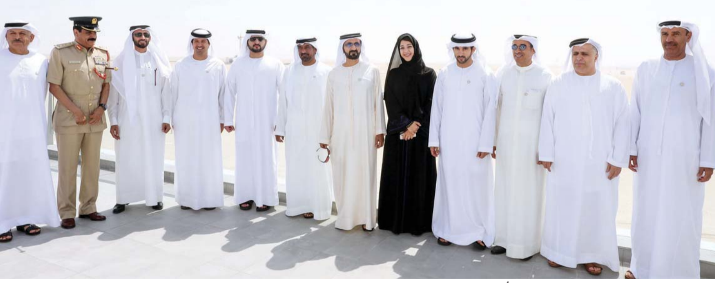
■ نائب رئيس الدولة وحمدان ومكتوم مع أعضاء اللجنة العليا لإكسبو 2020