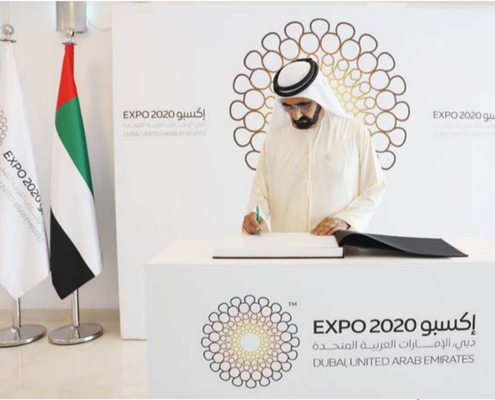
■ سموه موقعاً في أول صفحة من سجل الشرف الخاص بـ«إكسبو»

وتضم اللجنة العليا، سمو الشيخ أحمد بن سعيد آل مكتوم رئيساً، ومعالي محمد إبراهيم الشيباني مدير عام ديوان صاحب