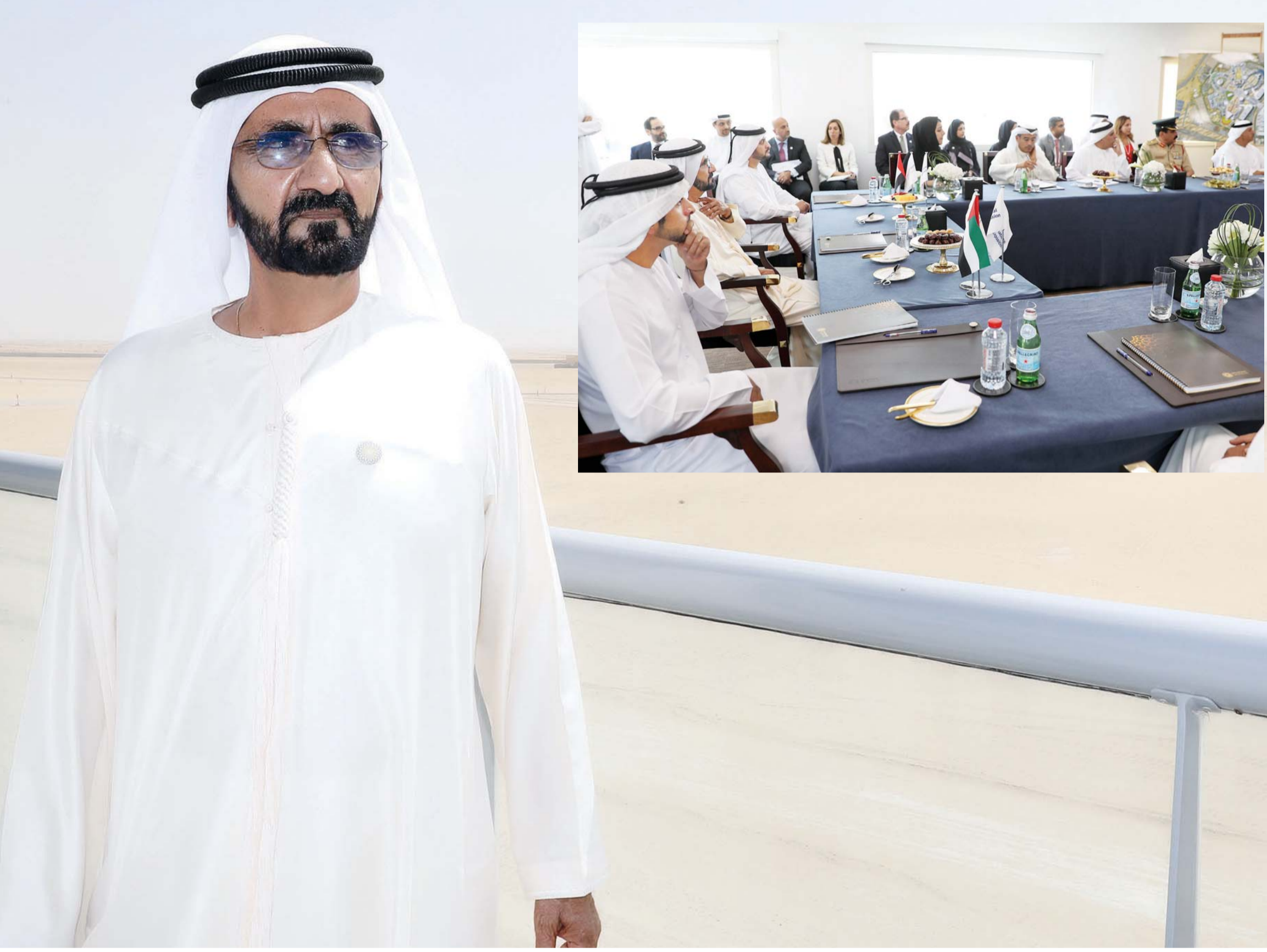
■ نائب رئيس الدولة في موقع إكسبو 2020 دبي