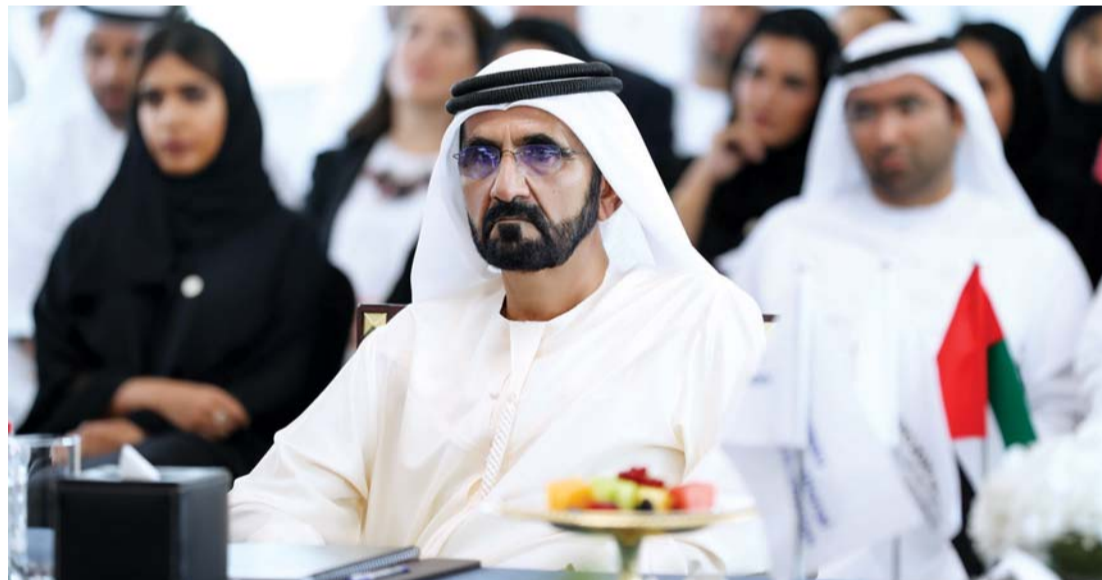
محمد بن راشد مستمعاً لشرح عن إكسبو

وقد شاهد سموه في بداية الزيارة للموقع، مجسماً ضخماً للمعرض والمباني والمنشآت المحيطة به في آخر تصميم هندسي باركه سموه، وأيدى ارتياحه ورضاه للتصميم الرائع لمبنى المعرض والمنطقة المحيطة