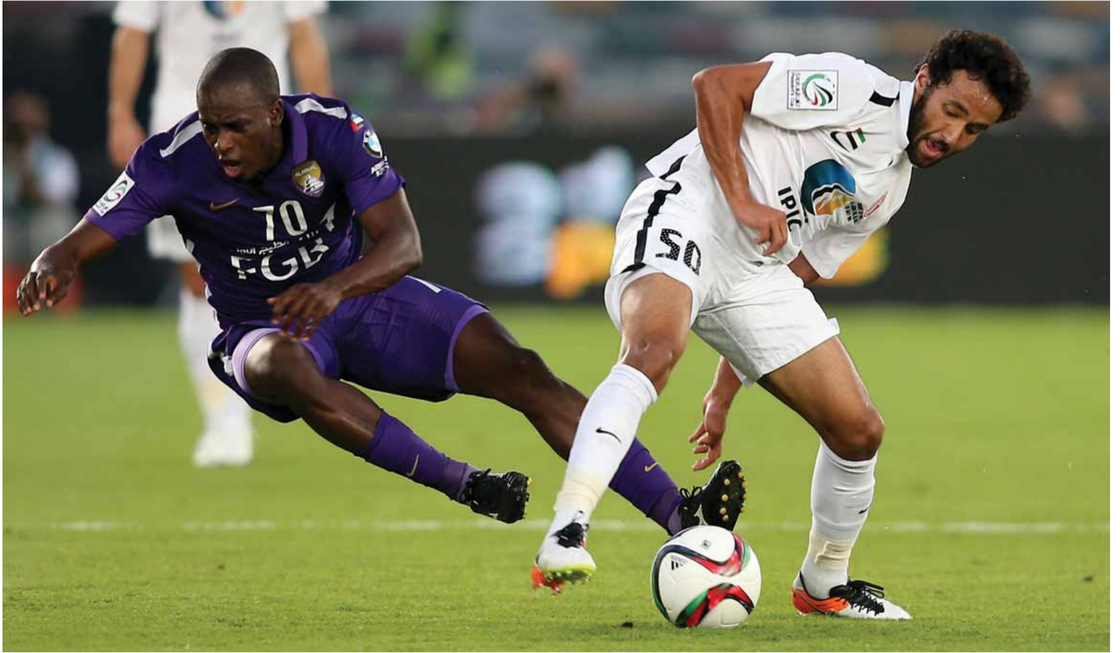
■ العين أدرك التعادل وخرج بضربات الترجيح