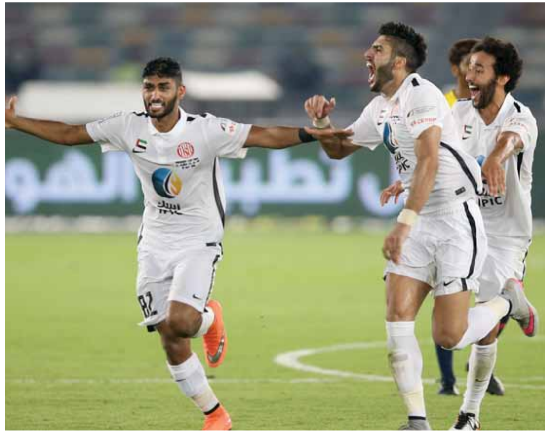
■ فرحة الجزيرة بالفوز والظفر بأغلى الكؤوس