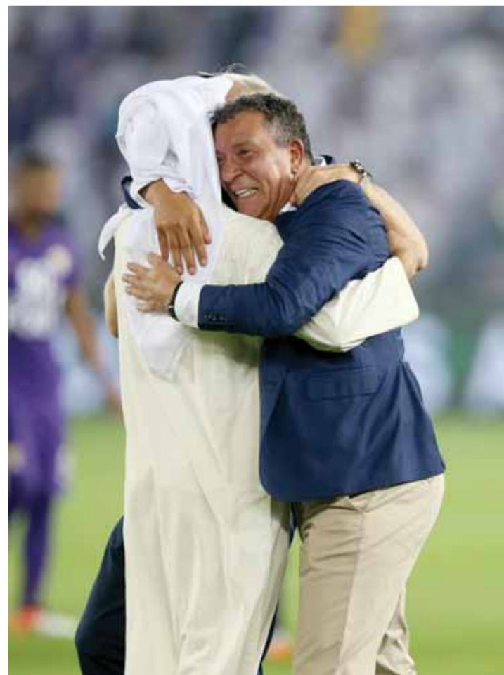
تين كات ودموع الفرح | البيان