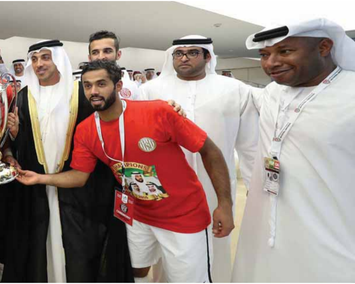
■ سموه يتوج الجزيرة بالكأس بحضور منصور بن زايد ومحمد بن حمدان بن زايد