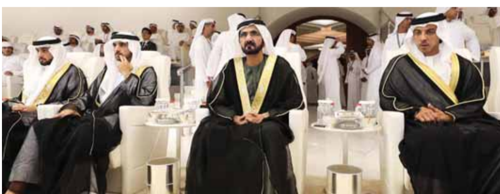
■ محمد بن راشد وحمدان بن محمد ومنصور بن زايد وأحمد بن محمد يتابعون النهائي

وتابع سموه: نفتخر في دولة الإمارات بقيادة الرشيدة وبشعب الإمارات، «شعب واحد كأس واحد»، والله يطول في أعمار شيوخنا لخدمة هذا البلد واستمرار التطور. وعن مجلس إدارة اتحاد كرة القدم الجديد، قال: الشباب لديهم دراية كاملة وطموح وقيادة شعب الإمارات أعتقد أن الإنجازات ستستمر وتتطور.