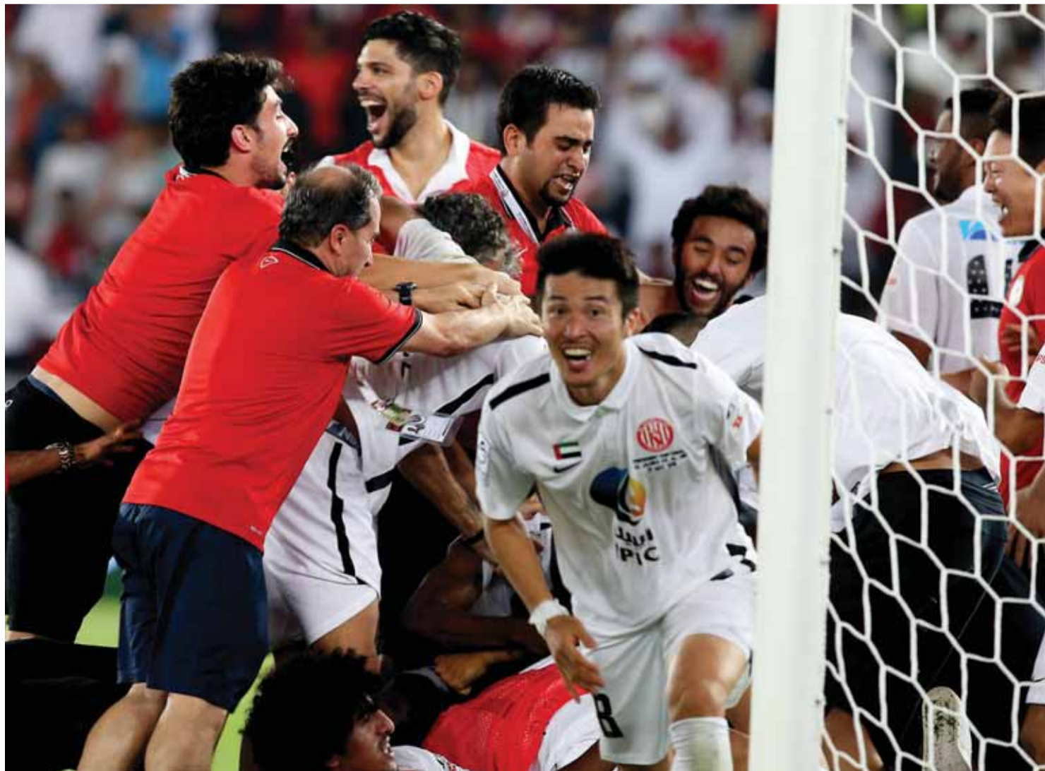
■ غونغ يحتفل بأول بطولة له مع الجزيرة

وأكد سهيل أن العين فريق قوي ومميز ولم يتأثر مستواه بخوضه مباريات قوية في البطولة الآسيوية وأخرها مواجهة ذوب آهن الإيراني وتمكن الزعيم من تخطيه بهدفين دون رد وتأهل، فالعين فريق كبير ولديه نوعية اللاعبين القادرين على تخطي الإرهاق وصنع الفارق، وفي المقابل كان الجزيرة عند الموعد، حيث يضم مجموعة من اللاعبين القادرين على التعامل مع أي منافس، وفي النهائي تساوت كفة الفريقين في فرص الفوز.