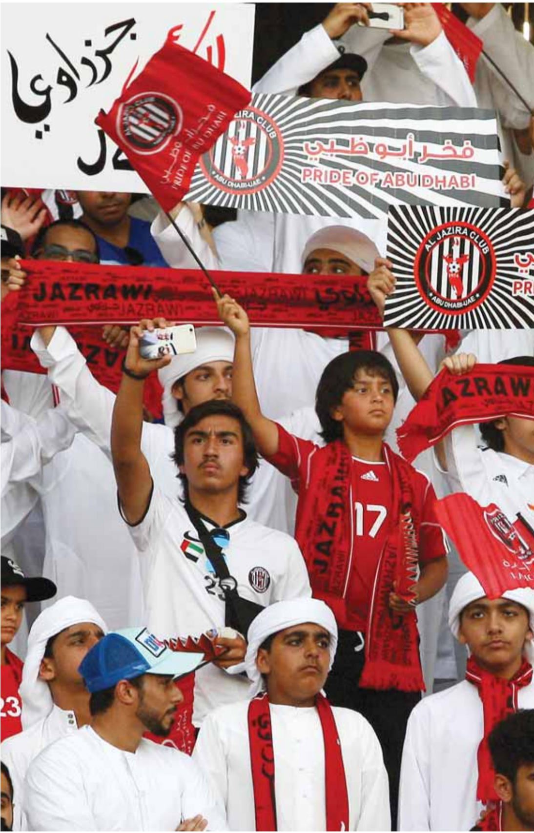
■ جماهير الجزيرة ساندت الفريق بقوة حتى النهاية