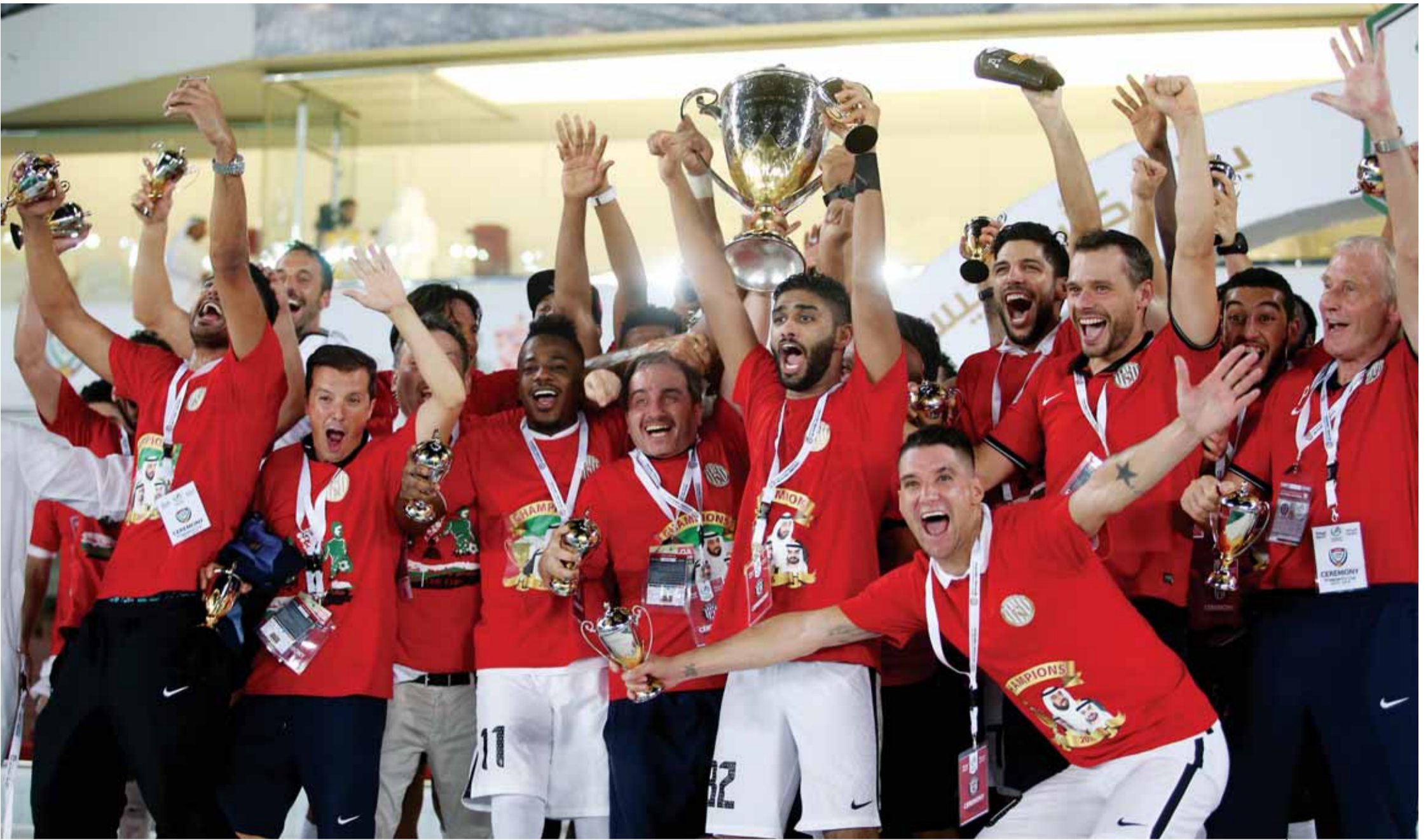
نجوم الجزيرة وفرحة أعلى الكؤوس | البيان

«من غير المنطقي القول باستبدال المدرب، وكل الأمور ستنتجح في اجتماع الأسبوع المقبل»، وأضاف: «الفريق كله قدم مردوداً طيباً وليس لاعباً بعينه، والجزيرة لا يعتمد على لاعب واحد، لكن علي مبخوت أفضل لاعب في الإمارات، ولا نستطيع الحديث عن احترامه في الخارج، إلا إذا جاء شيء رسمي، ولن نقف ضد مصلحة اللاعب، طالما أن العقد سيكون محترماً.»