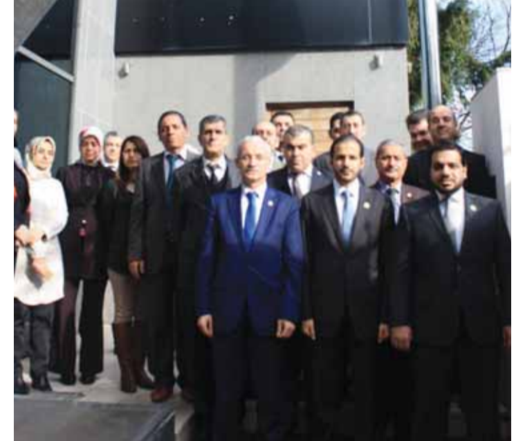
■ وسفارتنا في اسطنبول تحيي المناسبة

فريق الإغاثة، ومواطنو دولة الإمارات بالأردن.