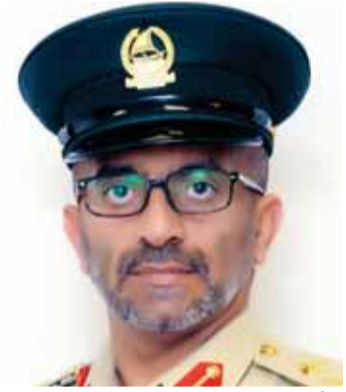
■ أحمد بن ثاني