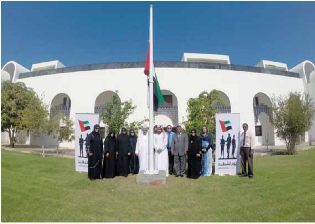
■ وفي سلطنة عمان