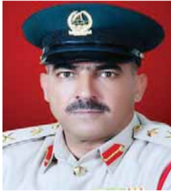
■ محمد بن فهد