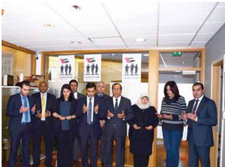
■ وسفارتنا في السويد

بتنكيس العلم الوطني اليوم عند الساعة الثامنة صباحاً بالتوقيت المحلي وذلك حاداً على أرواح شهداء الوطن من أفراد قواتنا المسلحة والذين استشهدوا في خدمة الوطن.