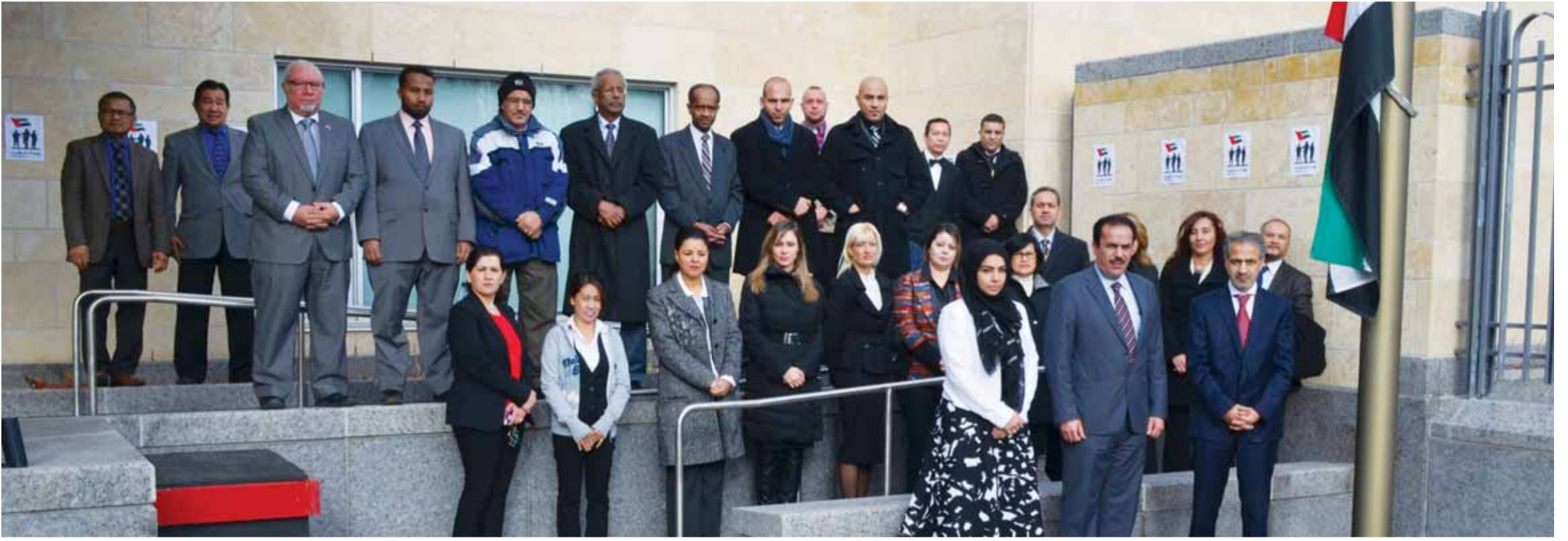
■ وخلال احتفال سفارتنا في كندا