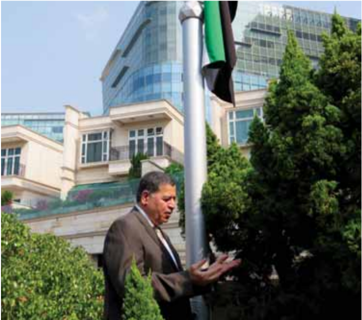
■ ولدى هونغ كونغ