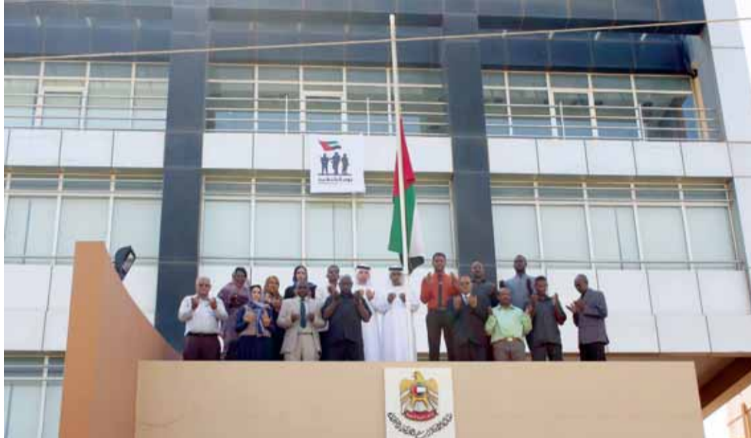
■ وفي الخرطوم

احتفلت سفارة دولة الإمارات في بلغراد بيوم الشهيد، حيث تم تكيس علم الدولة، تلتها وقفة صمت لمدة دقيقة واحدة، وقام بعد ذلك جمعة راشد سيف الظاهري، سفير الدولة لدى جمهورية صربيا، بمراسم رفع العلم مع عزف السلام الوطني لدولة الإمارات. وفي أرمينيا، تكيس الدكتور جاسم محمد القاسمي، سفير الدولة لدى أرمينيا، العلم في الساعة 08:00 صباحاً، ورفع العلم في الساعة 11:30 صباحاً.