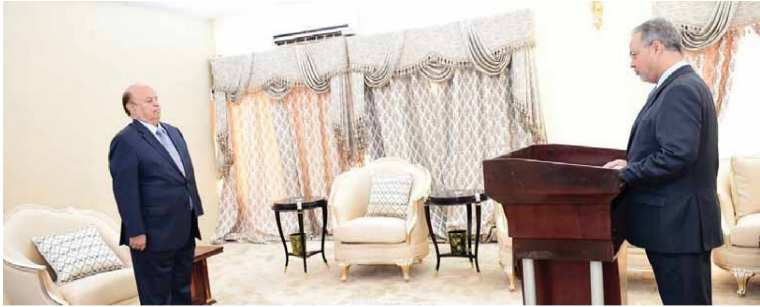
عبد الملك المخلافي مؤدياً اليمن الدستورية أمام هادي | سبأنت

كما أصدر هادي قراراً آخر بتعيين وزير الداخلية السابق اللواء عبده محمد