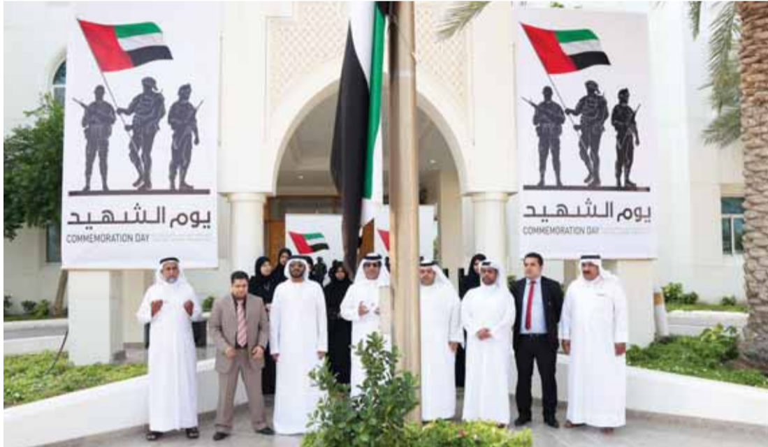
■ جانب من احتفالية سفارتنا في قطر