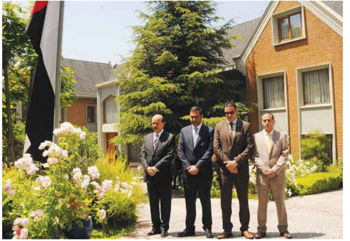
■ سفارة الدولة في تشيلي تحتفي بيوم الشهيد