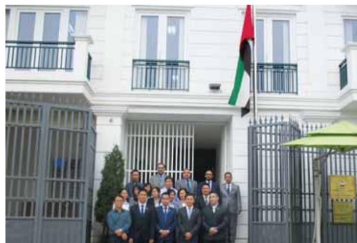
وفي سفارتنا لدى هانوي

وقامت سفارة الدولة في موسكو بإحياء مناسبة يوم الشهيد، وذلك بحضور أعضاء السفارة والملحقة العسكرية، وكذلك الطلاب المواطنين الدارسين في موسكو. وفي الأردن، أقامت سفارة دولة الإمارات في عمان فعالية يوم الشهيد، وذلك بمبنى السفارة، في مراسم حضرها بلال ربيع بلال البدور، سفير الدولة لدى المملكة الأردنية الهاشمية، وكادر السفارة الدبلوماسية وموظفوها، وأحمد جاسم عبيد السويدي، الملحق العسكري، وموظفو الملحقة العسكرية، وعدد من