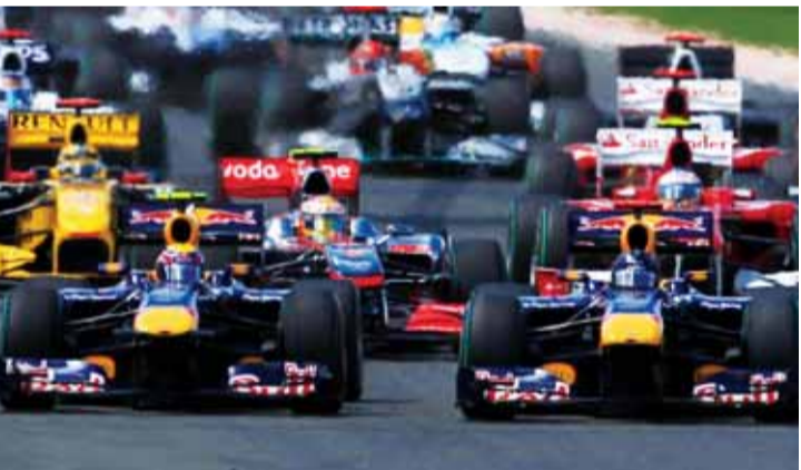
رد بل تراجع في المنافسة في ظل الإمكانيات العالية لمرسيدس | البيان