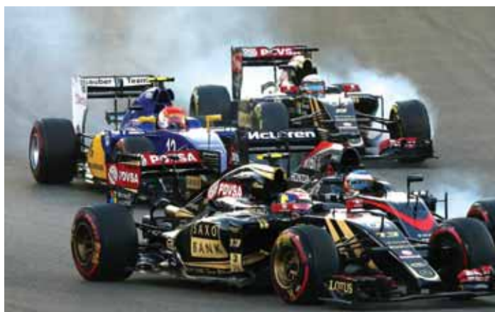
المنافسة الشديدة في المنعطف على الحلبة

والجهات المحلية مع الفورمولا 1 واستغلالها بأفضل صورة ممكنة، وهناك بعض المخططات التي نسعى لتحقيقها في الحدث الموسم القادم والتي سنعلن عنها في الوقت المناسب بعد الانتهاء من التفاصيل كافة. وشدد العامري على أن حلبة مرسى ياس استطاعت أن تخلق لنفسها مكانة مختلفة عن باقي الحلبات في روزنامة الفورمولا 1 خصوصاً في ظل العلاقة القوية التي تربط بينهم وبين الاتحاد الدولي للسيارات ومالكي الحقوق الحصرية للفورمولا 1، قائلاً: «نحن كشركاء لهم لا نتدخل في السياسيات ولكن نعطي رأينا إذا طلب منا ذلك،