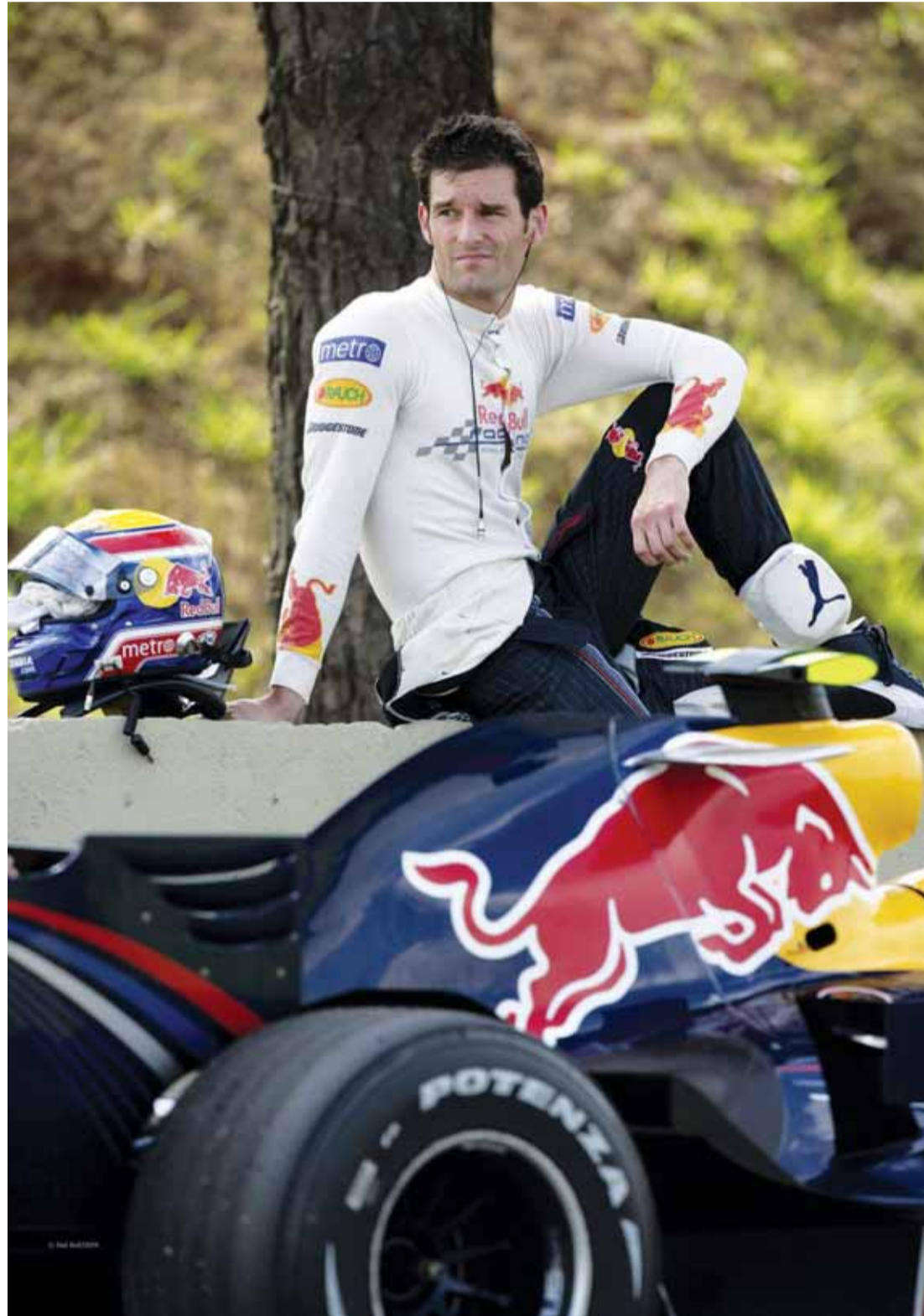
ويبر صاحب صولات وجولات مع رد بل | البيان