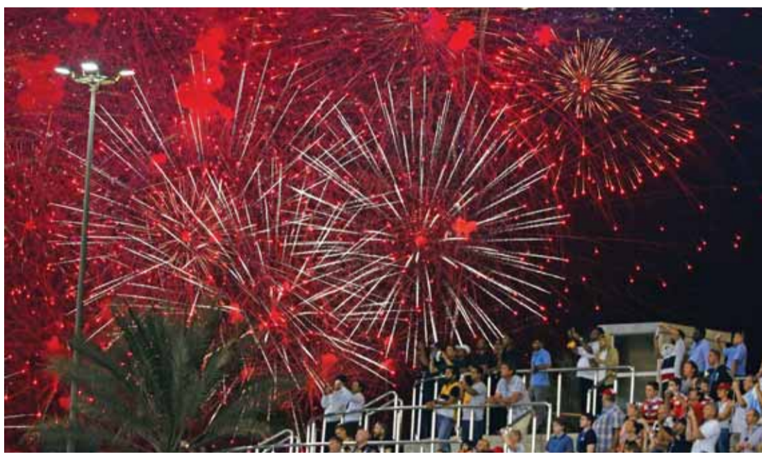
الالعاب النارية صاحبت الاحتفال بختام الجولة | البيان

واهتمامها الكبير بتنمية الرياضة لتعزيز أوجه التعارف والتلاقي بين شعوب العالم. وهنأ سموه سائق مرسيدس الألماني نيكو روزبرغ بطل جائزة الاتحاد للطيران الكبرى للفورمولا 1 لفوزه بجولة أبو ظبي، مشيداً سموه بالتنافس الحضاري من جانب سائقي الفرق الأخرى، ومعبراً سموه عن سعاده برؤية المشهد الجماهيري الغفير الذي رسمته مدرجات حلبة ياس في أجواء