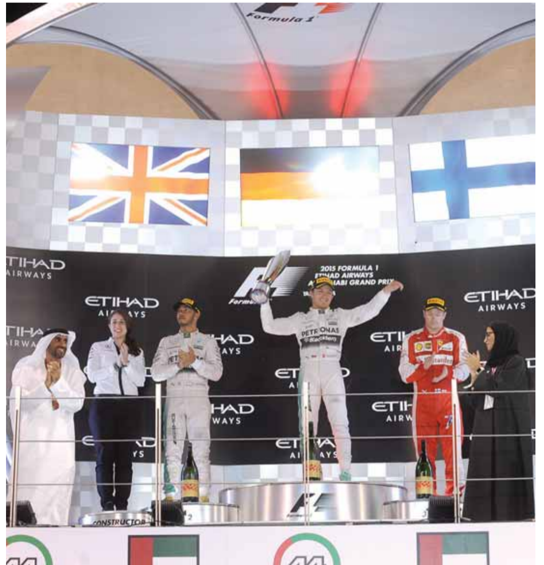
نهيان بن زايد خلال تتويجه لروزبرغ بطل جولة ياس