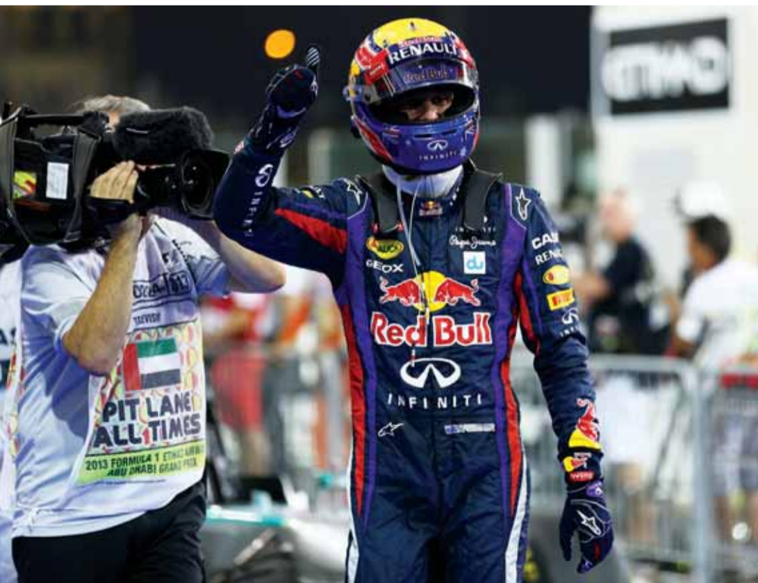
ويبر خلال دخوله حلبة ياس في آخر سباقاته قبل الاعتزال

بالقيادة على حلبة مرسى ياس لمدة 4 سنوات قبل اعتزالي الفورمولا 1، ولا يمكن أن أنسى عام 2010، الذي كنت أصارع فيه على لقب بطولة العالم، وكنت قريباً للغاية من تحقيقه، وتبقى فقط السباق الأخير في حلبة مرسى ياس، ولكني للأسف لم أوفق في هذا اليوم، وفاز فيتيل بالبطولة، وكذلك عام 2012، الذي انسحبت فيه من السباق، الذي كان مخيباً بالنسبة لي، إلا أن الذكريات الجيدة كثيرة، ومنها أنني استطعت اعتلاء منصة التتويج على حلبة مرسى ياس، عندما أحرزت المركز الثاني في جائزة الاتحاد للطيران الكبرى عامي 2009 و2013، وانطلاقي من المركز الأول في عام 2013.