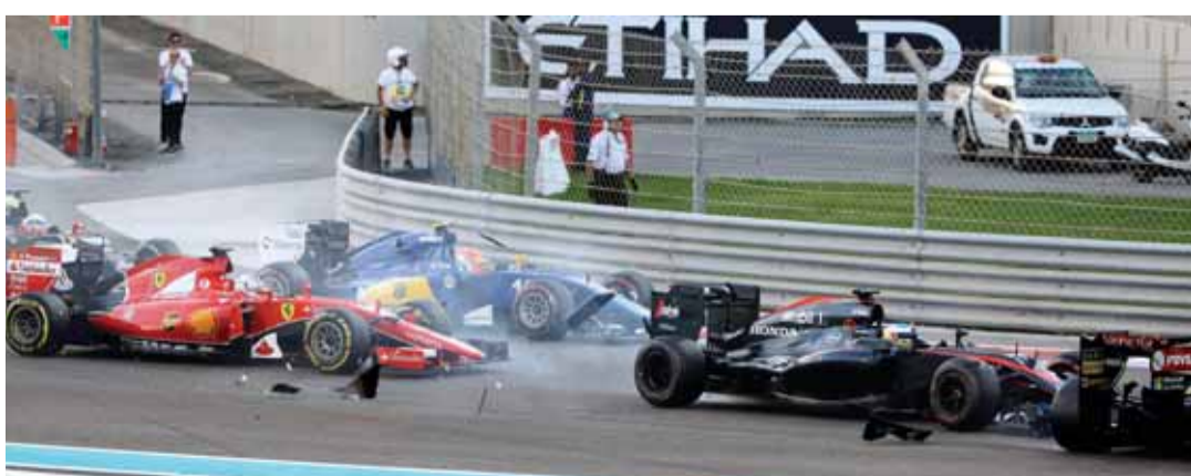
حادث جسيم يتسبب في إلغاء «جي بي 2»

انطلاقة السباق مباشرة، مما أدى إلى حدوث تصادم قوي مع سيارة مواطنه نورمان ناتو من فريق اردن انترناشيونال والذي حاول تفادي الحادث إلا أنه لم يتمكن من ذلك، لتصطمم بعد ذلك سيارته بجانب سيارة غاسلي، وتواصل الاصطدام بين أكثر من سيارة عندما اتسع الحادث ليشمل كلا من نيكولاس لاتيفي، دانيال دي جونغ، وشان غلايل، حيث اصطدم السائقون الأربعة بالحوادث وترفع الأعلام الحمراء على الفور داخل مضمار الحلبة. وعلى الفور نزل مدير سباقات الفورمولا 1 تشارلي وايتينغ إلى أرض حلبة مرسى ياس لبدء عملية إصلاح