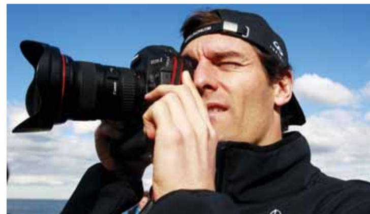
التصوير إحدى هواياته خارج الحلبة

وعن رؤيته لسباقات الفورمولا 1 في المواسم الأخيرة، خاصة في ظل التغييرات الدائمة التي يقرها الاتحاد الدولي للسيارات، قال: «أعتقد أن السيطرة الواضحة لفريق واحد أو سائق