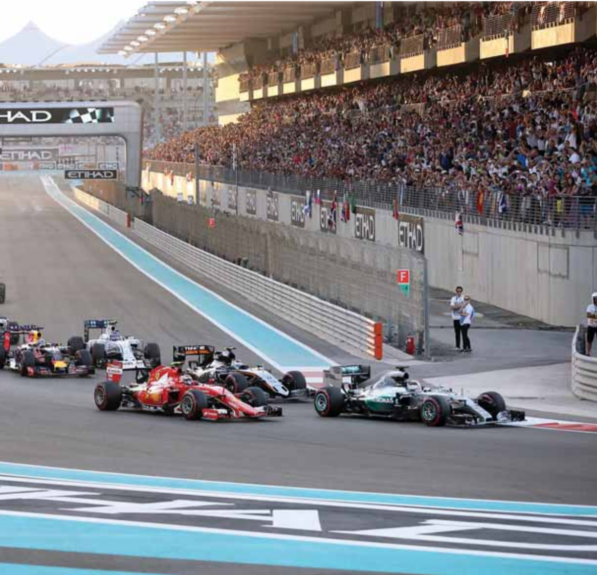
المنافسة على حلبة ياس خلال السباق وسط إقبال جماهيري كبير | البيان