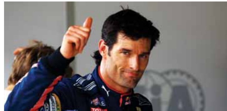
السائق الأسترالي تعرض لحادث ونجا منه بإعجوبة | البيان