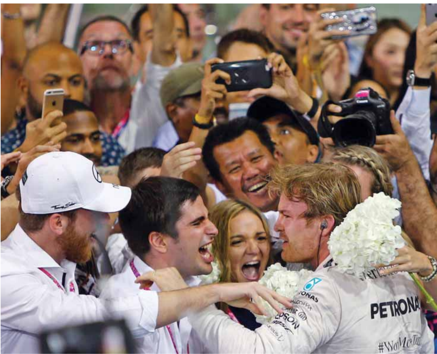
فرحة جنوية لطل جولة أبو ظبي الختامية | ف ب