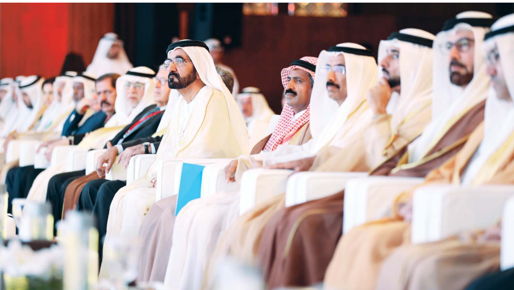
محمد بن راشد يتوسط الحاضرين بالجلسة الافتتاحية بحضور حمدان بن محمد والمر ومحمد القرقاوي وحسين الحمادي وأعضاء مجلس أمناء الجائزة