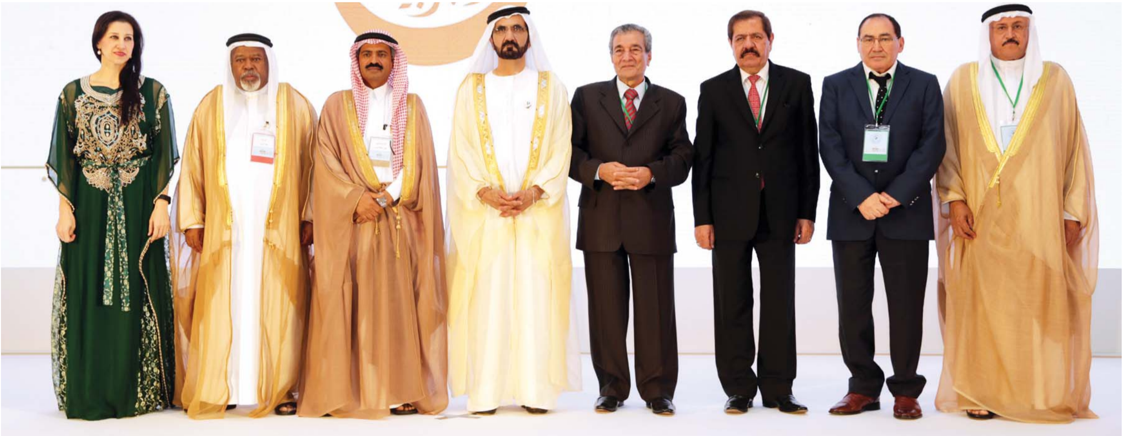
محمد بن راشد بنوسط فاروق شوشة وبلال البدور وخالد كركي وعلي بن موسى وعبيد المهيري وعبد القادر الفاسي وهنادا طه

بمناخ أرفع تقدير جهود العاملين في ميدان اللغة العربية أفراداً ومؤسسات وتدرج في سياق المبادرات التي أطلقها صاحب السمو الشيخ محمد بن راشد آل مكتوم نائب رئيس الدولة رئيس مجلس الوزراء حاكم دبي، للهوض باللغة العربية ونشرها واستخدامها في الحياة العامة وتسهيل تعلمها وتعليمها إضافة إلى تعزيز مكانة اللغة العربية وتشجيع القائمين على نهضتها.