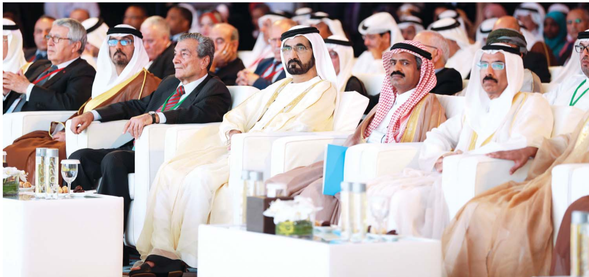
محمد بن راشد والمر والحمادي وشوثة والمسؤولون خلال احدى الجلسات

ونوه في ختام كلمته إلى أن معجم محمد بن راشد سيأتي بعد أكثر من ستين عاماً من وضع آخر معجمين عربيين لهذا التأكد أهميته بالنسبة لمواكبة اللغة لمتطلبات ومتغيرات العصر خاصة في قطاع المعلوماتية.