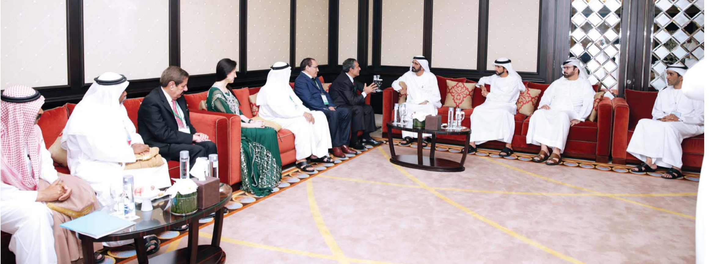
محمد بن راشد وحمدان بن محمد بحضور القرقاوي خلال اللقاء مع فاروق شوشة وبلال البدر وخالد كركي وعلي بن موسى وعبيد المهيري وعبد القادر الفاسي وهنادا طه