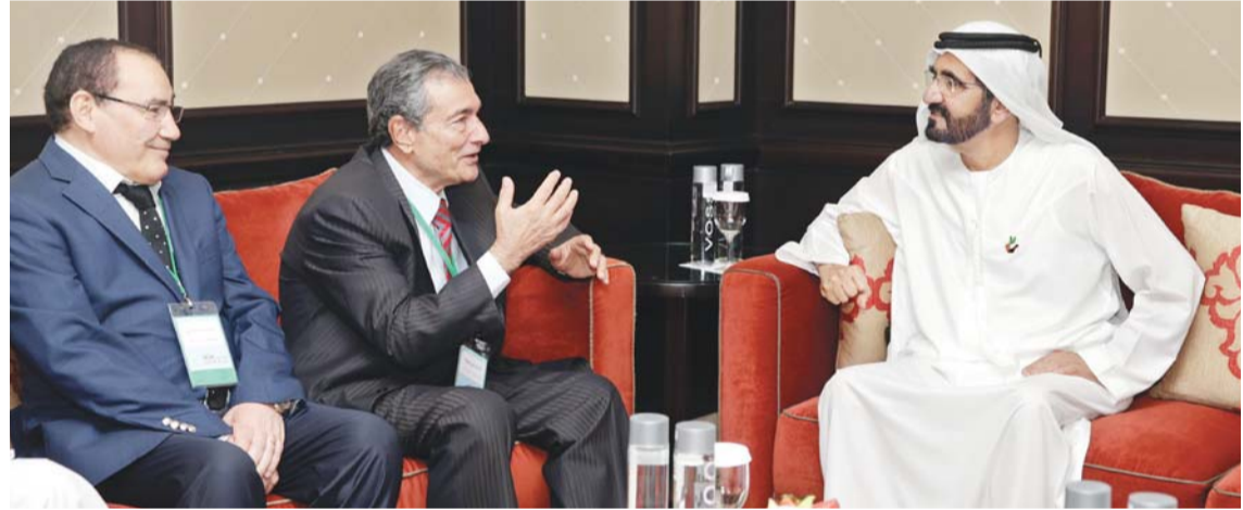
.. وسموه في حديث مع فاروق شوشة

دبي - وام التقى صاحب السمو الشيخ محمد بن راشد آل مكتوم نائب رئيس الدولة رئيس مجلس الوزراء حاكم دبي معالي محمد بن عبدالله القرقاوي وزير شؤون مجلس الوزراء ومعالي عبدالرحمن بن محمد العويس وزير الصحة رئيس مجلس إدارة هيئة دبي للثقافة والفنون وخليفة سعيد سليمان مدير عام دائرة التشريعات والضيافة في دبي - رئيس وأعضاء مجلس أمناء الجائزة محمد بن راشد آل مكتوم للغة العربية وتجاذب معهم أطراف الحديث حول شؤون