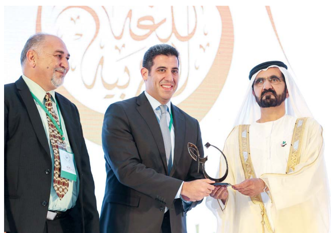
وسموه خلال التكريم

وأكد الدكتور شوثة على أهمية هذا المعجم بالنسبة للطلاب والدارسين والمدرسين والباحثين ولكل المهتمين باللغة العربية خاصة المستشرقين والمستعربين.