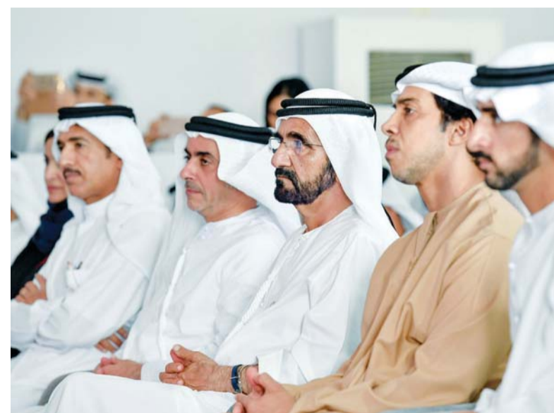
■ محمد بن راشد وحمدان بن محمد وسيف ومنصور بن زايد وأحمد الزعابي

وساهم في خلوة الخير، وخطوتنا التالية واستراتيجية طويلة الأمد لمأسسة الخير، ولن يقف الخير بوجود رجال يحبون الخير لمجتمعهم». حضر خلوة الخير سمو الشيخ حمدان بن محمد بن راشد آل مكتوم ولي عهد دبي، ومعالى أمل عبدالله القبسي رئيس المجلس الوطني الاتحادي، والفريق سمو الشيخ سيف بن زايد آل نهيان نائب رئيس مجلس الوزراء وزير الداخلية، وسمو الشيخ منصور بن زايد آل نهيان نائب رئيس مجلس الوزراء وزير شؤون الرئاسة، ومعالى محمد عبدالله القرقاوي رئيس اللجنة الوطنية العليا لعام الخير، وعدد من الوزراء والمسؤولين.