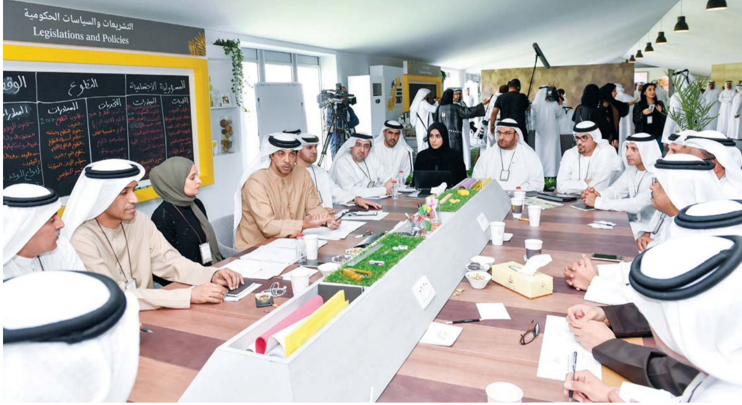
■ منصور بن زايد خلال المناقشات بحضور عهد الرومي وعبدالله الشيباني

عهود الرومي: قياس مؤشرات الأداء بصورة أكثر دقة للتقييم والتطوير