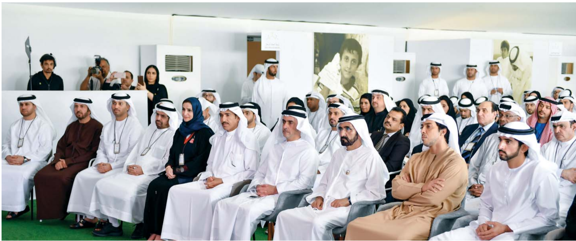
محمد بن راشد وحمدان بن محمد وسيف ومنصور بن زايد ووزراء ورواد أعمال وخبراء خلال الخلوة