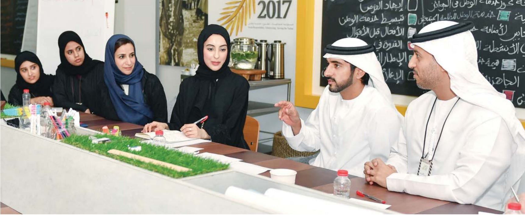
حمدان بن محمد متحدثاً في مسار خدمة الوطن بحضور أحمد الفلاسي وجميلة المهيري وشما المزروعى