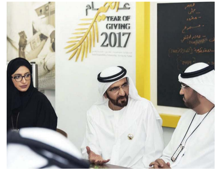
محمد بن راشد متحدثاً إلى سلطان الجابر

حظي بتفاعل غير مسبوق، حيث شهدت الخلوة تفاعلاً كبيراً من الناس على وسائل التواصل الاجتماعي، مع استجابة عدد كبير لدعوة سموه من خلال حوارات ونقاشات تفاعلية شهدت طرح العديد من الأفكار والمقترحات لتفعيل برامج عام الخير. وتم تشكيل فريق عمل لرصد هذه الأفكار وجمعها وفرزها وضعاها إلى سلسلة الأفكار