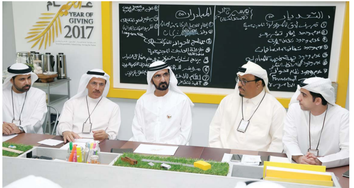
محمد بن راشد خلال خلوة الخير بحضور سلطان المنصوري وضاحي خلفان