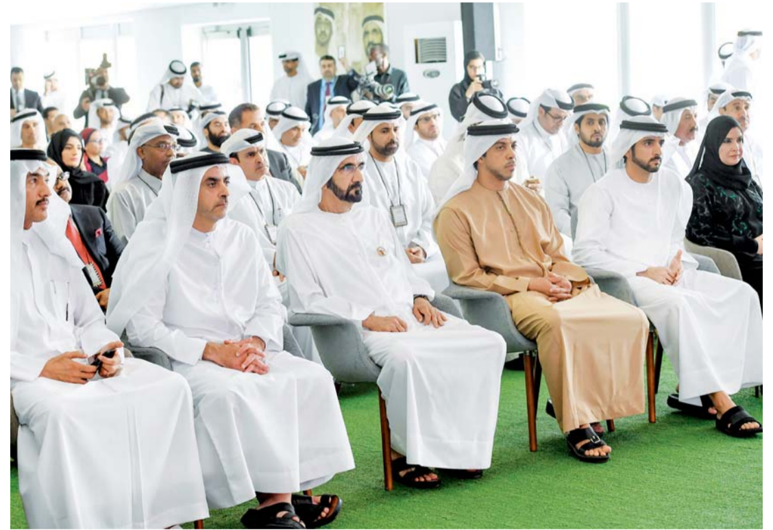
نائب رئيس الدولة وحمدان بن محمد وأمل القبيسي وسيف ومنصور بن زايد وأحمد الزعابي

حول المسؤولية الاجتماعية للشركات والشراكات بين الحكومة والقطاع الخاص برئاسة معالي سلطان بن سعيد المنصوري وزير الاقتصاد، والتطوع برئاسة معالي نجله بنت محمد العور وزيرة تنمية المجتمع، وتطوير الدور التنموي للمؤسسات الإنسانية، والإعلام برئاسة معالي الدكتور سلطان بن أحمد سلطان الجابر وزير دولة ورئيس مجلس إدارة المجلس الوطني للإعلام، وتطوير المنظومة التشريعية والسياسات الحكومية ذات الصلة بأهداف عام الخير برئاسة معالي جهود بنت خلفان الرومي وزيرة دولة لشؤون الشباب.