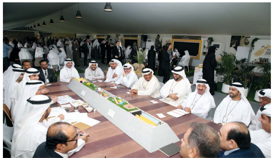
سلطان المنصوري يترأس الجلسة بحضور ضاحي خلفان وسامي القمزي