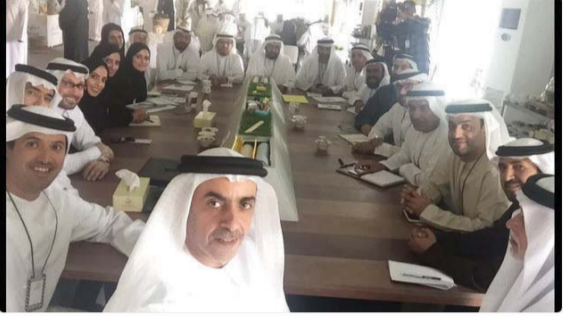
سيف بن زايد خلال الجلسة بحضور هلال المري وإبراهيم بوملحه وناصر النعيمي

سيف بن زايد آل نهيان SelfBZayed @T 2017 أكثر من 100 مسؤول حكومي وصناع القرار في القطاعين العام والخاص ورموز الخير والعمل الإنساني والتنموي بهدف المشاركة بالأفكار والآراء والمبادرات