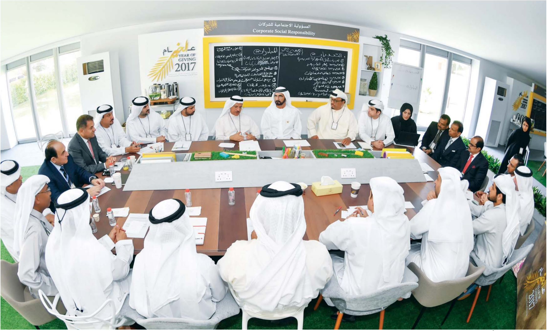
محمد بن راشد مستمعاً إلى الأفكار والمقترحات بحضور سلطان المنصوري ووضحي خلفان