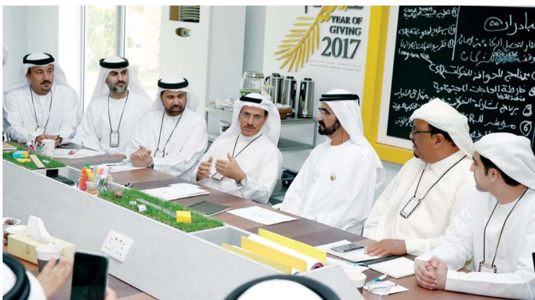
■ سموه مستمعاً إلى سلطان المنصوري بحضور ضاحي خلفان

ونوه سموه بأن «خلوة الخير تعد أكبر تجمع وطني لبناء استراتيجية طويلة الأمد لمأسسة عمل الخير، وما شهدته الخلوة من نقاشات يثبت أن دولتنا ستكون بمنزلة الله وبفضل همة أبنائها المخلصين متارة للعمل الإنساني الذي يبني الإنسان والوطن». وقال سموه: «نسعى لوضع منظومة تشريعية متكاملة للمسؤولية الاجتماعية، بحيث تمارس الشركات دورها التنموي بفاعلية أكبر ضمن أطر قانونية واضحة»، مؤكداً سموه: «كما نسعى إلى تقديم حوافز دائمة للمتطوعين، ولوضع أطر