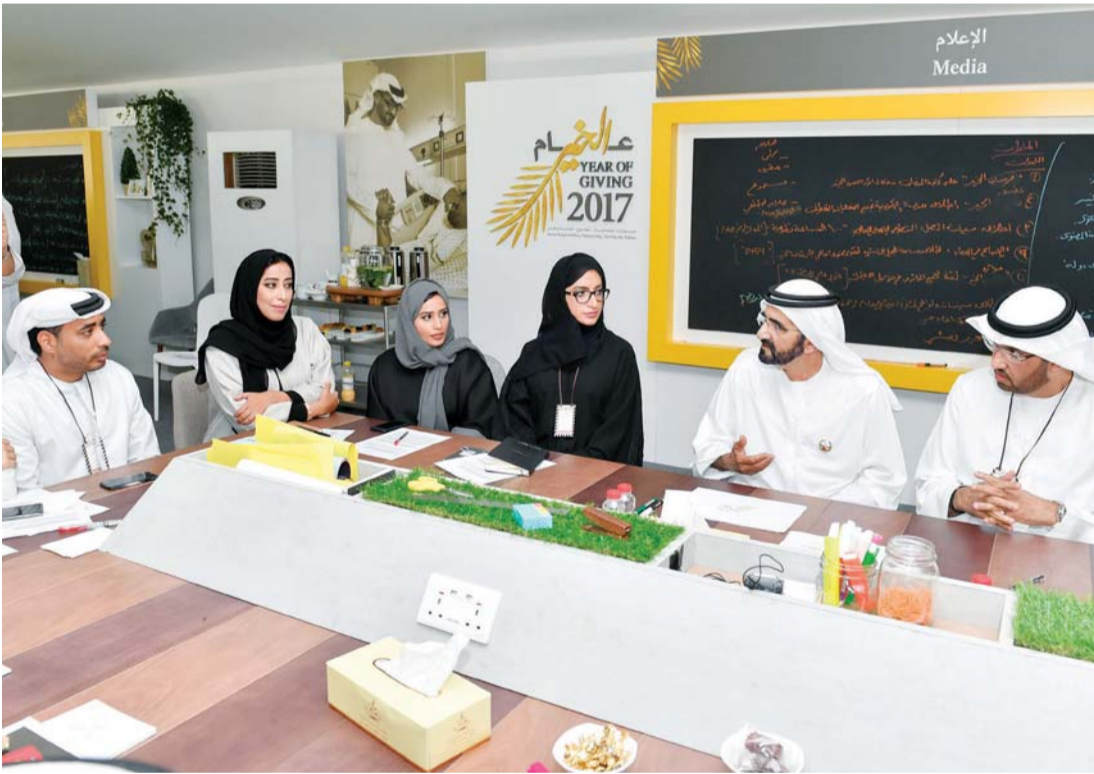
محمد بن راشد في حديث إلى الإعلاميين بحضور سلطان الجابر ومنى المري وسامي الريامي