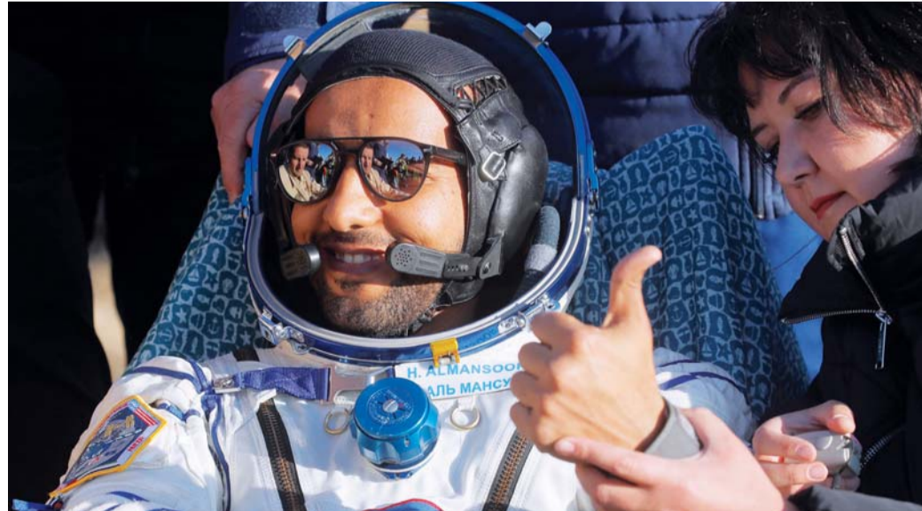
■ لحظة وصول هزاع المنصوري إلى الأرض

وقال الرئيس: «فيما يخص اختيار رائد فضاء إماراتي آخر خلال الفترة المقبلة، فإن ذلك سيتم بناءً على نوعية المهمة العلمية التي نريد أن نقوم بها، ومدّة المهمة التي من المفترض أن تكون، وانطلاقاً من ذلك فإننا نسعى بشكل حثيث في مركز محمد بن راشد للفضاء لاختيار الشخص المناسب للقيام بما هو مطلوب منه مستقبلاً، لافتاً في الوقت ذاته إلى أن رائد الفضاء الإماراتي سلطان النيادي على نفس درجة الاستعداد والكفاءة