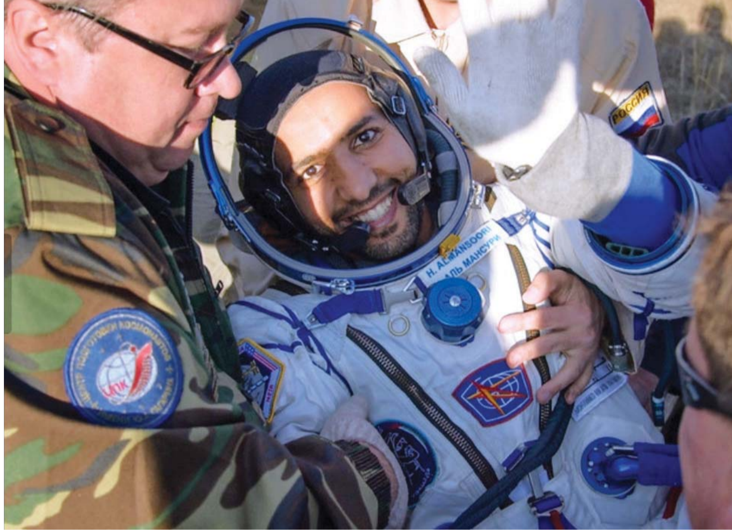
هزاع المنصوري لحظة وصوله إلى الأرض قادماً من محطة الفضاء الدولية

قال فاروق الباز، عالم الفضاء في وكالة ناسا، إن نجاح مهمة رائد الفضاء هزاع المنصوري وعودته بنجاح، جعل الإمارات تقف بمساواة الدول الكبرى التي لها جهود كبيرة في قطاع الفضاء، مبيناً أن شعوراً كبيراً بالفخر يتملكه بعد هذا الإنجاز الكبير، وأن «أولاد زايد علوها، وبنات زايد هيجملوها». وأضاف أنه يحق لشعب الإمارات أن يفخر بما حققه أبناء هذا الوطن والدعم الكبير الذي يقدمه القادة لإنجاح هذه الخطى الاستشرافية للمستقبل، فضلاً عن فريق عمل مركز محمد بن راشد للفضاء، الذي أنجز هذه المهمة التاريخية «طموح زايد»، مؤكداً أن ما قدمه الجميع يثبت أن الشباب العربي ما زال يخبر وأنه قادر على العطاء من جهة أخرى ذكر الباز أن مهمة المركبة الفضائية «سويوز MS-19»