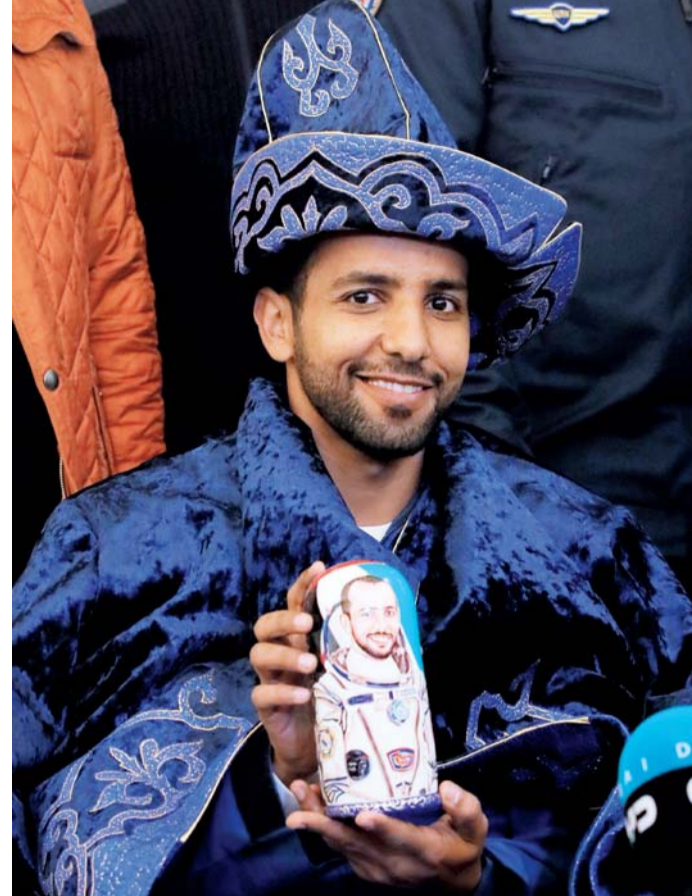
■ هزاع المنصوري باللباس الكازاخي التقليدي خلال المؤتمر الصحفي

أوضح رائد الفضاء الإماراتي هزاع المنصوري في تصريحات أدلى بها خلال المؤتمر الصحفي، الذي عقد أمس، لأعضاء طاقم المركبة الفضائية «سويوز 12-MS» في مطار كارغنده، أنه يشعر