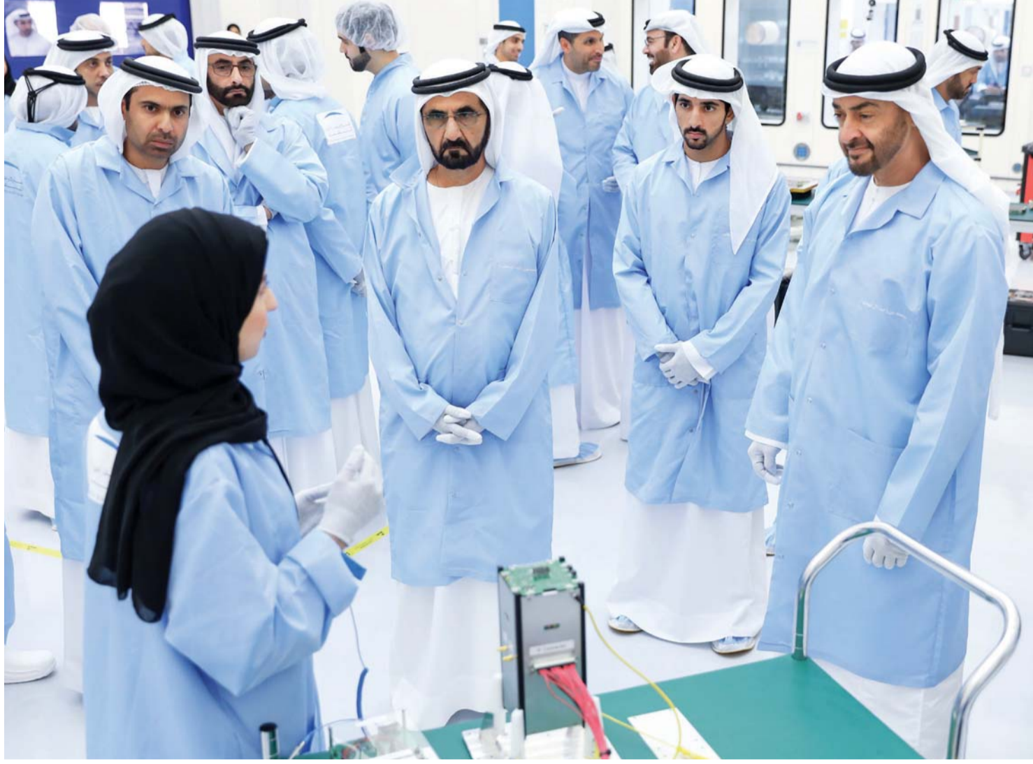
■ القيادة الرشيدة دعمت قطاع الفضاء للوصول إلى الريادة في المستقبل | أرشيفية