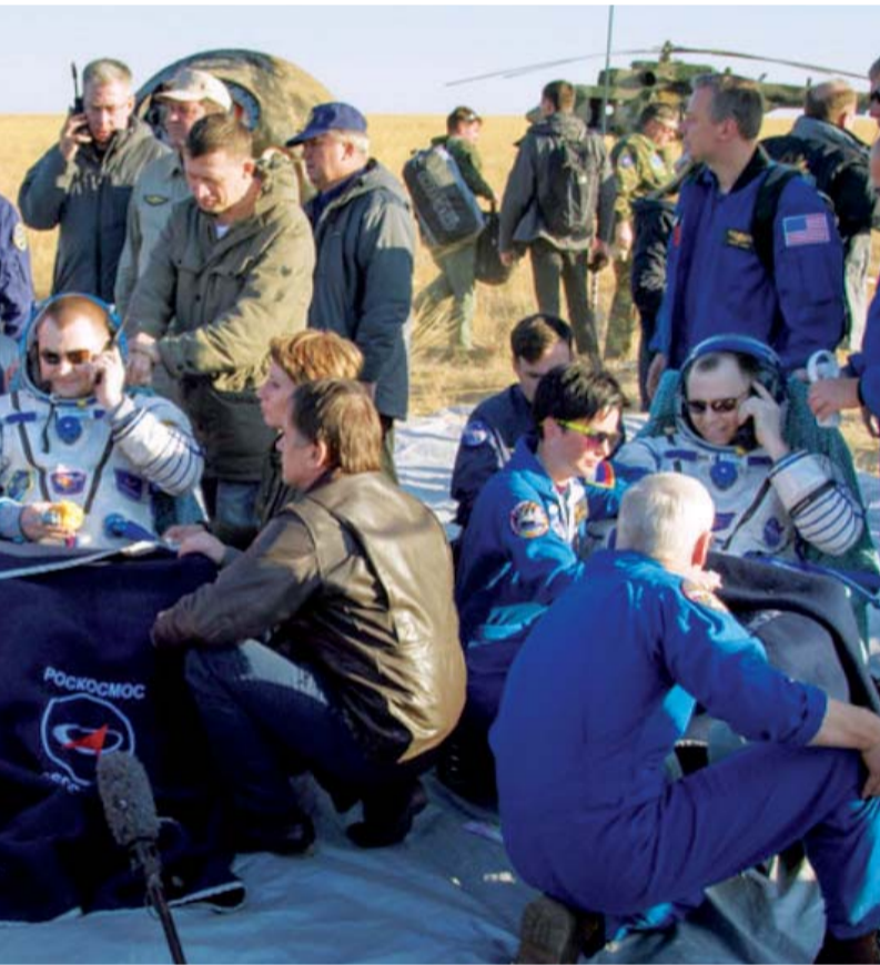
■ فريق دولي خلال استقبال هزاع المنصوري ورائدي الفضاء فور عودتهم

نجاح هذه المهمة التاريخية «طموح زايد». وأضاف أن هناك فترة زمنية تتراوح بين 3 و4 شهور، سيتم خلالها إجراء المقارنات على نتائج التجارب التي أجراها المنصوري خلال وجوده على متن محطة الفضاء الدولية، فيما سيكون هناك دراسات مكثفة، وصولاً لإصدار وإعلان النتائج النهائية التي ستفيد التساؤلات العلمية التي كنا نسعى للإجابة وتضيف للمجتمع العلمي الكثير، وتجيّب عن عنها، من خلال هذه المهمة الطموحة. ولفت المري إلى أنه لا يستبعد انطلاق أول إماراتية إلى الفضاء مستقبلاً.