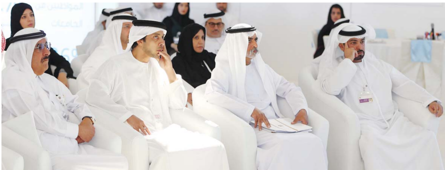
حمدان بن راشد ومنصور بن زايد ونهيان وحمدان بن مبارك