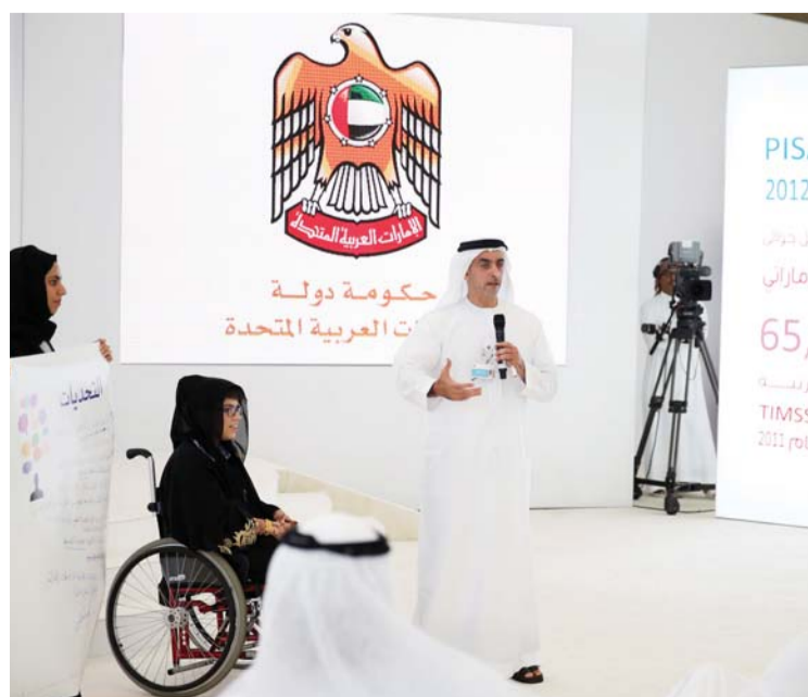
سيف بن زايد يقدم عرضاً عن ذوي الاحتياجات الخاصة