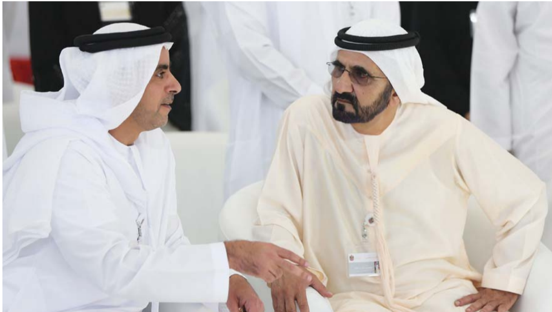
محمد بن راشد وسيف بن زايد