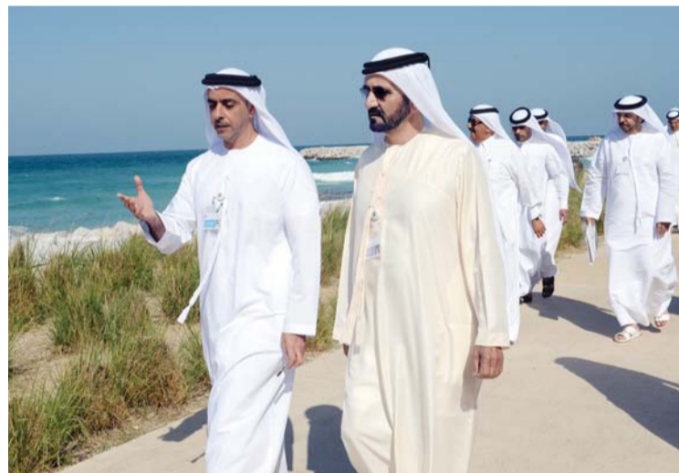
محمد بن راشد وحمدان بن راشد وسيف بن زايد