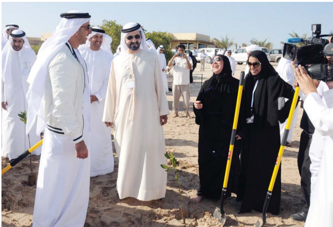
تصوير - سيف محمد - خليفة اليوسف - محمد هشام