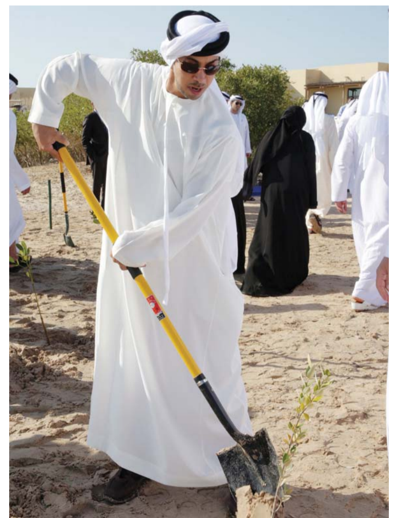
منصور بن زايد يزرع شجرة

وتفوقهم في العديد من المجالات. وأعرب سموه عن اعتزازه بالأجواء التشاورية والحوارية التي شهدتها الخولة الوزارية بوجه عام، وبما تنم عن أفكار تطويرية وابتكارية جديدة، تصب في خدمة الوطن وتنتج من إحدى أجمل البينات المحلية الطبيعية في الدولة، أبوظبي. البيان