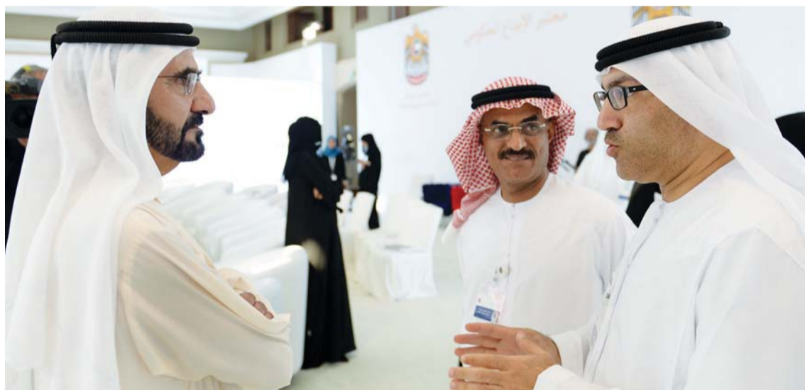
محمد بن راشد يستمع إلى عبدالرحمن العويس بحضور عبدالله النعيمي