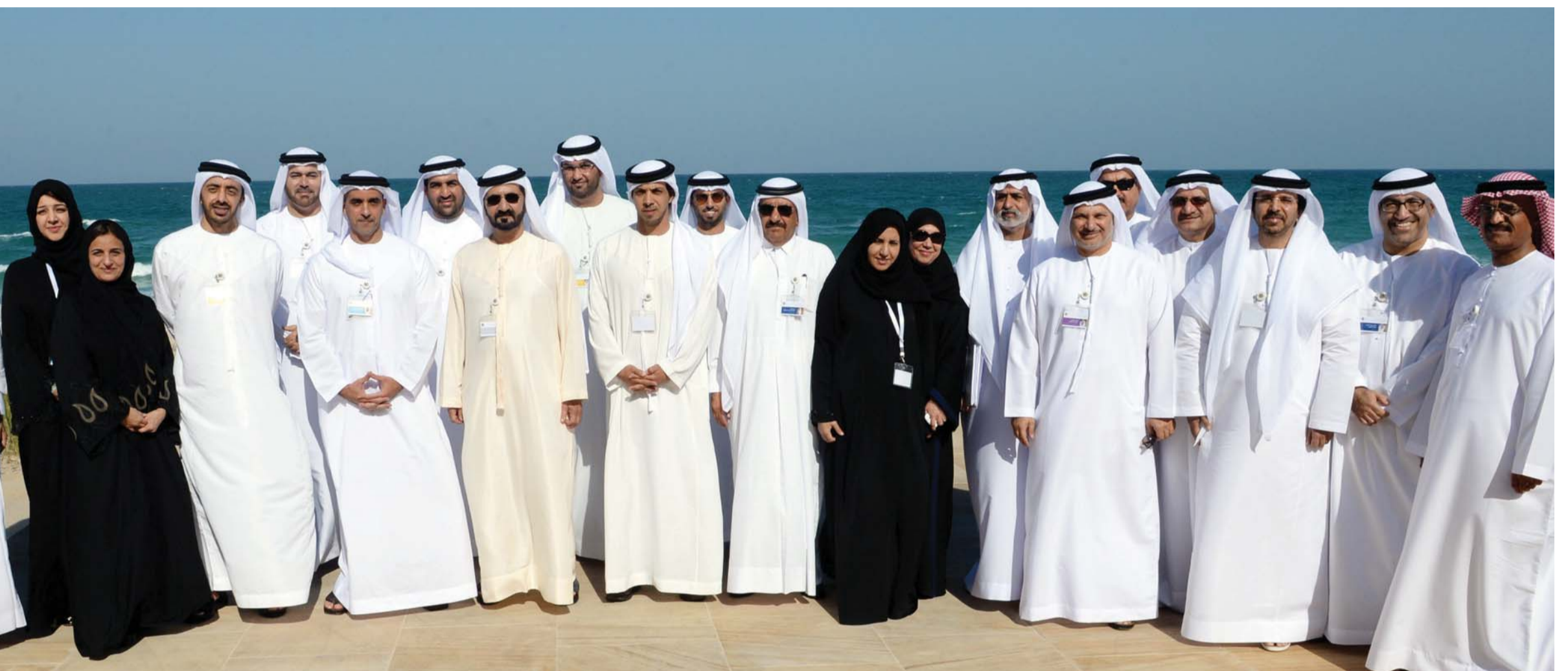
محمد بن راشد يتوسط أعضاء مجلس الوزراء خلال خلوتهم في صير بني ياس