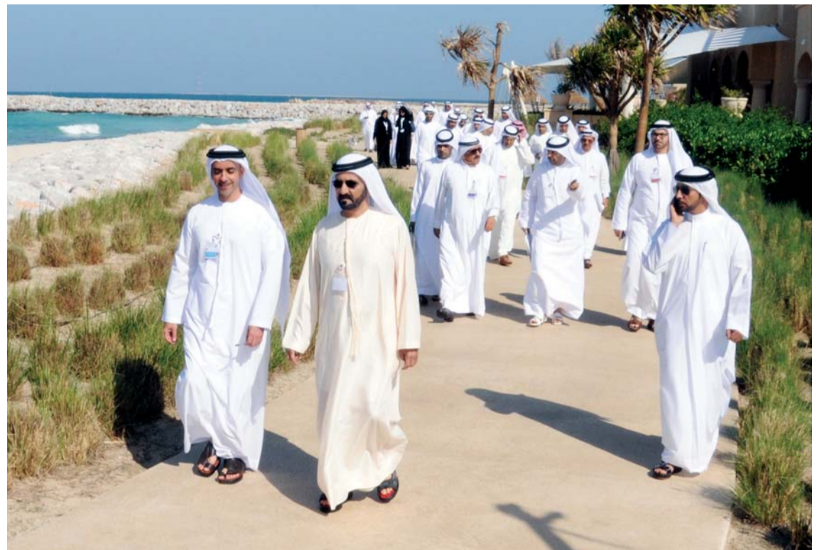
محمد بن راشد في طريقه لغرس أول شجرة قرم «المانجروف الأحمر» برفقة حمدان بن راشد وسيف بن زايد والوزراء