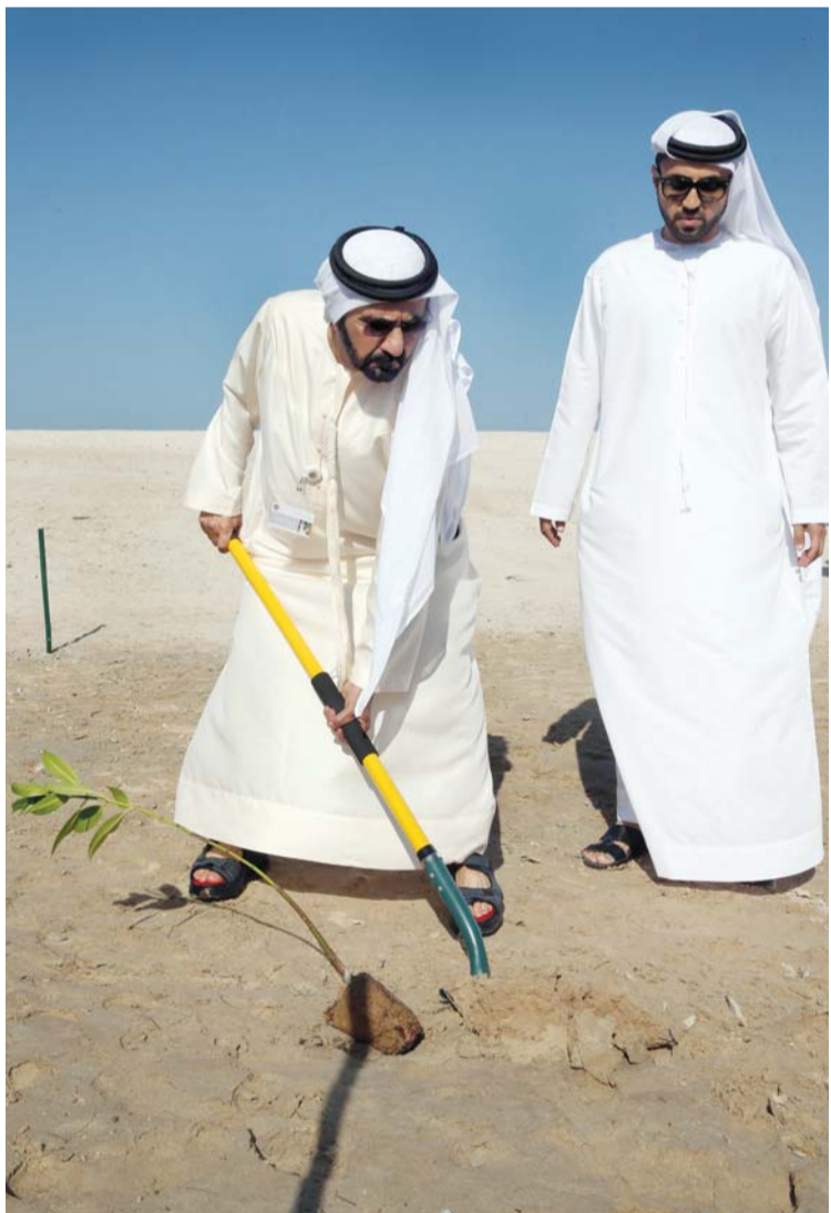
نائب رئيس الدولة يزرع شجرة قرم «المانجروف الأحمر»