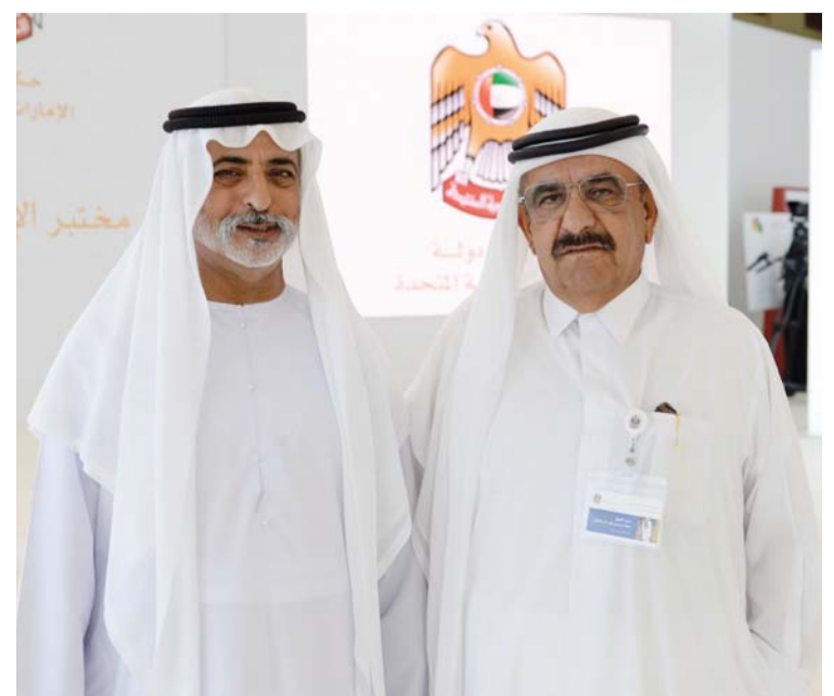
حمدان بن راشد ونهيان بن مبارك