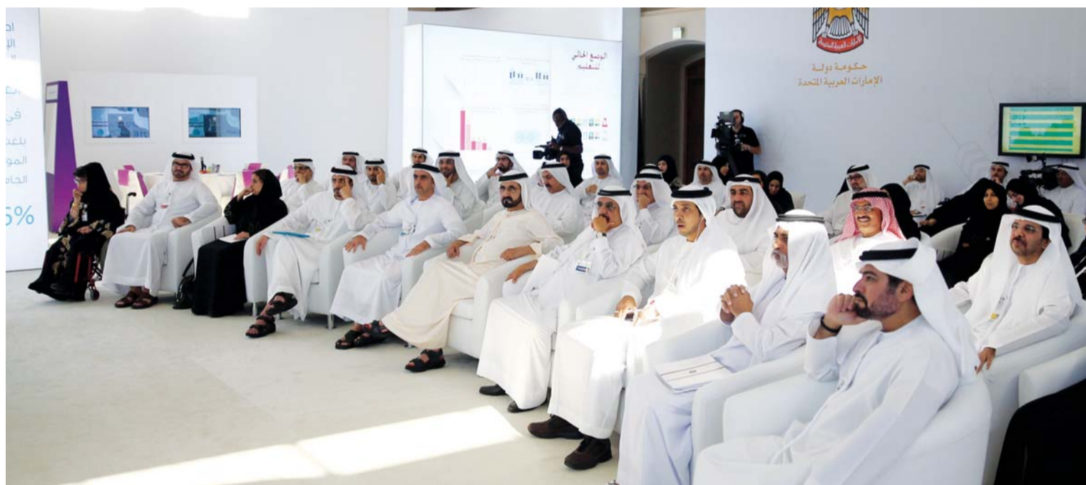
نائب رئيس الدولة يشهد جانباً من عروض تطوير التعليم بحضور حمدان بن راشد وسيف ومنصور بن زايد والوزراء

الوزارية وتلك اللقطة الأيوبية الرائعة لصاحب السمو الشيخ محمد بن راشد آل مكتوم مع التلميذة شما، بينما كان سموه مبعث الطاقة الايجابية والمحركة في ورش الخطوة عبر مشاركته فيها. وبحث الخطوة الوزارية الاستثنائية أمس تطوير قطاع التعليم في الدولة، بينما تتواصل اليوم لندارس سبل تطوير قطاع الصحة عبر تمحيص أكثر من 65 ألف فكرة وردت من خلال العصف الذهني الإماراتي لتطوير القطاعين. يذكر أن الكثير من الخدمات الاخبارية في الدولة اعتمدت على التغطية المباشرة للمكتب الاعلامي لحكومة دبي في بث وقائعها أولاً بأول، ولا سيما أن الآلاف من أبناء الميدان التربوي تابعوها لما لها من أهمية كبرى لدى هذا الميدان. وكان المكتب الاعلامي خاض ذات التجربة بنجاح ابان التغطية الحية والمباشرة لوقائع فوز الامارات باستضافة معرض اكسبو العالمي 2020 في دبي.