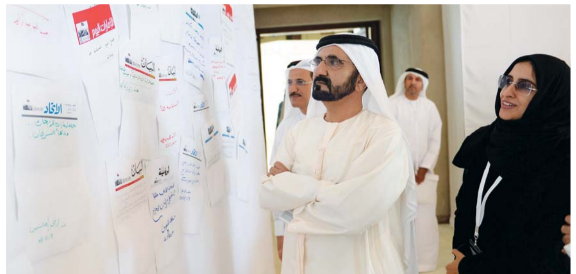
محمد بن راشد يتابع بعض ما كتبه الصحف الإماراتية

معايير أرقى وأقوى لتوظيفهم. وأشار سموه إلى توجهات صاحب السمو الشيخ محمد بن راشد آل مكتوم للتوطين في قطاع التعليم، على اعتبار أن المواطن هو الأساس في تطوير قطاع التعليم في الدولة.