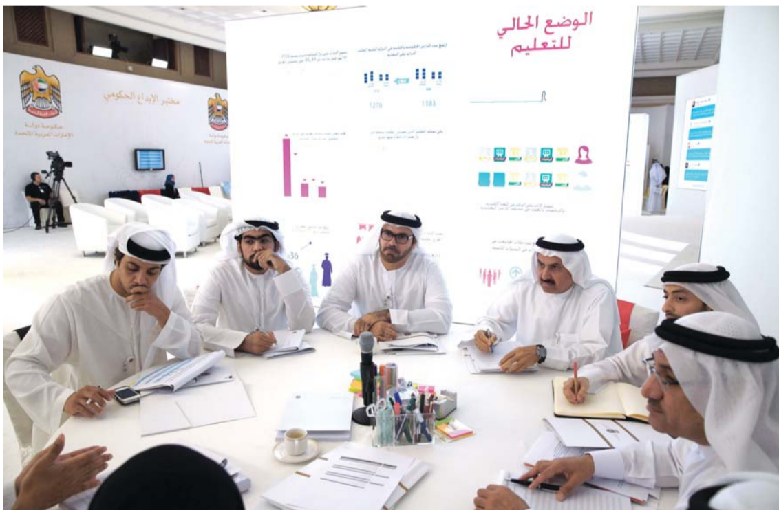
منصور بن زايد مترسماً عمل لجنته بحضور القرقاوي وغياش والقطامي وعدد من المسؤولين

وكان لافتاً ابراز المكتب الاعلامي لمشاركة التلميذة شما خالد من ذوي الاحتياجات الخاصة وحديثها أمام الخطوة