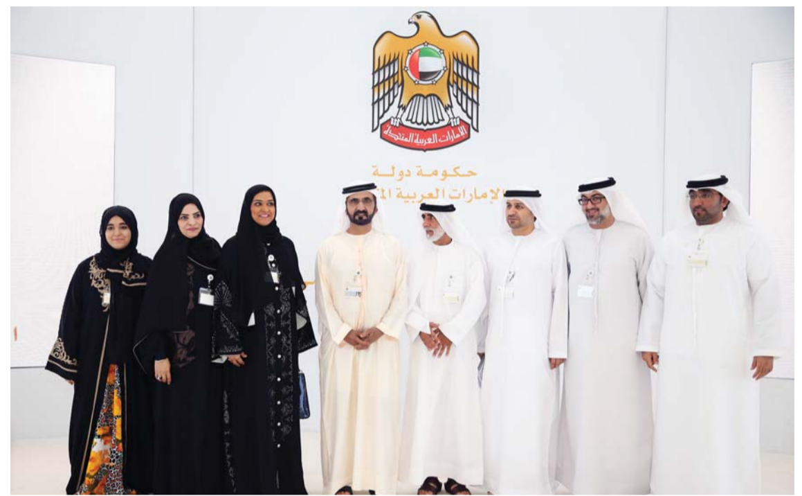
محمد بن راشد يتوسط عدداً من أصحاب الاقتراحات

الوزارية وتلك اللقطة الأيوبية الرائعة لصاحب السمو الشيخ محمد بن راشد آل مكتوم مع التلميذة شما، بينما كان سموه مبعث الطاقة الايجابية والمحركة في ورش الخطوة عبر مشاركته فيها. وبحث الخطوة الوزارية الاستثنائية أمس تطوير قطاع التعليم في الدولة، بينما تتواصل اليوم لندارس سبل تطوير قطاع الصحة عبر تمحيص أكثر من 65 ألف فكرة وردت من خلال العصف الذهني الإماراتي لتطوير القطاعين. يذكر أن الكثير من الخدمات الاخبارية في الدولة اعتمدت على التغطية المباشرة للمكتب الاعلامي لحكومة دبي في بث وقائعها أولاً بأول، ولا سيما أن الآلاف من أبناء الميدان التربوي تابعوها لما لها من أهمية كبرى لدى هذا الميدان. وكان المكتب الاعلامي خاض ذات التجربة بنجاح ابان التغطية الحية والمباشرة لوقائع فوز الامارات باستضافة معرض اكسبو العالمي 2020 في دبي.