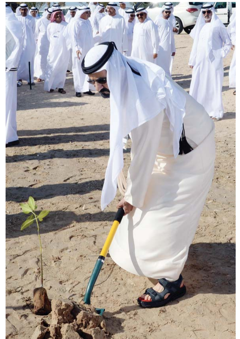
محمد بن راشد يغرس أول شجرة قرم «المانجروف الأحمر» في محمية الحباري