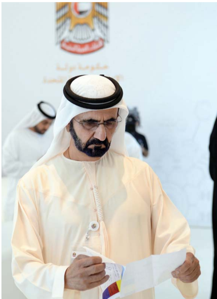
نائب رئيس الدولة يطالع مقترحات اللجان