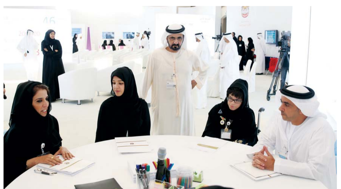
محمد بن راشد يتابع عمل اللجان