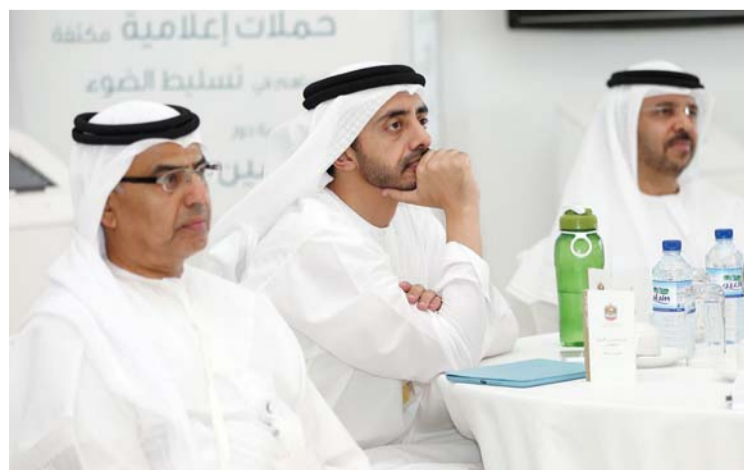
عبدالله بن زايد وهادف الظاهري وعبيد الطاير