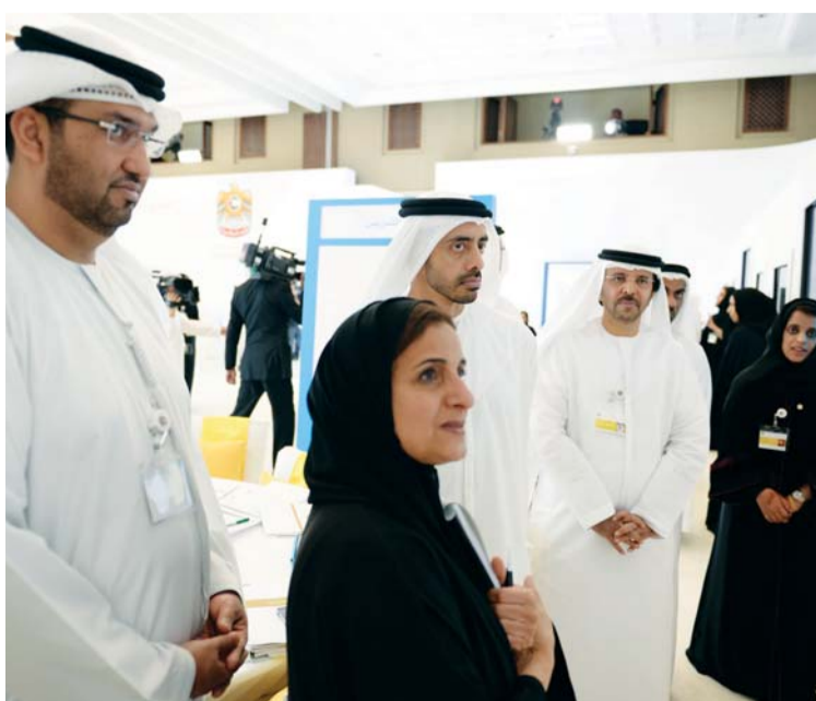
عبد الله بن زايد ولبنى القاسمي وهادف الظاهري وسلطان الجابر