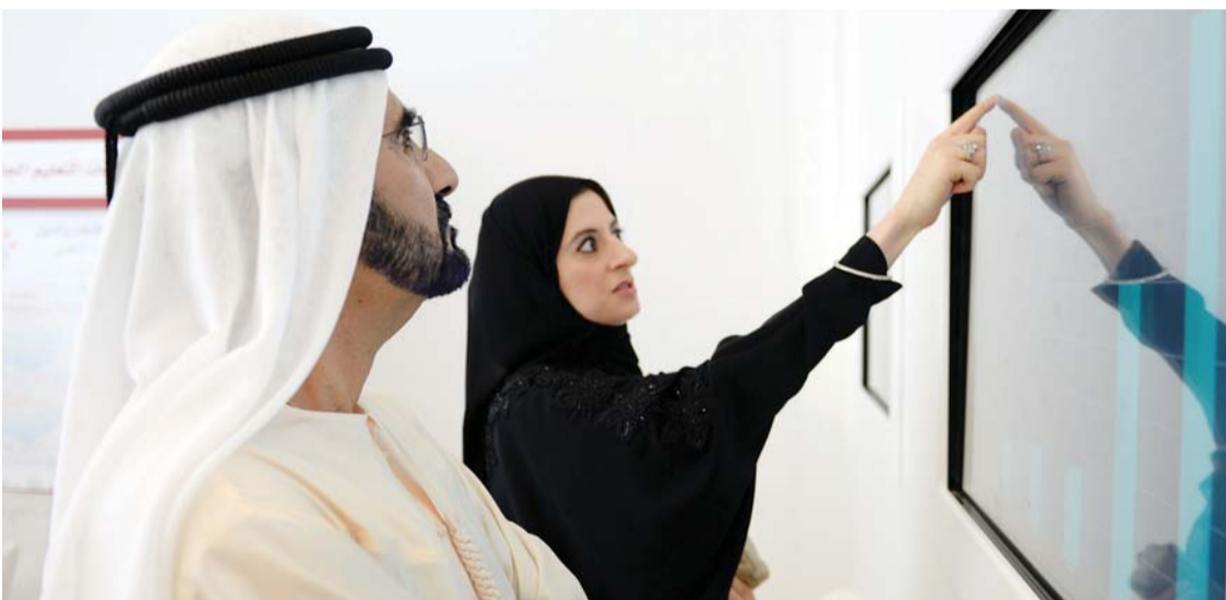
..وسموه يتابع عرضاً عن التحديات