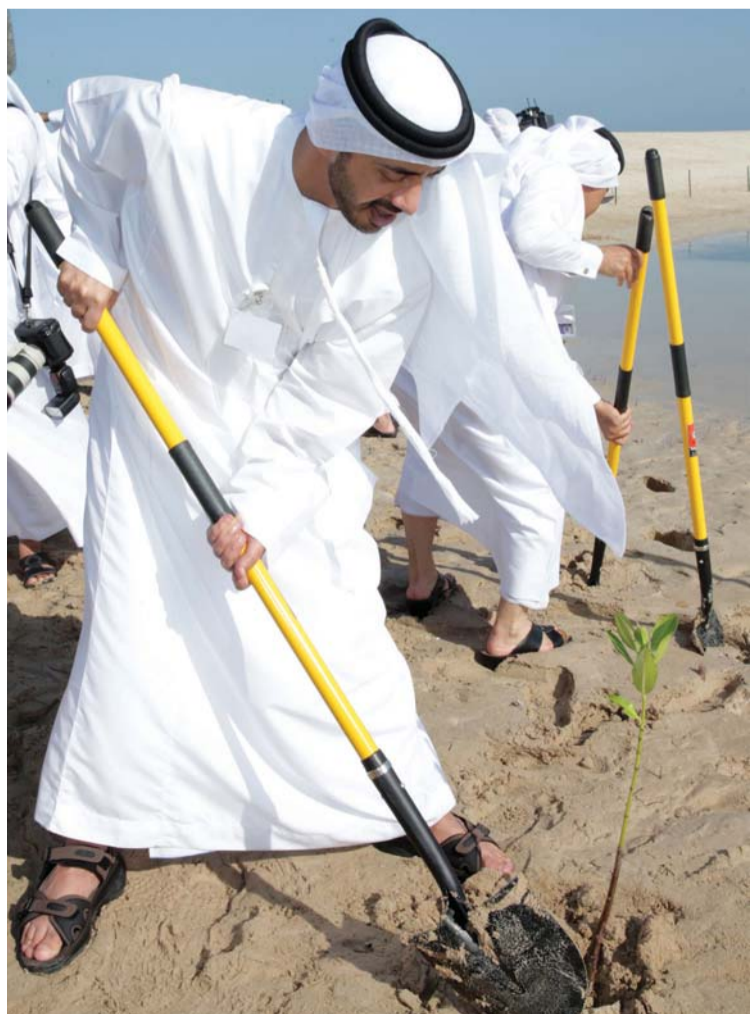
وعبدالله بن زايد يزرع شجرة