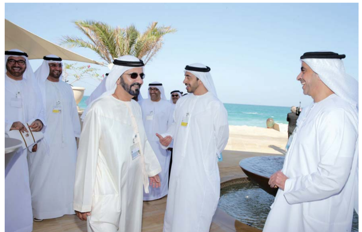
محمد بن راشد يتبادل الحوار مع سيف بن زايد بحضور عبد الله بن زايد ومحمد القرقاوي وسلطان الجابر