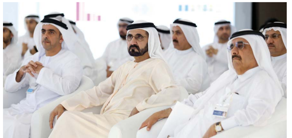
نائب رئيس الدولة يتوسط حمدان بن راشد وسيف بن زايد بحضور الوزراء