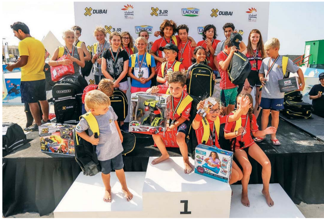
توزيع أبطال الترايثلون