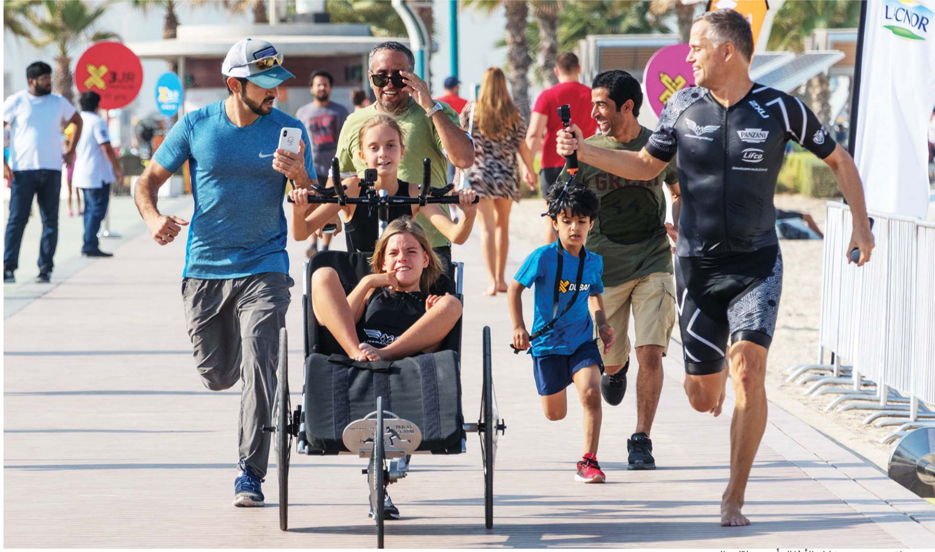
حمدان بن محمد يشترك الأطفال أحد سباقات التحدي

شارك سمو الشيخ حمدان بن محمد بن راشد آل مكتوم ولي عهد دبي، رئيس المجلس التنفيذي، رئيس مجلس دبي الرياضي أمس، في «ترايثلون الصغار X3» الذي نظمته «إكس دبي»، والمقدم من قبل شركة «لاكور».