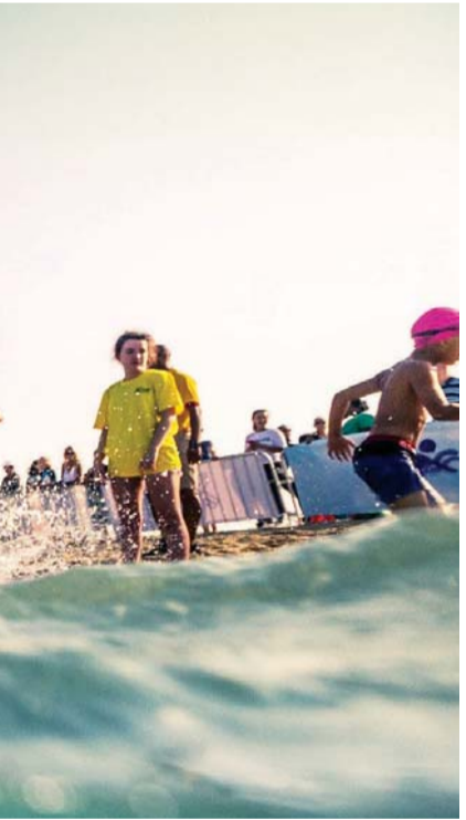
منافسة قوية بين الصغار