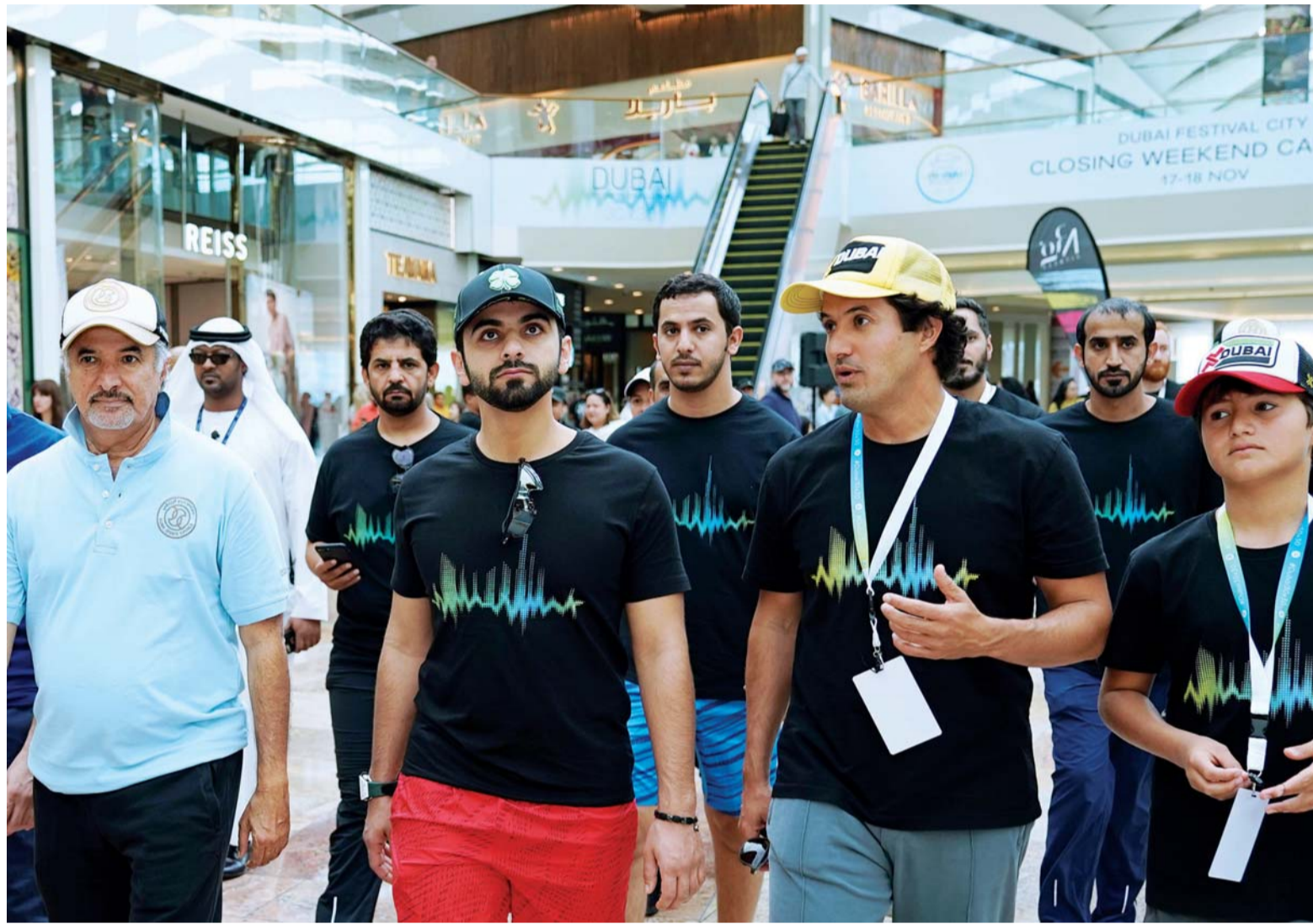
منصور بن محمد خلال متابعته فعاليات كرنفال ختام التحدي بحضور سعيد حارب

والتحمل واللياقة البدنية لدى ممارسيها. وتوقف سموه أمام منصة موسوعة غينيس لتحطيم الأرقام القياسية، التي تدعو من يرغب من المشاركين في «تحدي دبي للياقة» ومن له القدرة على الدخول في الموسوعة عرض قدراتهم وإمكاناتهم بهدف تحقيق رقم قياسي جديد. واختتم سموه جولته بالمرور على منصة «أكاديمية أم كي للمبارزة» وتعرف من القائمين عليها على أبرز الفعاليات التي تقدمها الأكاديمية في الكرنفال الختامي لـ«تحدي دبي للياقة» كالدراجات الهوائية البدينية للمشاركين والمبارزة بالسيف. ومع اقتراب اختتام «تحدي دبي للياقة».. تواصل المبادرة تشجيع الجميع للاستمرار في اتخاذ خطوات إيجابية نحو تبني نمط حياة صحي ليس لهم فقط، بل لأفراد عائلاتهم وأصدقائهم وزملائهم أيضاً. وتم إطلاق «تحدي دبي للياقة» لتحفيز سكان زوار مدينة دبي على ممارسة الرياضة لمدة 30 دقيقة يومياً على مدى 30 يوماً، وابتداءً في 20 أكتوبر الماضي ويختتم اليوم.