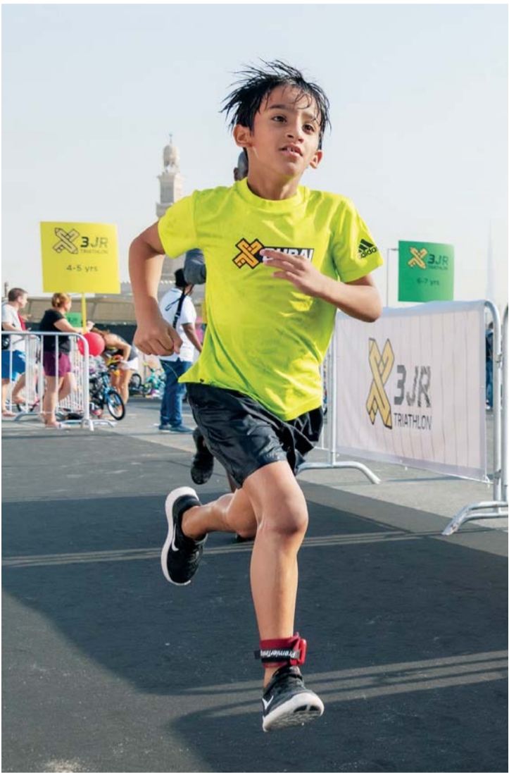
براعم على درب التحدي