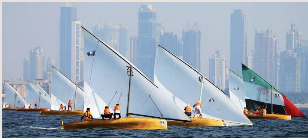
القوارب تكسر صمت البحر في «تحدي دبي للياقة» | البيان

على متنها ما يزيد على 400 شخص سيحصدون ملحة الماضي بين أجمل الوجهات السياحية والحضارية في الخليج العربي ومنطقة الشرق الأوسط، حيث من المنتظر أن يصل طول مسار السباق إلى 6 أميال بحرية. وتنافس القوارب المشاركة في