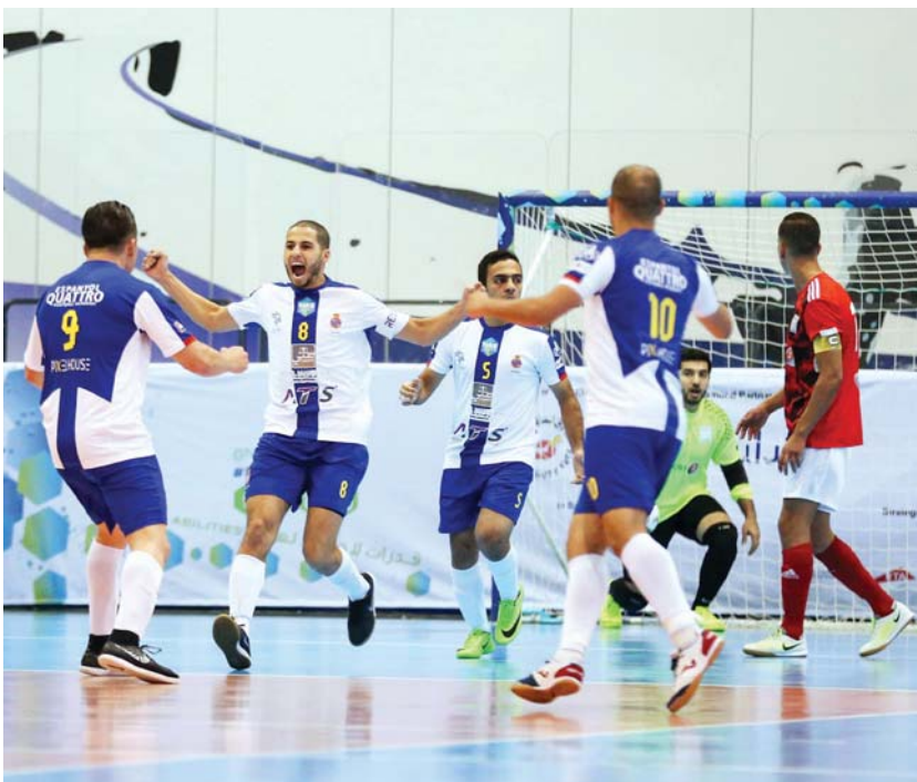
■ كواترو خطف الفوز في الثواني الأخيرة