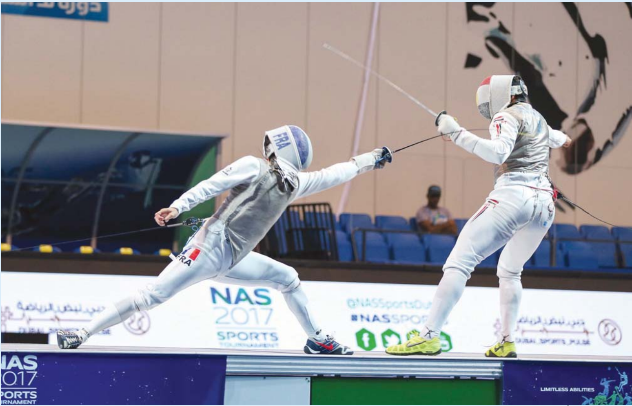
المباراة من الألعاب الجديدة في الدورة

هذا النوع يقام في الإمارات وفي منطقة الشرق الأوسط ليلاً، وقد حقق نجاحات كبيرة للدورة. وقال: شهدت النسخة الخامسة تسجيل عدد كبير من اللاعبين واللاعبات الذين لم يتمكن من مشاركتهم في بعض المنافسات ومن بينها الدراجات، والجري، كما كان هناك لاعبون من الجنسين طلبوا المشاركة بعد غلق باب التسجيل وقد اعتذرنا إليهم، وهذا يدل على أن حجم التفاعل مع دورة ند الشبا بات كبيراً سواء من المواطنين أو المقيمين في الإمارات، فالهدف الأساسي من دورة ند الشبا، خلق قاعدة تضم أكبر عدد من الممارسين للرياضة عبر تنظيم أحداث تنافسية لهم وبشكل احترافي عال المستوى. وختم قائلاً: دورة ند الشبا يُشارك فيها حالياً 5 آلاف رياضي ورياضية من مختلف الفئات والأعمار وأيضاً الجنسيات، وفي مقدمتهم أصحاب الهمم، وهذا العام أقمنا لهم مسابقتين بما يؤكد توجه الدولة أن هذه الفئة صاحبة إنجازات وفئة لا تُجرب من المجتمع، وأي فاعلية رياضية تضع أصحاب الهمم ضمن أولوياتها، وهذا ما تميزت به الدورة للغاية.