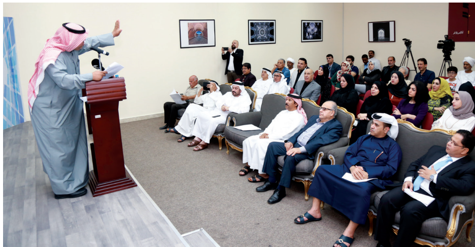
■ جانب من الأمسية الشعرية