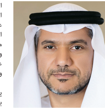
■ عويضة المر

وقال محمد بن جرش الفلاسي، وكيل دائرة الطاقة في أبوظبي: «جسد شهداء الإمارات بتضحياتهم وعطائهم قيم الولاء والشهامة وحب الوطن، وأكدوا أن راية الإمارات ستبقى خفاقة شامخة بفضل وجود رجال مخلصين أوفوا العهد، وصانوا الأمانة حتى آخر لحظة من حياتهم». وتابع: «أكدت التضحيات، التي قدمها أبطال الإمارات، أن ثقافة البذل الصادق والعطاء متأصلة في نفوس أبناء الوطن، وهي ثقافة راسخة متوارثة عبر الأجيال تؤكد استعداد أبناء الإمارات الدائم للدفاع عن وطنهم والذود عنه كلما دعت الحاجة».