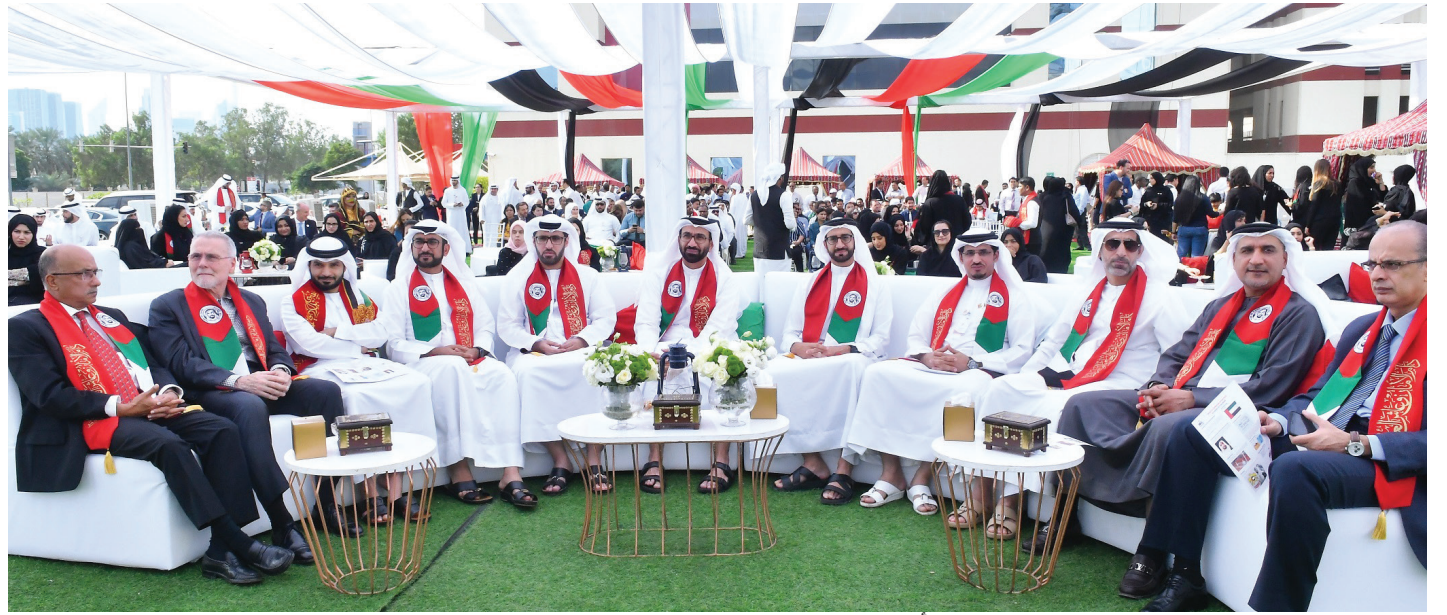
مسؤولو وموظفو مجموعة وصل خلال الاحتفال بيوم الشهيد أمس