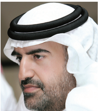
■ جمال بن حويرب