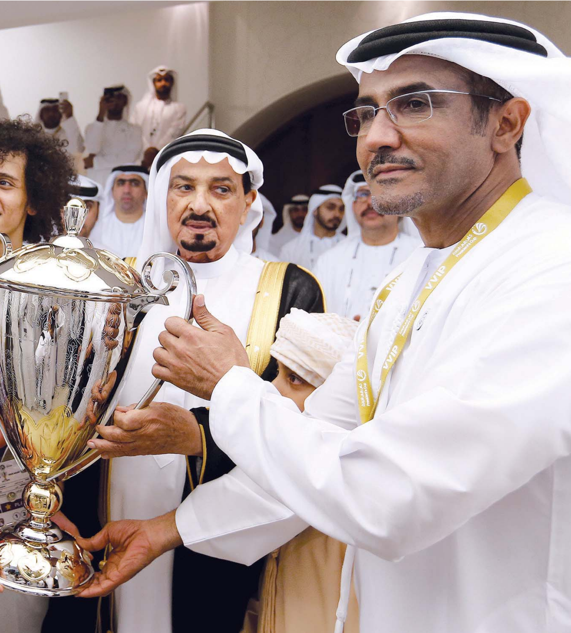
حميد النعيمي يسلم كأس رئيس الدولة لعموري بحضور عبدالله بن محمد ومروان بن غليظة وغانم الهاجري

هزاع بن زايد: مسيرة الإنجازات تتواصل.. الزعيم يفوز مجدداً بالرهان