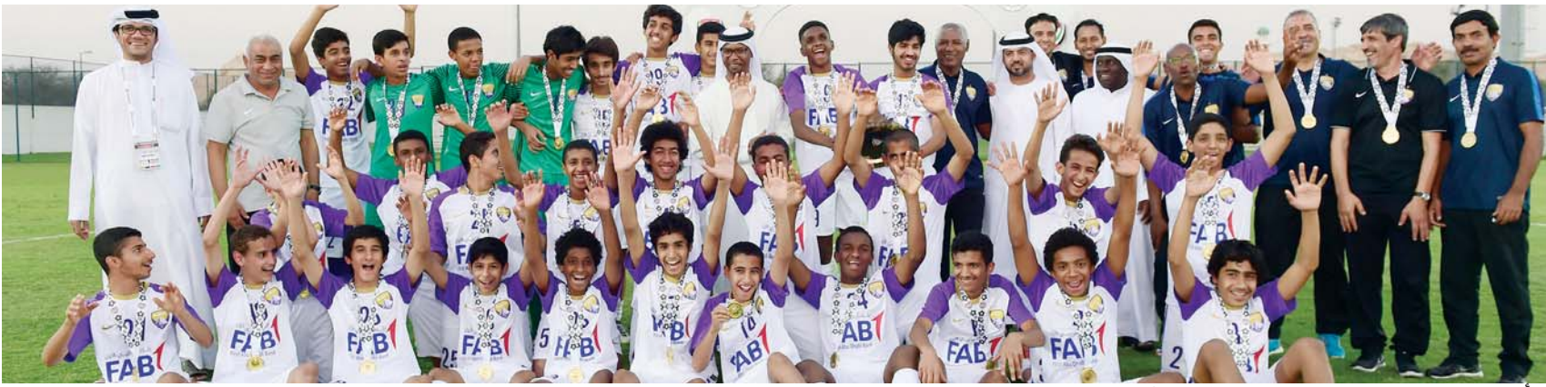
■ أكاديمية العين منيع المواهب تحتفل بالبطولات | البيان

الأول، وتحقيقه للبطولات والإنجازات، يدعم أكاديمية الكرة والقائمين عليها، ويؤكد نجاحها في مهمتها الأساسية، وهدفها الأول، وهو تغذية الزعيم بلاعبين قادرين على تحقيق التطلعات.