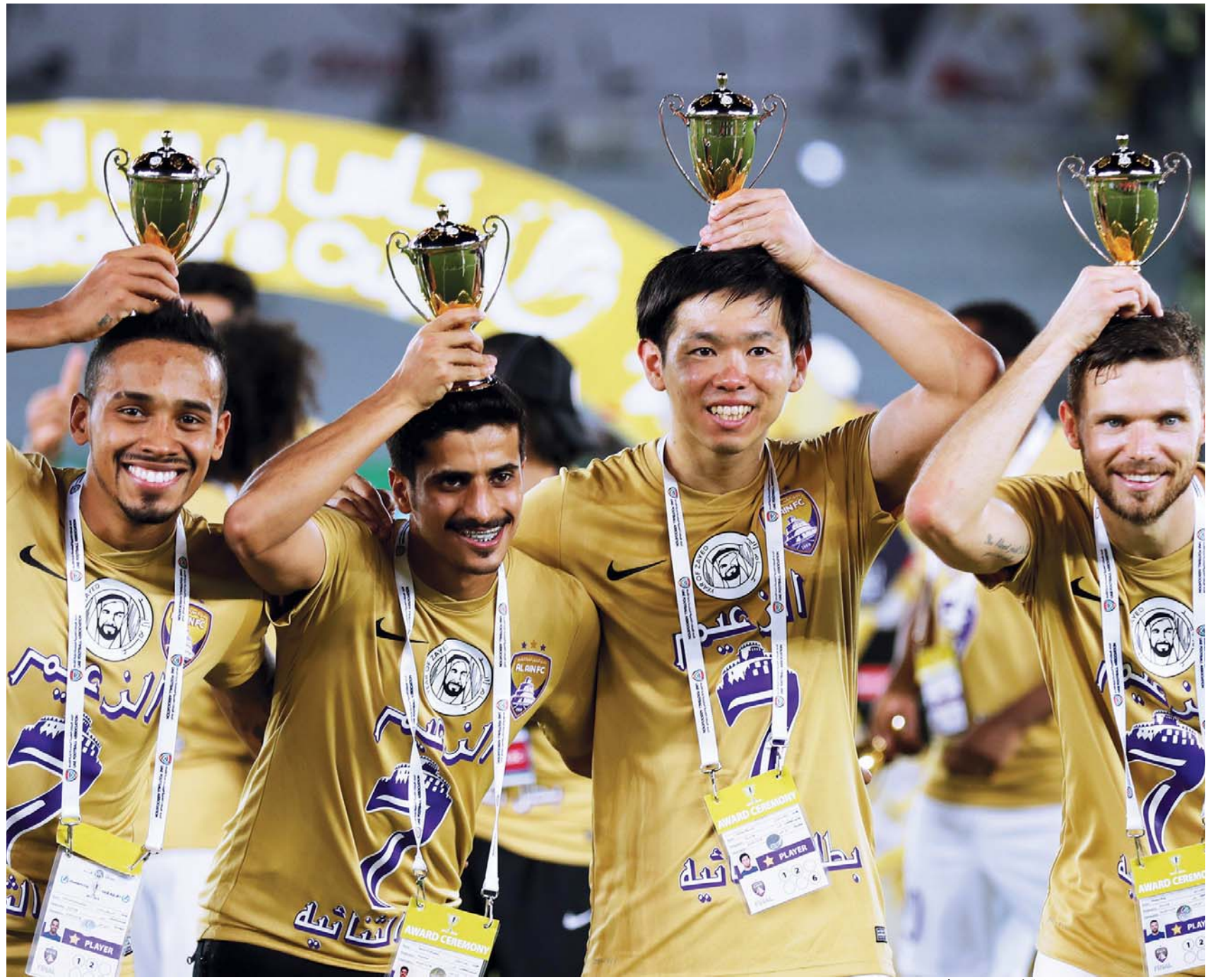
بيرغ وشيوتاني قدما إضافة كبيرة للعين | البيان

لاعباً بفريق العين أصبحوا جاهزين تماماً للعب في أي وقت بأية مباراة مهما كانت أهميتها وقوتها