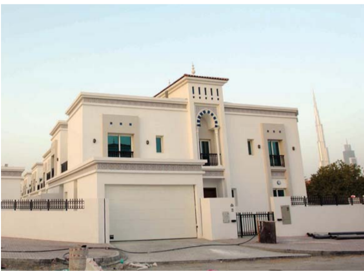
برج خليفة يظهر في أفق المشروع

تبلغ مساحة أرض المشروع 682 آلاف قدم مربع في حين تبلغ مساحة البناء 1.17 مليون قدم مربع وتجهز وصل للعقارات في تهيئة للسكان والسياح في الربع الأخير 2015 وبداية 2016.