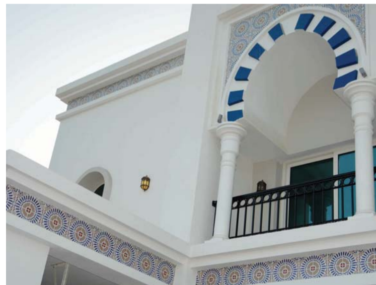
عراقة الفن الأندلسي في تصاميم الفلل