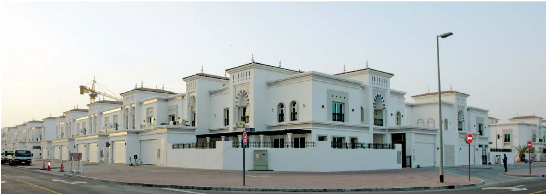
جانب من الفلل المنجزة