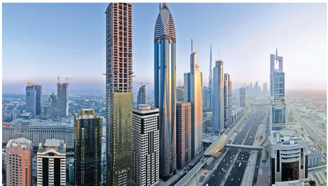
استقرار في عقارات دبي

وتوقع الملا أن تواصل أسعار إيجارات الشقق الفلل استقرارها في المناطق الرئيسية المرغوبة وأن يشهد عام 2016 تراجعاً لافتاً في أسعار الإيجارات نظراً لاكمال عدد كبير من المشاريع العقارية التي تم إطلاقها بين عامي 2011 و2014 ودخولها في السوق في تلك الفترة. وأشار الرئيس التنفيذي لشركة «ستاندرد للعقارات»: إن العائد القوي على الاستثمار العقاري في دبي، كان العنصر المحفز لاستقطاب المزيد من المستثمرين المحلي والأجنبية بالقطاع منذ مطلع 2015. لافتاً إلى أن الانتعاش العقاري ساهمت في