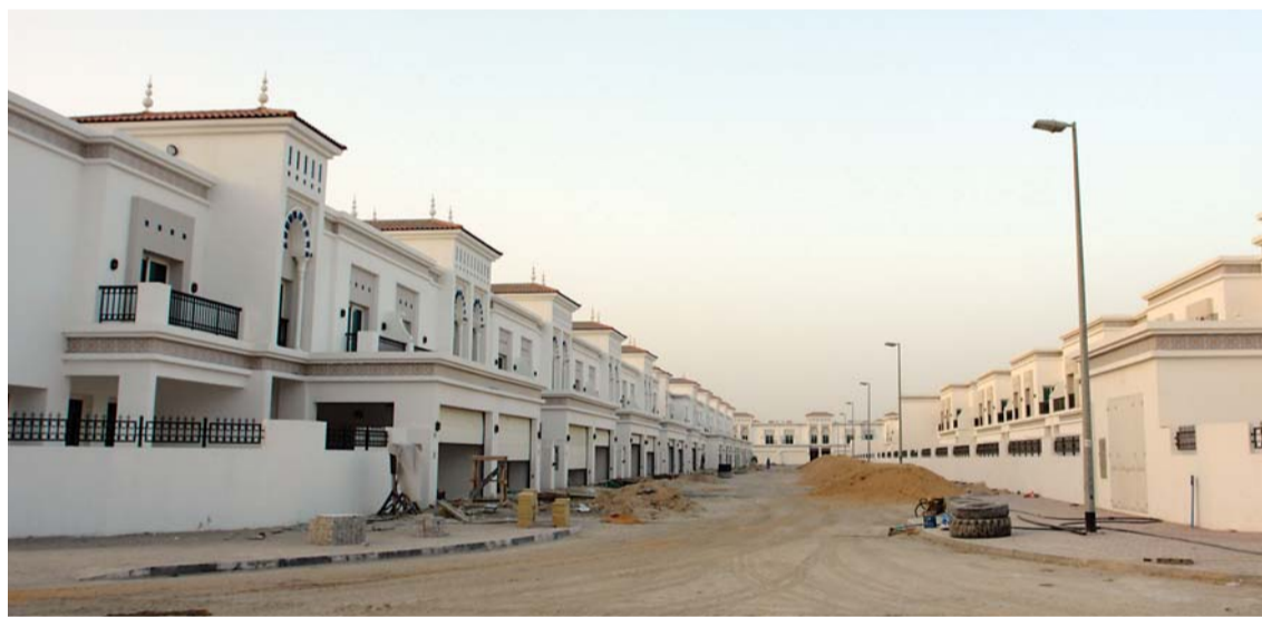
أعمال البناء تتقدم في المبنى السكني

متطورة في إنجاز المشاريع وتسليمها في مواعيدها المقررة رغم التحديات التي قد تعترض العديد من الشركات بسبب نقص مقاولي الباطن أو تقلبات أسعار مواد البناء والتنفيذ.