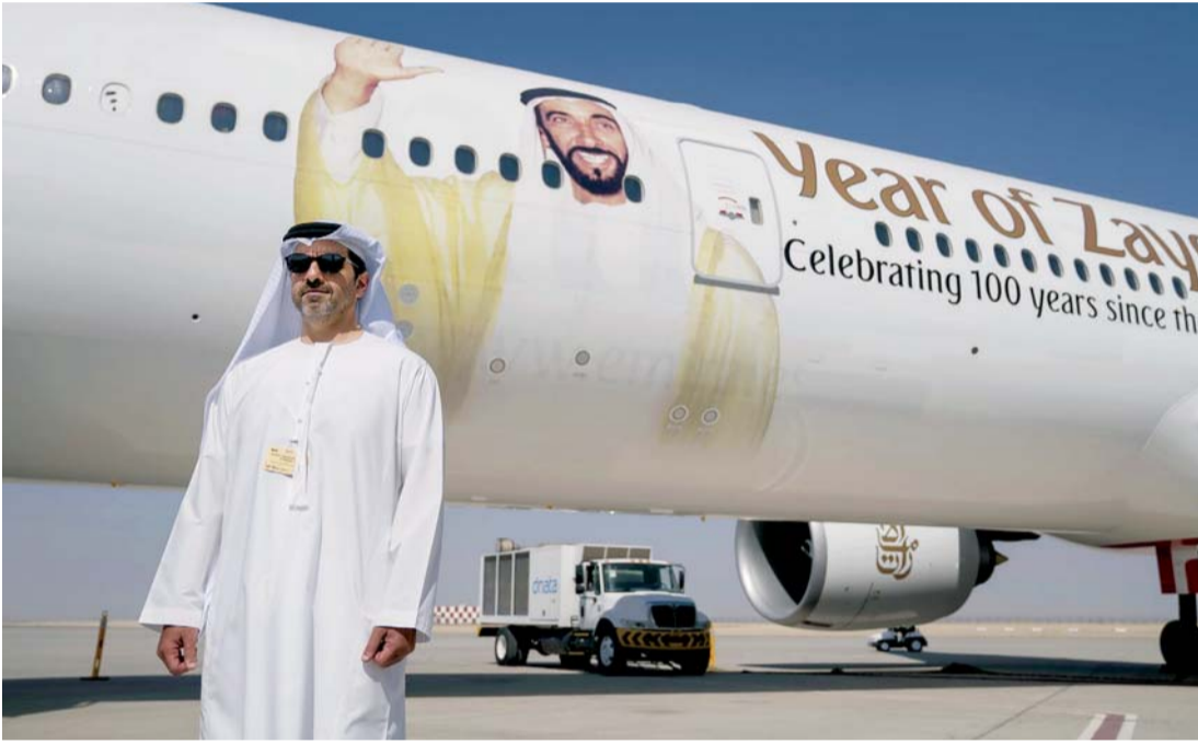
■ سموه يقف أمام طائرة لـ «الإمارات» تحمل ملصق «عام زايد»