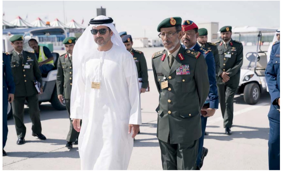
■ حامد بن زايد وحمد الرميثي وعدد من المسؤولين خلال زيارة معرض دبي للطيران أمس

الشركات وخطها المستقبلية. وأشاد سموه بالكفاءات المواطنة الشابة والطموحة التي تسعى عبر الصناعات المتخصصة إلى إبراز مهاراتها وكفاءتها، متمنياً لهم المزيد من التوفيق والنجاح في رفعة اسم وطنهم في المجالات كافة وخاصة مجال الطيران والدفاع الجوي والتقنيات الحديثة في الاتصالات والإلكترونيات.