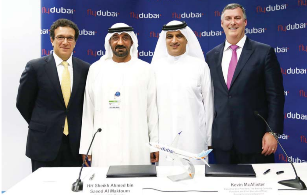
أحمد بن سعيد وغيث وكيفن مكاليستر بعد توقيع الاتفاقية

الطلبية تؤكد نجاح رؤية تأسيس فلاي دبي ودور الإمارة كمركز عالمي للطيران