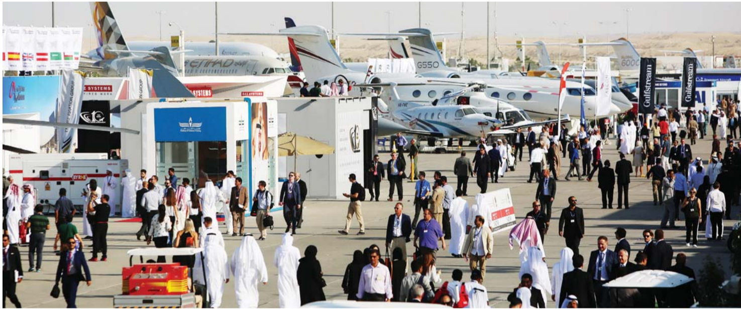
إجمالي الطائرات التي تم التعاقد على شرائها أمس وصل إلى 655 طائرة من أنواع مختلفة

وقال الهاشمي في مؤتمر صحفي على هامش المعرض إن قيمة صفقات اليوم الرابع بلغت 1,585 مليار درهم. وتضم الصفقات الجديدة شراء خمس طائرات نقل عسكرية من نوع «سي 295 إم دبليو» والخدمات المرتبطة بها من شركة «إيرباص ديفينس أند سبيس»، الإسبانية بقيمة 920 مليون درهم، والتعاقد مع «إم بي دي إيه» الفرنسية لتقديم الدعم الفني بقيمة 50,7 مليون درهم، والتعاقد مع شركة «الإمارات أفيشن للدعم» بقيمة 40 مليون درهم لتقديم الإسناد الفني وتوريد قطع الغيار للرادارات والطائرات وتقديم المعاونة الفنية، بالإضافة إلى عقد مع شركة «إيريورني سيستمز» الإماراتية بقيمة 26 مليون درهم لتقديم الإسناد الفني والدعم اللوجستي وقطع الغيار والمعاونة الفنية للطائرات العمودية، واتفاقية مع شركة «دينيل داينامكس» الجنوب أفريقية لشراء طائرات من نوع سيكر للقوات المسلحة بقيمة 48,15 مليون درهم، ومع شركة «دي إتش إيه بي أي دريلنج» المحلية لتقديم خدمات الصيانة والدعم الفني للقوات الجوية والدفاع الجوي بقيمة 8,6 ملايين درهم، ومع شركة «تكوم إل بي» الأميركية لتقديم الدعم والمعاونة الفنية لأنظمة الرادارات بقيمة 12,9 مليون درهم، وجلوبال إيروسييس لوجستيك الإماراتية لتقديم الإسناد الفني وتوفير قطع الغيار والمعاونة لمدة 3 سنوات بقيمة 40 مليون درهم، وعقد مع شركة ريثيون الأميركية لشراء قطع غيار ومعدات لنظام الباتريوت بقيمة 436,4 مليون درهم، وشركة «الطيب تكنولوجي سيرفس» الإماراتية لتقديم خدمات الصيانة لأنظمة الدفاع الجوي بقيمة مليوني درهم.