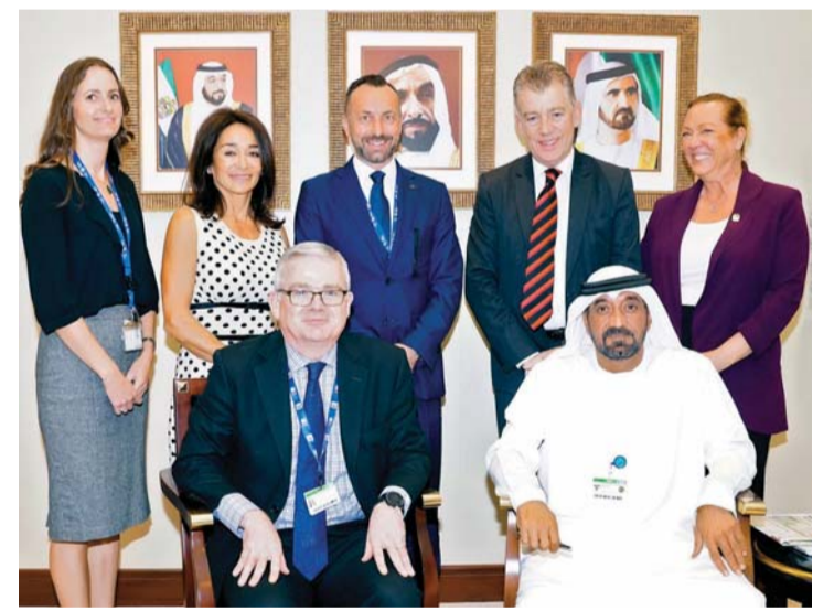
أحمد بن سعيد وممثلو مجموعة تاروس أمس خلال تمديد الاتفاقية

تشمل أربعة أعوام إضافية لتنظيم معرض دبي الدولي للطيران 2021 و2023 و2025 و2027. وستستمر بموجبه مجموعة تاروس والممثلة بمؤسسة تاروس إف اند إي الشرق الأوسط بإدارة وتنظيم المعرض بالتعاون مع مؤسسة مطارات دبي.