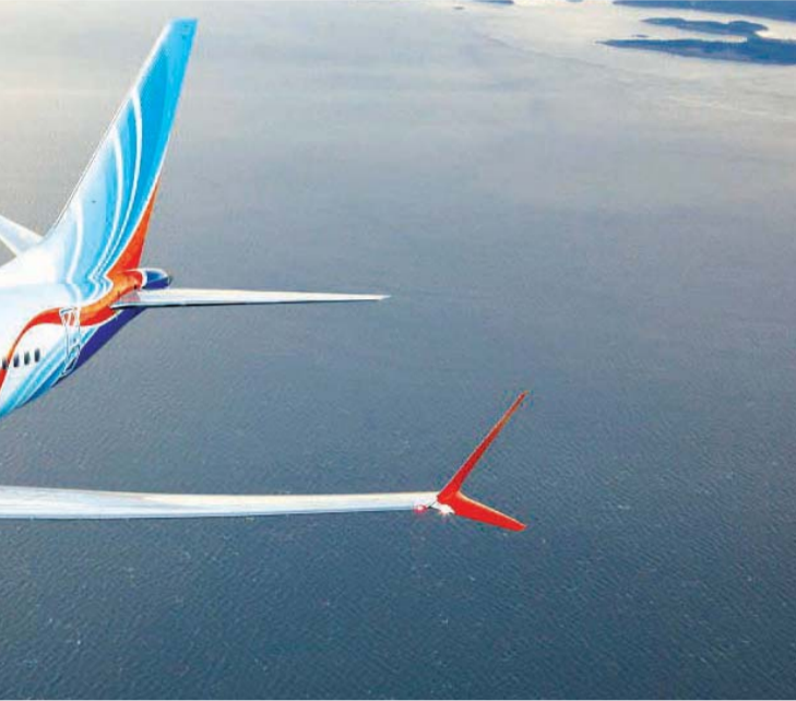
طائرة بوينغ من طراز 737 ماكس

الصفقة مع «بوينغ» قرار تجاري بحت وتوصلنا إلى ذلك بناء على قرار من الفريق الفني