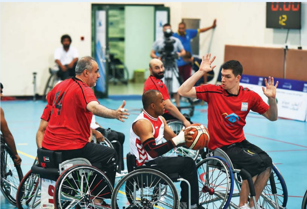
ندبة كبيرة في الجولة الثانية للمنافسات

تواصلت الإثارة في اليوم الثاني لبطولة كرة السلة بالكراسي المتحركة ضمن دورة ند الشبا، حيث جرت أربع مباريات ساخنة، جمعت الأولى مؤسسة دبي لخدمات الإسعاف والأنصاري للصرافة، وانتهى الشوط الأول بتقدم فريق مؤسسة دبي لخدمات الإسعاف 6/7، وفي الحصّة الثانية وسع الإسعاف الفارق إلى 7 نقاط، ثم انتفض فريق الأنصاري للصرافة وتمكن من تقليص الفارق إلى