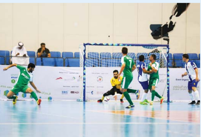
■ من مباراة فريقي الجوارح وكواترو