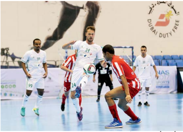
■ «أم كي أس» حقق فوزاً صعباً