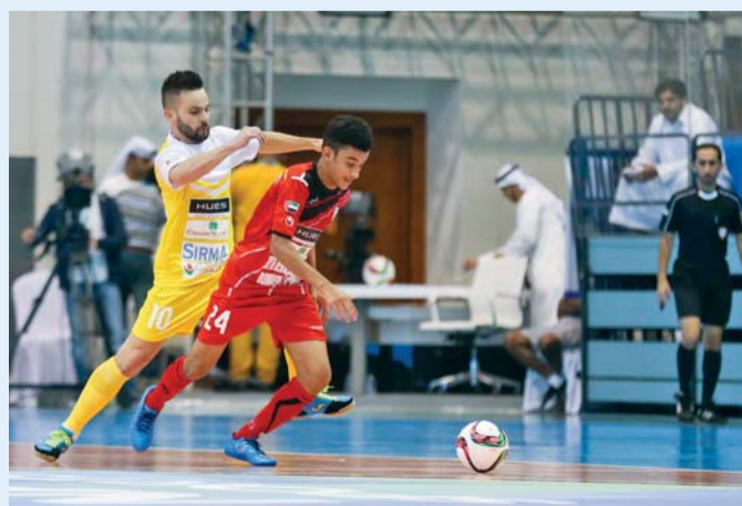
■ مواجهة الطاهر والعاصفة شهدت أهدافاً كثيرة

تسجيل الهدف الأول لفريق الطاهر بعد مرور 5 دقائق، لتشهد مجريات المباراة سلسلة من الأهداف السريعة المتبادلة سيطر فيها الطاهر على الأسبكية، وانتهى الشوط الأول لفائدته على نتيجة 4-2.