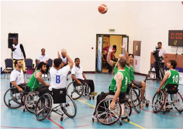
من منافسات سلة الكراسي

فيما قمنا بتوزيع عدد منهم لضمان تكافؤ الفرص، كما سيتواجد عدد من موظفي الدوائر، الذين قاموا بالتدريب على استخدام الكراسي المتحركة خلال الفترة الماضية، وهو الأمر الذي يسهم في نشر التوعية بهذه الرياضة، ويعزز تجربة المجتمع بالتفاعل معها».