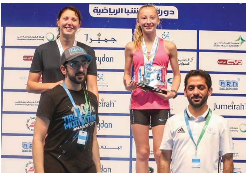
.. وعلى منصة التتويج

البطلة الصغيرة، التي حققت حلمها في نهائيات الشبا، اتسعت أمانيتها وبدأت في حلم جديد ينمو في دبي أرض الاستحليل، هو حلم المشاركة في الألعاب الأولمبية 2024، لا سيما أن والديها يشجعانها مع شقيقتها على الوصول إلى حيث تريدان، والداهما