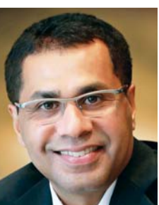
فيصل كوتيكولون: أساليب متكاملة في البناء والبنية التحتية