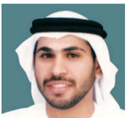
سلطان آل نهيان: «آفاق» سباق للتوافق مع المبادرات الحكومية