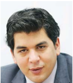
عارف الرمي: المصارف من أهم المساهمين في التطوير التقني