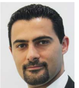
عمر الجميل: حلول فعالة في المساحة والقدرة