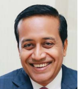
شاليش داش: تطوير الرؤية الاستراتيجية اعتماداً على الخبرة

عدد معاملات الدفع الإلكتروني المنفذة 5260677