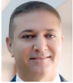
عنان فخر الدين: تشجيع النساء على الإبداع