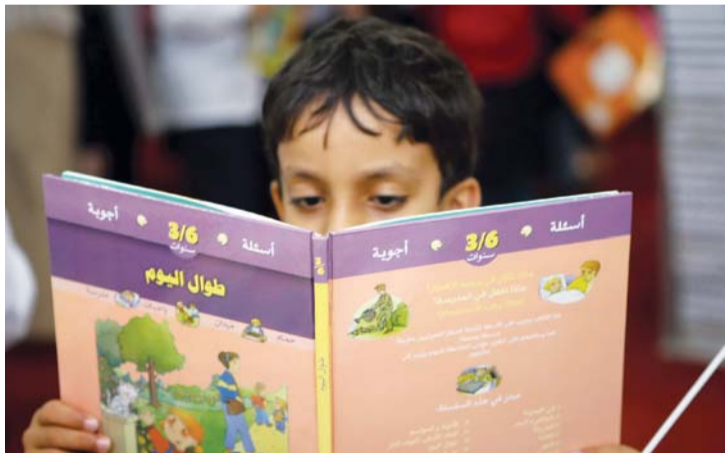
تشجيع الطلبة على القراءة | أرشيفية