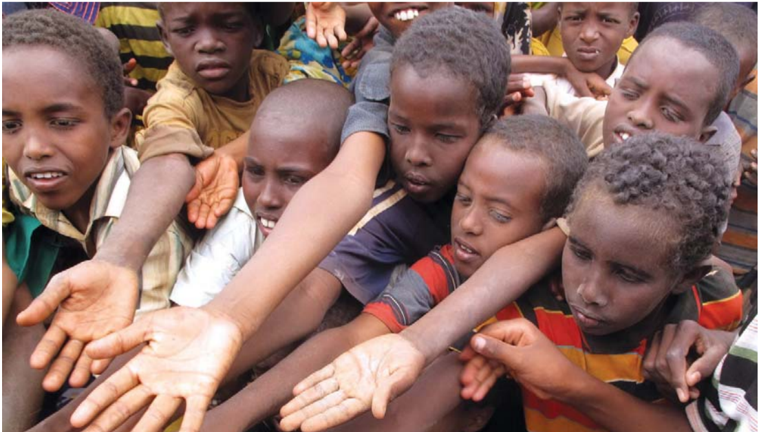
لا زال في العالم أطفال بحاجة إلى تعليم ورعاية صحية

وأوضح التقرير أن الهدف الثاني الخاص بتحقيق التعليم الابتدائي فقد بلغ معدل