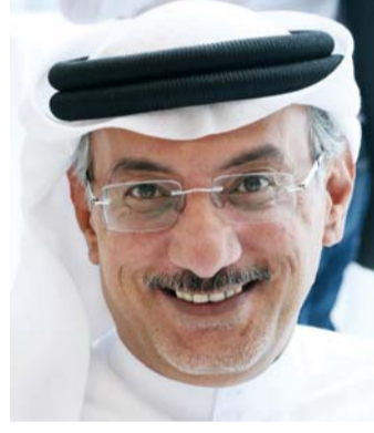
عبد الله بن سويات

على سموه وعطاءه اللامحدود الذي اعتاد عليه القاصي والداني، مشيراً إلى أن سموه يمد يد العون لكل محتاج، ومنكوب، وفقير، ومرضى سواء من خلال مبادراته المعروفة، أو من خلال مبادرات فجائية تتوافق مع الأحداث العالمية التي تحصل في العالم من كوارث طبيعية أو حروب ومجاعات.