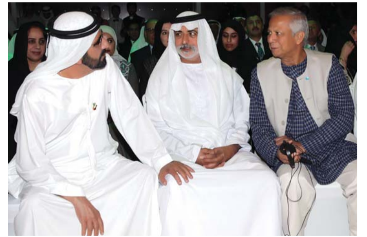
محمد بن راشد خلال إطلاق المؤسسة

استشراقاً من سموه لتحدي المياه، بوصفه أحد أهم التحديات التي ستواجه منطقتنا خلال الفترة المقبلة.