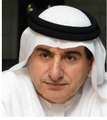
إبراهيم عبد الملك

وأهدافاً سامية لسنوات مقبلة حددت من خلالها ما تود تحقيقه، وهو أمر تنظيمي يؤكد بعد النظر الحقيقي لسموه، خاصة في ظل ما يمر به العالم حالياً من ظروف صعبة في أكثر من جهة في الكون، سواء من حروب، أو كوارث طبيعية، أو مجاعات، أو نقص في المياه، أو شح في التعليم أو توفر