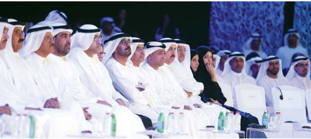
■ الهاشمي والشامسي والقطامي وغباش والبادي والطاير والحمادي والرومي والعويس وبن فهد والمنصوري والزعايبي والكندي

■ رصد 500 مليون درهم لأبحاث المياه استشرافاً من سموه لتحدي المياه خلال الفترة المقبلة