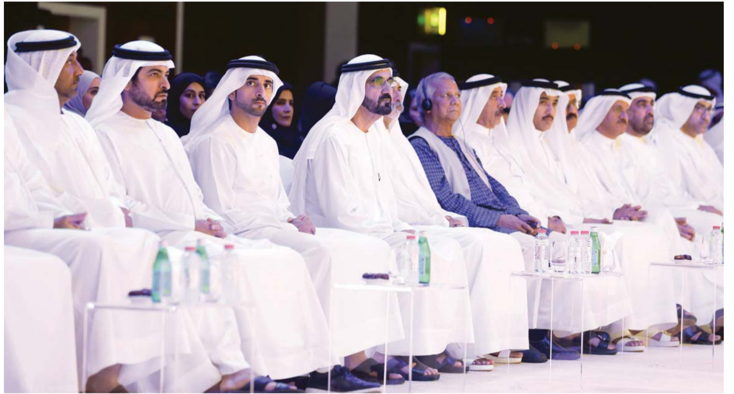
■ نائب رئيس الدولة لدى حفل الإطلاق بحضور حمدان بن محمد وأحمد بن سعيد وتهيان وحمدان بن مبارك وحشر بن مكتوم