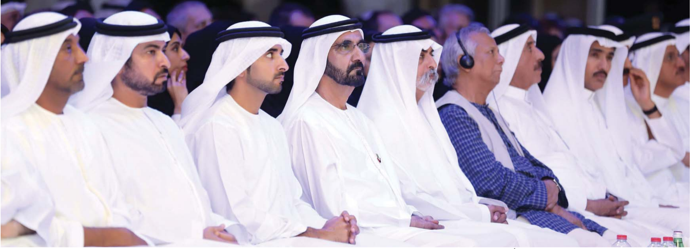
محمد بن راشد خلال إطلاق المؤسسة بحضور حمدان بن محمد وأحمد بن سعيد ونهيان وحمدان بن مبارك وحشر بن مكتوم

العالم اليوم يواجه تحديات كبيرة في الإرهاب وفي الحروب وفي الهجرات وغيرها والحل الحقيقي هو في التنمية