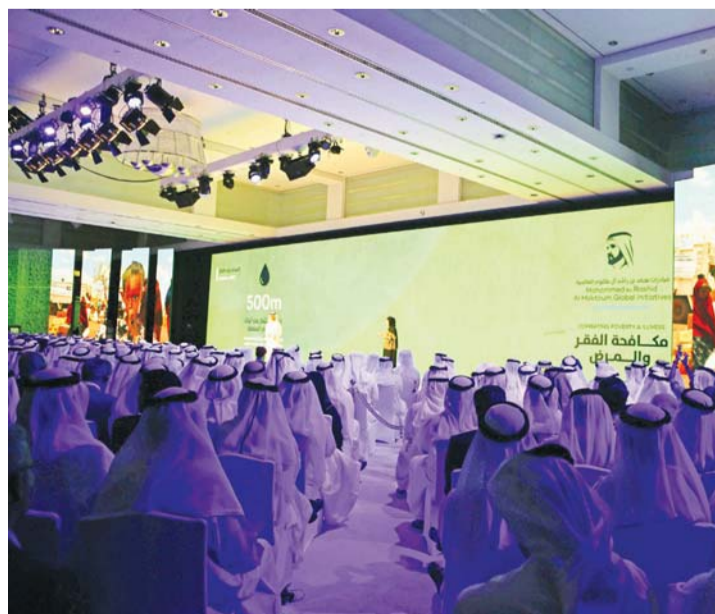
جانب من حفل إطلاق المؤسسة

وتتم الإعلان صباح أمس، عن الأهداف الرئيسية المبدئية للمؤسسة الجديدة، التي تتضمن أربعة قطاعات رئيسية، هي مكافحة الفقر، ونشر المعرفة، وتمكين المجتمع، وابتكار المستقبل، حيث ستعمل «مبادرات محمد بن راشد العالمية»، على دعم وتعليم 20 مليون طفل، ووقاية وعلاج 30 مليون إنسان من العمى وأمراض العيون حتى عام 2025، كما ستعمل المؤسسة على استثمار 2 مليارات درهم في إنشاء مراكز الأبحاث الطبية والمستشفيات في المنطقة، بالإضافة لرصد 500 مليون درهم لأبحاث المياه، وذلك