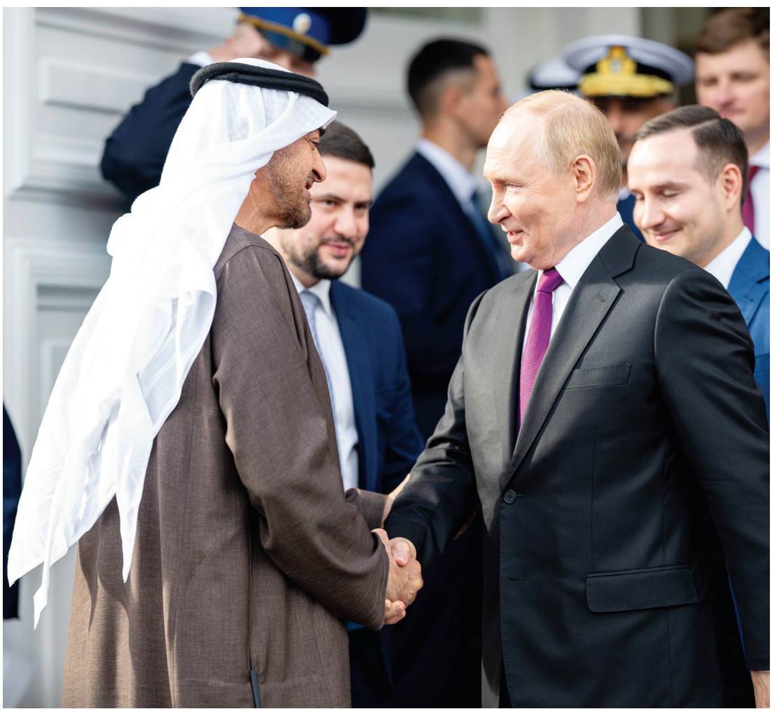
محمد بن زايد مصافحاً فلاديمير بوتين