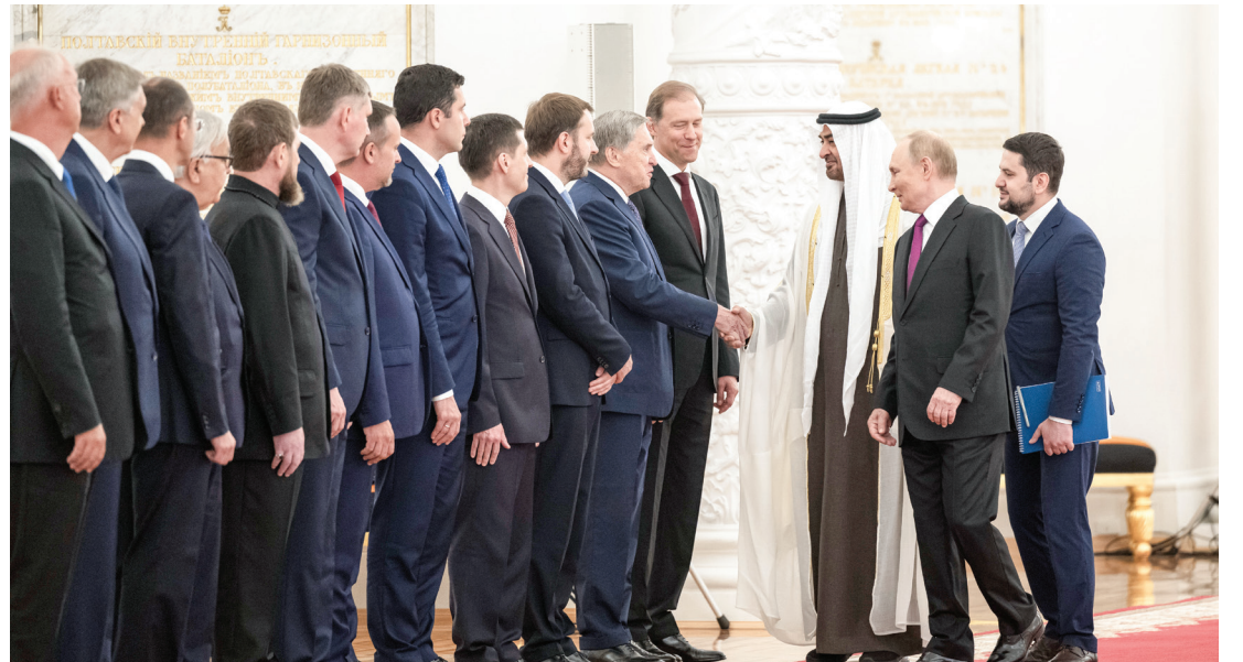
محمد بن زايد مصافحاً المسؤولين الروس بحضور فلاديمير بوتين