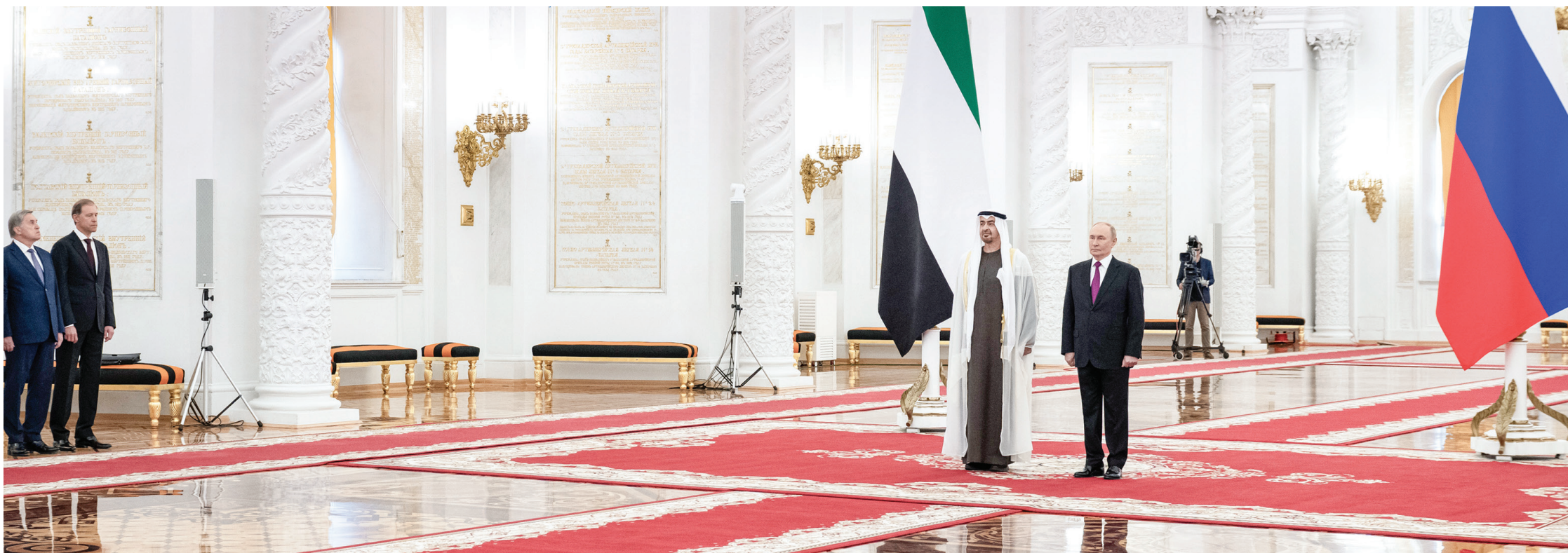
محمد بن زايد وفلاديمير بوتين خلال الاستقبال

محمد بن زايد: نهج الإمارات ثابت في العمل على ترسيخ أسباب السلام والاستقرار في العالم علاقتنا مع روسيا تستند إلى إرث عريق من التعاون البناء والعمل المشترك يمتد إلى أكثر من 5 عقود بوتين: روسيا تولي اهتماماً كبيراً بتطوير علاقاتها مع الإمارات تعاون البلدين يشهد نمواً ملحوظاً خاصة في المجالات الاقتصادية والاستثمارية