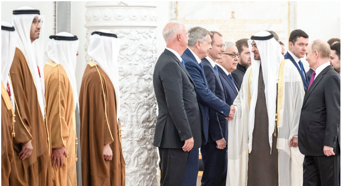
محمد بن زايد وفلاديمير بوتين لدى مصافحة المسؤولين الروس بحضور سلطان الجابر