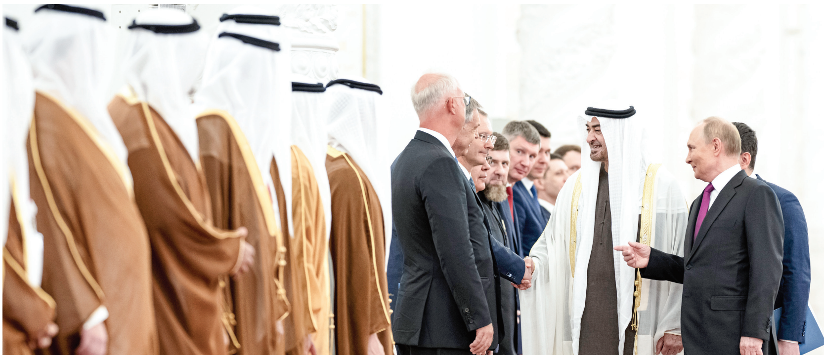
محمد بن زايد مصافحاً المسؤولين في روسيا بحضور فلاديمير بوتين

وتبادل صاحب السمو رئيس الدولة والرئيس الروسي خلال الجلسة وجهات النظر بشأن عدد من القضايا الإقليمية والدولية محل الاهتمام المشترك.. وفي هذا السياق أكد سموه نهج دولة الإمارات الثابت في العمل على ترسيخ أسباب السلام والاستقرار في العالم، بجانب دفع الحلول والمبادرات السلمية لمختلف النزاعات والصراعات على المستويين الإقليمي والعالمي. وتطرق الجانبان إلى أهمية القمة العربية - الروسية التي تعقد خلال شهر أكتوبر المقبل، والتي دعا إليها الرئيس فلاديمير بوتين لتعزيز علاقات روسيا مع العالم العربي. واستعرض سموه والرئيس الروسي تطورات الأوضاع في منطقة الشرق الأوسط، مشددين على ضرورة تكثيف العمل من أجل إيجاد أفق واضح للسلام العادل والشامل الذي يقوم على أساس «حل الدولتين»، ويضمن الاستقرار والأمن للجميع.