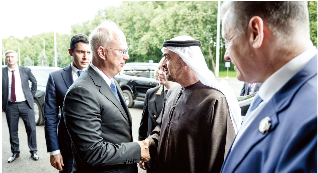
محمد بن زايد مصافحاً كيريل دميترييف الرئيس التنفيذي لصندوق الاستثمار المباشر الروسي