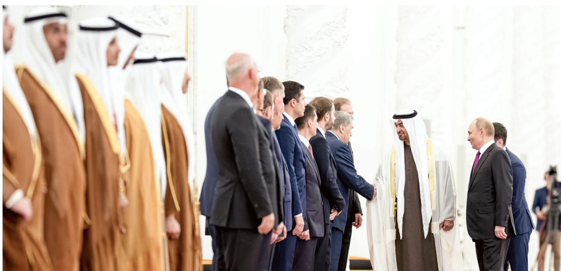
محمد بن زايد بحضور بوتين مصافحاً المسؤولين الروس

محمد بن زايد: نهج الإمارات ثابت في العمل على ترسيخ أسباب السلام والاستقرار في العالم علاقتنا مع روسيا تستند إلى إرث عريق من التعاون البناء والعمل المشترك يمتد إلى أكثر من 5 عقود بوتين: روسيا تولي اهتماماً كبيراً بتطوير علاقاتها مع الإمارات تعاون البلدين يشهد نمواً ملحوظاً خاصة في المجالات الاقتصادية والاستثمارية