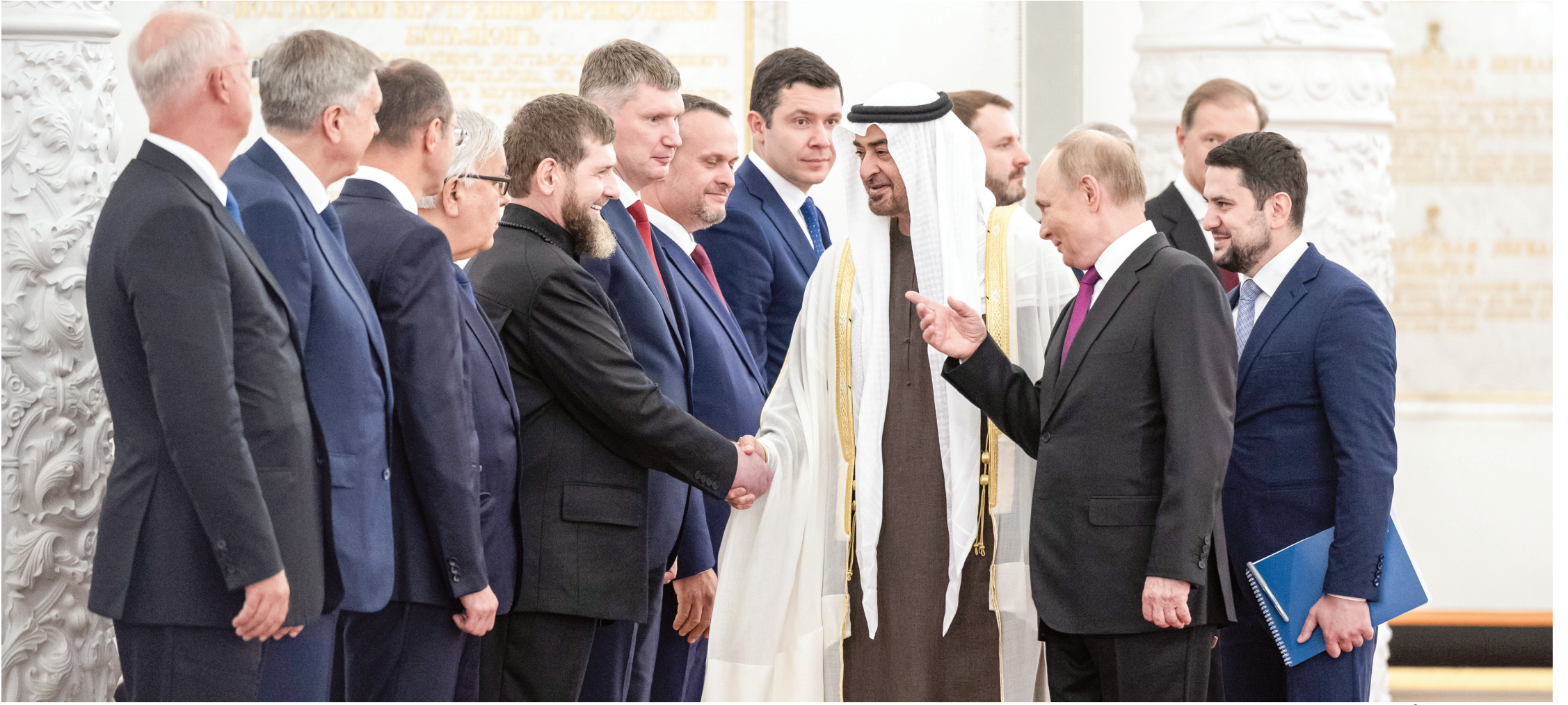
محمد بن زايد مصافحاً رمضان قديروف رئيس الشيشان بحضور فلاديمير بوتين