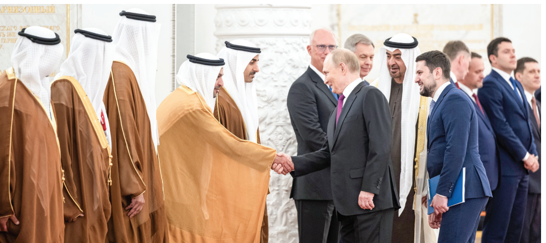
سموه لدى مصافحة بوتين لمحمد بن حمد بن طحون بحضور حمدان بن محمد بن زايد