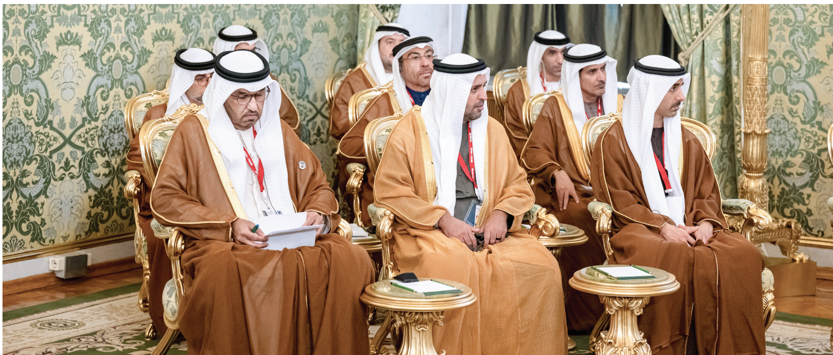
حمدان بن محمد بن زايد ومحمد بن حمد بن طحنون وعلي الشامسي وسلطان الجابر وسهيل المزروعبي وثاني الزيدوي ومحمد السويدي وأحمد الصايغ