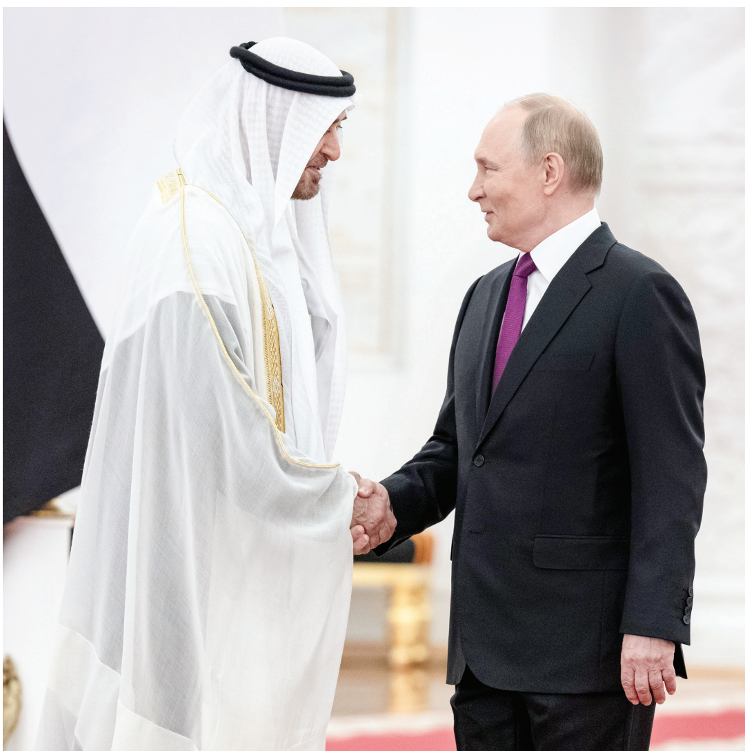
رئيس الدولة مصافحاً الرئيس الروسي