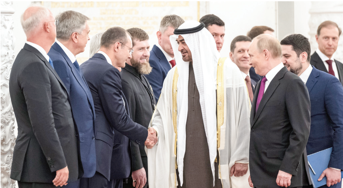
محمد بن زايد وفلاديمير بوتين خلال مصافحة أعضاء الجانب الروسي