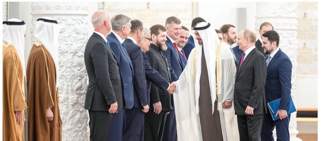
رئيس الدولة مصافحاً سيرجي ريباكوف نائب وزير الخارجية الروسي بحضور فلاديمير بوتين