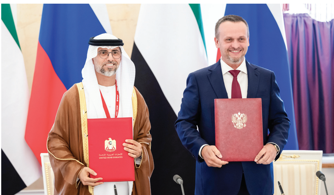
سهيل المزروعبي وأندريه نيكيتين لدى تبادل المذكرة