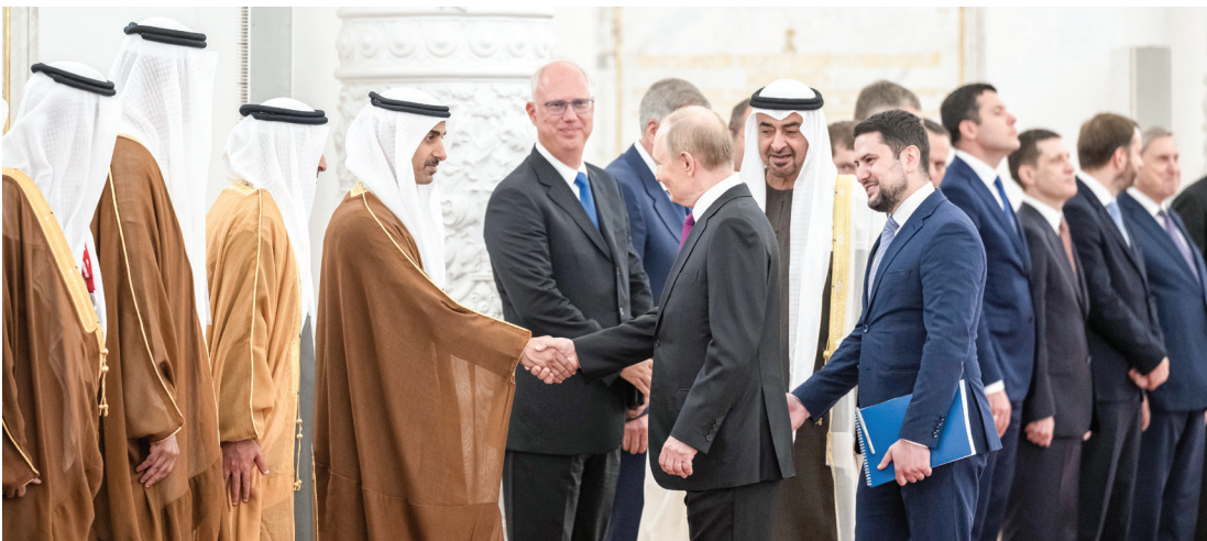
سموه خلال مصافحة بوتين لحمدان بن محمد بن زايد