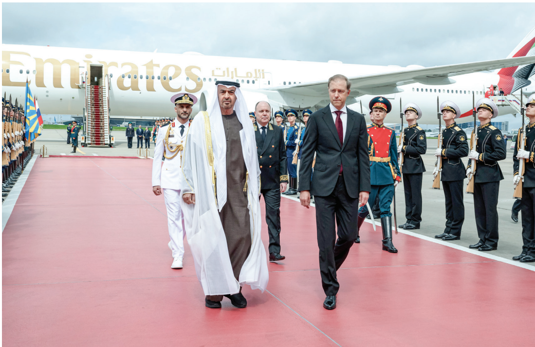
محمد بن زايد لدى وصوله موسكو بحضور دينيس مانتيروف النائب الأول لرئيس الوزراء الروسي

السلام الوطني للبلدين، وصافح سموه كبار مستقبليه، فيما صافح الرئيس الروسي الوفد المرافق لسموه. ووصل صاحب السمو الشيخ محمد بن زايد آل نهيان، رئيس الدولة، حفظه الله، إلى موسكو في زيارة رسمية إلى روسيا الاتحادية.