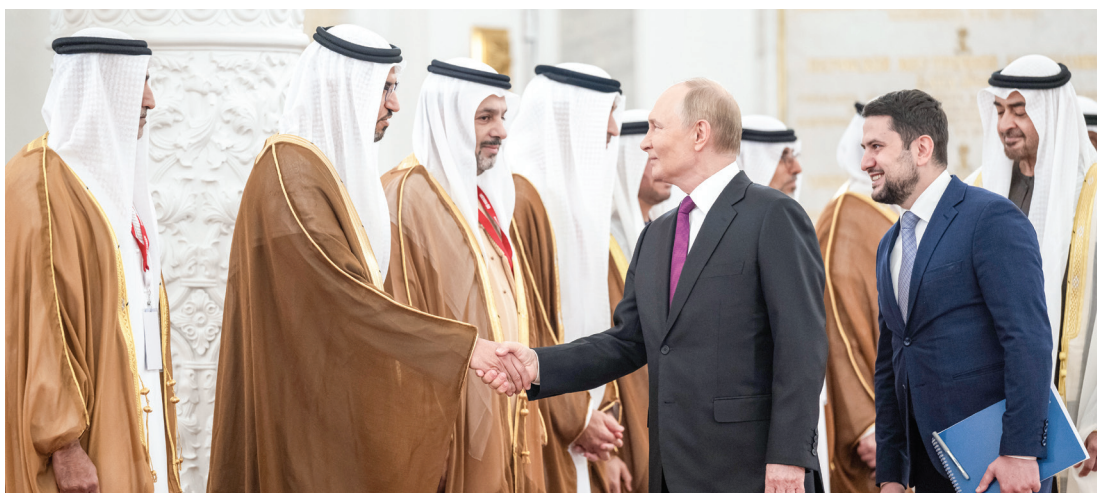
سموه لدى مصافحة بوتين لمحمد الجابر بحضور سهيل المزروعى وفيلس البناي