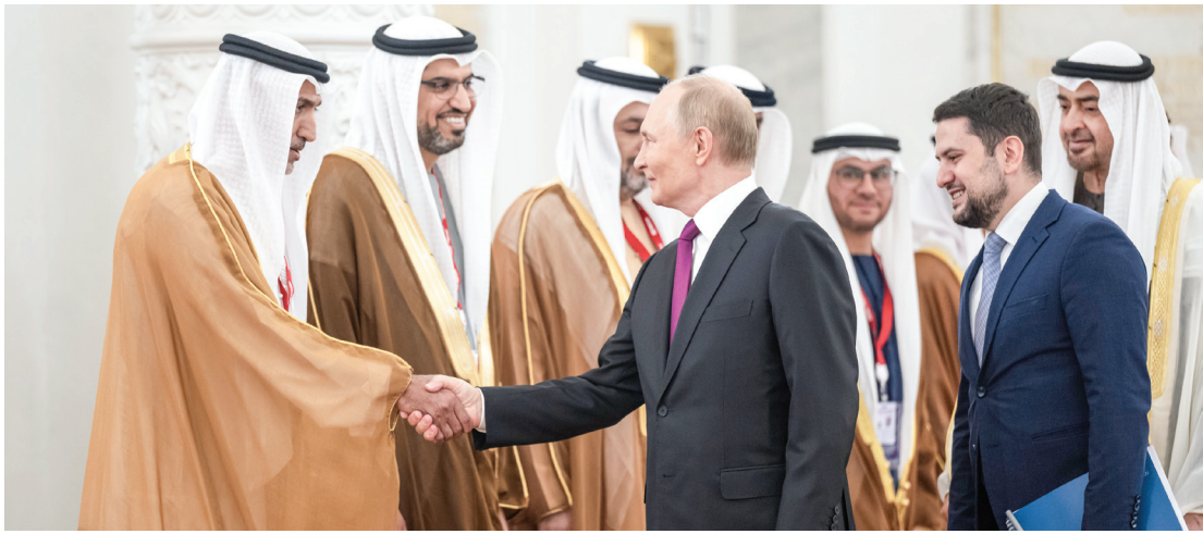
محمد بن زايد خلال مصافحة بوتين لمسلم الراشدي بحضور فيصل البناي وأحمد المزروعى ومحمد الجابر