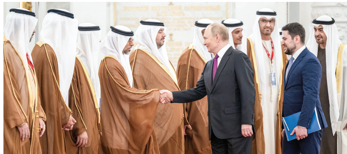
محمد بن زايد خلال مصافحة الرئيس الروسي لسهيل المزروعى بحضور علي الشامسى وسلطان الجابر ومحمد السويدي