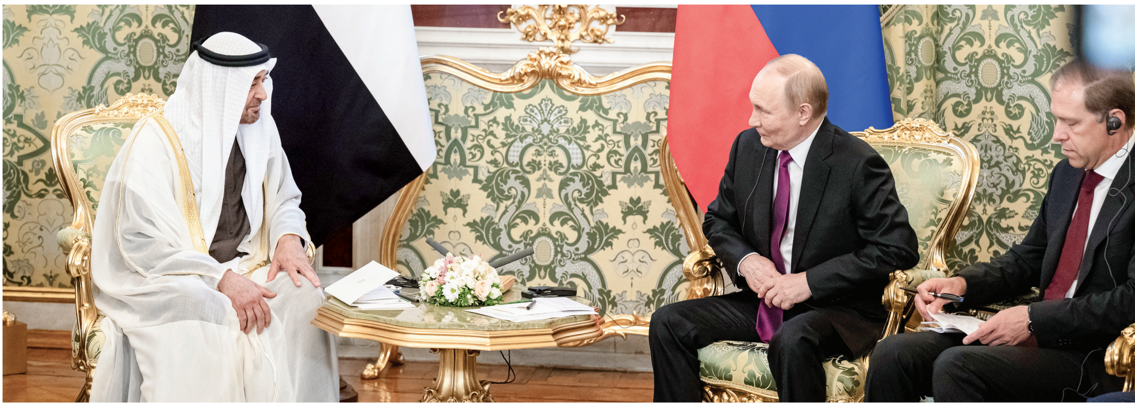
محمد بن زايد وفلاديمير بوتين خلال اللقاء

بحث مع الرئيس الروسي في موسكو سبل تعزيز الشراكة الاستراتيجية بين البلدين