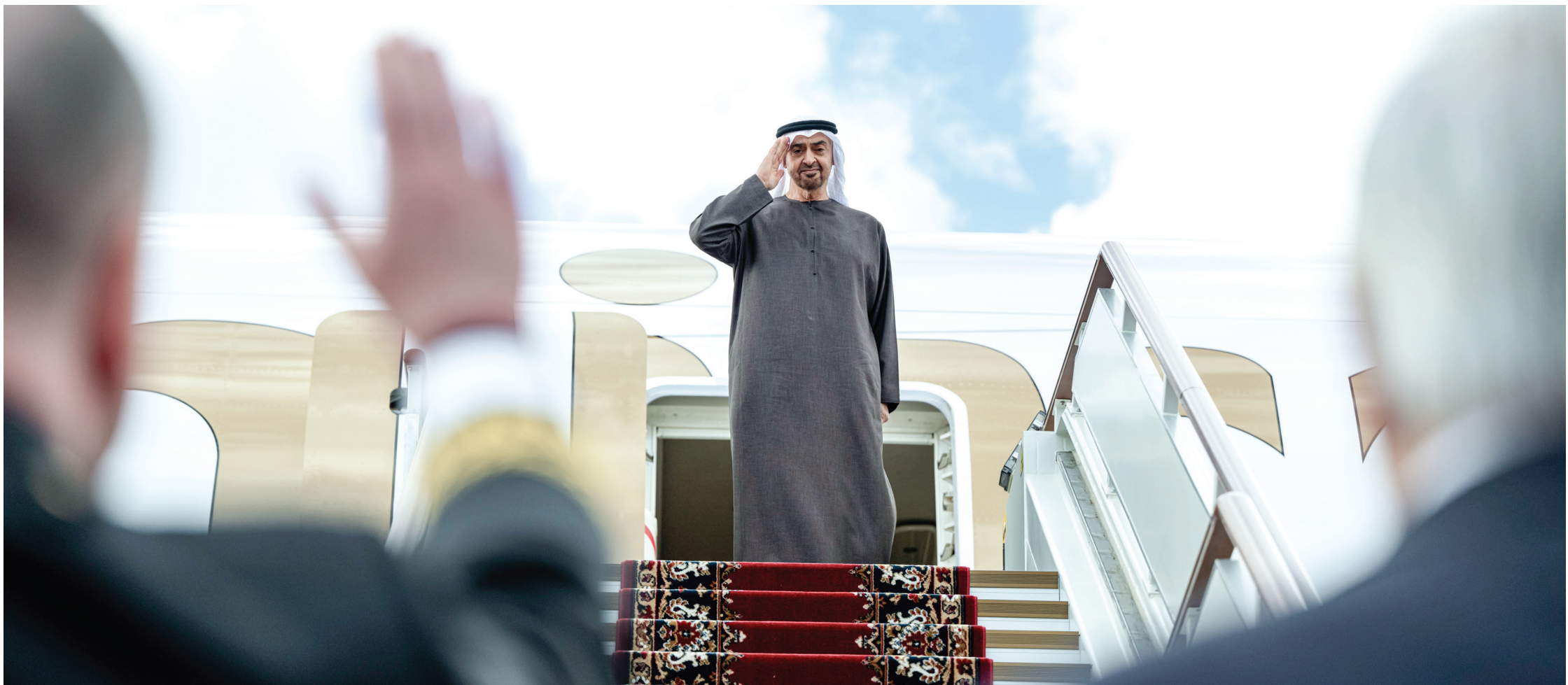
محمد بن زايد لدى مفارته المطار