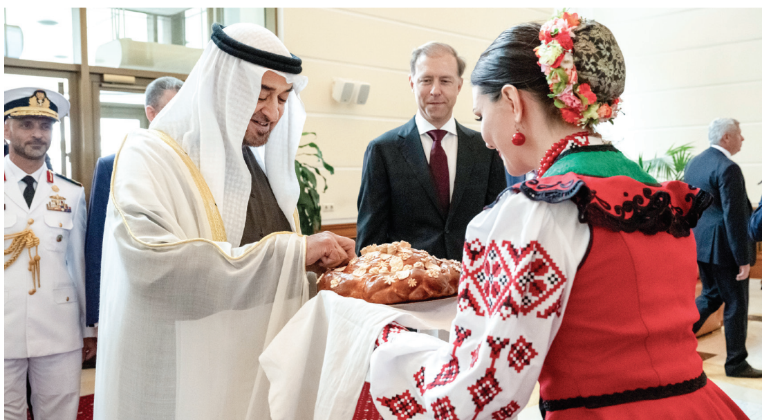
محمد بن زايد خلال الاستقبال بحضور دينيس مانتوروف

من جانبه، رحب الرئيس فلاديمير بوتين بصاحب السمو رئيس الدولة في روسيا معرباً عن شكره وتقديره للجهود المتواصلة التي تقوم بها دولة الإمارات، وتسفر عن نجاح تبادل الأسرى بين روسيا وأوكرانيا. وأكد أن روسيا تولي اهتماماً كبيراً بتطوير علاقاتها مع دولة الإمارات، مشيراً إلى أن التعاون الإماراتي - الروسي يشهد نمواً ملحوظاً، خاصة في المجالات الاقتصادية والاستثمارية وغيرها من المجالات. وأقام الرئيس الروسي مأدبة غداء تكريماً لسموه والوفد المرافق. وحضر جلسة المحادثات الوفد المرافق لصاحب السمو رئيس