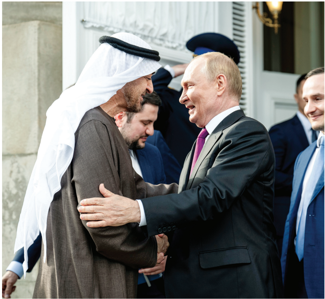
رئيس الدولة مودعاً فلاديمير بوتين