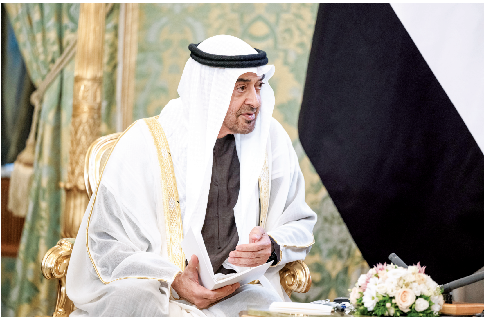
رئيس الدولة خلال اللقاء

محمد بن زايد وبوتين يستعرضان مسارات التعاون في الاقتصاد والتجارة والاستثمار والفضاء والطاقة