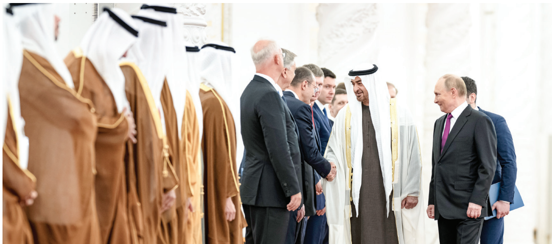
سموه مصافحاً أعضاء الجانب الروسي