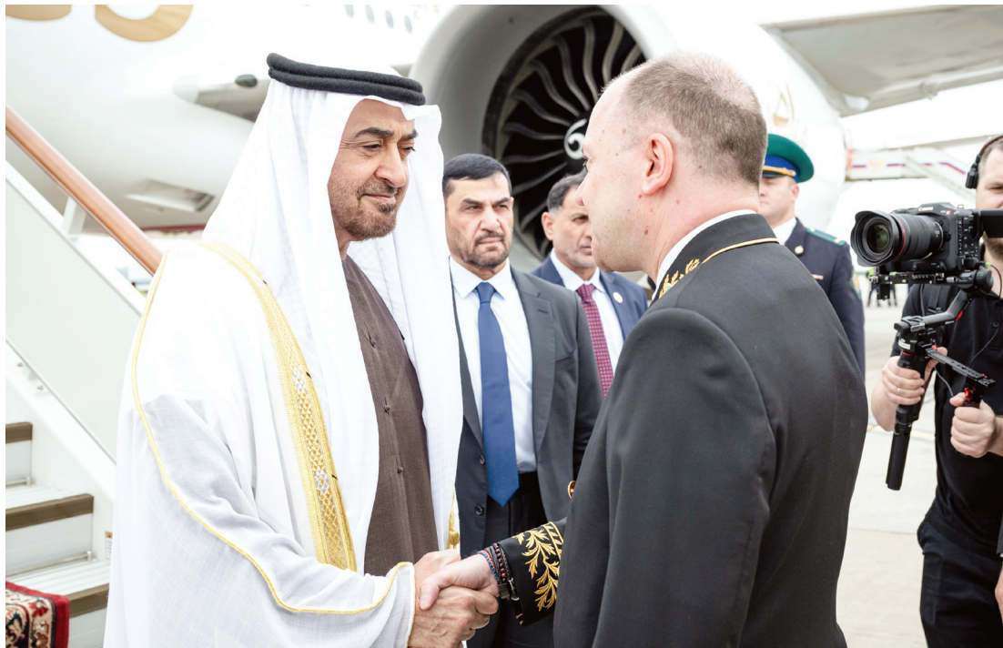
محمد بن زايد مصافحاً أحد أعضاء الوفد الروسي