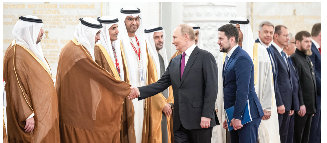
سموه لدى مصافحة بوتين لأحمد الصايغ بحضور حمدان بن محمد بن زايد ومحمد بن حمد بن طحون وعلي الشامي وسلطان الجابر ومحمد السوداني