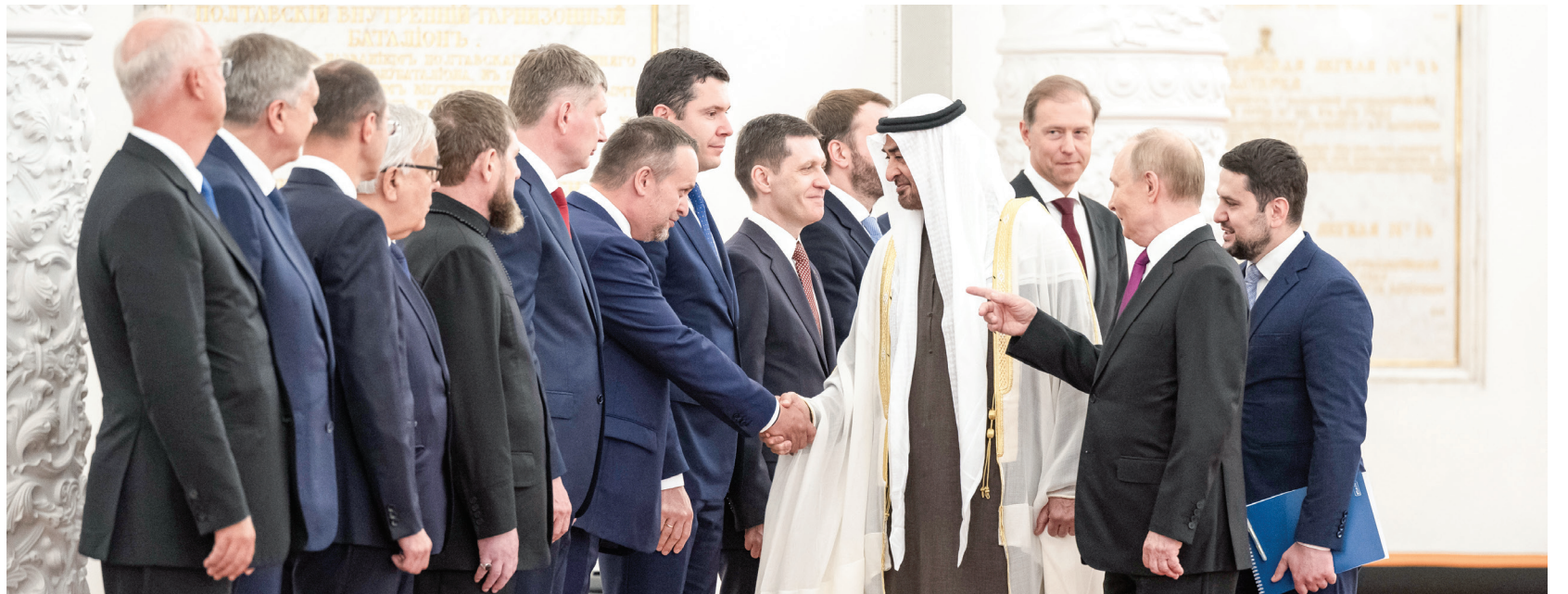
رئيس الدولة لدى مصافحته أندريه نيكيتين وزير النقل الروسي بحضور فلاديمير بوتين

أكد صاحب السمو الشيخ محمد بن زايد آل نهيان رئيس الدولة، حفظه الله، أن نهج الإمارات الراسخ والمتواصل يتمثل بدعم التعاون الدولي من أجل مواجهة التحديات العالمية، وتحقيق السلام والاستقرار والازدهار على المستويين الإقليمي والعالمي. وقال، أمس، في تدوينة عبر حسابه الرسمي على منصة «إكس»: «خلال لقائنا اليوم في موسكو، بحثت مع الرئيس فلاديمير بوتين علاقات الشراكة الاستراتيجية بين بلدينا، والعمل المشترك لتعزيزها بما يخدم تطلعاتنا التنموية المشتركة. نهج الإمارات الراسخ والمتواصل دعم التعاون الدولي من أجل مواجهة التحديات العالمية وتحقيق السلام والاستقرار والازدهار على المستويين الإقليمي والعالمي لمصلحة جميع الدول وشعوبها».