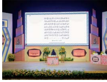
أصوات ندية في مسابقة الشيخة فاطمة للقرآن