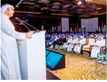
بحث سبل استفادة قطاع البناء من الذكاء الاصطناعي