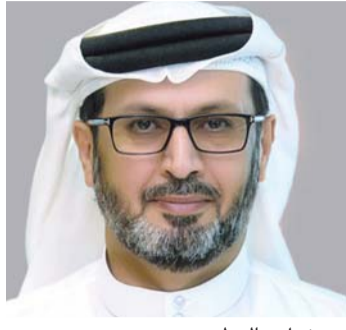
■ ضرار بالهول

وقال «لقد حرص صاحب السمو الشيخ خليفة بن زايد آل نهيان، رئيس الدولة، حفظه الله، منذ توليه مقاليد الحكم على مواصلة النهج والمبادئ القيمة التي رسخها الشيخ زايد، ومسيرة سموه حافلة بالعطاء والبذل لخدمة الوطن والمواطن من خلال توفير أرقى مقومات العيش الكريم والخدمات التعليمية والصحية والرعاية الاجتماعية، وغيرها من المتطلبات الضرورية التي تؤمن للإنسان على أرض هذه الدولة الحياة الطيبة والرفاهية».