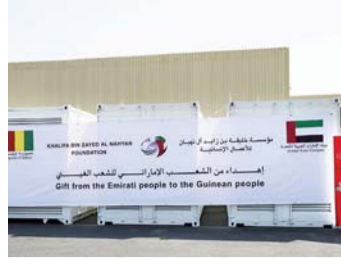
الإمارات تزود غينيا بمولدات كهرباء