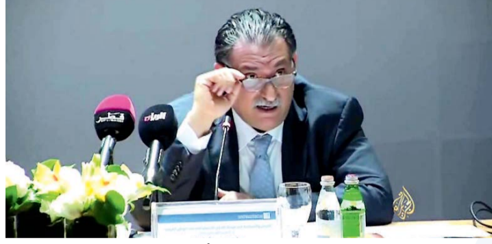
عزمي بشارة عزاب الخراب عبر شاشة الجزيرة | أرشيفية

تدفعها قطر لشق الصف، يمكن أن يتخرب عند أول نداء للالتفاف حول راية الوطن». وقال الكاتب الإماراتي سلطان العميمي: «تعلمت من الأزمة الخليجية، أن ما كان يحكه نظام الحمدين سراً لدول المنطقة، أكبر مما يتخيله بعضهم.. والسنوات القادمة ستكشف عن خفايا أكبر». ومن ناحية أخرى، قال أحد المواطنين القطريين: «تعلمت من الأزمة الخليجية، أن سبب الفتنة هو إعلامنا الهابط، وأن داعم وممول الإرهاب لا يخرج من حيز الحمدين». وقال خالد آل سعود: «تعلمت أن دول الخليج ملك لمواطنيها، أما قطر، فهي تحت تصرف وإدارة المرتزقة والإرهابيين».