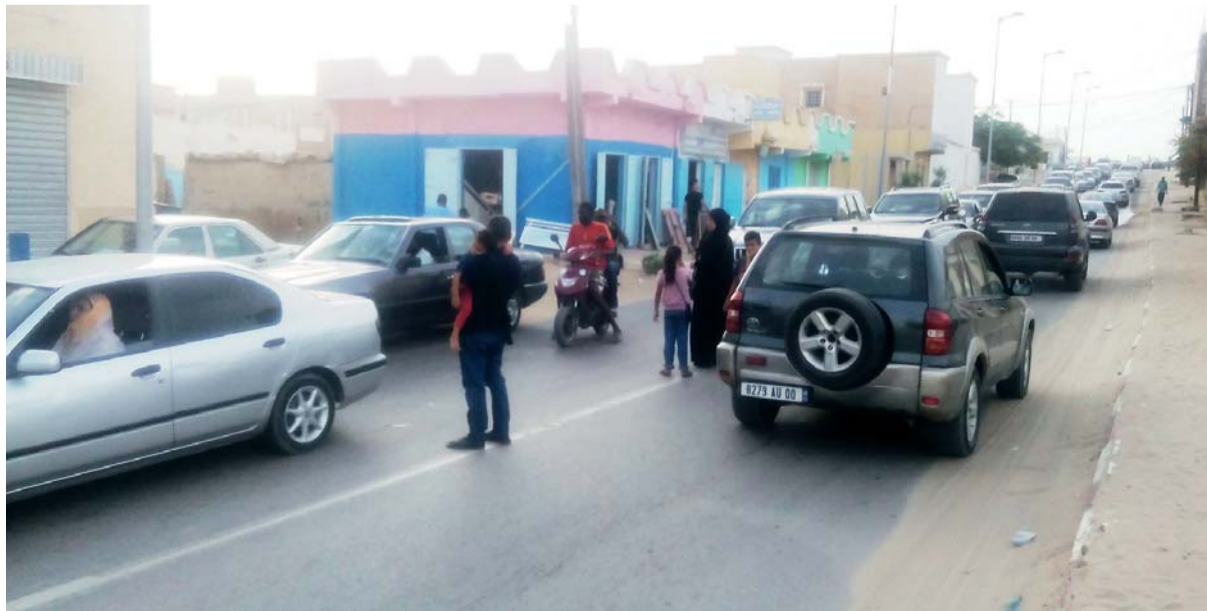
امرأة سورية مع أطفالها في أحد شوارع نواكشوط