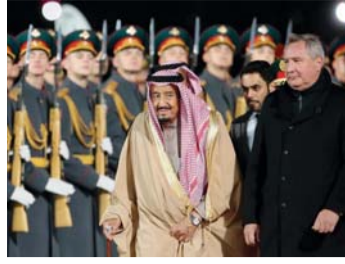
خادم الحرمين يبدأ زيارة إلى موسكو