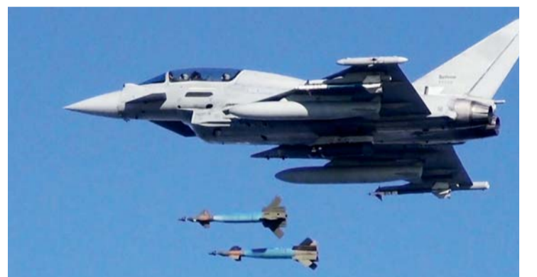
■ المقاتلة البريطانية تايفون