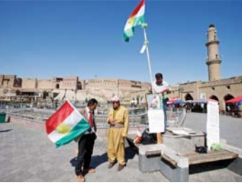
دعوات كردية للتراجع عن نتائج الاستفتاء