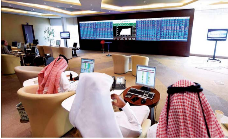
■ تراجع مستمر في أداء الأسهم القطرية | أرشيفية

الأسمه بنحو 1,44% أو 34,53 نقطة ليلعب مستوى 2369,22 نقطة. وامتدت الخسائر إلى المؤشرات القطاعية مع هبوط مؤشر أسهم العقارات بنسبة 2,99% ومؤشر أسهم التأمين بنسبة 1,91% ومؤشر أسهم البنوك والخدمات المالية بنسبة 1,5% ومؤشر أسهم الاتصالات بنسبة 1,1% ومؤشر أسهم الصناعة بنسبة 1,05%.