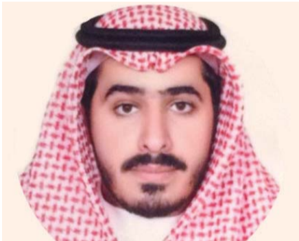
■ حمد المري

القطرية عنهم، قائلاً: «بدأت القصة في العام 1996 عندما قام بعض العسكر الأحرار بمحاولة استرجاع السلطة من الشيخ حمد بن خليفة آل ثاني وردها لوالده الشيخ خليفة بن حمد، فتم اكتشاف الانقلاب قبل وقوعه، عندها أجريت عمليات الاعتقالات ضد جميع من شاركوا أو كانت لهم صلة قرابة من بعض المتهمين، وبعضهم ليس له لا ناقة ولا جمل.. تم زجهم في السجون، وتم تعذيبهم أشد العذاب تحت ذريعة الاستجواب القسري».