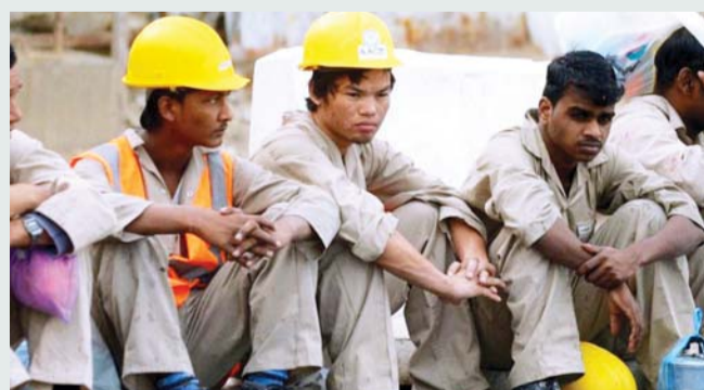
■ المازق الاقتصادي في قطر أدى إلى نزيف في العمالة | أرشيفية