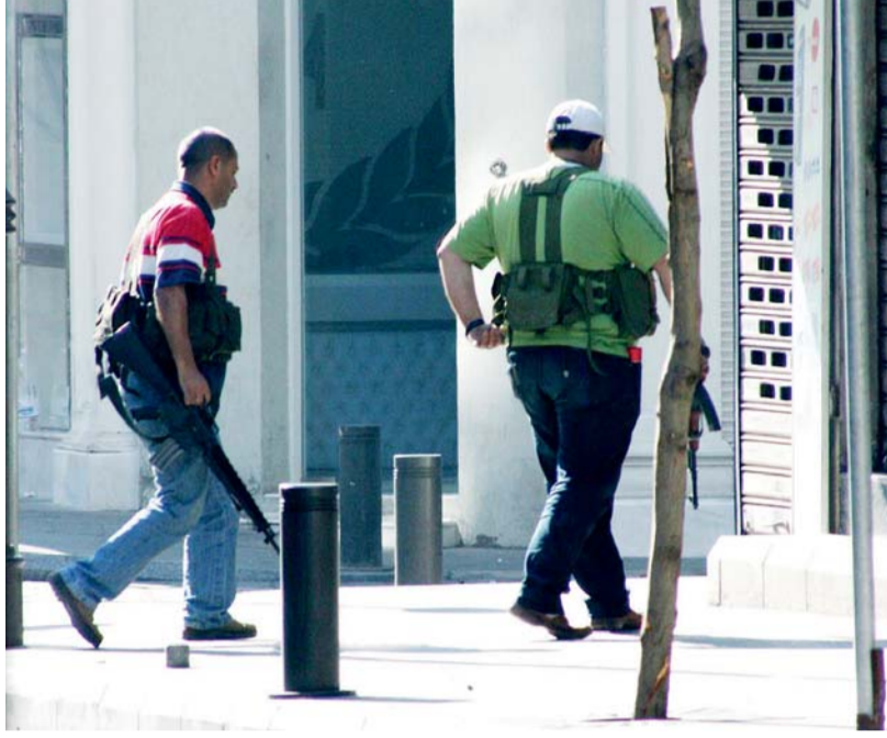
■ من مشاهد سيطرة ميليشيات حزب الله على بيروت 2008 | أرشيفية