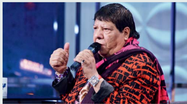
■ شعبان عبدالرحيم