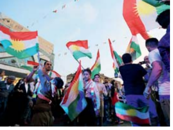
تنسيق ثلاثي للضغط على كردستان