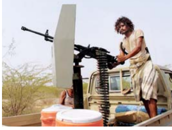
التحالف يدمر معامل أسلحة للحوثي