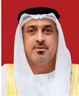
■ سلطان بن خليفة

وقال سموه - في كلمة له بمناسبة «يوم الشهيد» الذي يصادف 30 نوفمبر من كل عام -: «دماء شهدائنا الأبرار سالت لكي تروي قصص العزة والكرامة لهذا الوطن، شهدائنا قدموا أنفسهم من أجل إرساء وترسيخ قيم جميلة وعديدة،