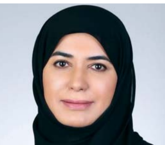
■ هنا السويدية