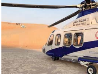
«الإسعاف الجوي» في أبو ظبي ينقذ مصاباً