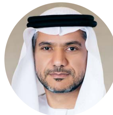
■ عويضة المر