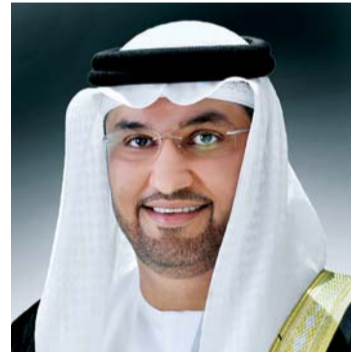
■ سلطان الجابر