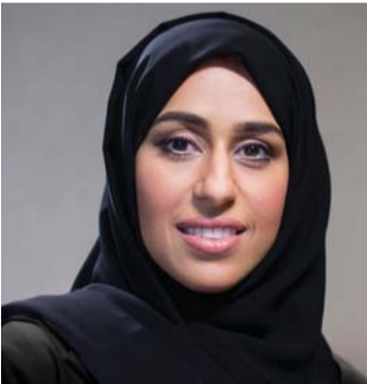
■ حصة بوحמיד

الإمارات البواسل. وذكر معاليه أن شهداء الإمارات قدوة لجيل الشباب ولكل إماراتي وعربي، وأن تضحياتهم ستبقى نبراساً يضيء دربنا، وسيفتح الجميع بإنجازاتهم العظيمة في ميادين الشرف والعز والفداء.