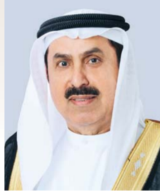
■ صقر غباش

تقدريوقال معاليه في كلمة بمناسبة يوم الشهيد: إن إحساس القيادة بنض الشعب تجاه هؤلاء الشهداء،