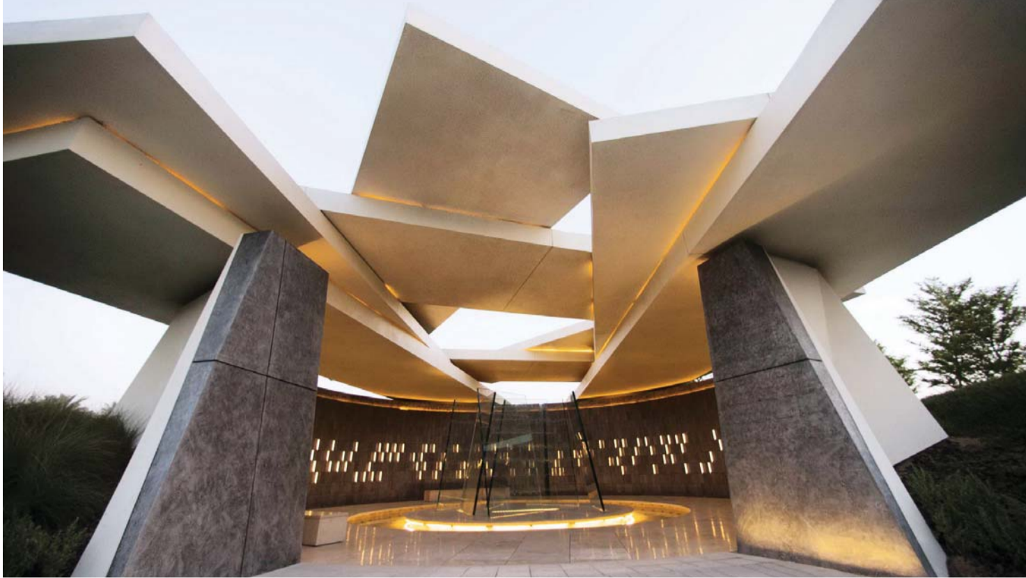
شهداءنا الأبرار جسدوا بإخلاص قيم التضحية والعطاء