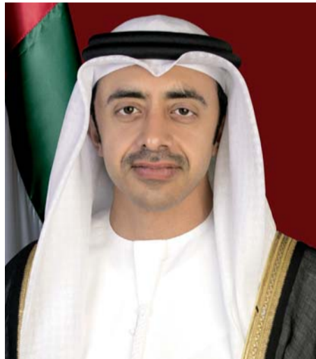
■ عبدالله بن زايد

في الثاني من ديسمبر، يعزز في كل واحد فينا ثقته بنفسه ووطنه وقيادته، فهذه الدولة التي قدمت نموذجاً حضارياً بين دول العالم المتقدمة، استطاعت بكل حكمة أن تحقق مكتسبات وتصنع منجزات عصرية في مختلف المجالات، وتبنت في الوقت ذاته سياسات السلم وتعزيز الأمن والاستقرار، ومكافحة التطرف بكل أشكاله، وصنعت نموذجاً في القدرة العسكرية الفذة، بقواتها المسلحة، وتدريبها واحترافها، وخبراتها الميدانية، وصولاً إلى مشاركة المرأة في العمل العسكري، وإدراج الشباب في برنامج الخدمة الوطنية الذي يمنح الشباب والفتيات الفرصة للمساهمة في تعلم مهارات جديدة وحماية بلادهم من الطامعين والغابثين، وأصحاب كل أجندة تترص بهذه المنطقة، وتريد زعزعة السلم الإقليمي. لقد كان اتحاد دولة الإمارات الذي نحتفي بذكره الثامنة والأربعين بعد أيام ميلاداً لفكرة فريدة آمن بها الشيخ زايد وأخوته المؤسسون، حيث استشفوا المستقبل وسعوا جاهدين في سبيل تحقيق حلم الوحدة، الذي شكك فيه الكثيرون، فالتجارب التي سبقتنا لم تبشر بالخير، لكن عزيمة المؤسسين وتكاتف أبناء هذه الأرض جعل الحلم حقيقة، بل وتجاوزت نتائجه كل التوقعات، فلقد حققت دولة الإمارات نتائج مبهرة في مختلف القطاعات الحيوية على مستوى العالم، كالبنية التحتية، والازدهار الاقتصادي، والاستقرار الأمني وتعزيز التسامح وتنمية الموارد الاقتصادية غير النفطية، ناهيك عن الإنجازات التي تحققت في مجالات التكنولوجيا وعلوم الفضاء، وكان آخرها إرسال أول رائد فضاء إماراتي إلى محطة الفضاء الدولية وإجراء تجارب علمية عدة.