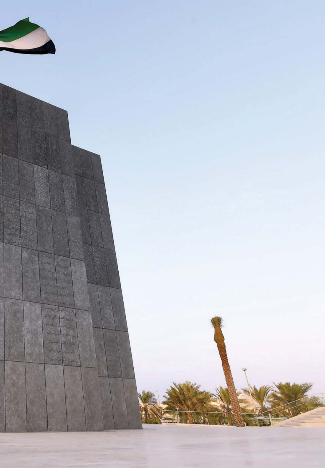
■ تضحيات شهداء الإمارات ستبقى خالدة في ذاكرة الأمة | أرشيفية