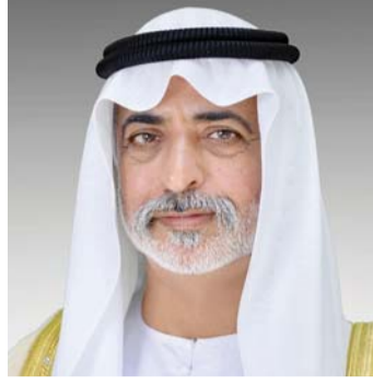
■ نهيان بن مبارك

وقال العويس إن هذا اليوم يشكل حضوراً لأبناء الوطن الشهداء في الذاكرة الوطنية، فالشهداء قدموا أعلى ما يملكون لصفون راية الوطن خلف القيادة الرشيدة لصاحب السمو الشيخ خليفة بن زايد آل نهيان، رئيس الدولة، حفظه الله، وصاحب السمو الشيخ محمد بن راشد آل مكتوم، نائب رئيس الدولة رئيس مجلس الوزراء حاكم دبي، رعاه الله، وصاحب السمو الشيخ محمد بن زايد آل نهيان، ولي عهد أبوظبي نائب القائد الأعلى