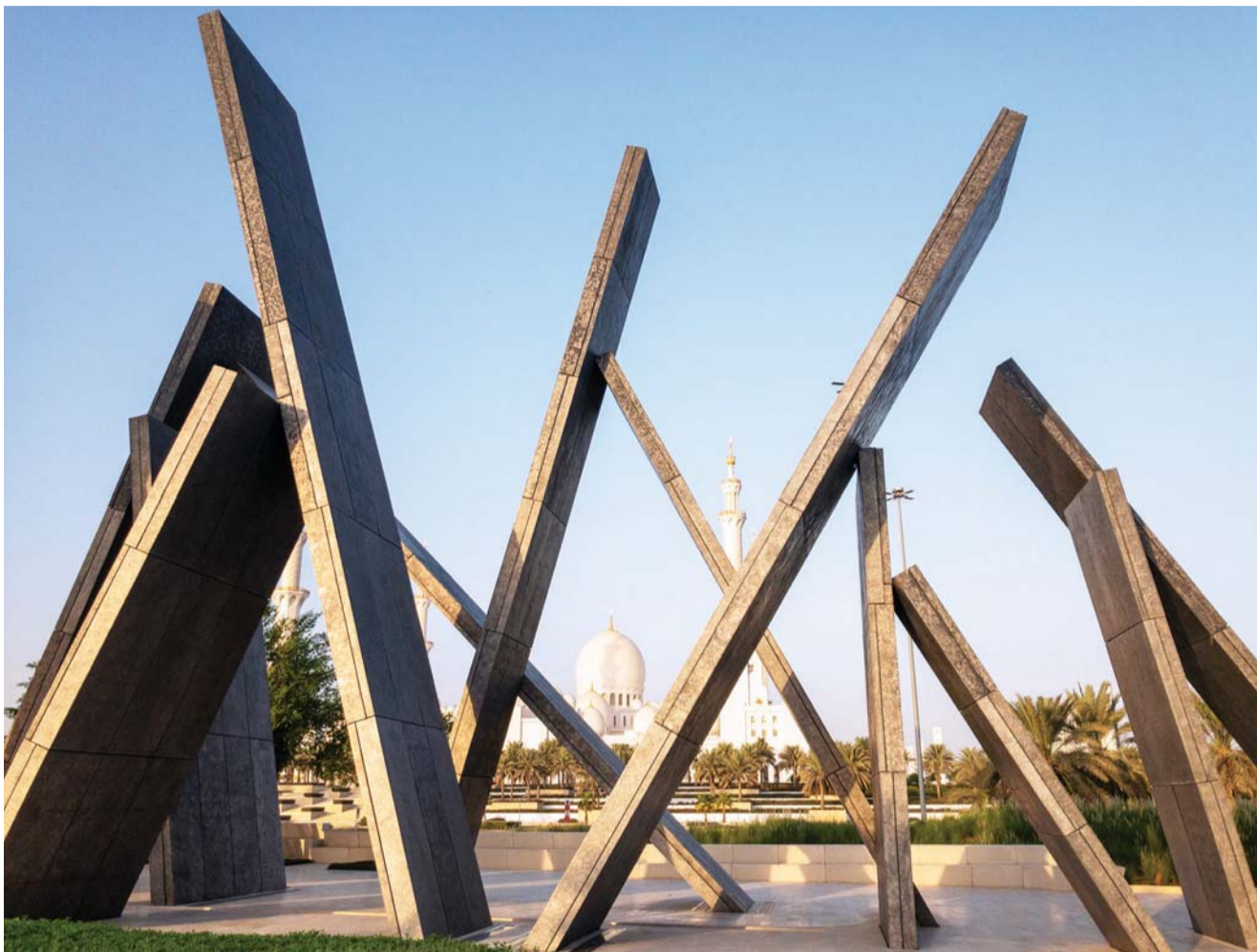
شهداء الإمارات لبوا النداء ليسطروا أروع الملاحم في ميادين الحق والشرف

وأكدت سموها أن الشهداء سجلوا بدمائهم أروع الأمثلة في التضحية، ما يضعنا أمام مسؤولية عظيمة، ولنكون أكثر اتحاداً وتضامناً، وأكثر التزاماً وإخلاصاً، وأن نحمل مشاعل الأمل التي أضاءها الشهداء لمواصلة طريق البناء والنهضة فنتسردهم بطولات شهدائنا لتمكين دعائم دولتنا، ونحشد الجهود لمواصلة مسيرة البناء والتنمية، وكتابة فصول المجد. واختتمت سموها قائلة: إن أبنسة الإمارات معطاءة بقدر الوطن المعطاء، فهي ابنته التي قدرت حقه عليها أبلغ تقدير جادته بفلذات الكبد، وقدمت النفس والتفيس وهو أغلى ما عندها للدفاع عن مكتسبات الوطن وحدوده، وهي بذلك تنال رضا الله ورضا الوطن عنها وتقدم الواجب تجاهه، رحم الله شهداءنا وأسكنهم فسيح جناته، وتحية إلى أمهاتهم وأبنائهم وذويهم الذين يستحقون الاحترام والتقدير والرعاية المستمرة لهم.