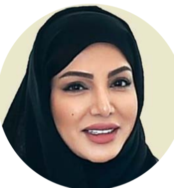
■ روضة السعدي