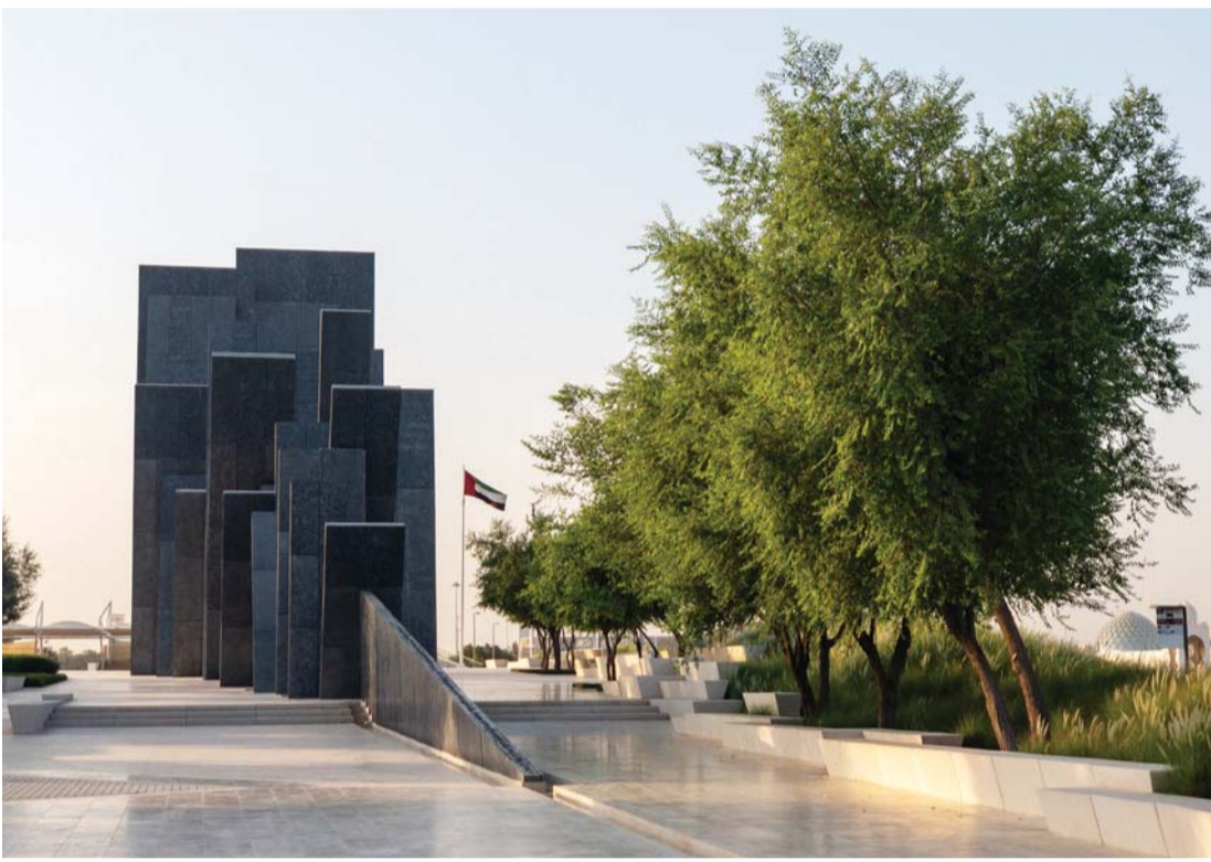
■ واحة الكرامة تجسد الملحمة البطولية للشهداء الأبرار | تصوير: أحمد بدوان

وفي تدوينة عبر حسابه في «تويتر» قال سمو الشيخ مكتوم بن محمد بن راشد: «في يوم الشهيد تنحني الأمة أمام تضحيات أبنائها الذين عطروا ترابها الطاهر بدمائهم.. شهداء الإمارات ضحوا بأرواحهم الغالية ليبقى الوطن الغالي أعلى.. واليوم هذه الأرواح تظل راية دولتنا.. ذكراهم الحية في القلوب تشهد على مجد الإمارات وعزة قادتها وكرامة شعبها المحفوظة».