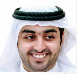
■ راشد بن حمد

أكد الشيخ الدكتور راشد بن حمد الشرقي رئيس هيئة الفجيرة للثقافة والإعلام أن قيم العطاء تتجلى بأبهى معانيها في «يوم الشهيد»، تلك التي جسدها أبناء الإمارات، وترجموها في الميادين العسكرية والإنسانية على حد سواء، فكانوا أهلاً للسير وأهلاً للخير.