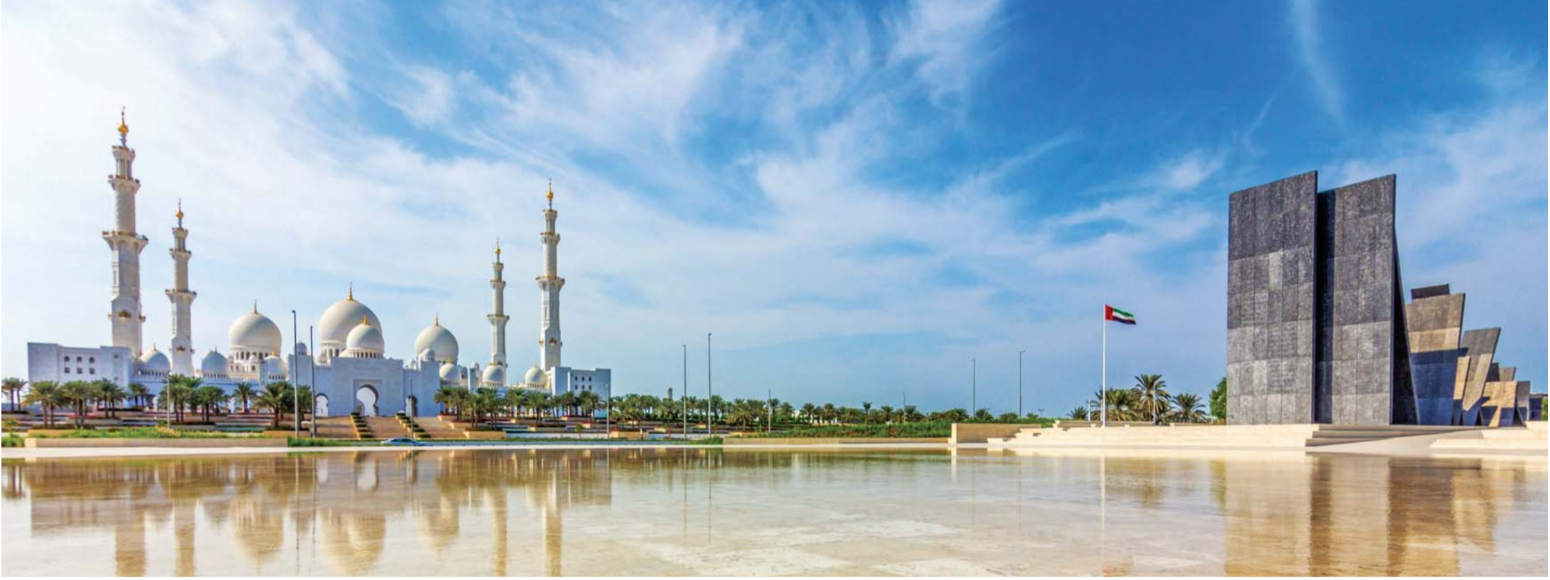
الكرامة والخلود لشهدائنا الذين صدقوا ما عاهدوا الله عليه | أوشيفية

■ تتلأأ أمامنا أسماء الكوكبة المباركة المنقوشة في لوحات واحة الكرامة فنزداد يقيناً بأن دولتنا قوية بأبنائها