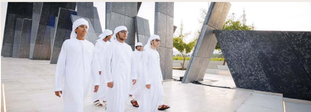
فريق المغاوير خلال الزيارة

عظيمة في جميع المجالات التنموية وفي مقدمتها بناء الإنسان الذي يمثل ثروة الوطن هذا الإنسان الإماراتي الذي فخر بتميزه في جميع مناحي العمل الوطني، إذ أصبح المواطن الإماراتي نموذجاً للتنمية البشرية الرائدة على مستوى العالم.