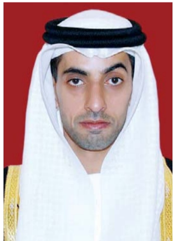
■ خالد بن زايد

وقال سموه في كلمة بمناسبة «يوم الشهيد»: «إننا في مؤسسة زايد العليا لأصحاب الهمم رئيساً وأعضاء مجلس الإدارة والكوادر الإدارية والتربوية والمنتسبين إليها من أصحاب الهمم، نؤكد أن شهداء الوطن سيظلون في ضمير ووجدان كل فرد منا، كما أننا جميعاً نقف خلف القيادة الرشيدة مدافعين عن الحق جيوشاً من المقاتلين بالسلاح والكلمة والموقف، ونسأل المولى عز وجل أن يسكن شهداء الوطن