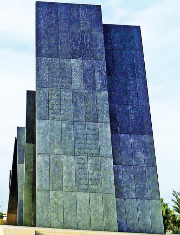
يوم الشهيد تخليد لأبطال من أبناء الإمارات وتضحياتهم العظيمة | أرشيفية