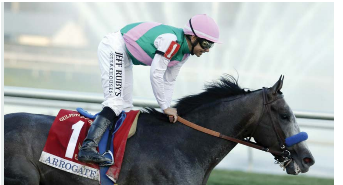
■ أوجبت جاهز للمنافسة الشرسة في الشوط الرئيسي