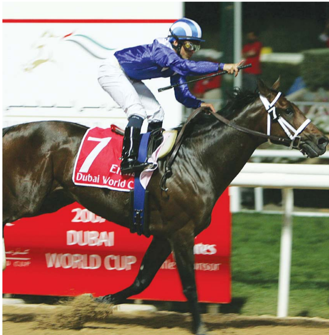
«انفاسور» لحظة فوزه بكأس دبي العالمي 2007 | البيان

وتعتبر الجائزة التي حصل عليها سمو الشيخ حمدان بن راشد آل مكتوم، الثالثة التي تذهب لشخصية عربية، حيث سبق أن نالها صاحب السمو الشيخ محمد بن راشد آل مكتوم، كما حصل عليها الأمير خالد بن عبدالله في 2002. وبعد ختام سباقات المضمار في الموسم البريطاني في 8 نوفمبر 2015، تم تحديد أبطال الملاك والمدربين والفرسان المتميزين. وحسم سمو الشيخ حمدان بن راشد آل مكتوم لقب بطولة الملاك مبكراً على أساس الجوائز المالية، حيث حققت خيول سموه الفوز 130 مرة بمجموع جوائز مالية قدرها 3,6 ملايين جنيه استرليني، وجاء وصيفاً فريق جودلفين بعد تحقيقه أكبر عدد من الانتصارات.