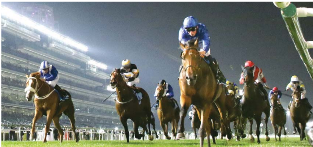
■ كأس دبي العالمي اكتسب شهرة عالمية واسعة | البيان

تُبنى آمال اليابان في السباق على الخيول أواردي أند لاني، المملوكات لوجي مايدا. أواردي البالغ من العمر سبع سنوات هو الأخ الأكبر غير الشقيق لاني البالغ من العمر أربع سنوات، تم توليد كلاهما في كنتاكي. لا يعتبر أحدهما من أقوى المنافسين، ولكن من الجدير بالذكر دائماً أن أولئك الذين يعرفون هذه الخيول عن كثب لن يترددوا بالتسجيل والمشاركة في سباق مثل كأس دبي العالمي إلا إذا كانوا على ثقة بأنه