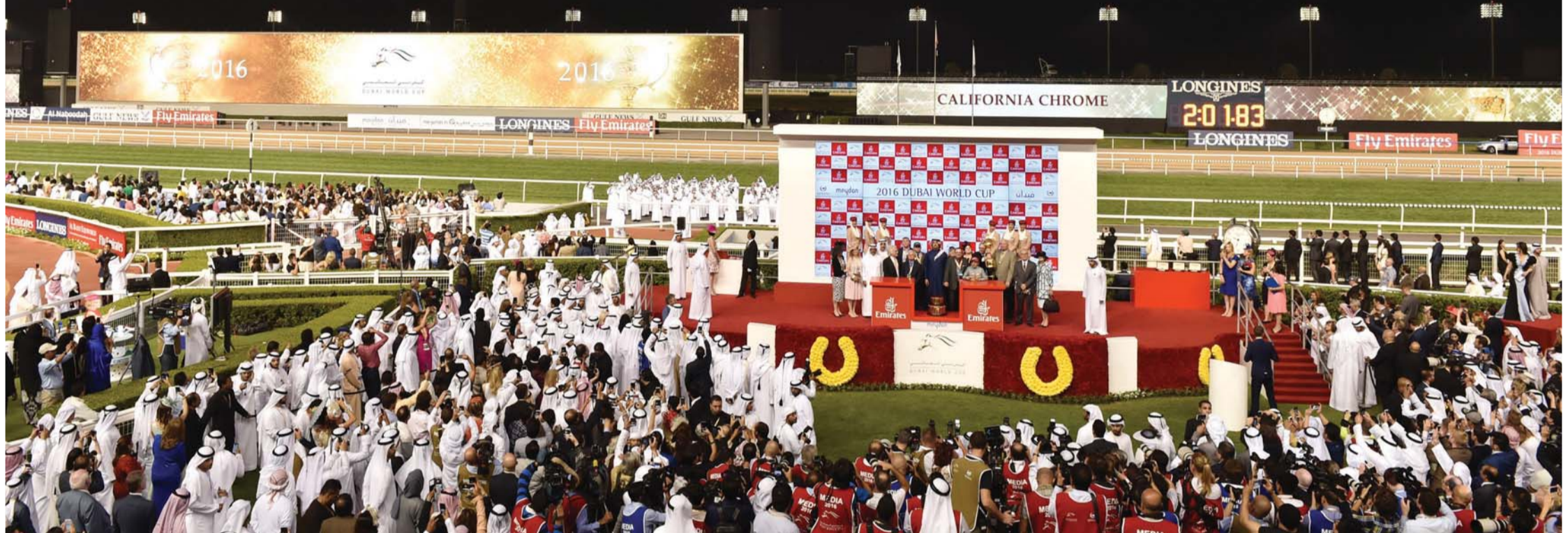
كأس دبي العالمي حدث استثنائي في عيون الناس | البيان

حقيقة أهمية توجيه النشء والأبناء نحو رياضة الفروسية التي أوصى بها الرسول الكريم محمد صلى الله عليه وسلم، واستطاع السباق الأعلى على مستوى العالم أن ولفت أنظار الكثير من الأسر وأولياء الأمور الذين أدركوا أهمية رياضة الفروسية ودورها الإيجابي على أبنائنا. وأشاد تركيشي من اليابان بالنجاح الذي حققه كأس دبي العالمي لاسيما في أمسية أمس، وقال إن الحدث باعتباره مؤثراً على جميع أنحاء العالم، فإن المهتمين بعالم الخيل في اليابان، يتذكرون الإنجاز السابق والوحيد لهم في الكأس الأعلى حينما حققت المهرة «فيتوريا بيسا» اللقب الأعلى في 2011 بقيادة الفارس الياباني ميركو ديمورو وإشراف المدرب كاتسو هيكو سومي.