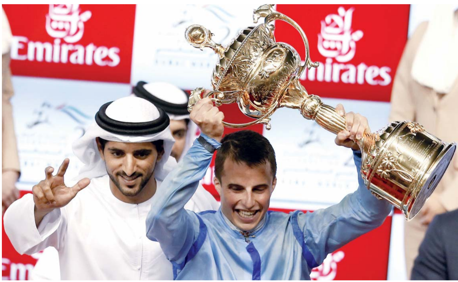
سموه يحتفل بالفوز مع الفارس بارزلونا | البيان

تملك خيول سمو الشيخ حمدان بن محمد آل مكتوم سجلاً مشرفاً من الإنجازات الباهرة في سباقات الخيل المحلية وخاصة في كأس دبي العالمي. ويحمل سموه لقب البطولة العام قبل الماضي 2015، حيث نال «برنس سرور» لقب البطولة بجدارة واستحقاق، ودخل سموه سجل البطولة التاريخي، وهذا غير مستبعد عن سمو الشيخ حمدان بن محمد آل مكتوم الفارس الملمه، والذي يحمل لقب بطولة العالم للقدرة في فرنسا 2014.