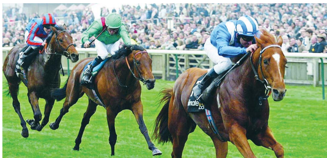
إنجازات باهرة لخيول حمدان بن راشد في المضامير الأوروبية