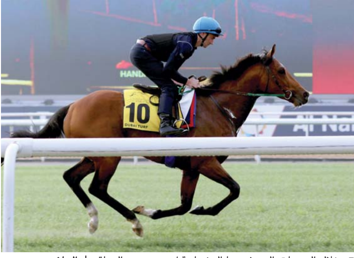
■ خلال التدريبات التي شهدها المضمار قبل يومين من السباق

رئيس التحرير المسؤول: منى بوسمره رئيس التحرير التنفيذي: رياض مقداي مدير التحرير للشؤون الفنية: إبراهيم الحساوي التصميم الفني: أحمد حواش إشراف: أحمد الحوري إعداد: بهاء الدين عطا - ياسر قاسم - خالد المهيري علي الظاهري - رشا عبدالمنعم متابعة: عز الأسواني - هشام السبع - محمود سعيد