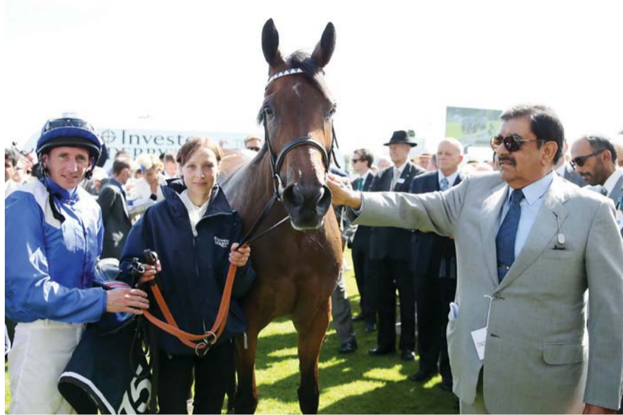
حمدان بن راشد يرت على بطولة الأوكس «تغرودة»