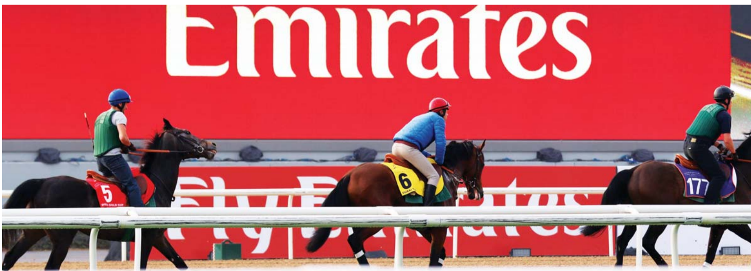
■ جانب من تدريبات الفرسان الأخيرة

المعلا إن عدد الطائرات في اسطول طيران الإمارات يتجاوز 260 طائرة تتوجه رحلاتها إلى أكثر من 150 محطة عالمية في القارات الست، مما يعكس إيجاباً على الفعاليات والأحداث التي تستضيفها دبي وأبرزها كأس دبي العالمي، مشيراً إلى أنهم حريصون على رعاية الكثير من سباقات الخيول الأخرى حول العالم منها سباق ملبورن أحد أشهر الفعاليات في العالم الذي يقام في أستراليا، إلى جانب عدد من السباقات الأخرى في بريطانيا وغيرها من الدول، مؤكداً حرصهم على رعاية العديد من سباقات الفروسية حول العالم.