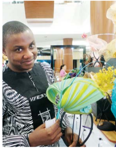
■ كينجسلي أميس

الخامات ويضيف مصمم القبعات النجيري كينجسلي أميس أن لون الخامة مهم جداً عند اختيار القبعة، لأنه يؤثر بشكل مباشر في السحنة، فذوات البشرة الباهتة، مثلاً، تناسب درجات الزهري، أما صاحبات البشرة الدافئة فهن أكثر حظاً، إذ تناسبهن مختلف الألوان، كما أن تغيير ألوان القبعات وخاماتها عند تبدل الفصول أمر ضروري. وتبقى أقمشة الحرير والشيفون كما الجيرسيه والبروكار وما شابهها مناسبة على مدى السنة، خصوصاً في كأس دبي العالمي للخيل.