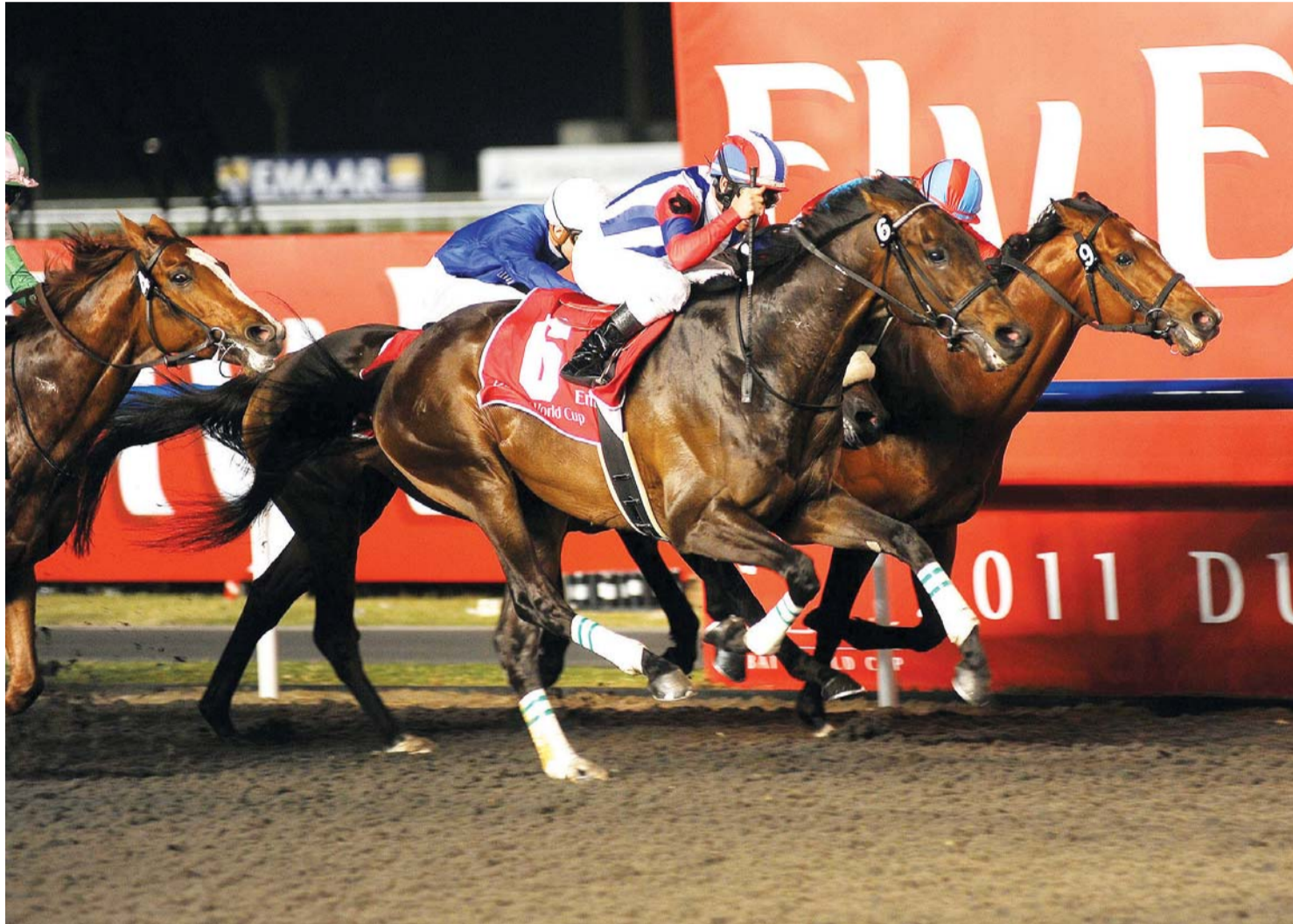
■ نخبة الخيول تتنافس على الشوط التاسع الرئيسي | البيان

وبالإضافة إلى بناء علاقات متينة معهم، كذلك نحرص دائماً على أن نكون شركاء في نجاح ورعاية العديد من الرياضات الكبرى عبر العالم كالتنس وكرة القدم والكريكت والغولف وغيرها، بالإضافة طبعاً إلى سباقات الخيول وعروض الفروسية، ونود ختاماً أن نعرب عن شكرنا وتقديرنا لكل من ساهم في تنظيم واستضافة كأس دبي العالمي، ونحن على يقين بأنهم عملوا دون كلل على مدى الأشهر الماضية، والشكر كذلك إلى ممثلي وسائل الإعلام سواء من المقيمين في دبي أو الذين حضروا من كافة مناطق العالم لتغطية هذا الحدث بأقلامهم وكاميراتهم التي طالما سلطت الضوء على أبرز الفعاليات المحلية والعالمية. واختتم قائلاً: نود أن نشكر بشكل خاص ونرحب بجميع الملاك والفرسان والمدربين والحضور، وتتمنى للجميع الاستمتاع بالسباقات وقضاء أسعد الأوقات على مضمار ميدان.