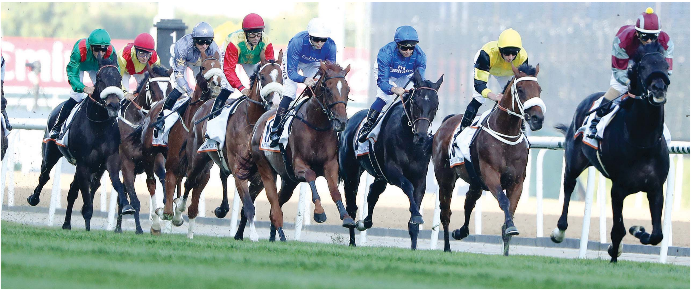
من منافسات الشوط الثالث نسخة 2016

و«ترب تو باريس» بإشراف ادوارد دنلوب، «وول أوفايير» لمالكه عزيز خير بإشراف هوغو بالمر، «هارت بريك سيتي» بإشراف المدرب انطوني مارتين وبيغ أورانج» بقيادة الفارس ديتوري وإشراف المدرب مايكل بيل.