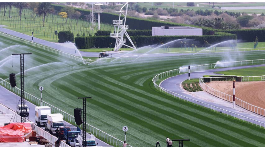
■ جانب من المضمار العشبي