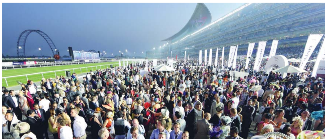
الحدث العالمي يستقطب زواراً من مختلف أنحاء العالم