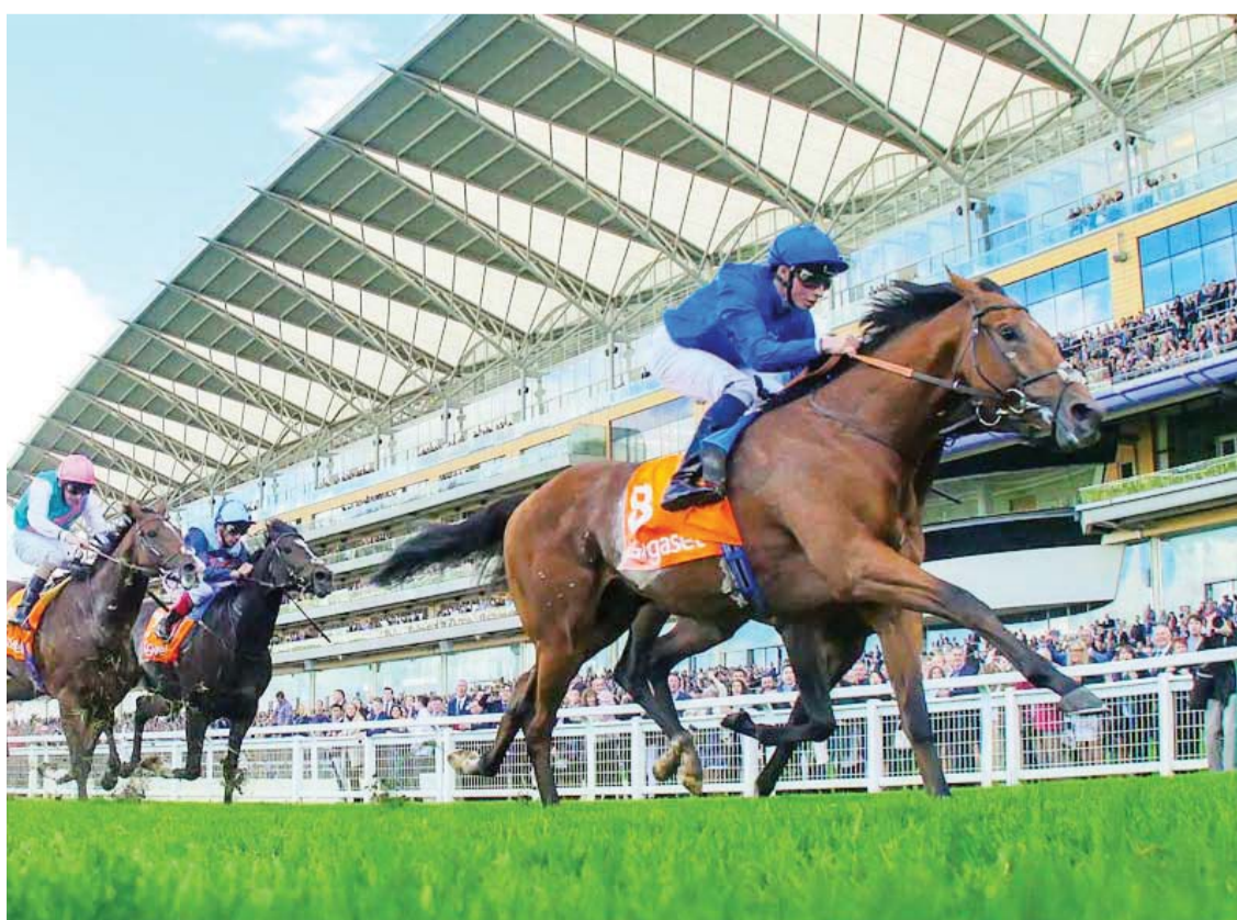
موف أب أبرز نجوم جودلفين في الشوط الرئيسي | البيان

وحقق «ريشيستر» فوزاً باهراً على مسافة الميل بسباق ج 1 جاك لو موروا بمضمار دوفيل في فرنسا في شهر أغسطس، ويرتقي هنا إلى مسافة تسعة فيرونغ للمرة الأولى بسباق ج 1 دبي تيرف، وتبلغ قيمة الجوائز المالية للسباق 6 ملايين دولار أميركي. هذا المهر ذو السنوات الأربع وابن الفحل «إفراج»، والذي أحرز المركز الثالث على