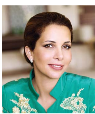
■ بقلم: هيا بنت الحسين