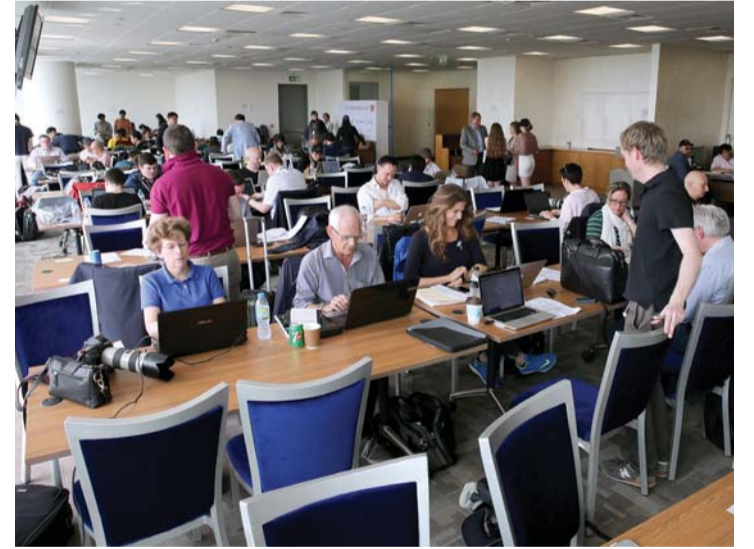
■ الإعلاميون الضيوف بدأوا عملهم مبكراً في المركز الإعلامي