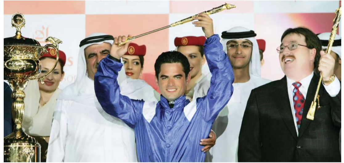
حمدان بن راشد مع الفارس جارا والمدرّب واتسون بعد فوز انفاسور

كلاسيك» حيث توج «نيفون دي كاردون» بطلاً بعد اعتزال الملكة «العنود»، حيث نال لقب البطولة الأولى تحت مسمى «دبي كحيلة كلاسيك» عام 2000.