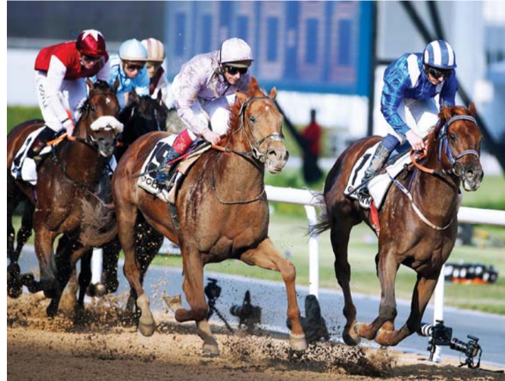
■ من منافسات البطولة