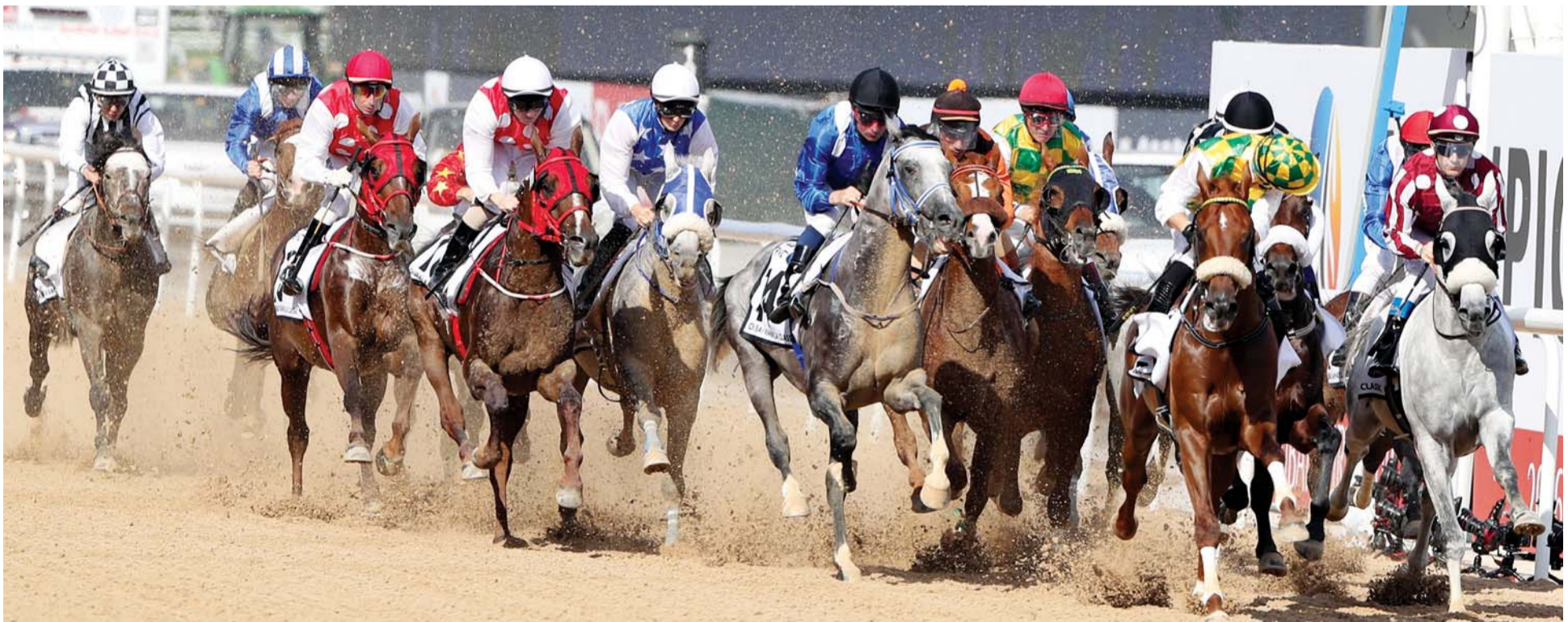
شوط «كحيلة كلاسيك».. موندريال للخيول العربية الأصيلة