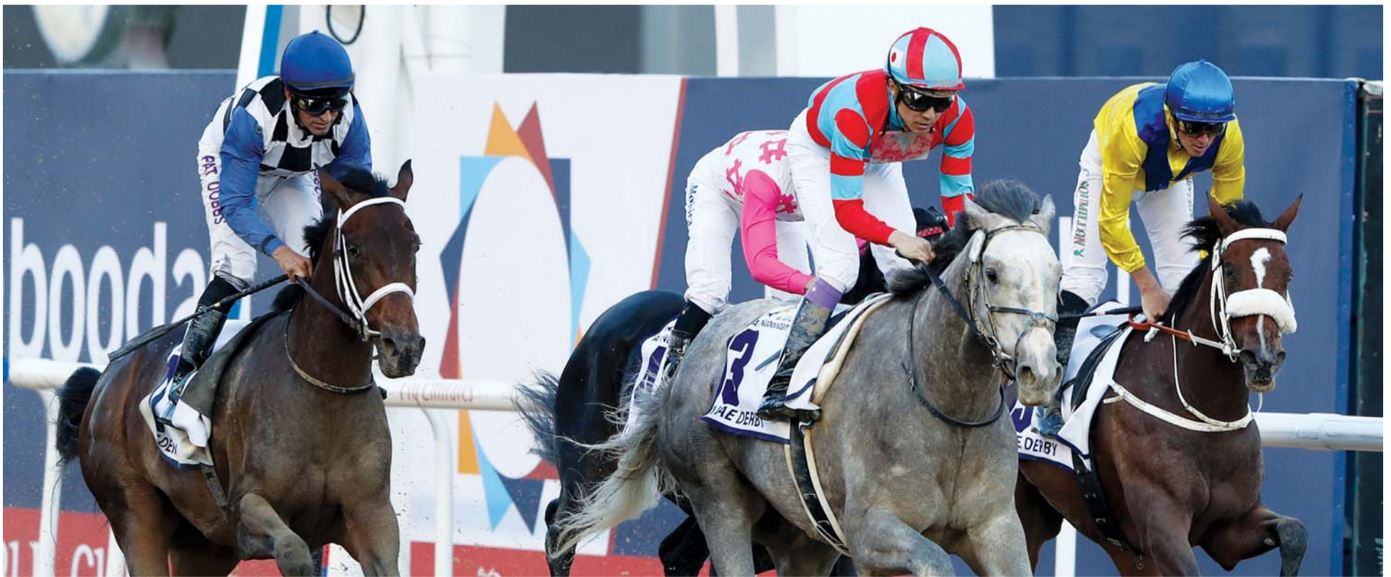
خلال الشوط الرابع في النسخة الأخيرة