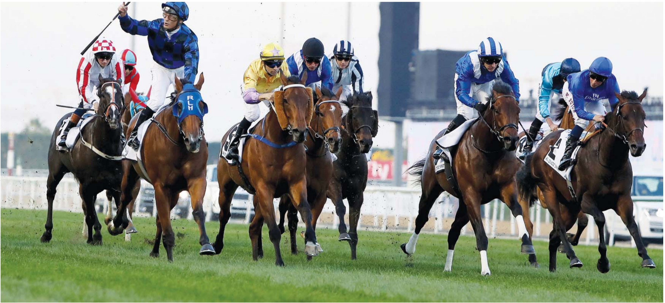
الشوط الخامس النسخة الماضية شهد ندبة وإثارة | ارشيفية

سكوير»، بقيادة كريستوف وإشراف إف. سايب، «ليماتو» لملكه بول جاكوبس، بقيادة هاري بينتلي وإشراف إتش. كاندي. «لونغ أون فاليو» بقيادة جويل روزاريو بإشراف ديليو موت. ويتوقع أن يشهد الشوط معركة شرسة بين مختلف خيول العالم، وستكون خيول الإمارات أمام تحدٍ حقيقي أمام الخيول الأميركية والبريطانية والنيوزيلندية.