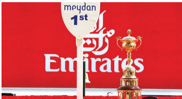
■ الكأس الأعلى برعاية طيران الإمارات

وتابع: يشهد كأس دبي العالمي برعاية طيران الإمارات، كل عام تطوراً كبيراً بوجود خيول من جميع أنحاء العالم، خصوصاً الدول المهمة بسباقات الخيل كالولايات المتحدة الأميركية وبريطانيا وأستراليا