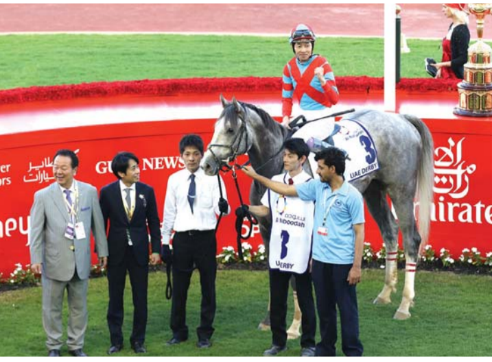
■ «الإمارات للشحن الجوي» نقلت نخبة الخيول المشاركة | البيان