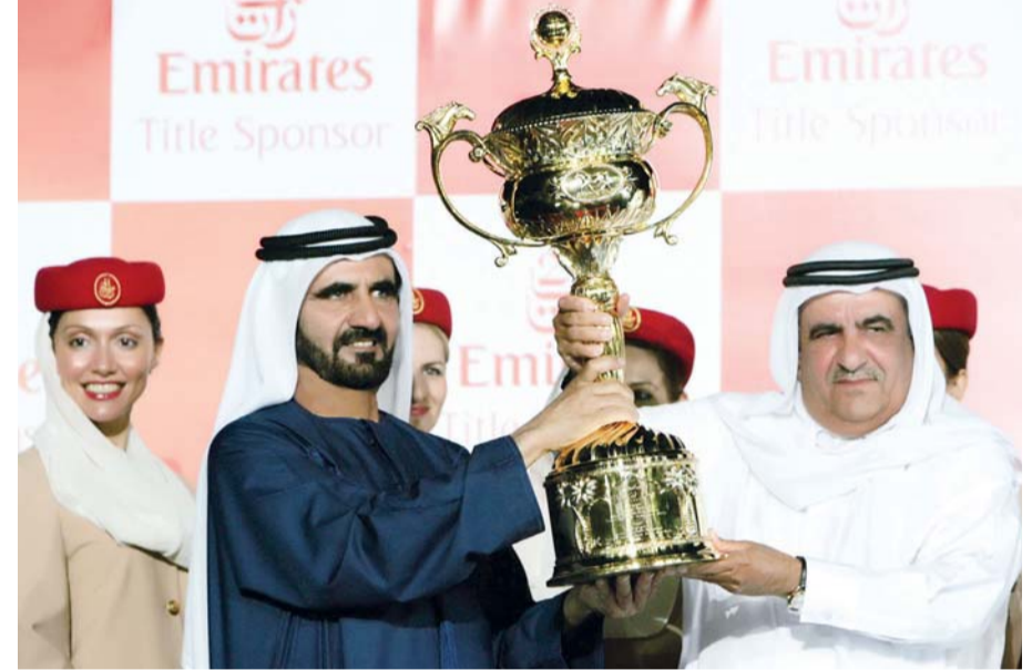
محمد بن راشد يتوج حمدان بن راشد بكأس دبي العالمي 2007 | البيان