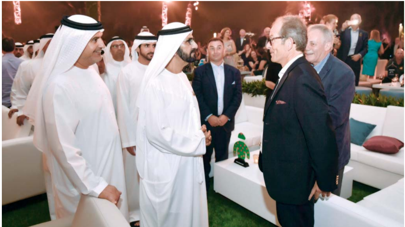
■ محمد بن راشد يتحدث خلال حفل تكريم المتميزين مع المدرب الفرنسي اروين شاربي وسعيد الطاير | البيان