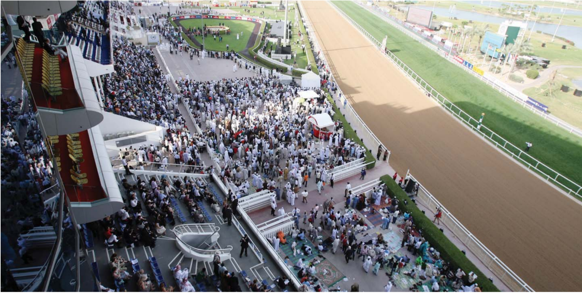
■ مضمار ميدان جاهز لاستقبال الحدث العالمي