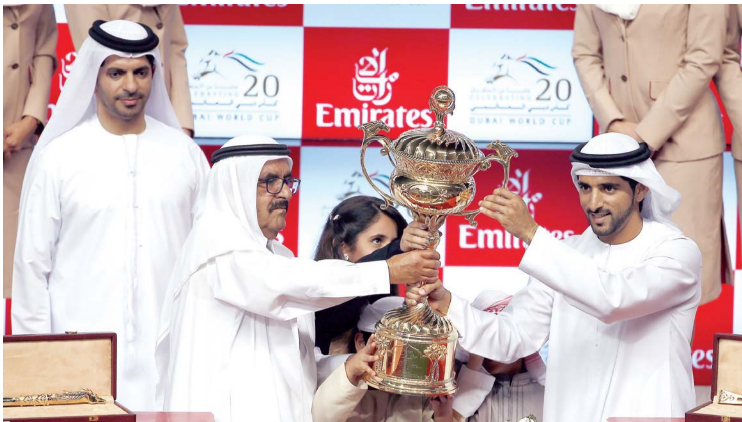
حمدان بن محمد يتسلم من حمدان بن راشد كأس دبي العالمي 2016 | البيان

هذه حكاية فارس إنسان تخطت سمعته الحدود وبلغت الآفاق العالمية في عالم الفروسية.