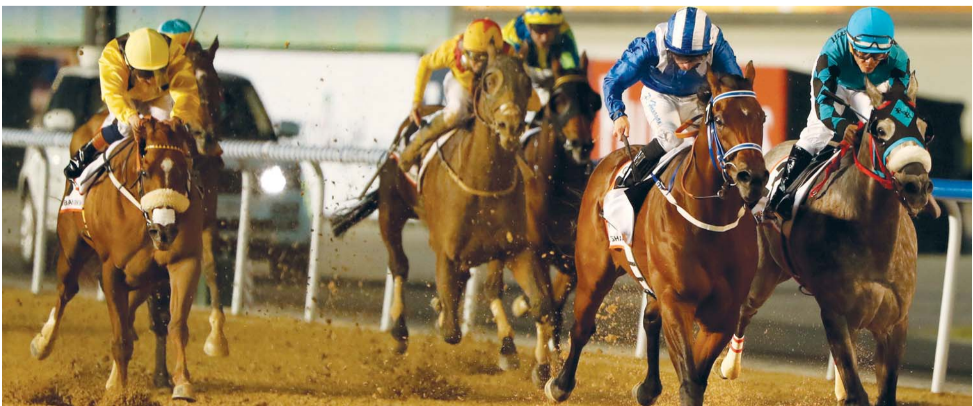
خلال الشوط السادس في نسخة العام الماضي | ارشيفية