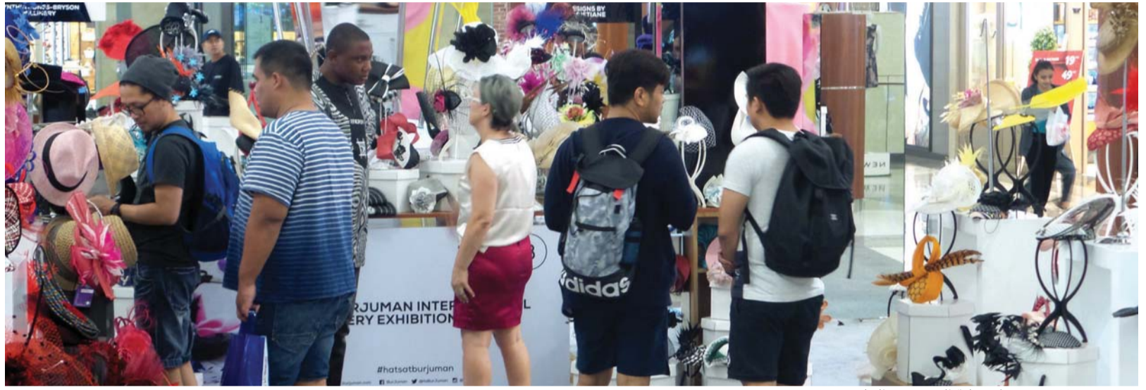
■ جمهور غفير حرص على زيارة المعرض البيان

في الثلاثينات، تحولت إيلسا سكايريللي التي كانت تصاميمها نقطة انطلاق في معنى القبعة النسائية من التحفظ والجدية إلى الطرفة والسحر. فانتجت بعض أغرب التصميمات التي أثارت ضجة، أشهرها قبعة على شكل حذاء مقلوب تعاونت في تصميمها مع الرسام الإسباني سلفادور دالي.