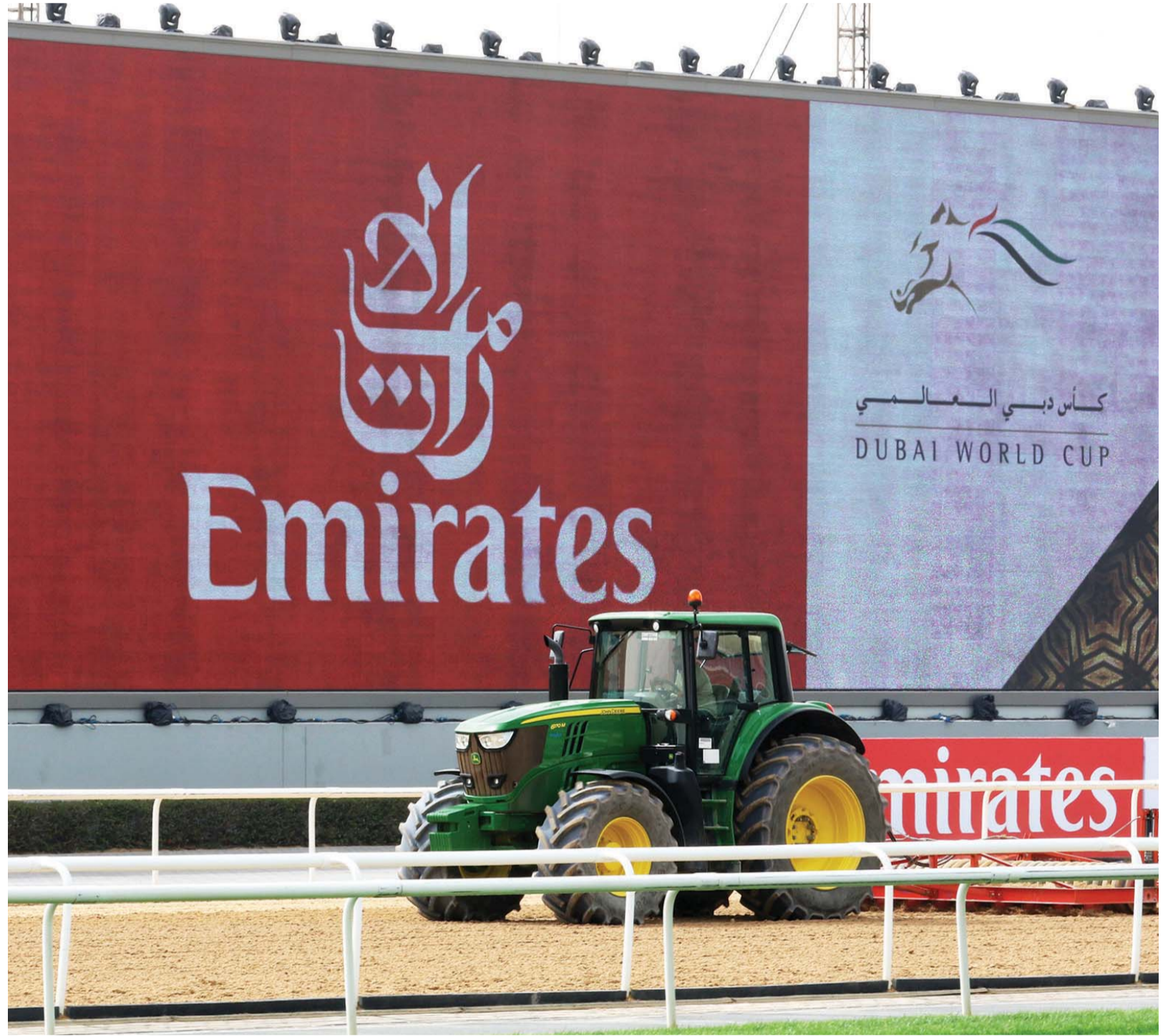
■ استعدادات قصوى لتهيئة المضمار الرملي