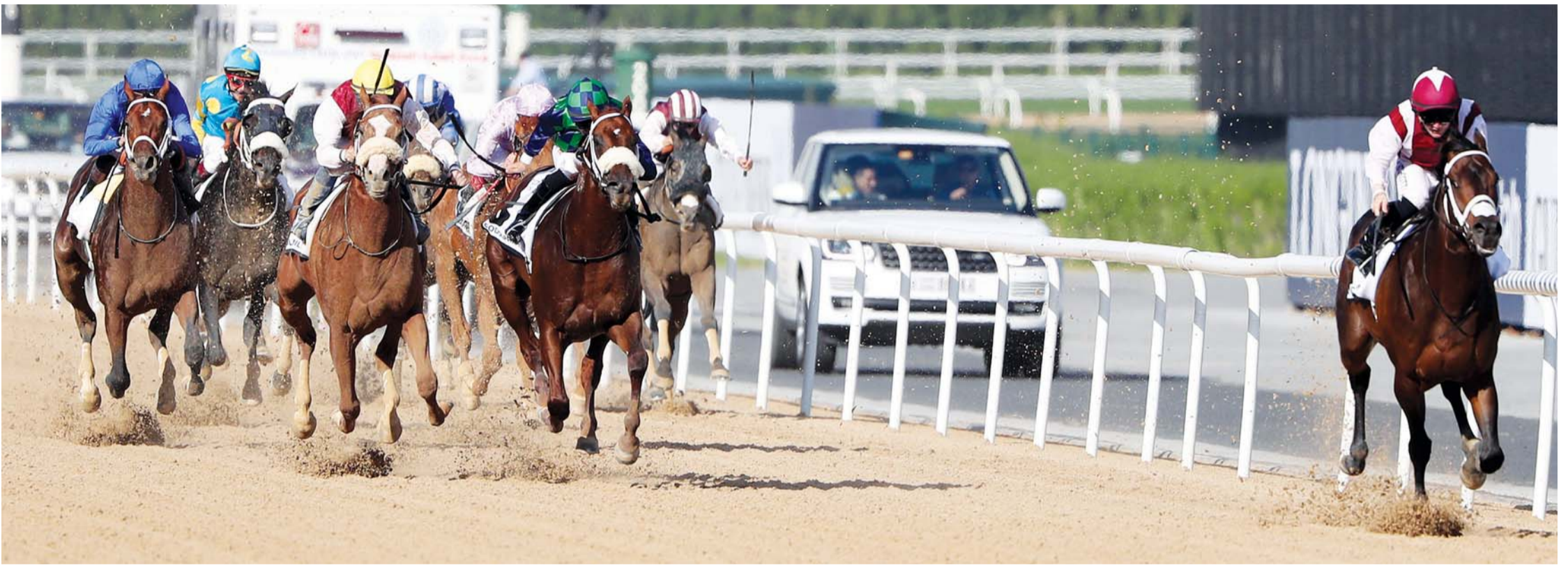
نخبة الخيول العربية تتنافس في شوط «كحيلة كلاسيك»

الماضي، و«سكند صمر» للشيخ راشد بن حميد النعيمي بإشراف دوغ واتسون. إلى جانب المنافس الأميركي «شارب أزيكا» المملوك لـ غلفنتين فارم بإشراف المدرب جورج نافيرو. وقد حقق المركز الأول مرتين ومركز الوصيف مرتين هذا الموسم بأميركا.