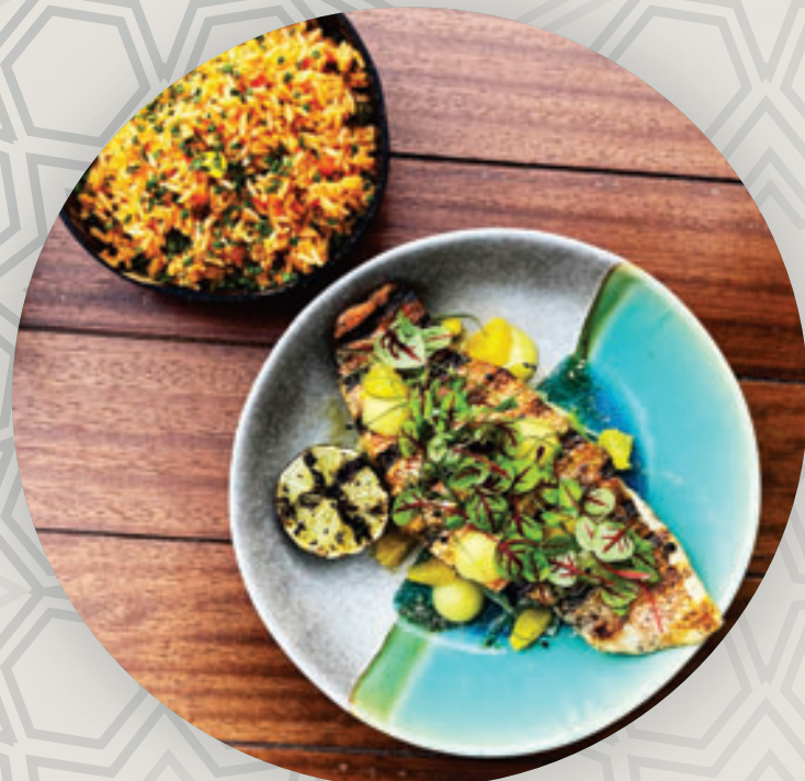
سمك بالخلطة وأرز مع الزعفران