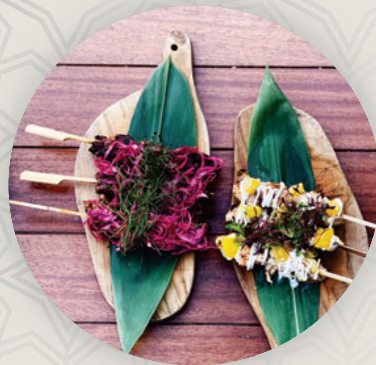
لحم الواغو ودجاج مع المندرين