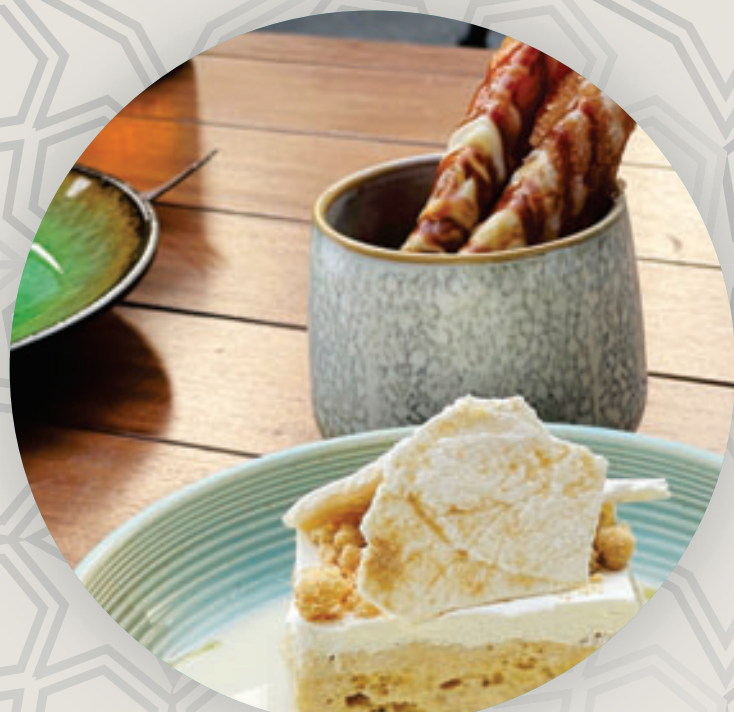
حلوى لذيذة بالشكولاتة البيضاء