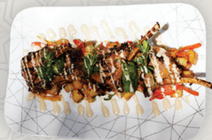
شرائح لحم الضأن