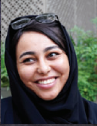
أم جود: لا يمكن تصور مائدة رمضان من دون «اللقيمات»