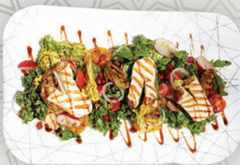
سلطة جبن الحلومي