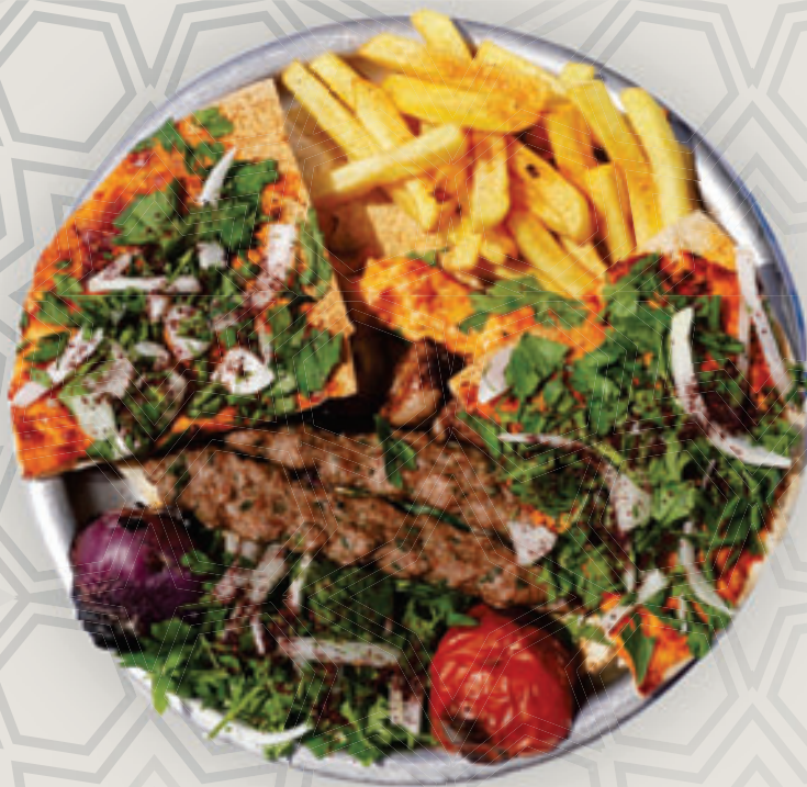
مشا و مشكلة

بسكويت وكريمة الجبنة ومزينة بالفواكه الطازجة