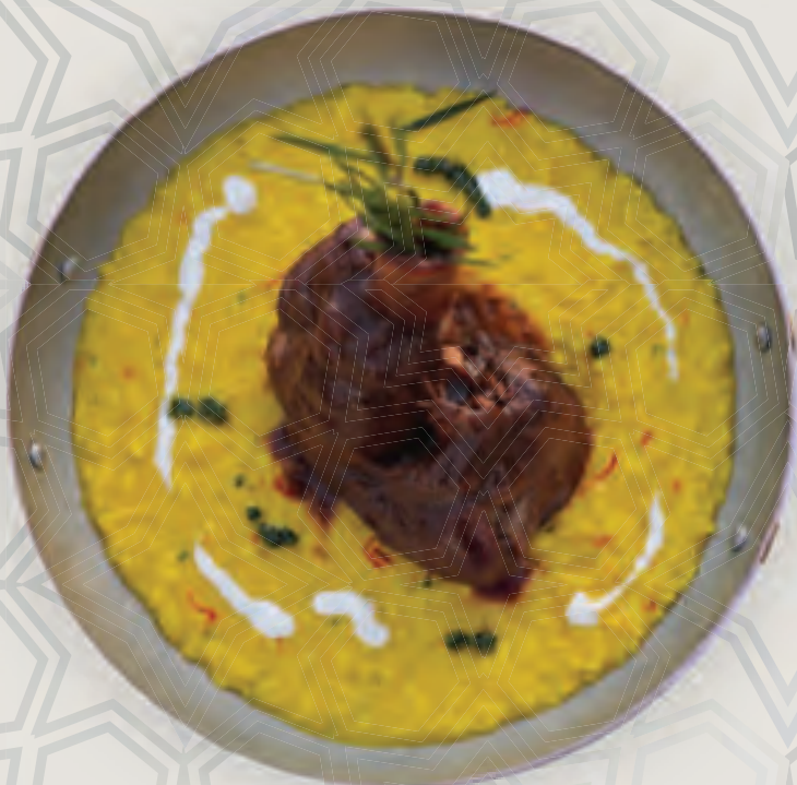
ريزوتو كونستينو دي اغنيلو (لحم العجل بالزعفران)