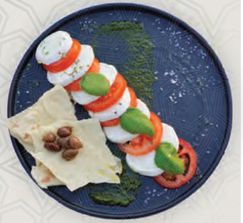
بارميجانا دي ميلانزي (بادنجان مشوي، حبق، بوفالو موزاريللا)