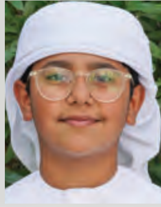
حمدان عبد الله شهر الخير وأعظم مناسبة للشعور بالفقراء