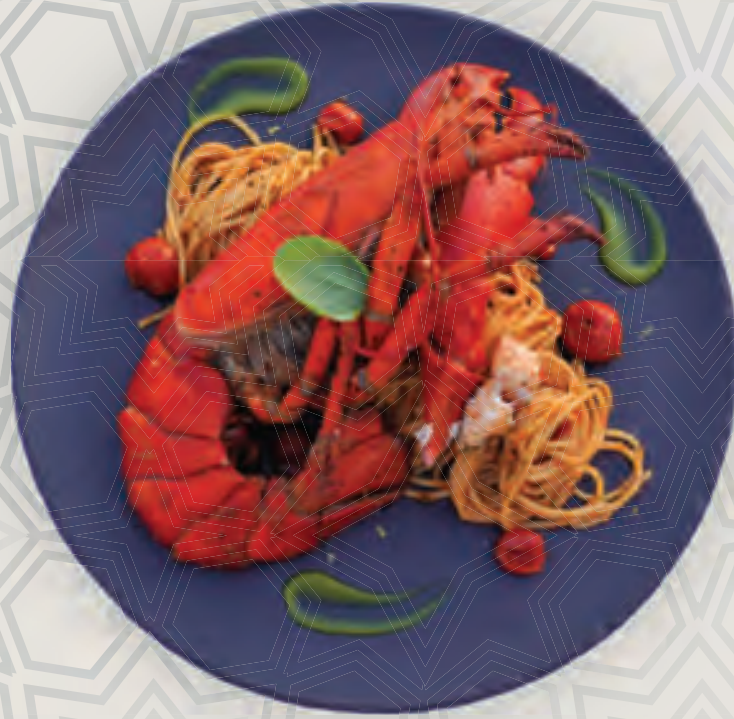
سباغيتي استيك داتيرونو (كرنند، طماطم، حبق)