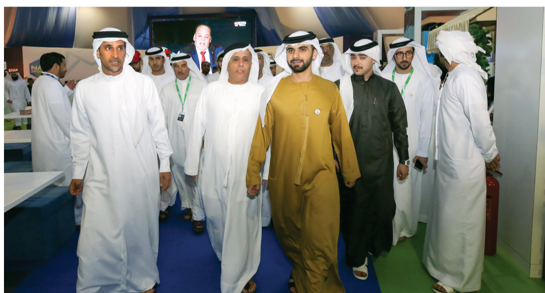
منصور بن محمد يتجول في خيمة الجماهير بحضور زايد بن مكتوم ومطر الطاير وعبدالله خليفة المري | البيان

وقد التقى سمو الشيخ حمدان بن محمد بن راشد آل مكتوم خلال حضوره جانباً من الحفل الافتتاحي عدداً من الرياضيين المشاركين في الفعاليات والمسؤولين المتواجدين في الحدث، وتجاذب معهم أطراف الحديث حول أهمية هذه الدورة الرياضية بالنسبة لتشجيع الشباب من الجنسين على خوض البطولات الرياضية بجميع أنواعها، كي يكونوا قدوة للشباب الآخرين الذين يعزفون أو هم عازفون عن ممارسة أي نوع من أنواع وأنشطة الرياضة التي وصفها سموه بأنها تصفي الروح والذهن وتصلق المواهب والطاقات الكامنة في أجسام الشباب.. إضافة إلى أنها تقوي الجسد وتقويه من الإصابة بعدد من الأمراض