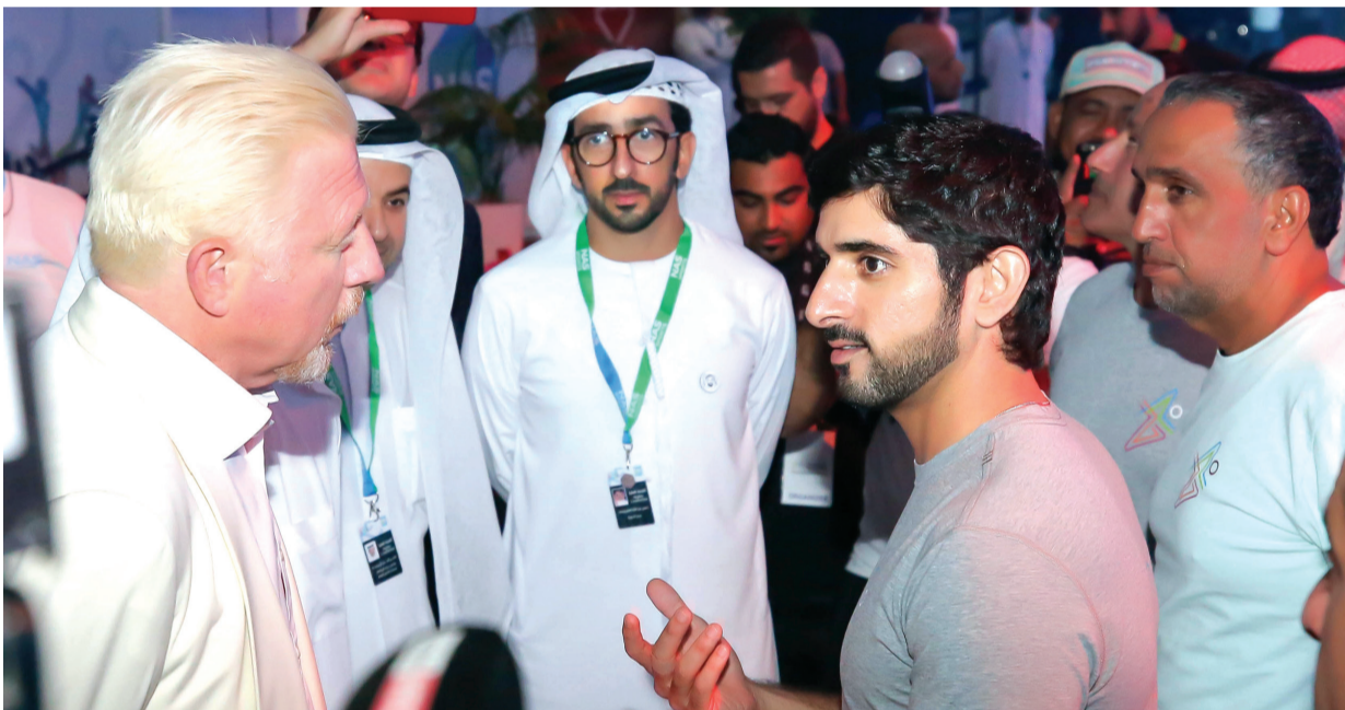
■ حمدان بن محمد يرحب ببوريس بيكر بحضور حسن المزروعى | البيان

وعن قدرة الصربي نوفاك ديوكوفيتش الذي سبق أن دربه بين 2013 و2016 في العودة مجدداً إلى القمة، قال: ديوكوفيتش عانى من إصابة أبعدهت 6 أشهر عن الملاعب، ويحتاج إلى الوقت لاستعادة مستواه وأعتقد أنه قادر على ذلك لأنه لاعب ملهم.