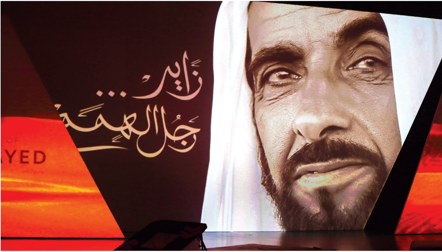
■ زايد.. رجل الهمم عنوان حفل افتتاح دورة ناس | البيان