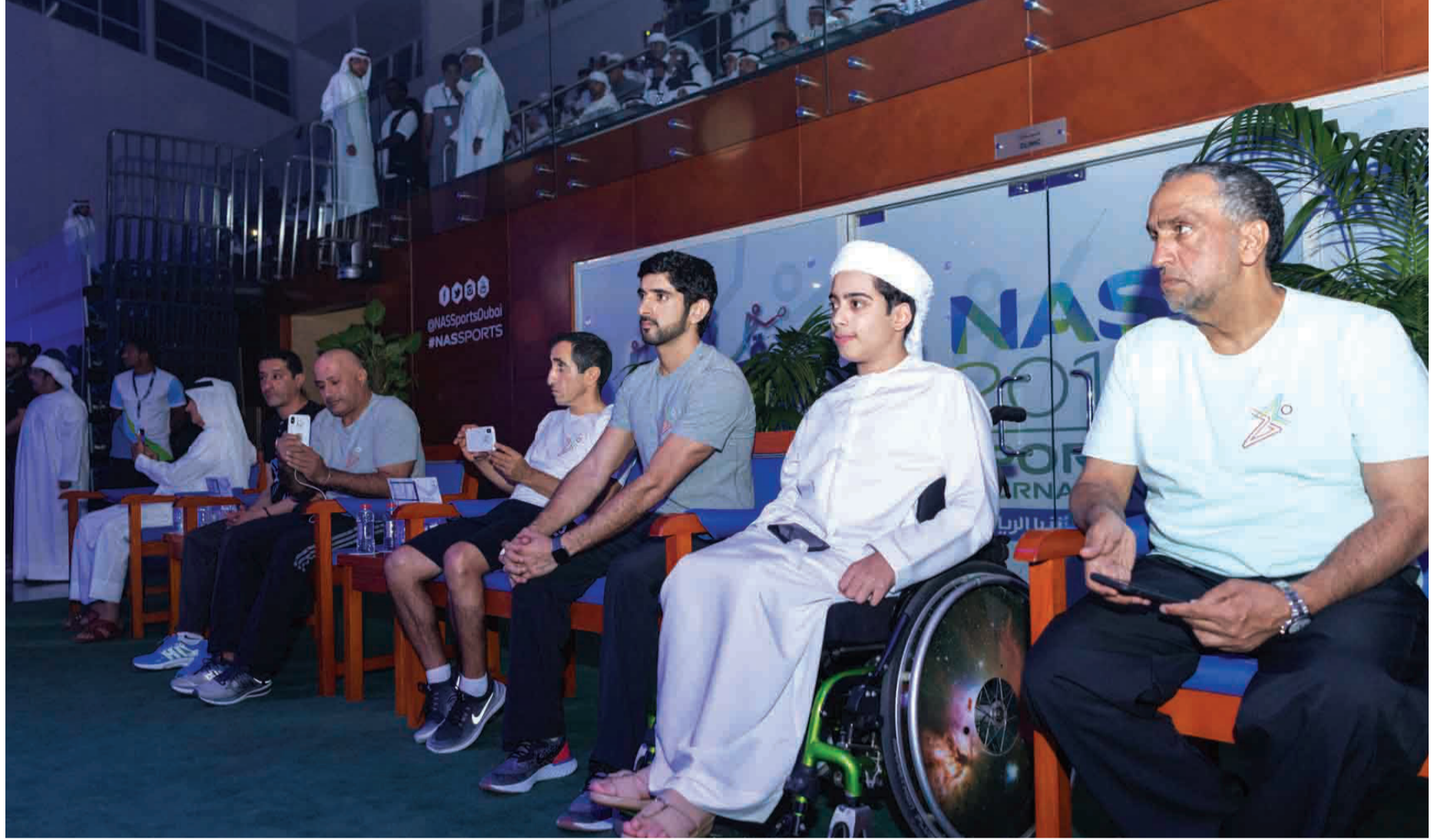
حمدان بن محمد خلال متابعته حفل افتتاح دورة ناس بحضور سعيد بن مكتوم وأحمد وسعيد جابر وسعيد هلال