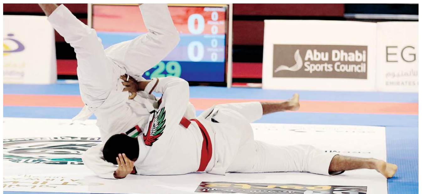
■ مهارات عالية للاعب الجوجيتسو