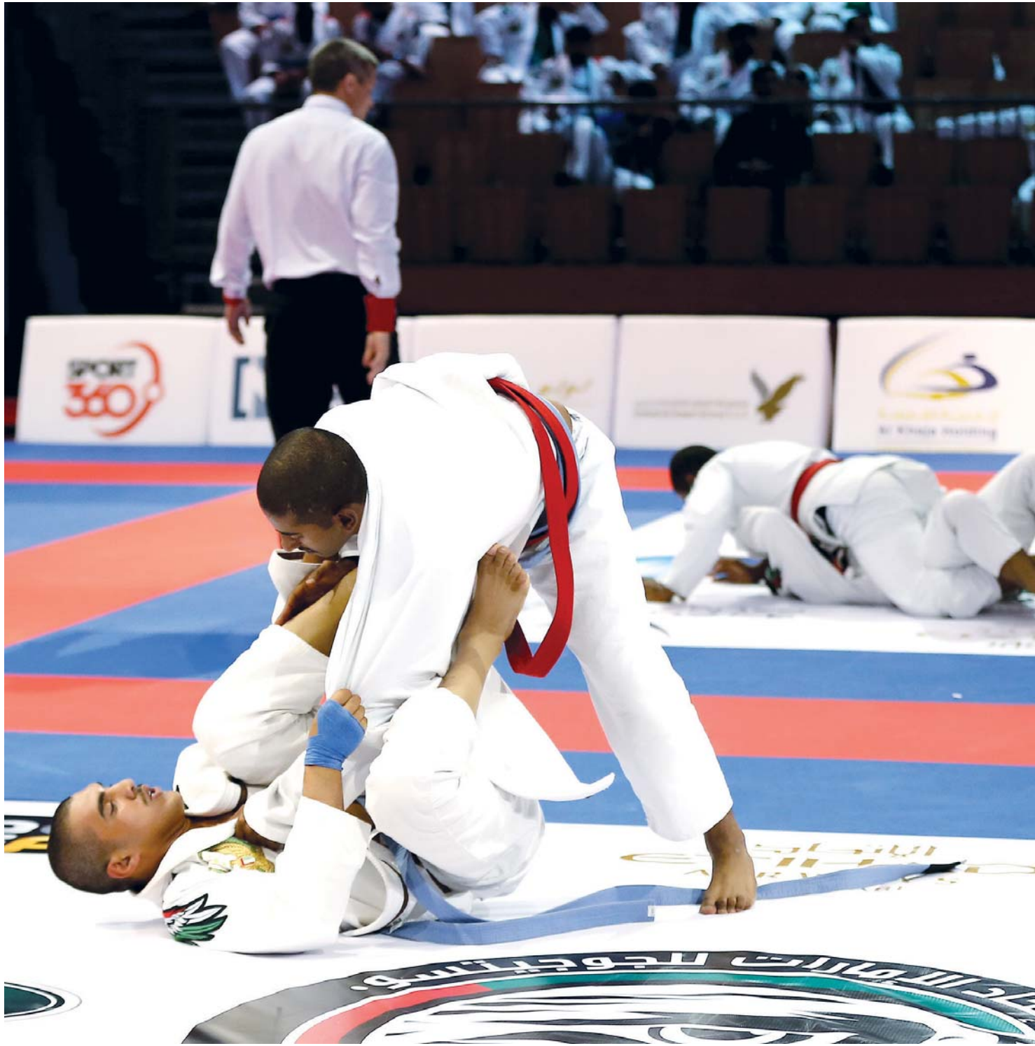
■ منافسات قوية في نزلات البطولة

ويتابع: «أحاول تجهيز نفسي من خلال منافسات القوات المسلحة من أجل الاستعداد بأفضل صورة ممكنة قبل غمار منافسات بطولة العالم للمحترفين في النسخة العاشرة، إذ سأشارك في منافسات الحزام البنفسجي لوزن 62 كجم بعدما نجحت في إنقاص وزني 7 كيلوجرامات، وكوني المصنف الأول في هذا الحزام، أطمح إلى تحقيق المركز الأول والميدالية الذهبية في النسخة الحالية رغم وجود منافسين أقوى إلا أن ثقتي بنفسي ليس لها حدود». وعن أبرز المحطات الصعبة التي مرت طوال مشواره مع الجوجيتسو يقول: «من أصعب اللحظات التي مرت علي عندما تعرضت لإصابة في الركبة ابعدتني لمدة 3 سنوات عن البطولات، توقفت خلالها عن المشاركة في أي منافسات وهو أمر صعب على أي لاعب بالطبع ولكني بفضل الإصرار والمثابرة تمكنت من تجاوز تلك الفترة».