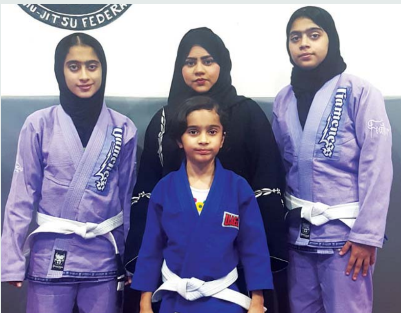
فتيات المازمي والدتهن | البيان

غذائي صحي، وهذا الأمر في غاية الأهمية بالنسبة للأبناء والفتاة بشكل عام، وأوصي أولياء الأمور باتباع أسلوب صحي مع أبنائهم؛ لأنه يعزز من القدرة البدنية والقوام الرياضي للأبناء ويعدهم عن مخاطر السمعة، وأمراض العصر، ولافتة إلى أن الجوجيتسو، الذي يغرس في النشء فوائد صحية ونفسية، يكمل المنظومة بذهن متفتح، ما يحول تفكير الأولاد والفتيات إلى الأشياء الإيجابية وتبني كل ما هو مميز؛ لأنهم ببساطة قد توجه نشاطهم إلى رياضة مفيدة منضبطة.