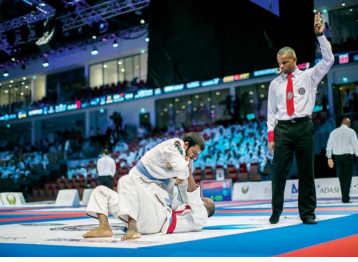
■ أجواء رائعة في البطولة

على جهودها الدؤوبة في رعاية أبطال اللعبة وتوسيع رقعة المشاركة بها لتشمل كل أبناء الدولة. أبو ظبي - البيان الرياضي