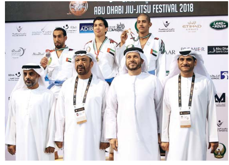
جانب من تتويج الفائزين