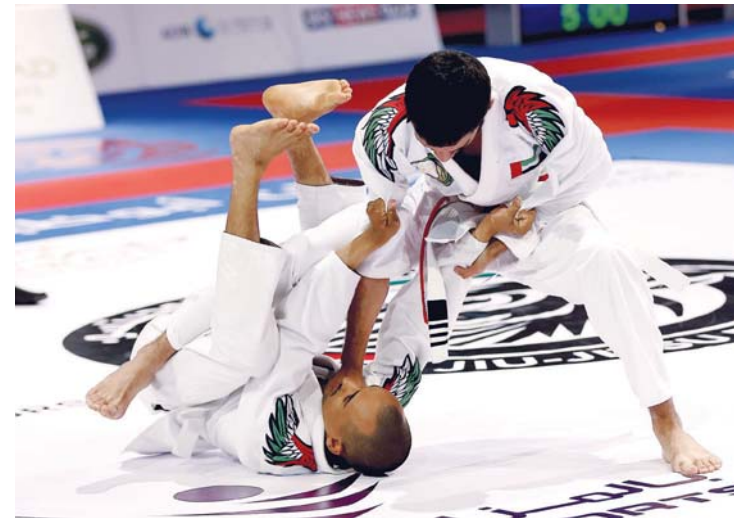
مواهب واعدة في الحدث | البيان

يحرص مركز التعليم والتطوير المهني التابع لمعهد أبوظبي للتعليم والتدريب المهني، على التواجد في بطولة أبوظبي العالمية لمحترفي الجوجيتسو من خلال متابعة طلاب المركز للمنافسات، ووجهت اللجنة المنظمة للبطولة الدعوة للمركز للحضور لمشاهدة الفعاليات، إذ يتواجد يوماً نحو 300 طالب من طلاب المركز في صالة آبيك آرينا لمتابعة النزلات والتعرف بصورة أكبر على رياضة الجوجيتسو. ويملك