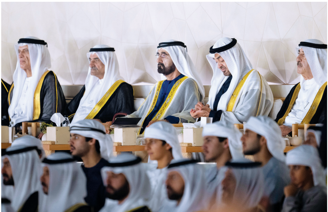
محمد بن زايد ومحمد بن راشد وحمد الشرقي وسعود المعلا وسعود بن مقر خلال الحفل