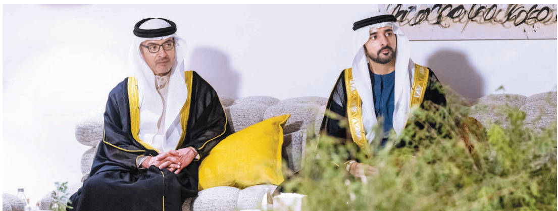
حمدان بن محمد وهزاع بن زايد