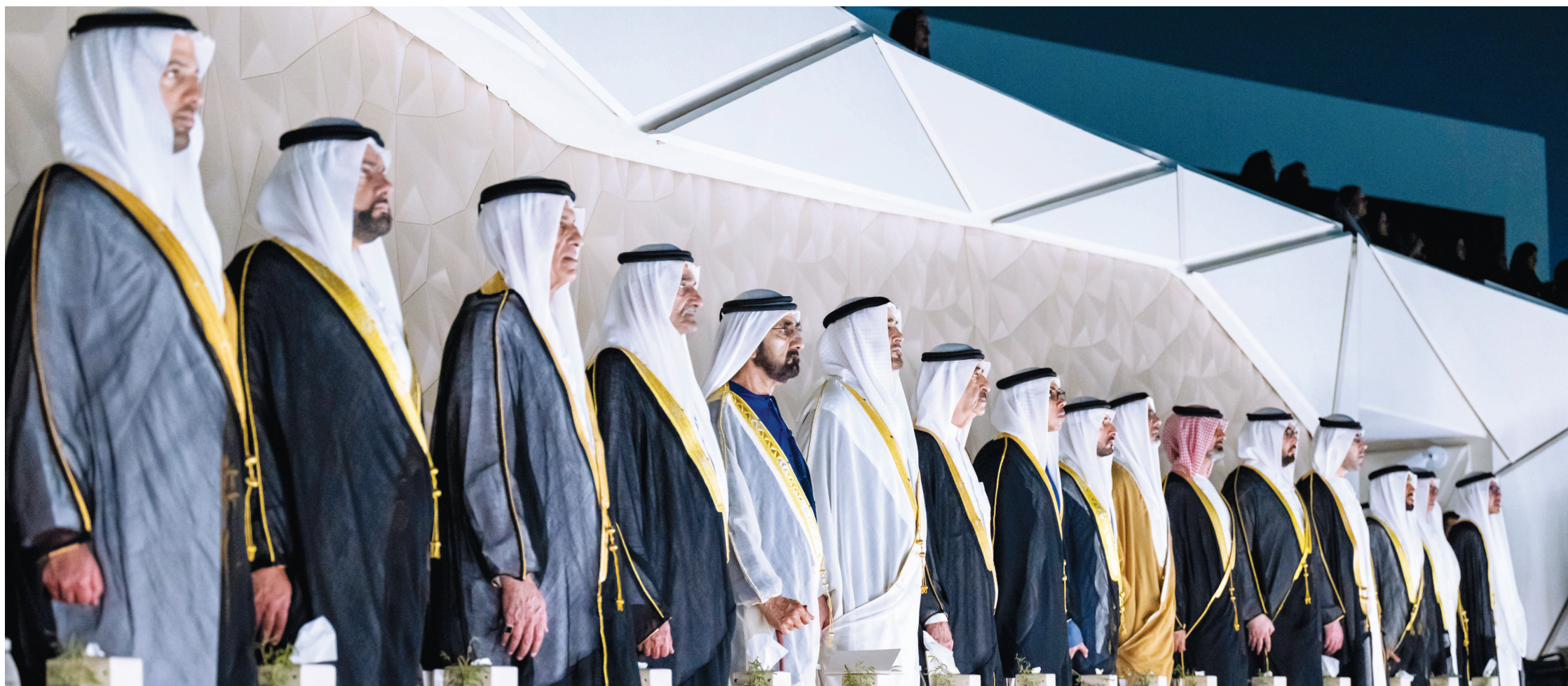
محمد بن زايد ومحمد بن راشد وحمد الشرقي وسعود المعلا وسعود بن صقر ومنصور بن زايد وخالد بن محمد بن زايد وحمدان بن محمد وعمار النعيمي ومحمد بن حمد وراشد المعلا ومحمد بن سعود وأحمد بن سعود ونهيان وحامد وعبدالله بن زايد | تصوير: حمد الكعبي ومحمد الحمادي وعبدالله النيايدي وعمر العسكر