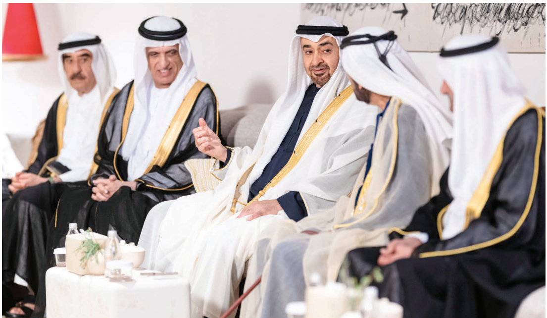
محمد بن زايد ومحمد بن راشد وحمد الشرقي وسعود المعلا وسعود بن مقر