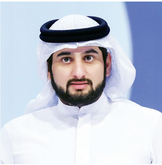
دبي - البيان

” سموه: نواصل مسيرة الريادة الإماراتية ونحقق آمال وطموحات شعبنا وأمتنا