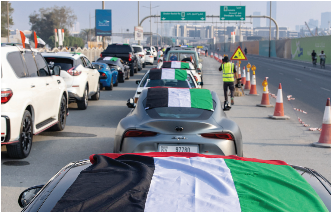
الفعالية جشدت روح الاتحاد لدى المشاركين