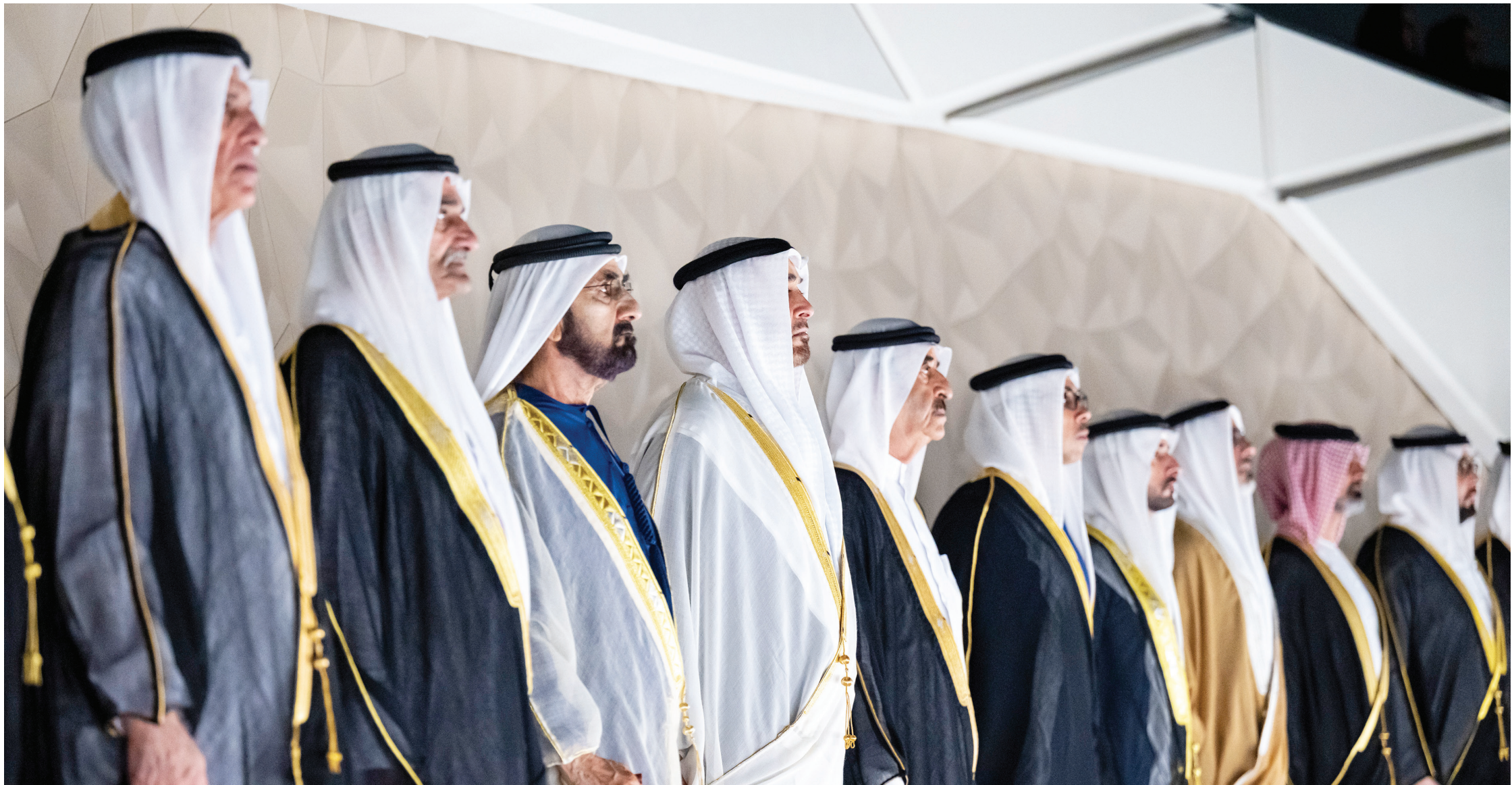
محمد بن زايد ومحمد بن راشد وحمد الشرقي وسعود المعلا وسعود بن مقر ومنصور بن زايد وخالد بن محمد وحمدان بن محمد وعمار النعيمي وراشد بن سعود