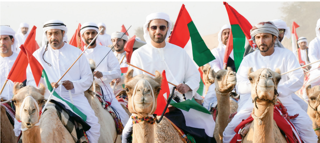
محمد بن سعود خلال مشاركته في المسيرة التراثية

أكد سمو الشيخ أحمد بن سعيد آل مكتوم، رئيس هيئة دبي للطيران المدني، رئيس مطارات دبي، الرئيس الأعلى الرئيس التنفيذي لطيران الإمارات والمجموعة، أن الآباء المؤسسين وخذوا القلوب، وصنعوا قصة نجاح تتجدد مع كل إنجاز. وقال سموه في تغريدة على «إكس»: «منذ 54 عاماً انطلقت قصة اتحاد أرسى الآباء المؤسسون دعائمهم، فوحدوا القلوب وصنعوا قصة نجاح تتجدد مع كل إنجاز. اليوم نجتمعنا رؤية موحدة وطموح لا يعرف المستحيل لنعمل ونُخلص ونواصل مسيرة البناء والتطوير، مُتّحدين قيادةً وشعباً بروح واحدة من أجل الوطن وأبنائنا وأبنائنا، اليوم وكل يوم ولابد.. عيد الاتحاد هو يوم الإرادة والإيمان بأن الإمارات لا تنتظر الغرض، بل تصنعها برؤية قيادتها وإرادة مواطنيها الذين هم الثروة التي ينهض بها الوطن ويزدهر».