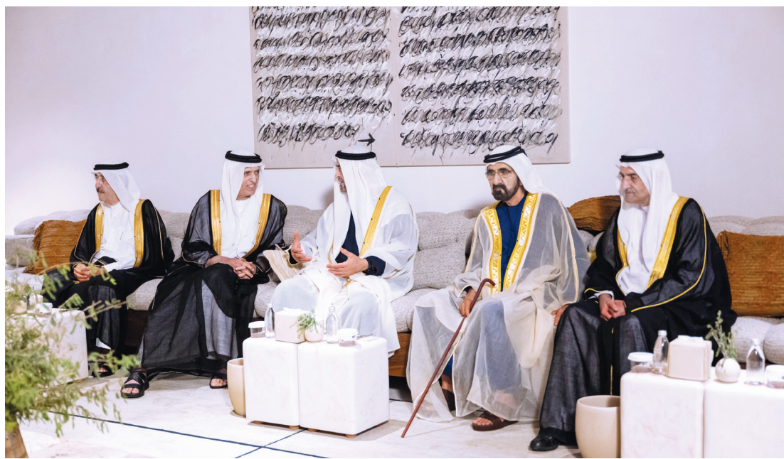
محمد بن زايد ومحمد بن راشد وحمد الشرقي وسعود المعلا وسعود بن صقر