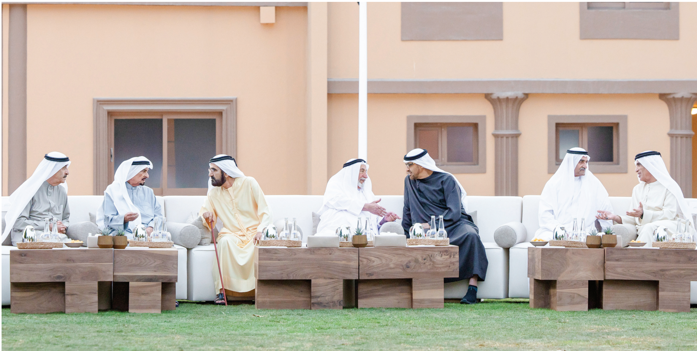
برؤية القيادة الرشيدة.. الإمارات تواصل تعزيز مسارها الوطني ومسيرتها الريادية عالمياً | أرشيفية