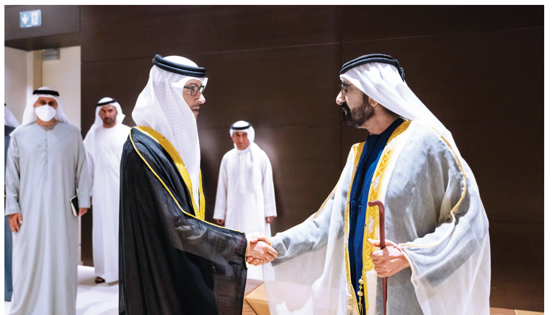
محمد بن راشد مصافحاً هزاع بن زايد بحضور سعيد بن مكتوم