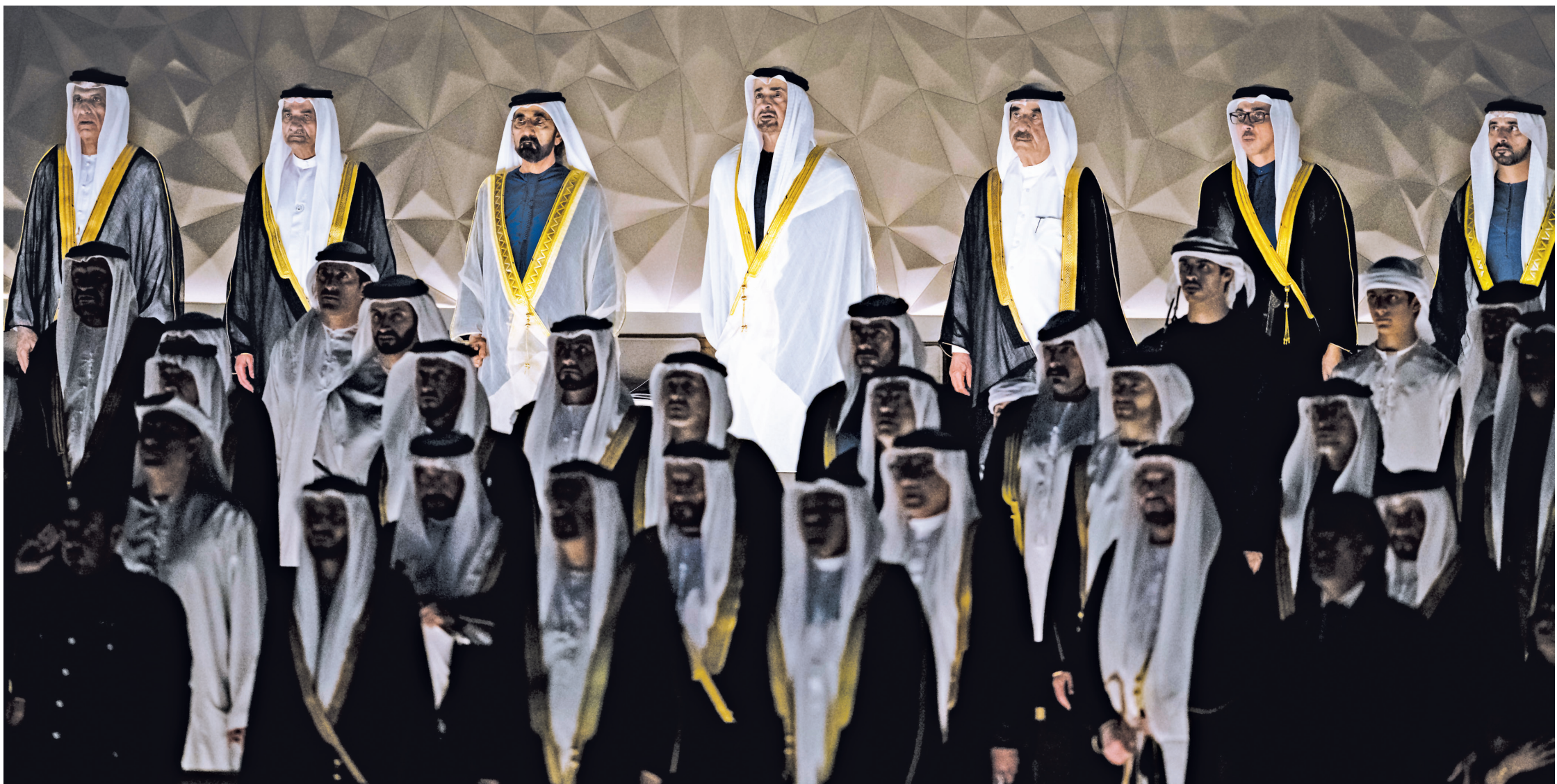
محمد بن زايد ومحمد بن راشد وحمد الشرقي وسعود المعلا وسعود بن مقر ومنصور بن زايد وحمدان بن محمد