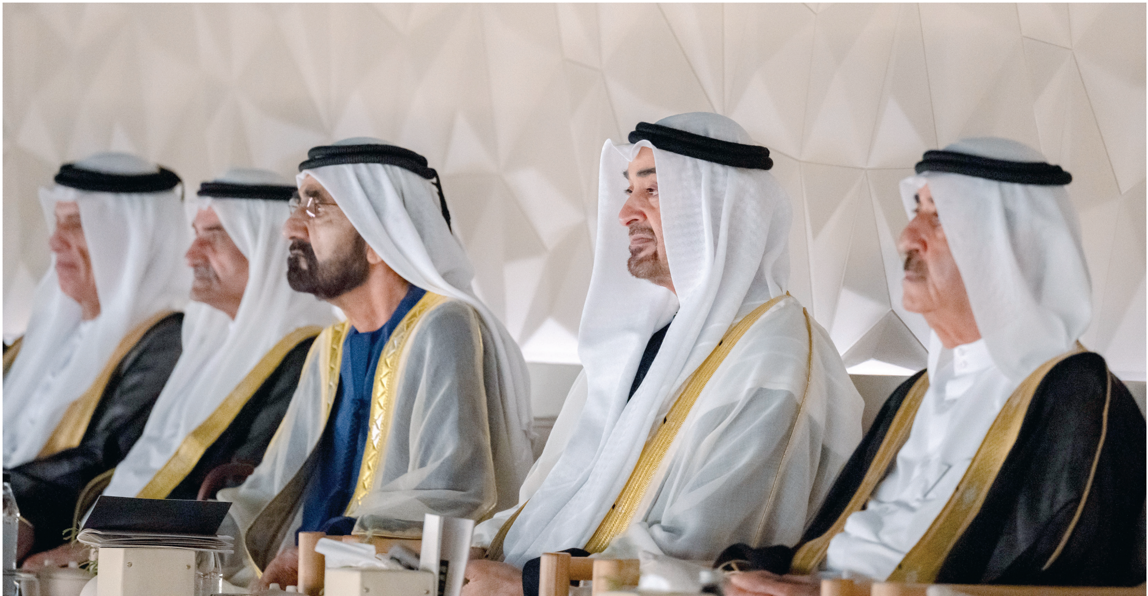
محمد بن زايد ومحمد بن راشد وحمد الشرقي وسعود المعلا وسعود بن صقر خلال متابعة فقرات الاحتفال