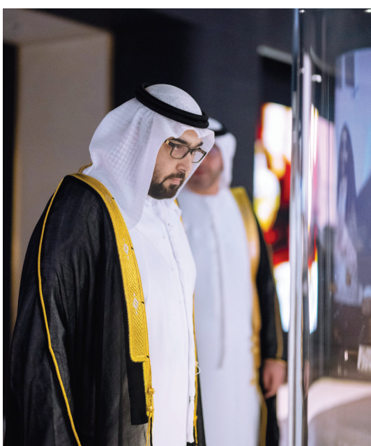
راشد المعلا خلال جولة في المتحف