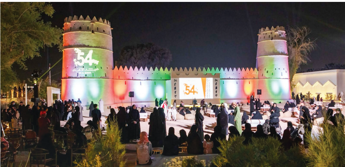
احتفالات العين تعكس روح الهوية الإماراتية

استقبلت منطقة العين الخضراء الحدث الوطني الكبير بأجواء احتفالية متكاملة، تجمع بين الجمال الحضاري والوعي البيئي وروح الاتحاد. واحتفى متحف العين بعيد الاتحاد الـ54 يومي 1 و2 ديسمبر من خلال برنامج ثقافي يعكس روح الهوية الإماراتية وتراثنا العريق، حيث يرحب بالزوار لمعايشة أجواء وطنية تجمع بين الترفيه والمعرفة في تجربة تحفي بتاريخ المكان والإنسان. وتضمنت الفعالية باقة متنوعة من الأنشطة، تشمل العروض التقليدية وفي مقدمتها العيّالة، وورش الأطفال التفاعلية، إلى جانب استعراض الحرف الإماراتية التي تعكس مهارة الصناعات اليدوية، إضافة إلى الاستمتاع بالأطباق المحلية مع فعالية الطبخ المباشر، والتصوير الفوري، إلى جانب قصص تراثية تروي للزوار تعكس تاريخ الإمارات وانتقال إنشائها من جبل إلى جبل.