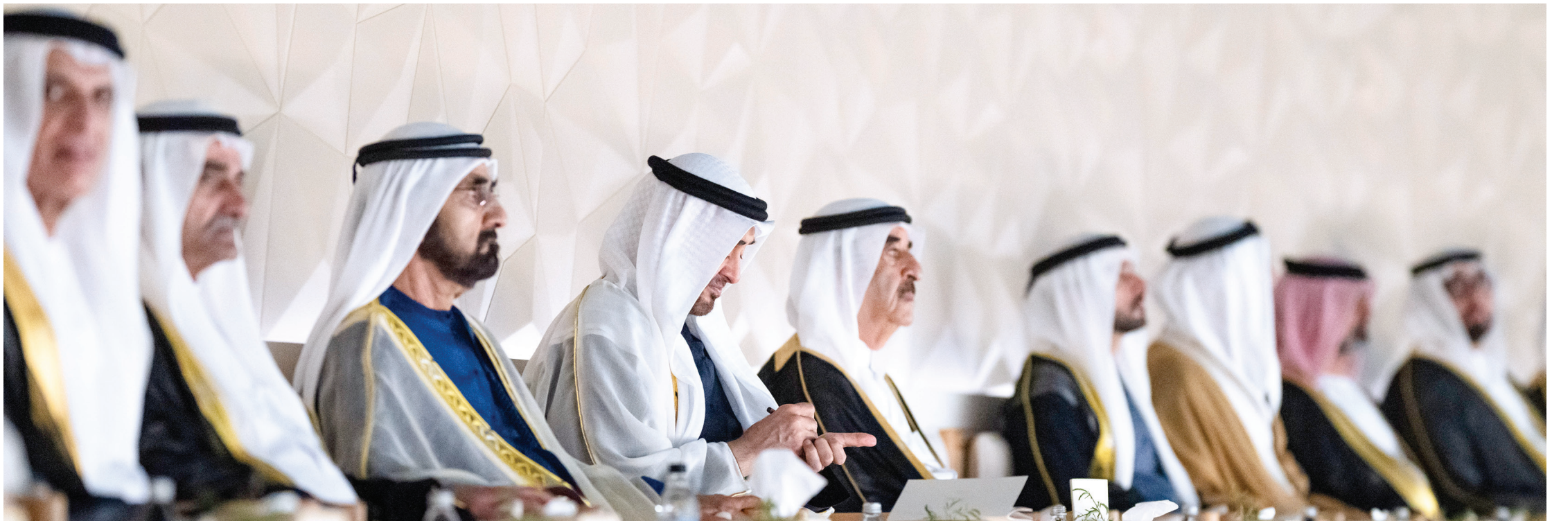
محمد بن زايد ومحمد بن راشد وحمد الشرقي وسعود المعلا وسعود بن صقر وحمدان بن محمد وعمار النعيمي وراشد بن سعود