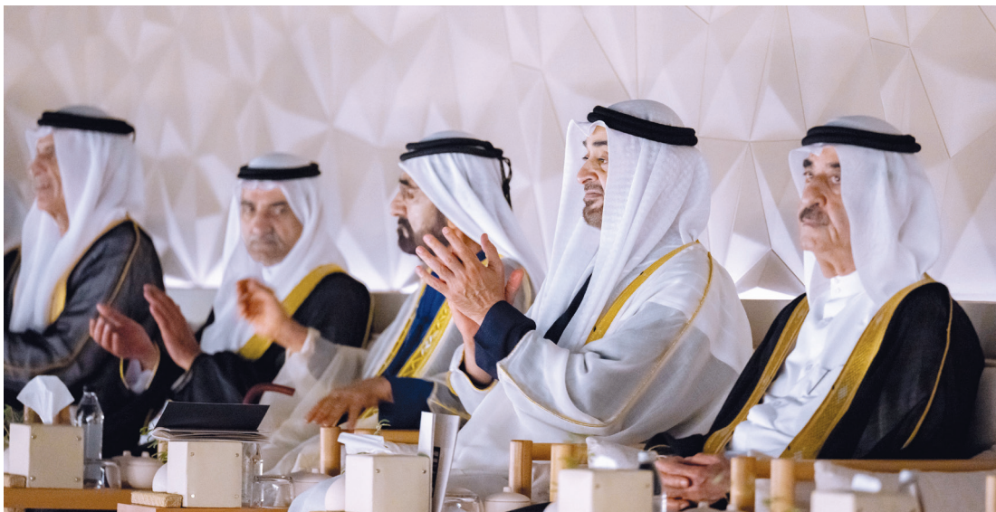
محمد بن زايد ومحمد بن راشد وحمد الشرقي وسعود المعلا وسعود بن صقر خلال الحفل