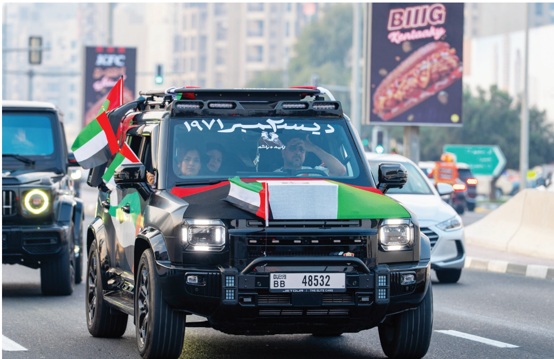
جانب من المشاركين في الاحتفالية الوطنية

احتفاء بيوم توحدت فيه الرؤى وصدقت فيه العزائم لبناء وطن لا يعرف المستحيل