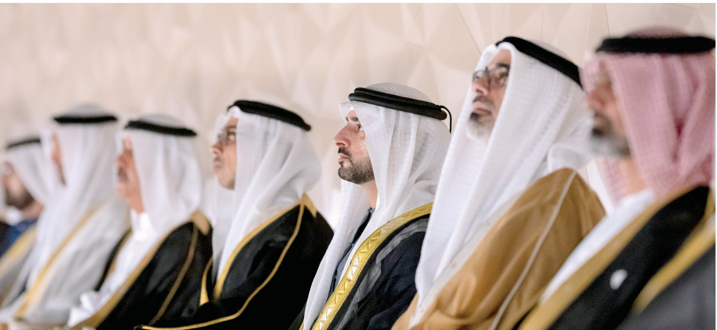
سعود المعلا ومنصور بن زايد وخالد بن محمد وحمدان بن محمد وعمار النعيمي خلال الحفل