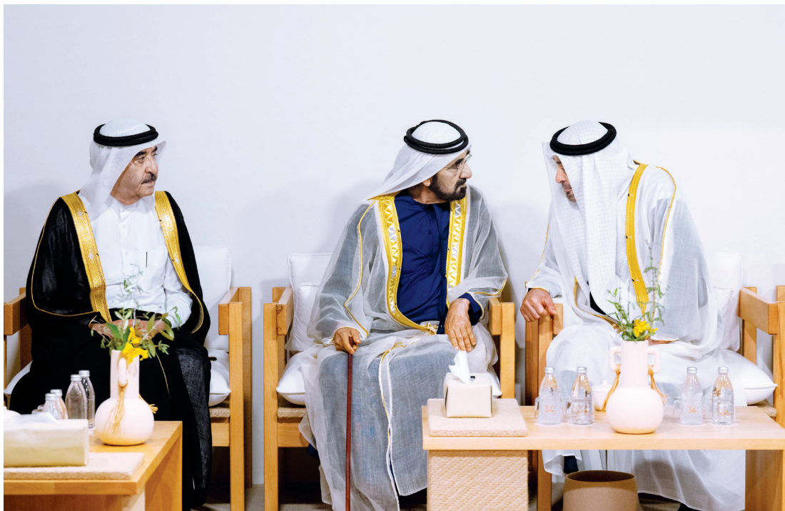
محمد بن زايد في حديث مع محمد بن راشد بحضور سعود المعلا