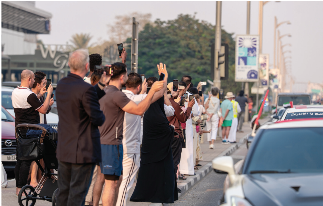
المواطنون والمقيمون حرصوا على المشاركة في التعبير عن المشاعر الوطنية