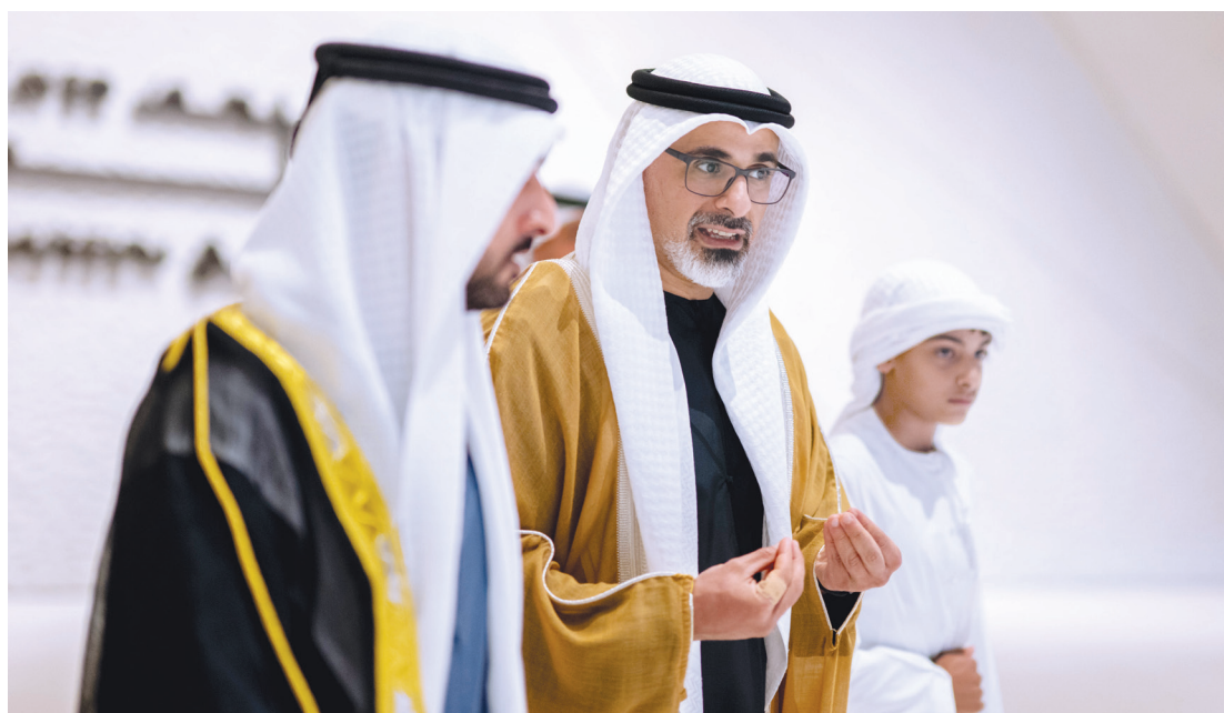
خالد بن محمد بن زايد وحمدان بن محمد