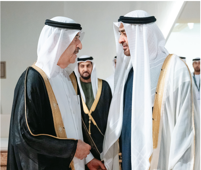
رئيس الدولة مصافحاً حاكم أم القيوين بحضور حمدان بن زايد