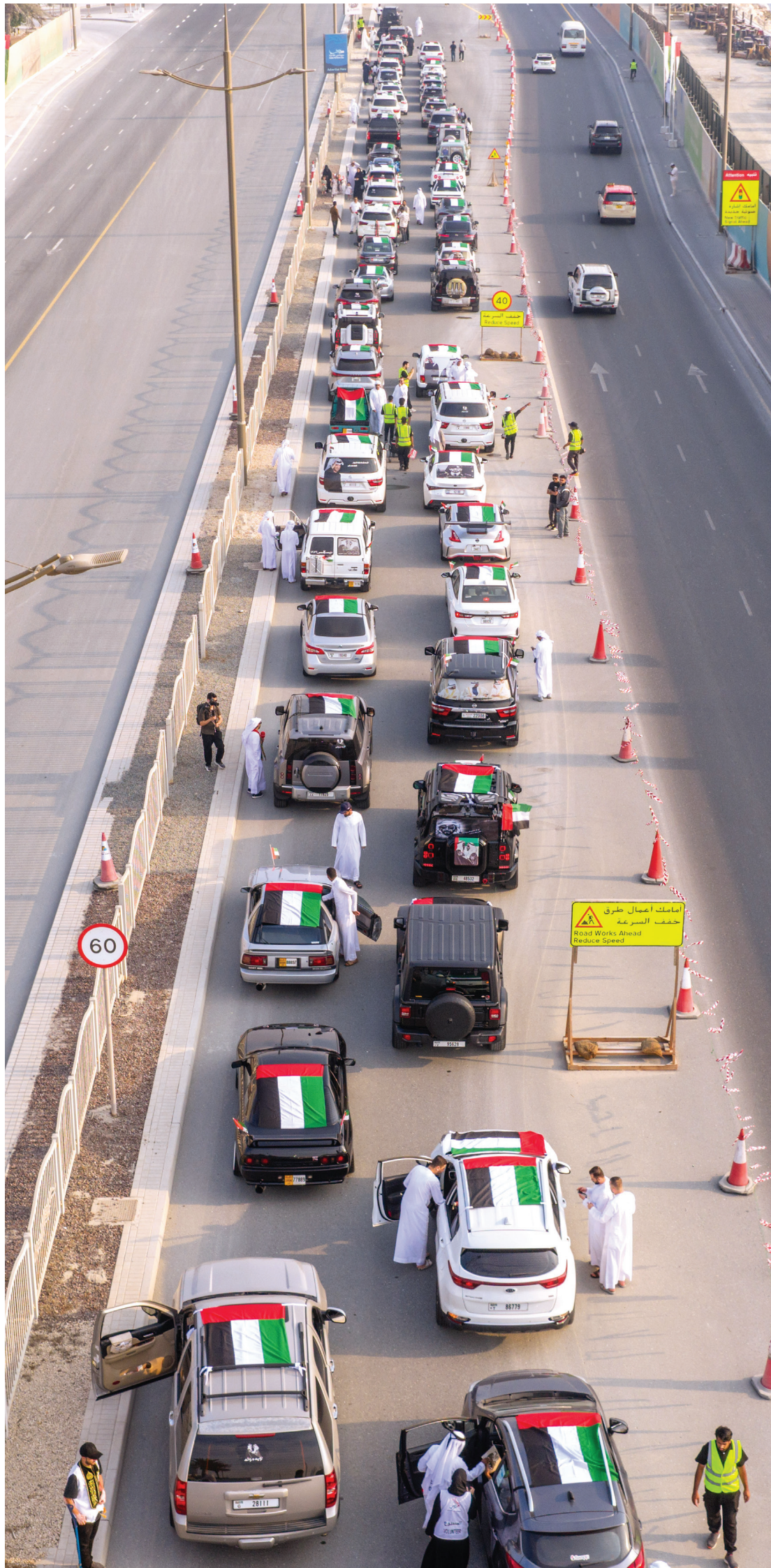
التزام بإرشادات المسيرة يؤكد المشاركة المجتمعية الواعية

نظم المسيرة «براند دبي» بالتعاون مع «لجنة تأمين الفعاليات» وهيئة تنمية المجتمع