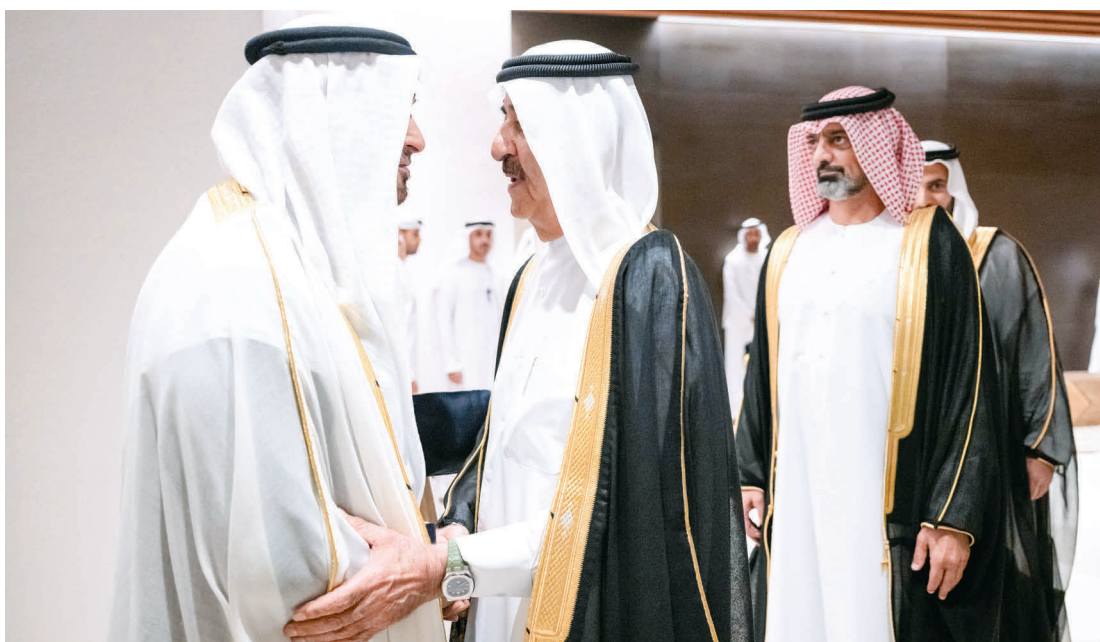
محمد بن زايد مصافحاً سعود المعلا بحضور عمار النعيمي