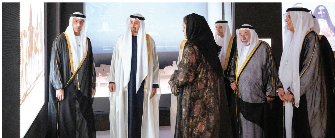
محمد بن زايد وسلطان القاسمي وحمد الشرقي وسعود بن مقر بحضور محمد المبارك

ويوثق متحف زايد الوطني إرث المؤسس المغفور له الشيخ زايد بن