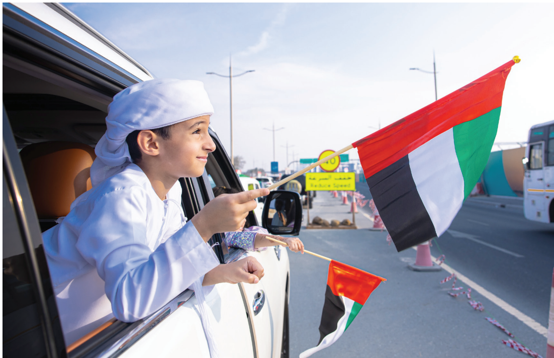
رفع علم الدولة تعبير عن الروح الوطنية