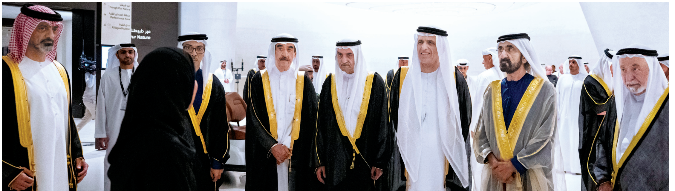
محمد بن راشد وسلطان القاسمي وحمد الشرقي وسعود المعلا وسعود بن صقر ومنصور بن زايد وعمار النعيمي