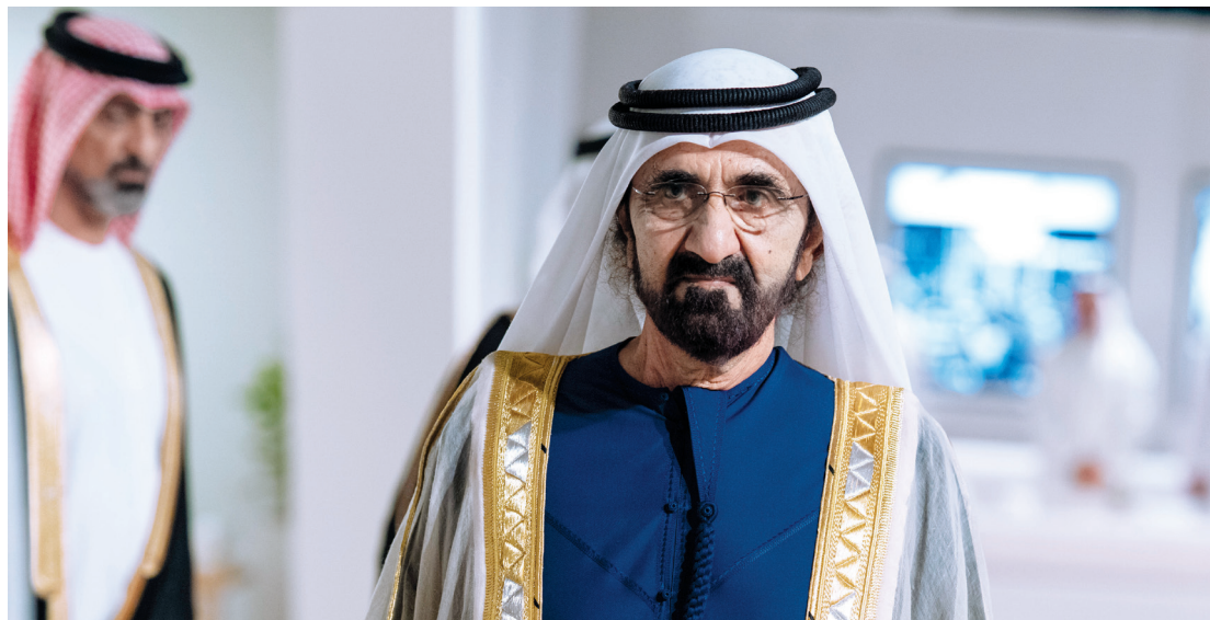
محمد بن راشد خلال الحفل بحضور عمار النعيمي