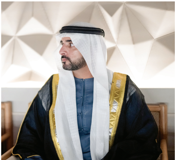
حمدان بن محمد خلال متابعة الحفل