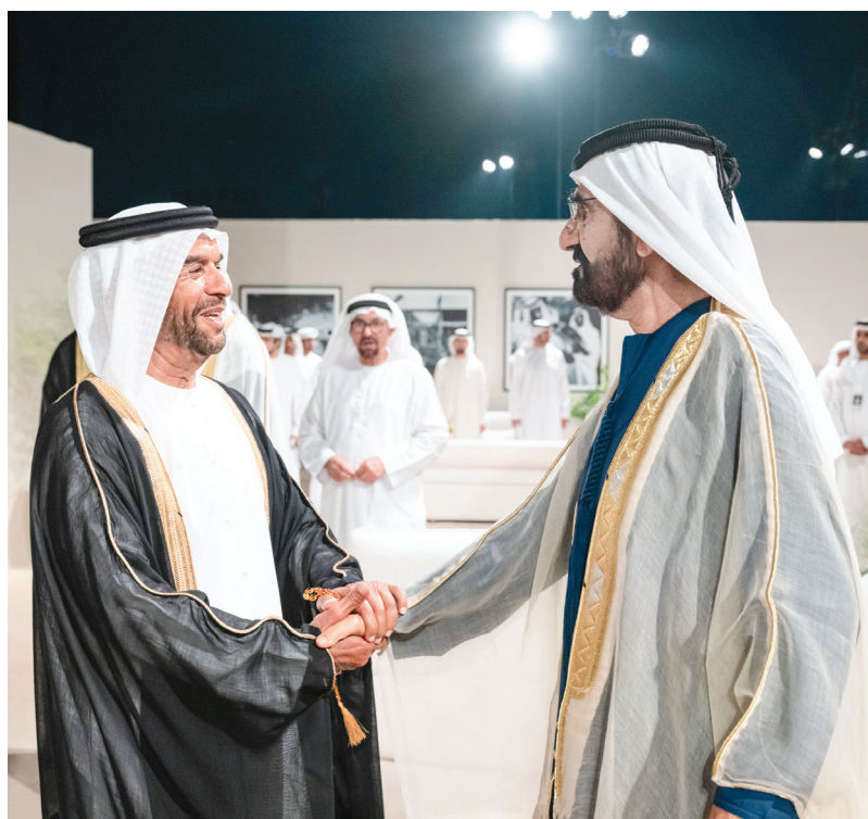
محمد بن راشد مصافحاً سرور بن محمد