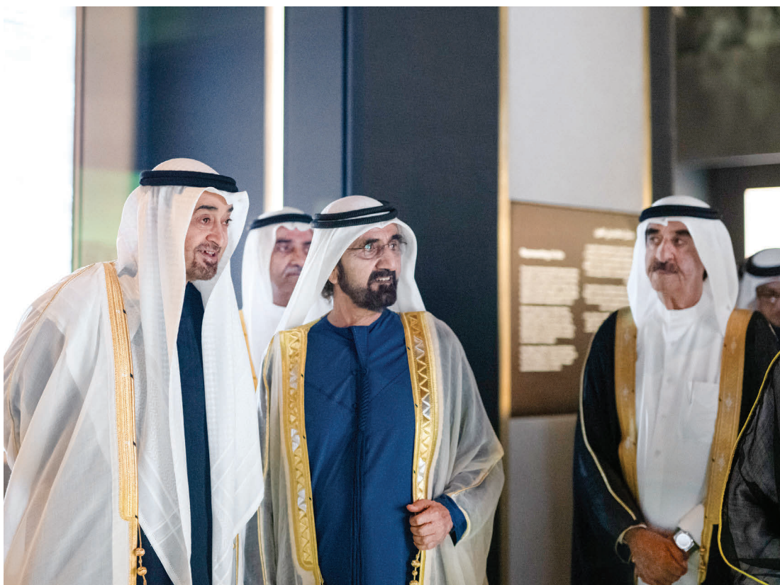
محمد بن زايد ومحمد بن راشد وحمد الشرقي وسعود المعلا