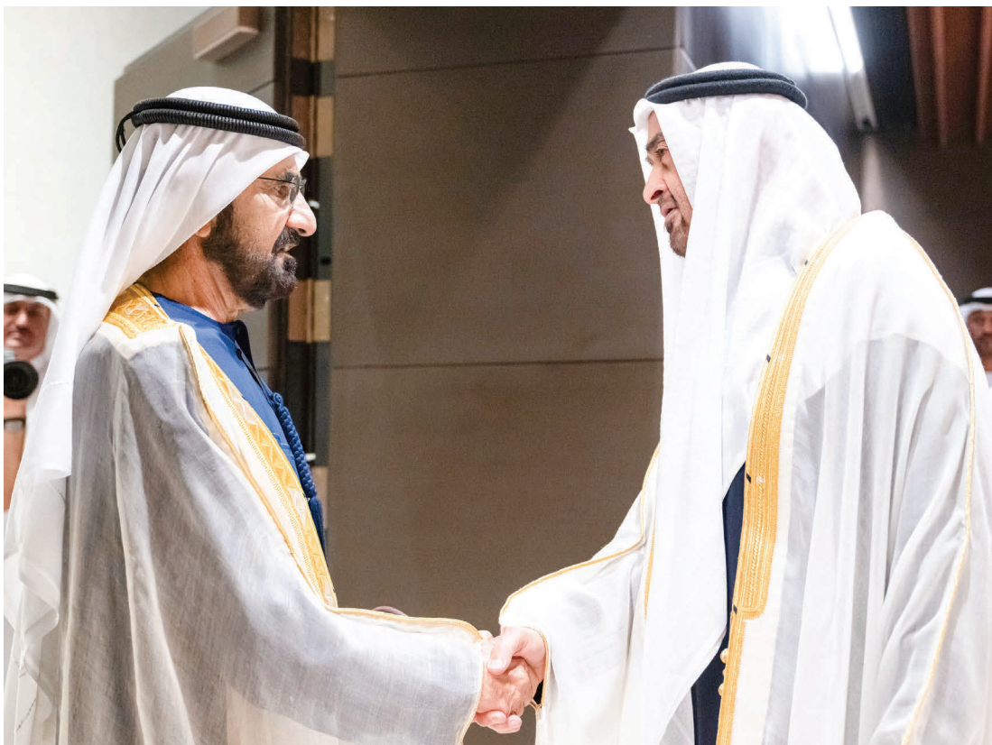
محمد بن زايد مصافحاً محمد بن راشد

وتضم مجموعة من التسجيلات الصوتية والصور الفوتوغرافية ومقاطع فيديو أرشيفية ومقتنيات شخصية. وقال صاحب السمو الشيخ محمد بن زايد آل نهيان، رئيس الدولة، حفظه الله، عبر منصة «إكس»: «إن الحفاظ على إرث الوالد المؤسس الشيخ زايد، رحمه الله، وتخليده ليظل مصدر إلهام للأجيال المقبلة، أولوية رئيسية ومسؤولية وطنية. ويمثل متحف زايد الوطني في أبوظبي الذي جرى افتتاحه بحضور إخواني الحكام صرحاً ثقافياً يحكي قصة زايد، ويخلد مسيرته وقيمته في القيادة والبناء والإنسانية، وجسراً يربط تاريخنا بحاضرنا ومستقبلنا، ونافذة على ثقافتنا وتراثنا وتقاليدنا عبر التاريخ».