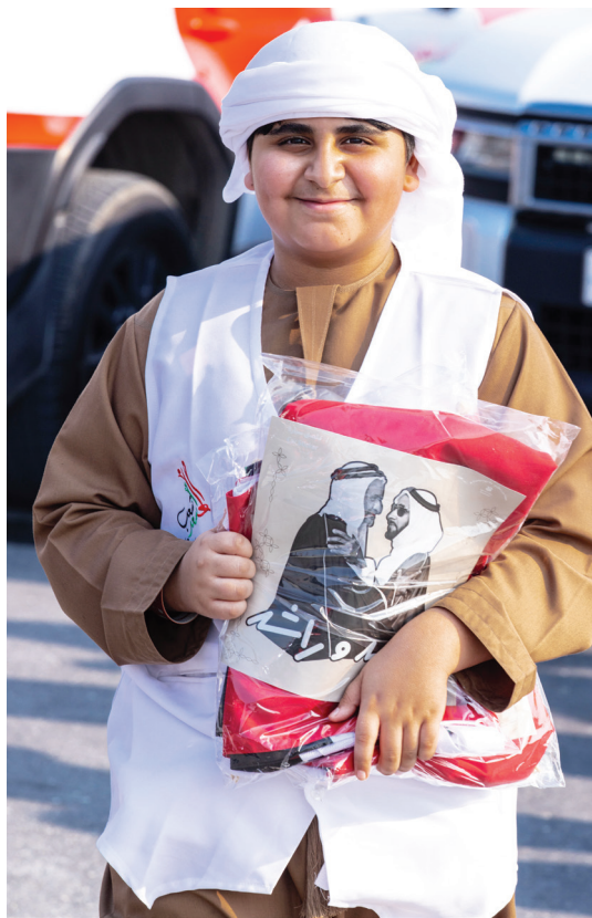
المتطوعون وزعوا 1000 غُلم على المشاركين