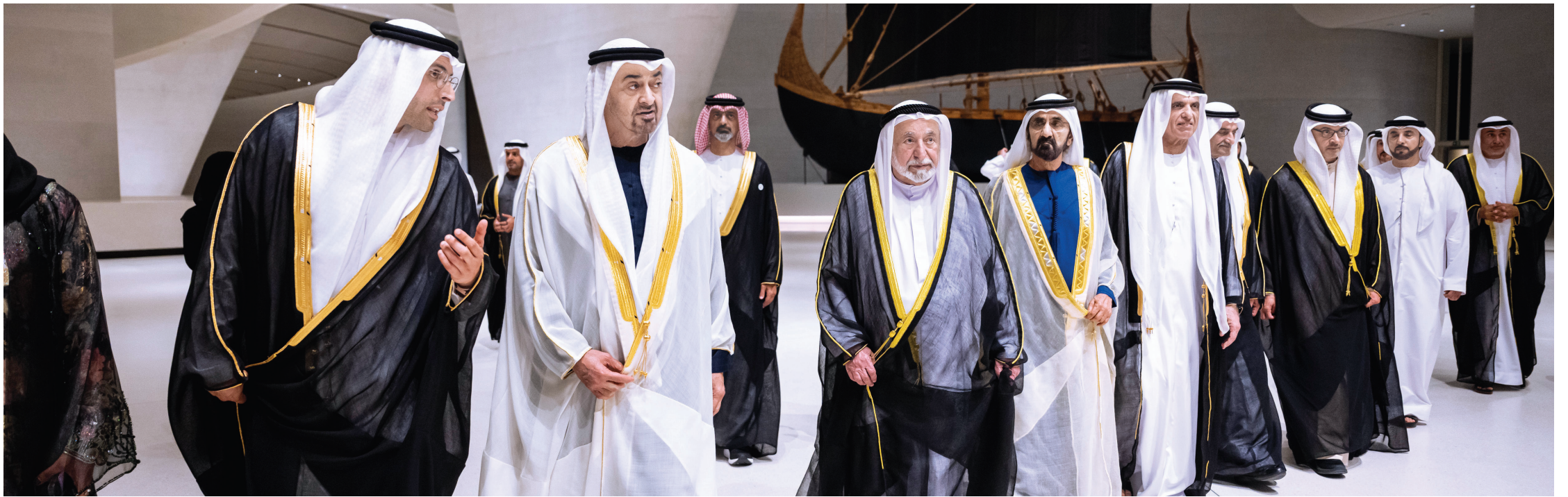
رئيس الدولة خلال افتتاح المتحف بحضور محمد بن راشد وسلطان القاسمي وحمد الشرقي وسعود بن صقر وعمار النعيمي وهزاع بن زايد