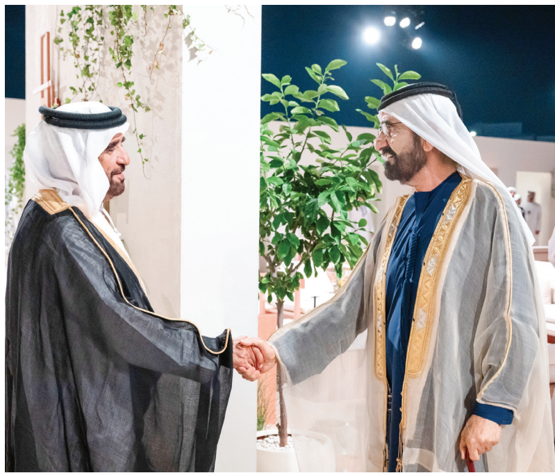
محمد بن راشد مصافحاً سيف بن محمد