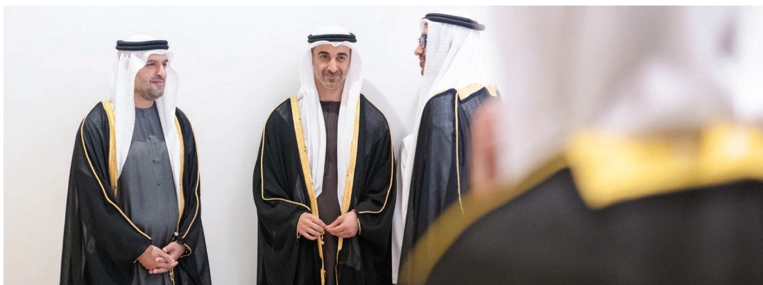
عبدالله بن زايد وحمدان بن محمد بن زايد ومحمد بن حمد بن طنون