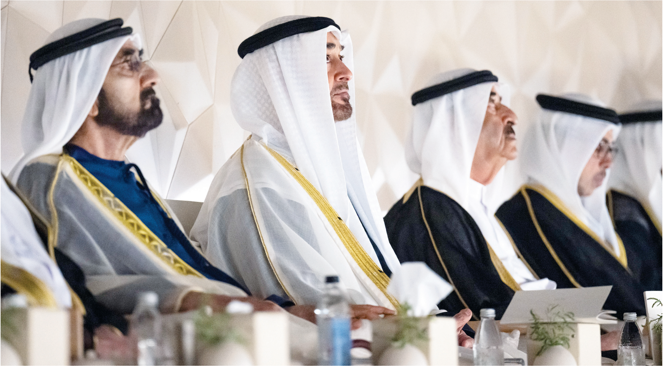
محمد بن زايد ومحمد بن راشد وسعود المعلا ومنصور بن زايد خلال الحفل