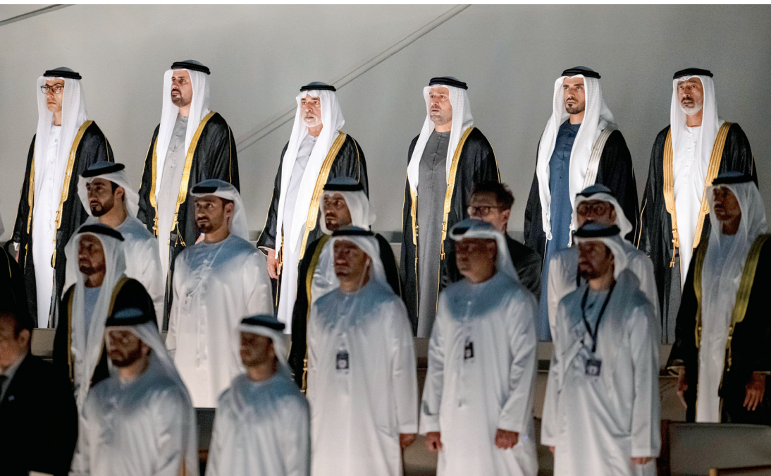
خالد بن زايد وذياب وزايد بن محمد بن زايد ونهيان بن مبارك ومحمد بن حمد بن طحون وسعيد بن حمدان