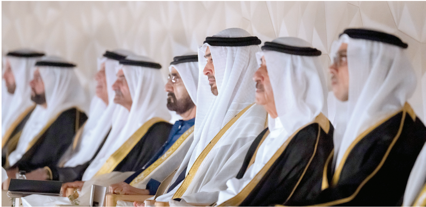
محمد بن زايد ومحمد بن راشد وحمد الشرقي وسعود المعلا وسعود بن صقر ومنصور بن زايد ومحمد الشرقي