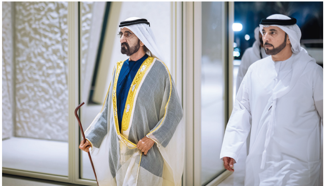
محمد بن راشد خلال الافتتاح بحضور سلطان السبوسي