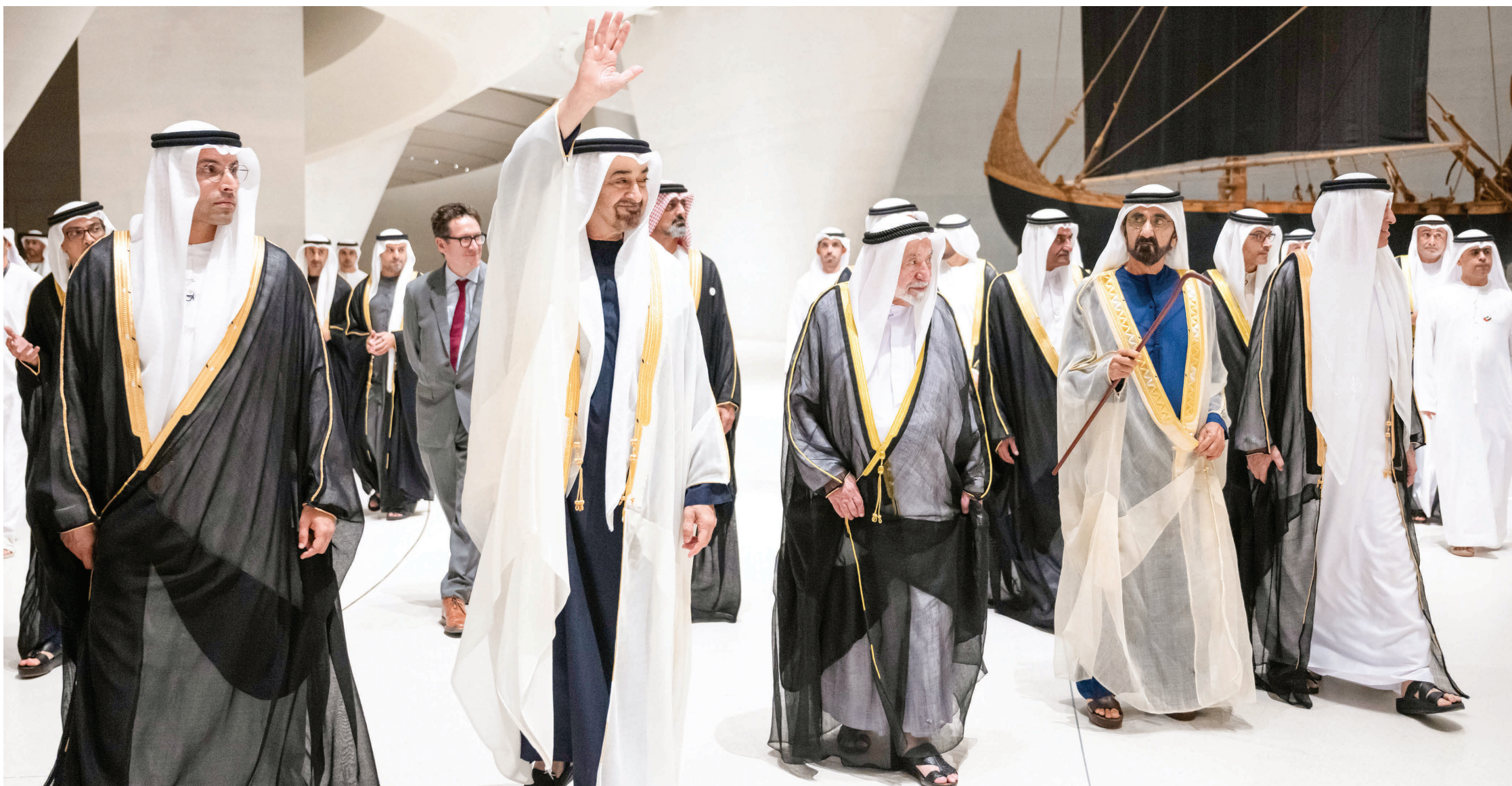
محمد بن زايد ومحمد بن راشد وسلطان القاسمي وحمد الشرقي وسعود بن مقر ومنصور بن زايد وعمار النعيمي وهزاع بن زايد وحمدان بن محمد بن زايد ومحمد بن حمد بن طنون ومحمد المبارك