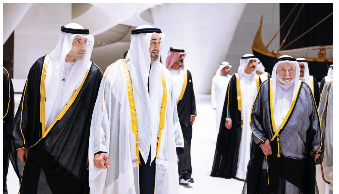
محمد بن زايد خلال جولة في المتحف بحضور سلطان القاسمي وحمد الشرقي وسعود المعلا وعمار النعيمي