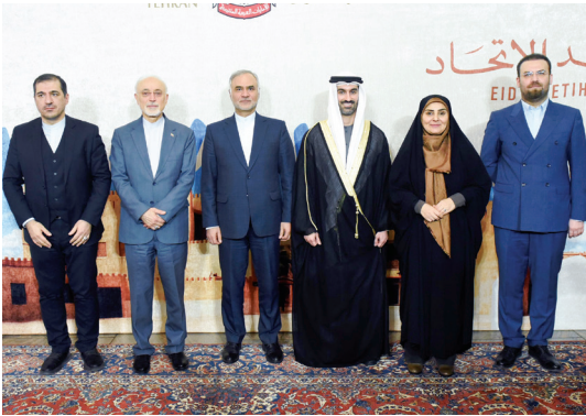
خالد بالهول وفرزانة صادق خلال الاحتفال بعيد الاتحاد

وقال سموه في تغريدة على حسابه في منصة «إكس»: «نبارك لقيادتنا الرشيدة وشعبنا العزيز ذكرى عيد الاتحاد، ونسأل الله أن يحفظ دولتنا وشعبنا وكل المقيمين على هذه الأرض الطبية، وفي هذا اليوم، نجدد العهد بالسير على خطى زايد وراشد والآباء المؤسسين، لنواصل مسيرة الريادة الإماراتية ونحقق آمال وطموحات شعبنا وأمتنا».