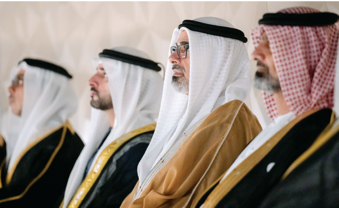
منصور بن زايد وخالد بن محمد وحمدان بن محمد وعمار النعيمي