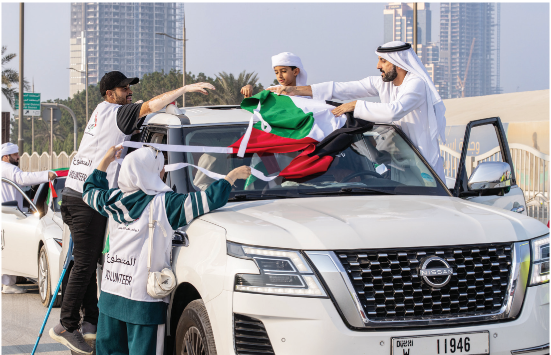
مشاركة لافتة في المسيرة واعتزاز بعلم الإمارات وقيم الاتحاد