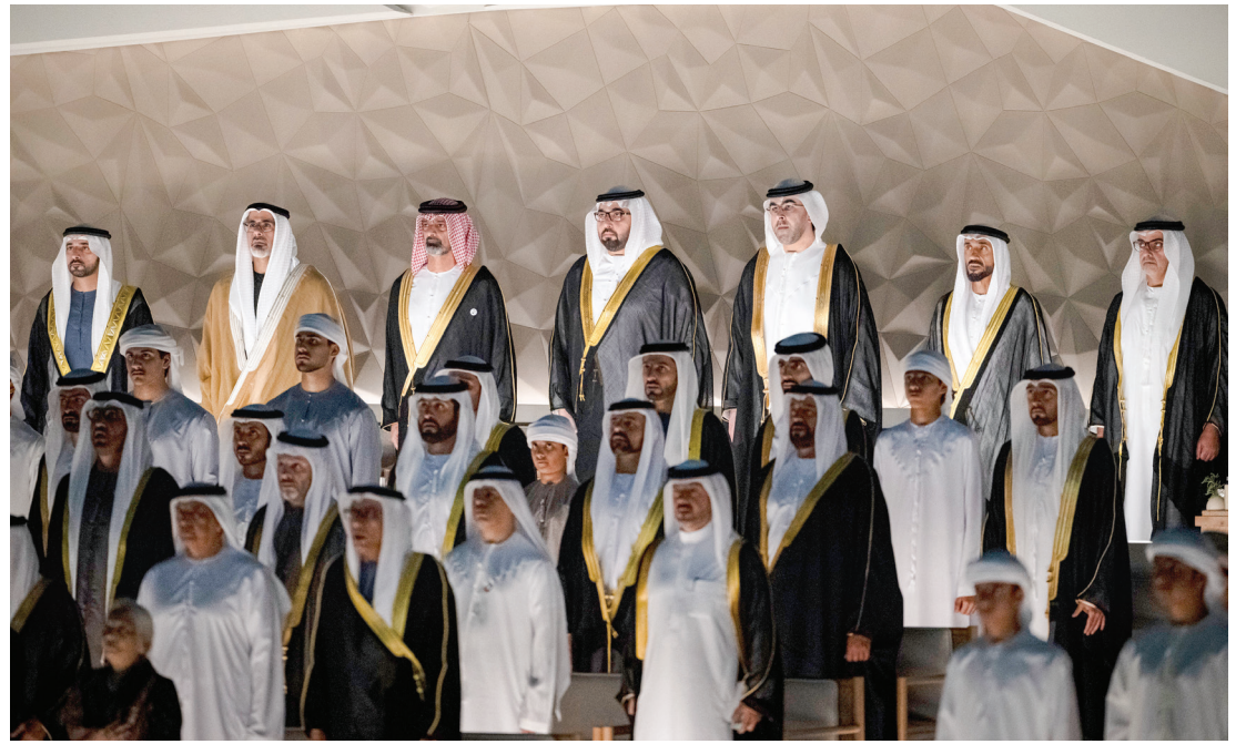
خالد بن محمد وحمدان بن محمد وعمار النعيمي ورashed وأحمد بن سعود ونهيان وحامد بن زايد