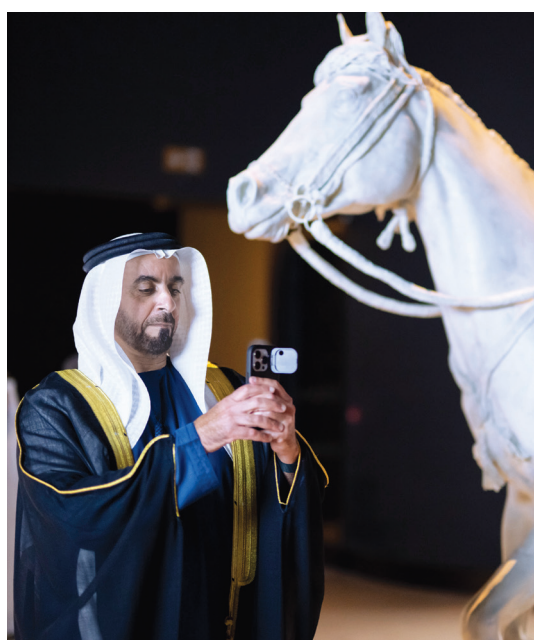
سيف بن زايد خلال جولة في المتحف