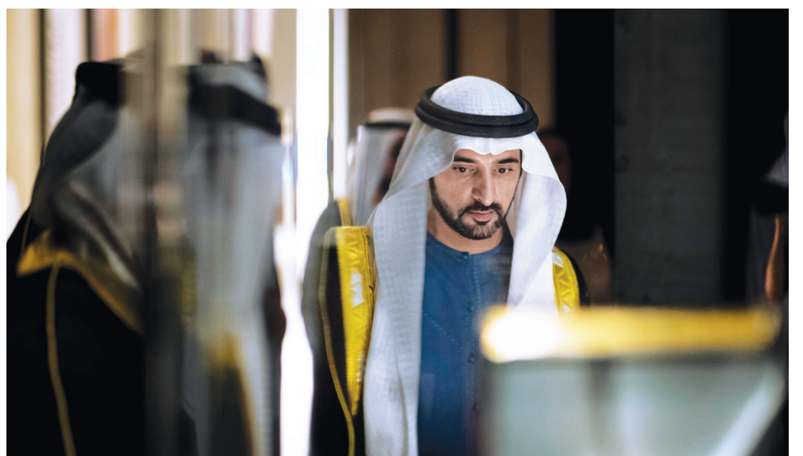
حمدان بن محمد خلال الاطلاع على مقتنيات المتحف