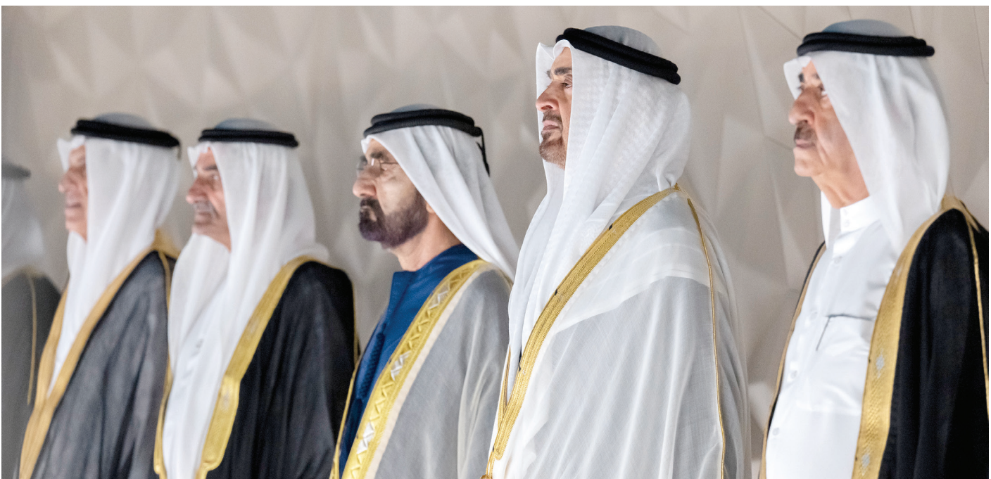
محمد بن زايد ومحمد بن راشد وحمد الشرقي وسعود المعلا وسعود بن مقر خلال متابعة فعاليات الحفل