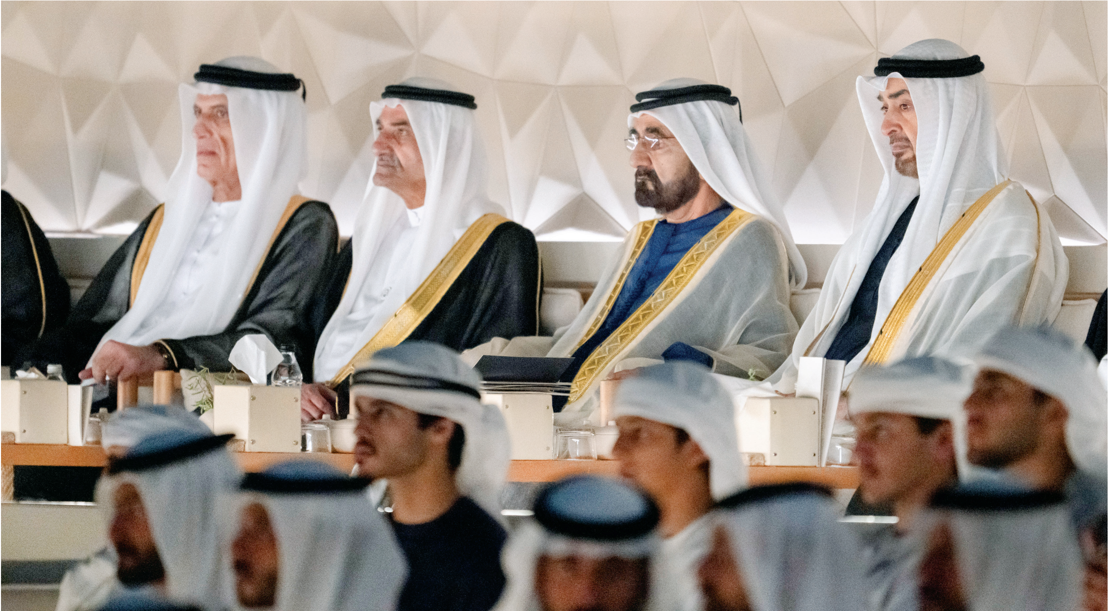
محمد بن زايد ومحمد بن راشد وحمد الشرقي وسعود بن صقر يتابعون فعاليات الحفل