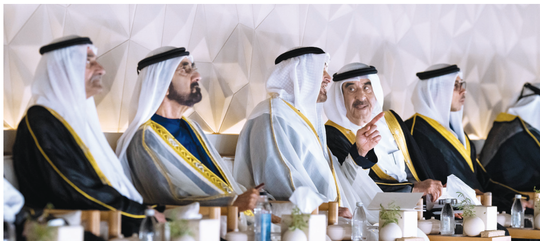
محمد بن زايد ومحمد بن راشد وحمد الشرقي وسعود المعلا ومنصور بن زايد خلال الحفل