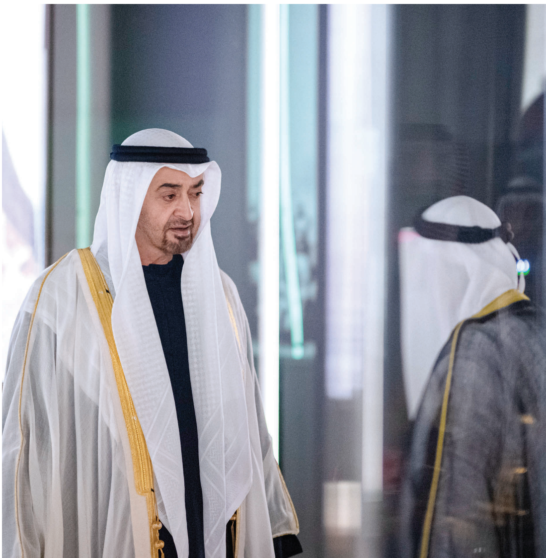
محمد بن زايد خلال افتتاح متحف زايد الوطني