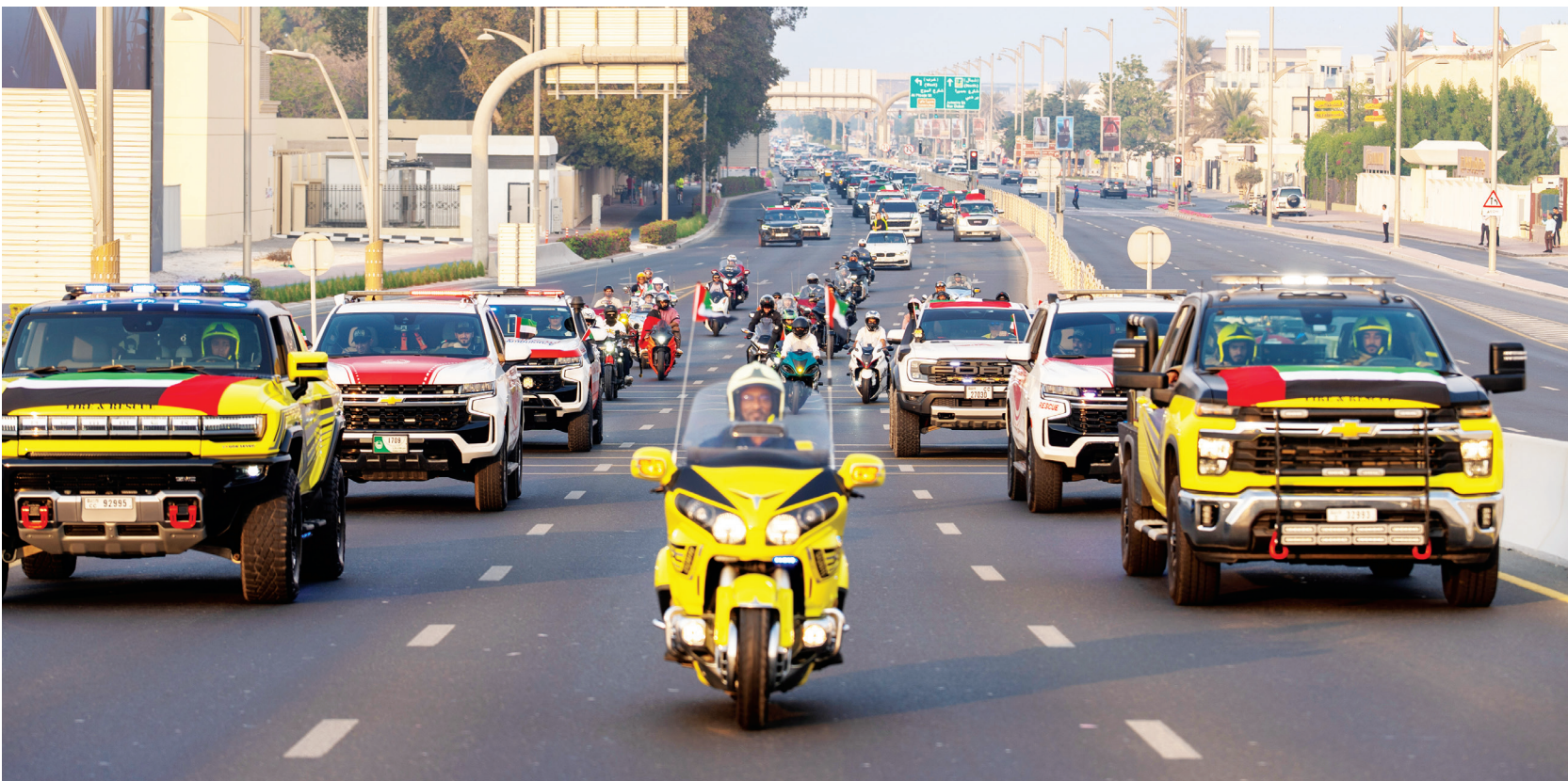
مشاعر تعبر عن الانتماء للإمارات والولاء لقيادتها الرشيدة

الإمارات منذ إعلان قيامها في العام 1971 على يد المغفور لهم الشيخ زايد بن سلطان آل نهيان، والشيخ راشد بن سعيد آل مكتوم، وإخوانهما الآباء المؤسسين، طيّب الله نراهم جميعاً، وصولاً إلى ما تشهده الدولة اليوم من إنجازات كبرى تصدرت بها العديد من مؤشرات