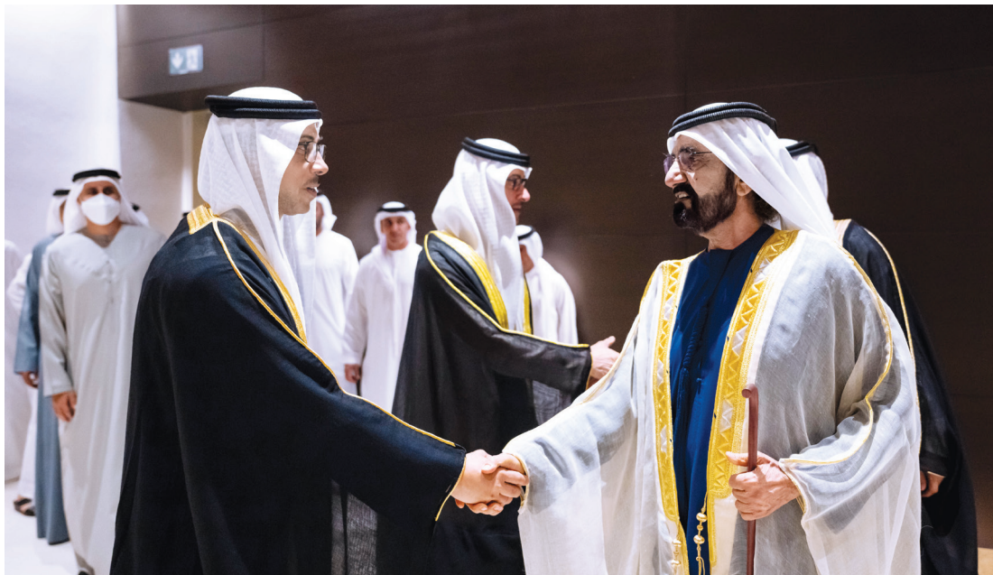
محمد بن راشد مصافحاً منصور بن زايد بحضور هزاع بن زايد