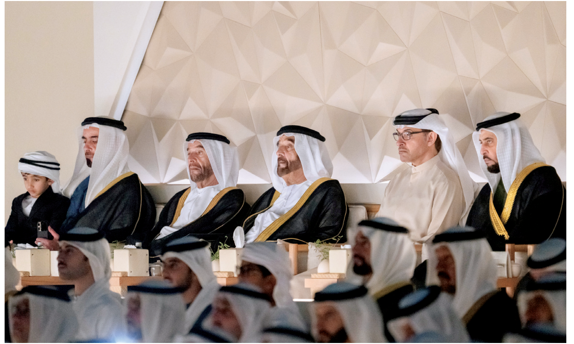
حمدان وهزاع بن زايد وسيف وسرور بن محمد وسيف بن زايد