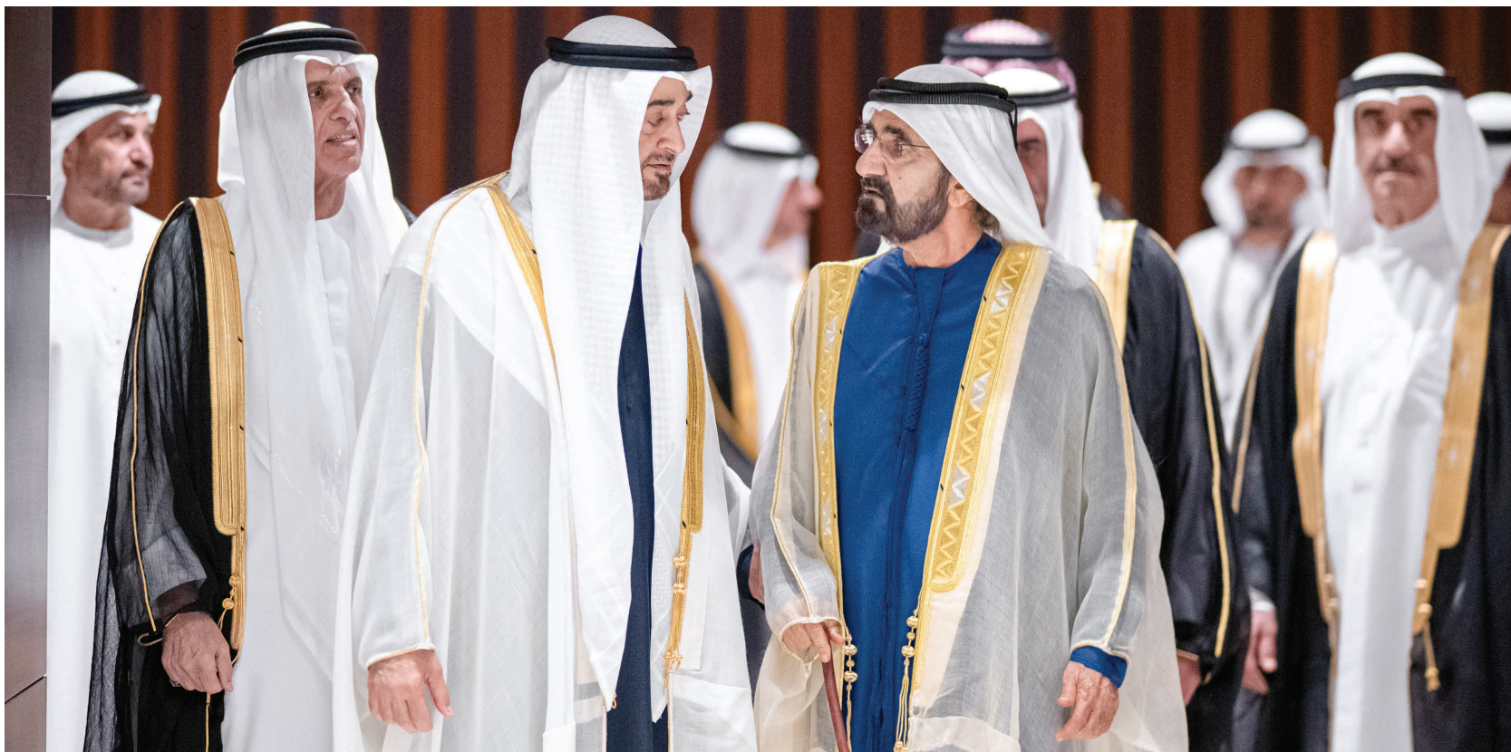
محمد بن زايد في حديث مع محمد بن راشد بحضور سعود المعلا وسعود بن مقر