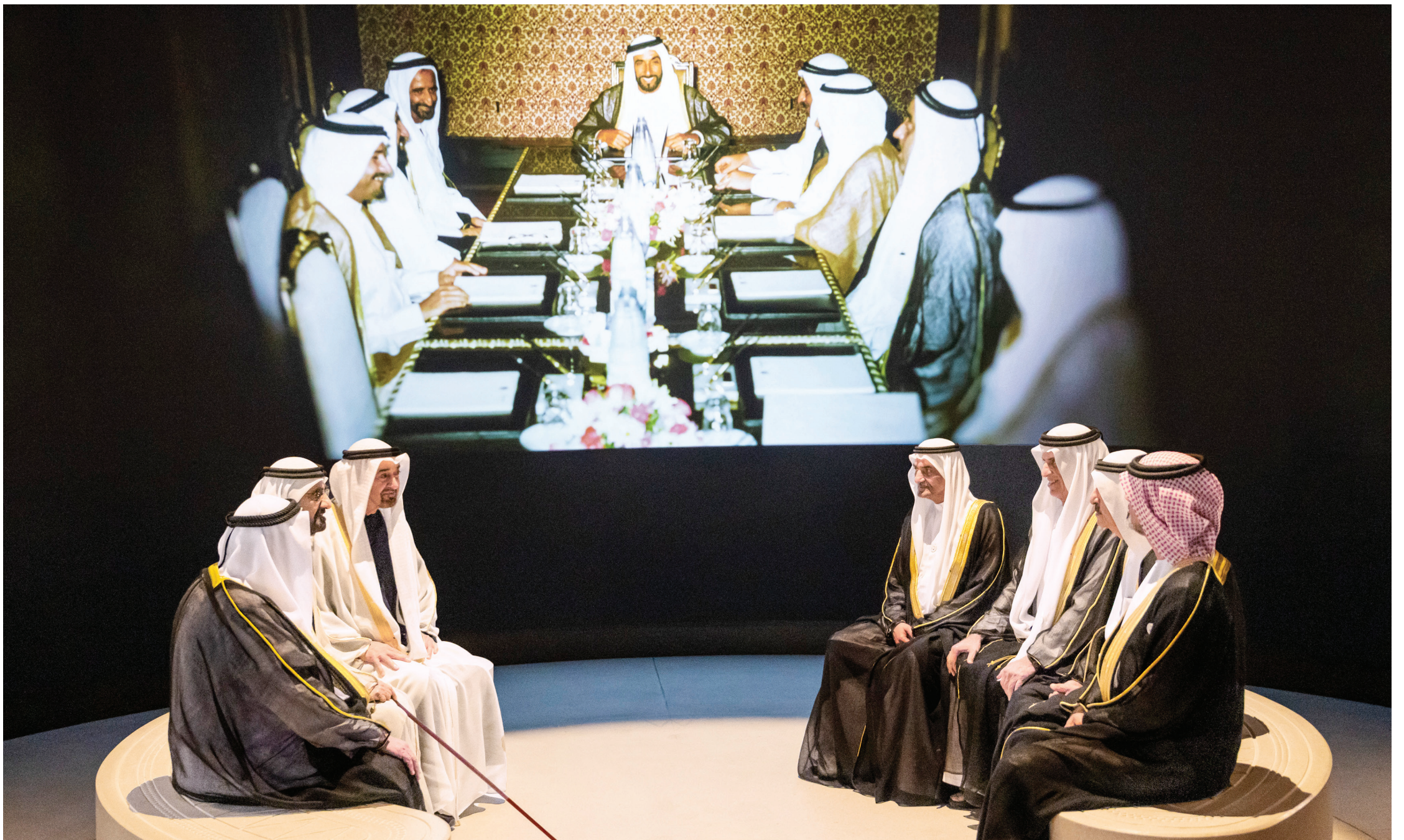
محمد بن زايد ومحمد بن راشد وسلطان القاسمي وحمد الشرقي وسعود المعلا وسعود بن صقر وعمار النعيمي في لقاء إلى جانب صورة تاريخية بمتحف زايد لاجتماع المجلس الأعلى