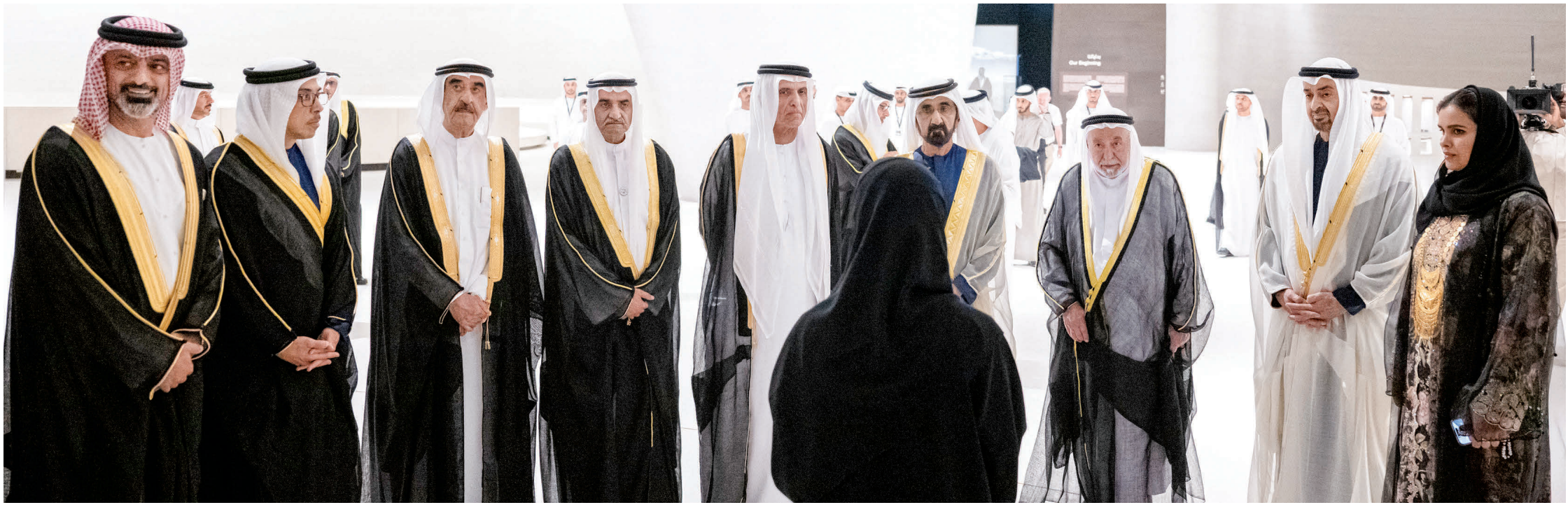
محمد بن زايد خلال افتتاح المتحف بحضور محمد بن راشد وسلطان القاسمي وحمد الشرقي وسعود المعلا وسعود بن مقر ومنصور بن زايد وعمار النعيمي