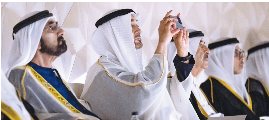
رئيس الدولة خلال توثيقه صوراً من الحفل بحضور محمد بن راشد وسعود المعلا ومنصور بن زايد