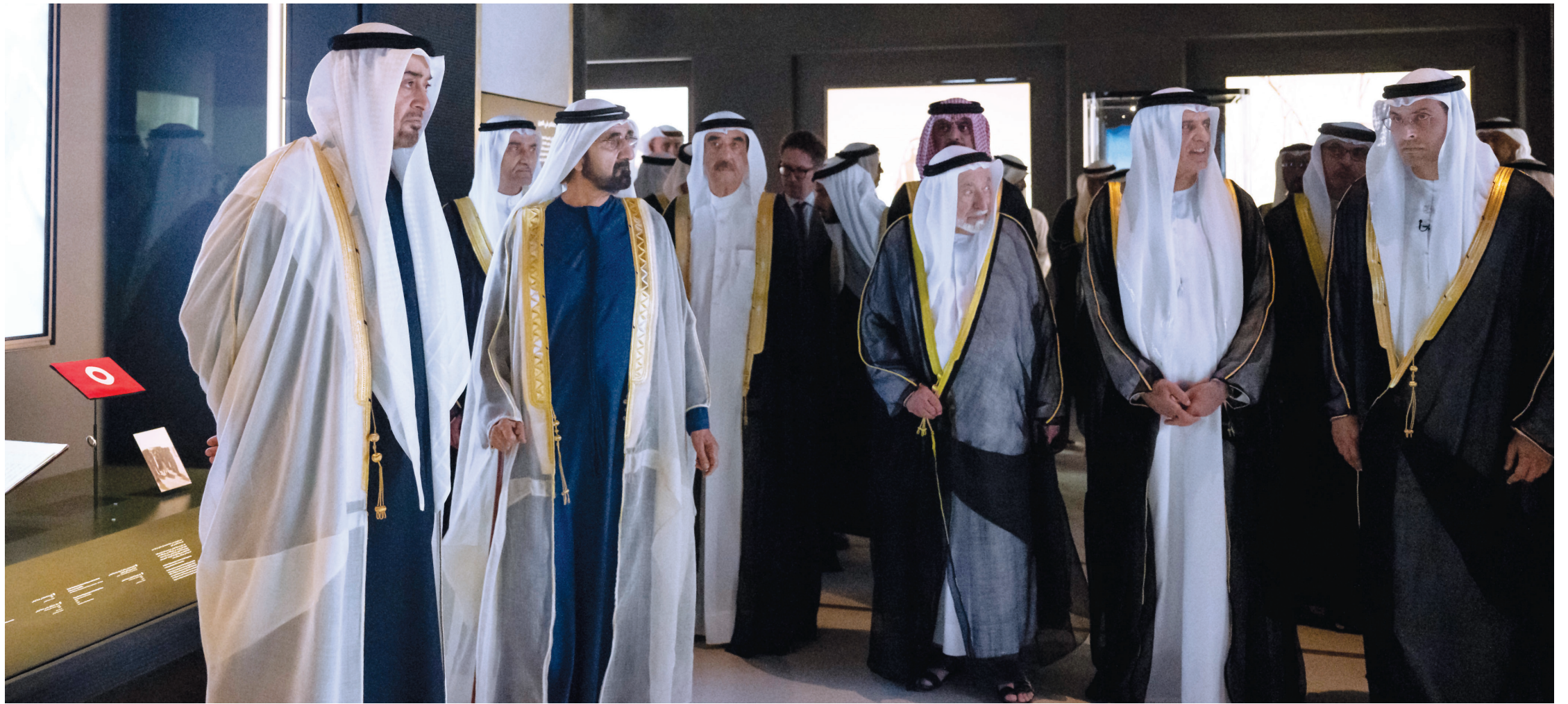
محمد بن زايد ومحمد بن راشد وسلطان القاسمي وحمد الشرقي وسعود المعلا وسعود بن صقر وعمار النعيمي وهزاع بن زايد ومحمد المبارك