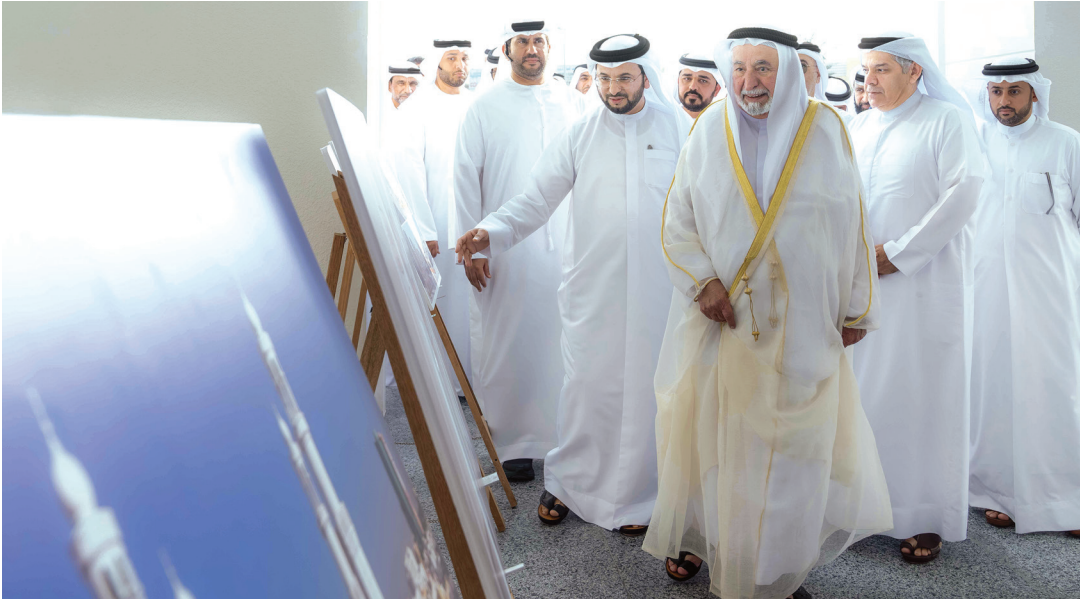
سلطان القاسمي خلال تدشين المشروع

ويأتي هذا الافتتاح تماشياً مع توجيهات سموه الهادفة إلى ترميم المساجد في إمارة الشارقة، ما يسهم في الحفاظ على بيوت الله، التي تعد رمزاً من رموز الشارقة. وأدى سموه والحضور ركعتي تحية المسجد، ليتعرف سموه بعدها على أبرز الأعمال، التي أنجزت لتطوير وتجميل مسجد الإمام النووي بمنطقة المناخ، مستمِعاً سموه إلى شرح حول التصميم المستخدمة والإضافات التي تمت، ومنها رفع منسوب المنارتين وجدران المسجد، وإضافة رواق خارجي، إضافة إلى تزويد المسجد بالخدمات والمرافق، التي تعزز من دوره الديني والاجتماعي، وتأكيداً على دعم واهتمام الشارقة بصيانة المساجد وتوسعتها وتطويرها، لتواكب احتياجات الأهالي والمصلين. رافق سموه خلال التدشين كل من: الشيخ فاهم بن سلطان القاسمي، رئيس دائرة العلاقات الحكومية، والشيخ محمد بن حميد القاسمي، رئيس دائرة الإحصاء والتنمية المجتمعية، والشيخ ماجد بن سلطان القاسمي، رئيس دائرة شؤون الضواحي، ومعالي عبدالرحمن بن محمد العويس، وزير دولة لشؤون المجلس الوطني الاتحادي، وعدد من كبار المسؤولين.