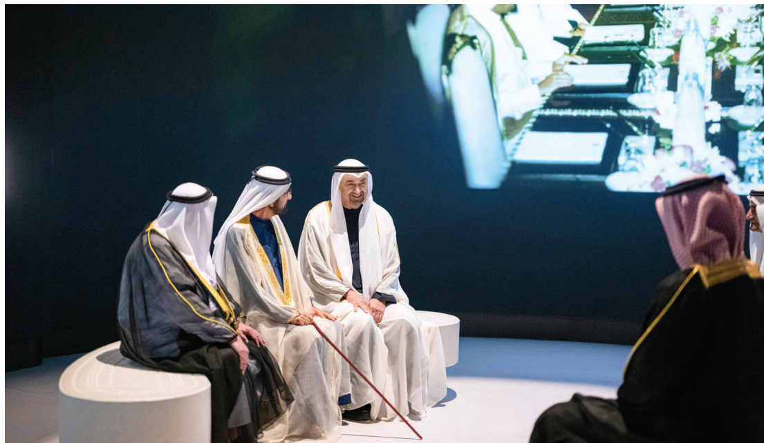
محمد بن زايد ومحمد بن راشد وسلطان القاسمي وحمد الشرقي وعمار النعيمي

وأكد صاحب السمو الشيخ محمد بن زايد آل نهيان، رئيس الدولة، أن متحف زايد الوطني صرح وطني، يخلد مسيرة الوالد المؤسس الشيخ زايد بن سلطان آل نهيان، رحمه الله، ونهجه في القيادة والبناء ورويته الإنسانية بجانب كونه يربط تاريخ الإمارات العريق بحاضرها ومستقبلها، والتعريف بثقافتنا وتراثنا وتقاليدنا عبر التاريخ. وأشار سموه إلى أهمية المتحف في توثيق أبرز المحطات