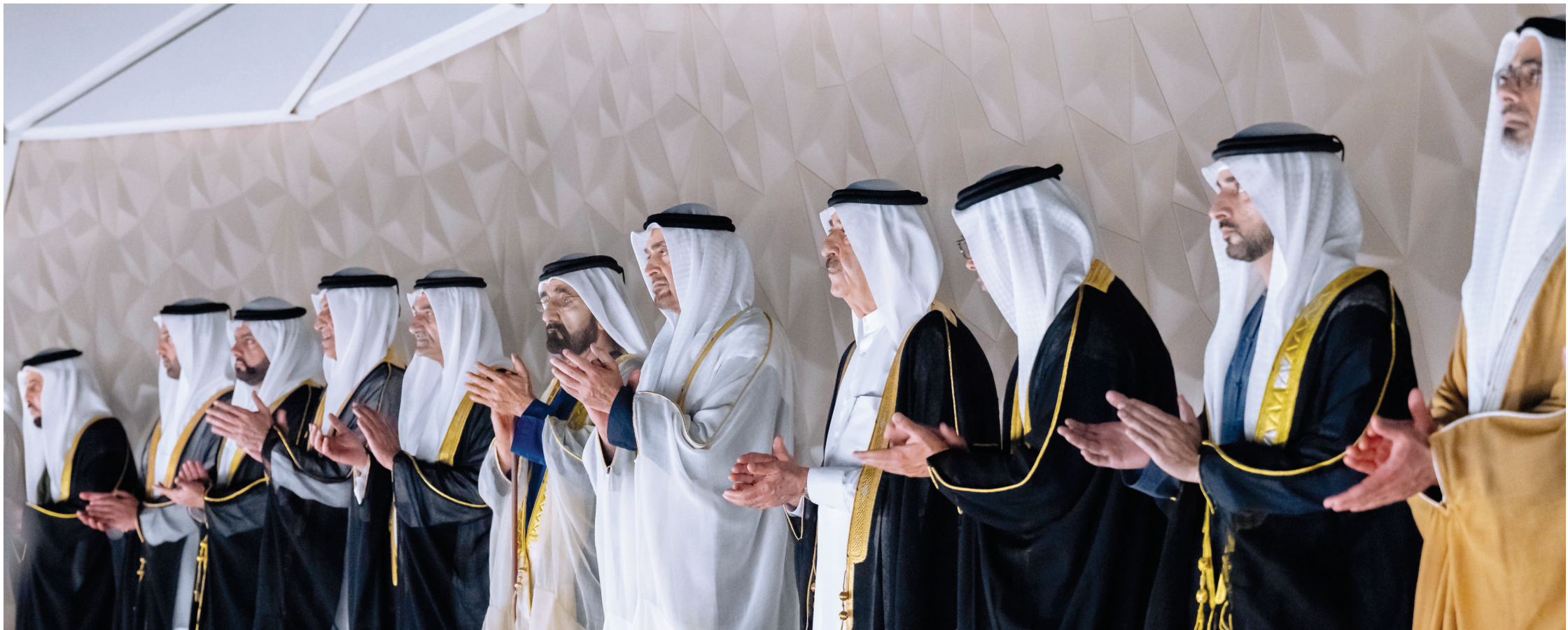
محمد بن زايد ومحمد بن راشد وحمد الشرقي وسعود المعلا وسعود بن مقر ومنصور بن زايد وخالد بن محمد بن زايد وحمدان بن محمد ومحمد بن حمد ومحمد بن سعود

شهد والحكام والشيوخ الاحتفال الرسمي بعيد الاتحاد الـ 54 في متحف زايد بأبوظبي