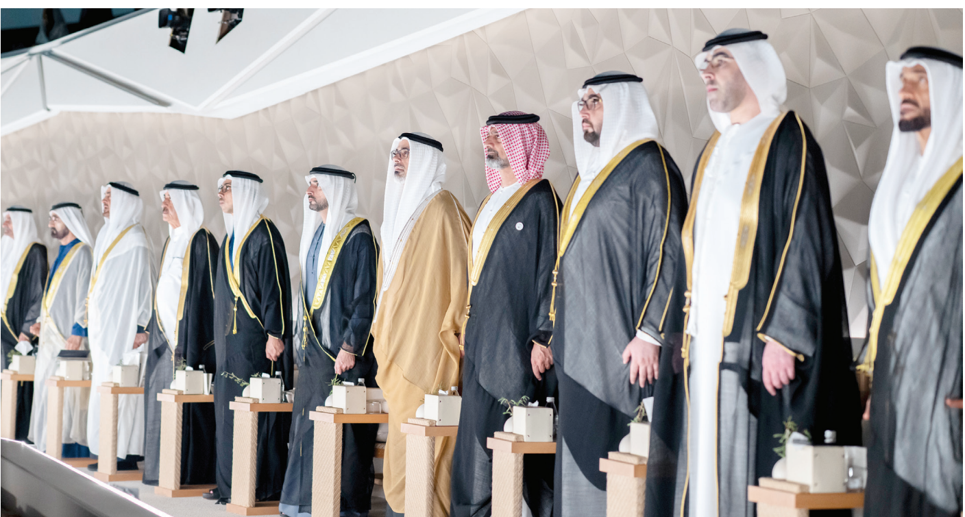
محمد بن زايد ومحمد بن راشد وحمد الشرقي وسعود المعلا ومنصور بن زايد وخالد بن محمد وحمدان بن محمد وعمار النعيمي وراشد وأحمد بن سعود ونهيان بن زايد