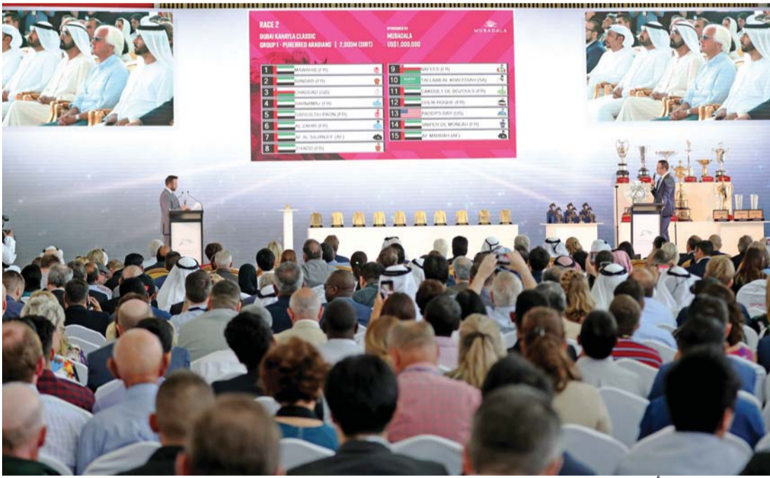
■ حفل القرعة استأثر بحضور واهتمام كبيرين

«أوردي» في الحارة رقم «1» والخيل «نورث أميركا» لقادروف ينطلق من الحارة رقم «2» والأميريكي «فن إيفيرا» ينطلق من الحارة رقم «3». وينطلق الأميركي «وست كوست» أبرز المرشحين للقب من الحارة رقم «9». وتنطلق المهرة التشيكية «فوريا كوزادا» من الحارة رقم «4»، فيما ينطلق «فور إيفر أنبريدلد» من الحارة رقم «6». وينطلق الأميركي «بافيل» من الحارة رقم «8».