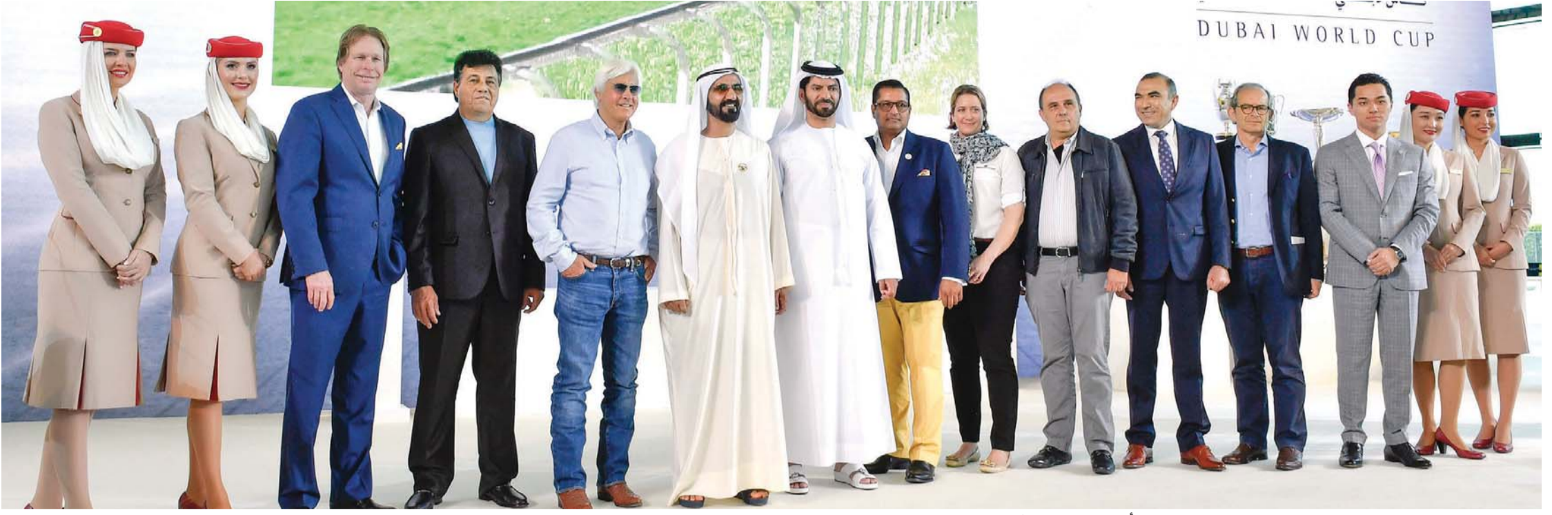
محمد بن راشد في لقطة تذكارية مع المديرين المشاركين في شوط كأس دبي العالمي