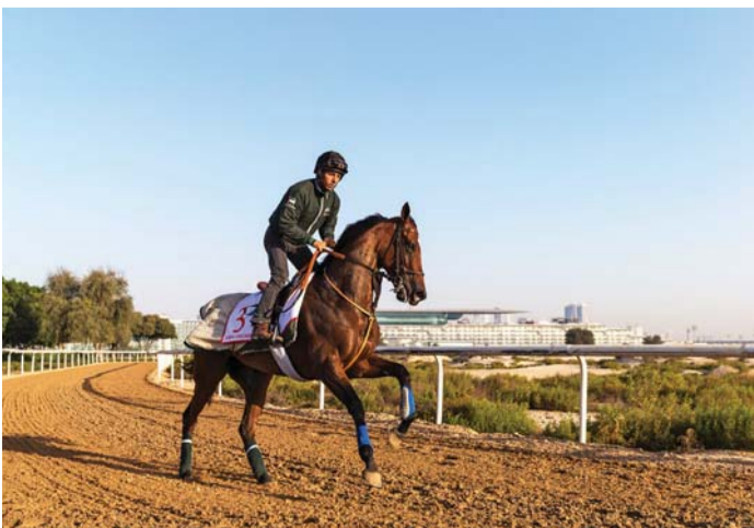
«فيوريا كروزادا» خلال التدريب