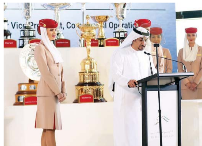
الغيث يلقي كلمته

لقد باتت طيران الإمارات تلعب دوراً رئيساً في تحقيق التواصل بين الشعوب والثقافات، فنحن نوفر للمسافرين عبر العالم وصولاً سهلاً إلى عدد كبير ومتنام من الوجهات، وخدمات لا تضاهى على الأرض وفي الأجواء، ونحن بذلك نساعدهم الناس على الاستمتاع بتجارب وثقافات جديدة. إن لدينا التزاماً قوياً بدعم جهود دبي الترويجية الرامية إلى تعزيز مكانتها عالمياً في كافة المجالات، الرياضية والتجارية والاستثمارية والسياحية. وتصب رعاية طيران الإمارات مناسبات كبرى، مثل كأس دبي العالمي، في هذا الاتجاه.