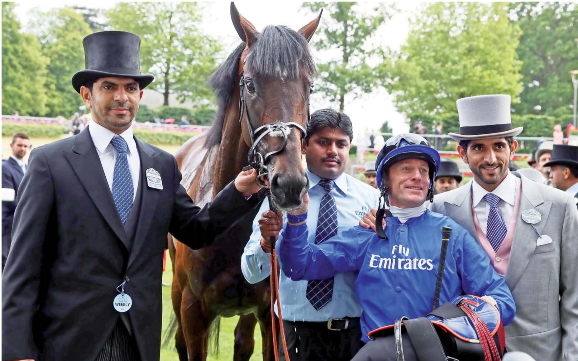
حمدان بن محمد وسعيد بن سرور خلال إنجاز أوروبي لجودلفين

وجود «ويست كوست» في البوابة رقم 9 لا يشكل خطراً علينا