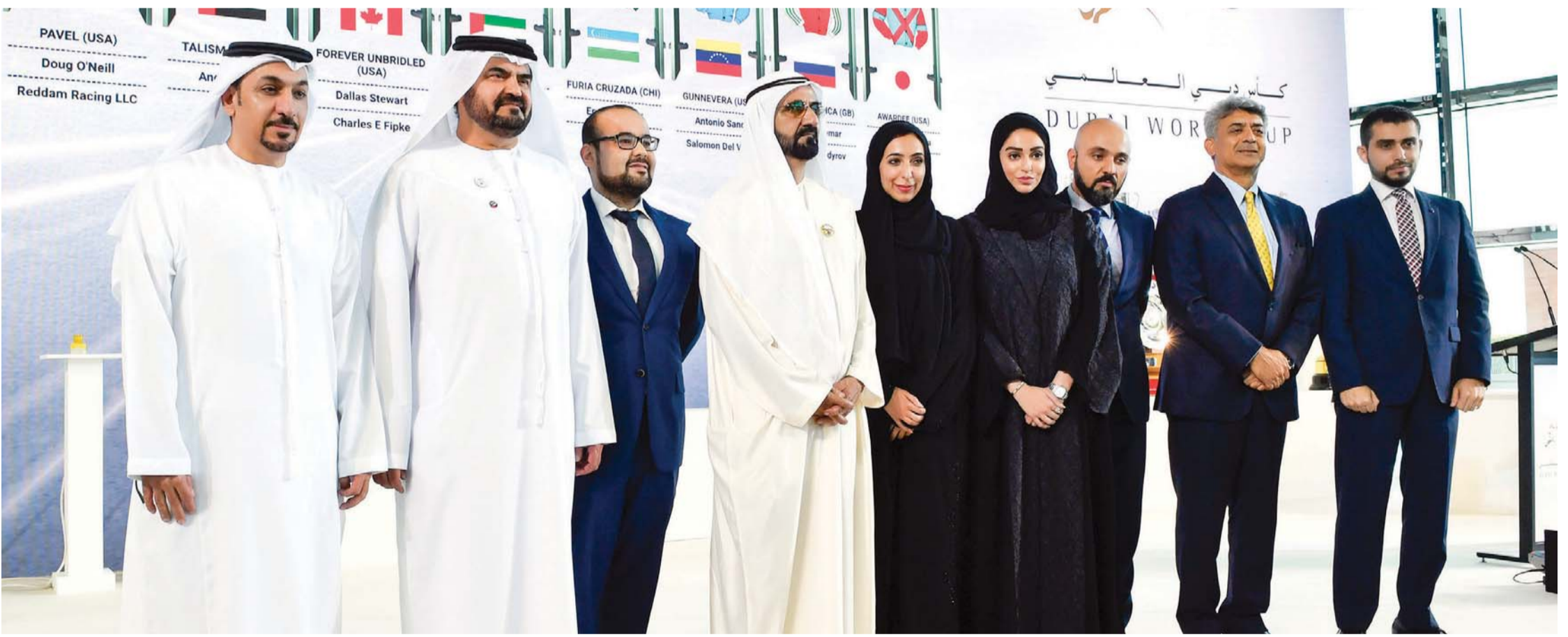
فارس العرب في صورة تذكارية مع رعاة الحدث العالمي الكبير