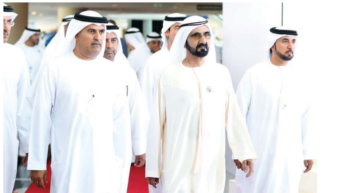
محمد بن راشد لحظة وصوله الاحتفال بحضور سعيد الطاير وسلطان السبوي

وأوقعت قرعة شوط «دبي غولدن شاهين» لمسافة 1200 متر برعاية غلف نيوز عن وقوع الأميركي «مانديور بيسكيتس» في الحارة رقم «1»، الأميركي «إكس واي جت» في الحارة رقم «2»، وأوقعت «رينالدو ذا ويزارد» لمؤسسة زعيل للسباقات الدولية في الحارة رقم «3». وينطلق الأميركي «روي إتش» من الحارة رقم «6»، وينطلق «شيلونغ» من الحارة رقم «7» ويليه «ميا كاتش» من الحارة رقم «8»، فيما ينطلق الأميركي «وايلد دودي» من