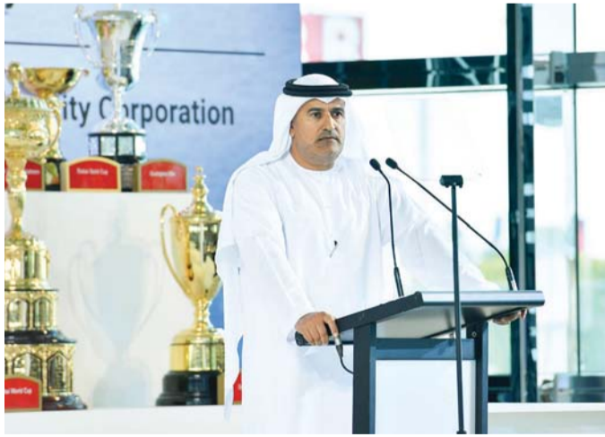
■ الطائر يلقي كلمته

كما تقدم الطائر بالشكر والتقدير للشركاء «مدينة محمد بن راشد - دستركت ون»، و«طيران الإمارات»، و«لونجين»، و«موانئ دبي العالمية»، و«جلف نيوز»، و«عزيزي للتطوير»، و«مجموعة سعيد محمد النابودة»، و«مبادلة»، و«الطائر للسيارات». وفي الختام، توجه الطائر بالشكر للملك والفرسان الذين شاركوا في كل بطولات كأس دبي العالمي السابقة، والمشاركين في منافسات يوم السبت المقبل، مؤكداً أنه لا يوجد خاسر في هذا اليوم، فإن شرف المنافسة الاستثنائية في مونديال الخيل، بحضور مؤسس هذا الحدث العالمي، صاحب السمو الشيخ محمد بن راشد آل مكتوم، نائب رئيس الدولة، رئيس مجلس الوزراء، حاكم دبي، رعاه الله، يكفي، مقدماً الشكر لسموه لحضور مراسم القرعة.