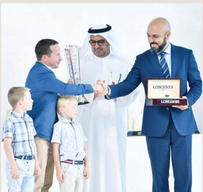
البيسطي وعون يتوجان تاغ أوشيه