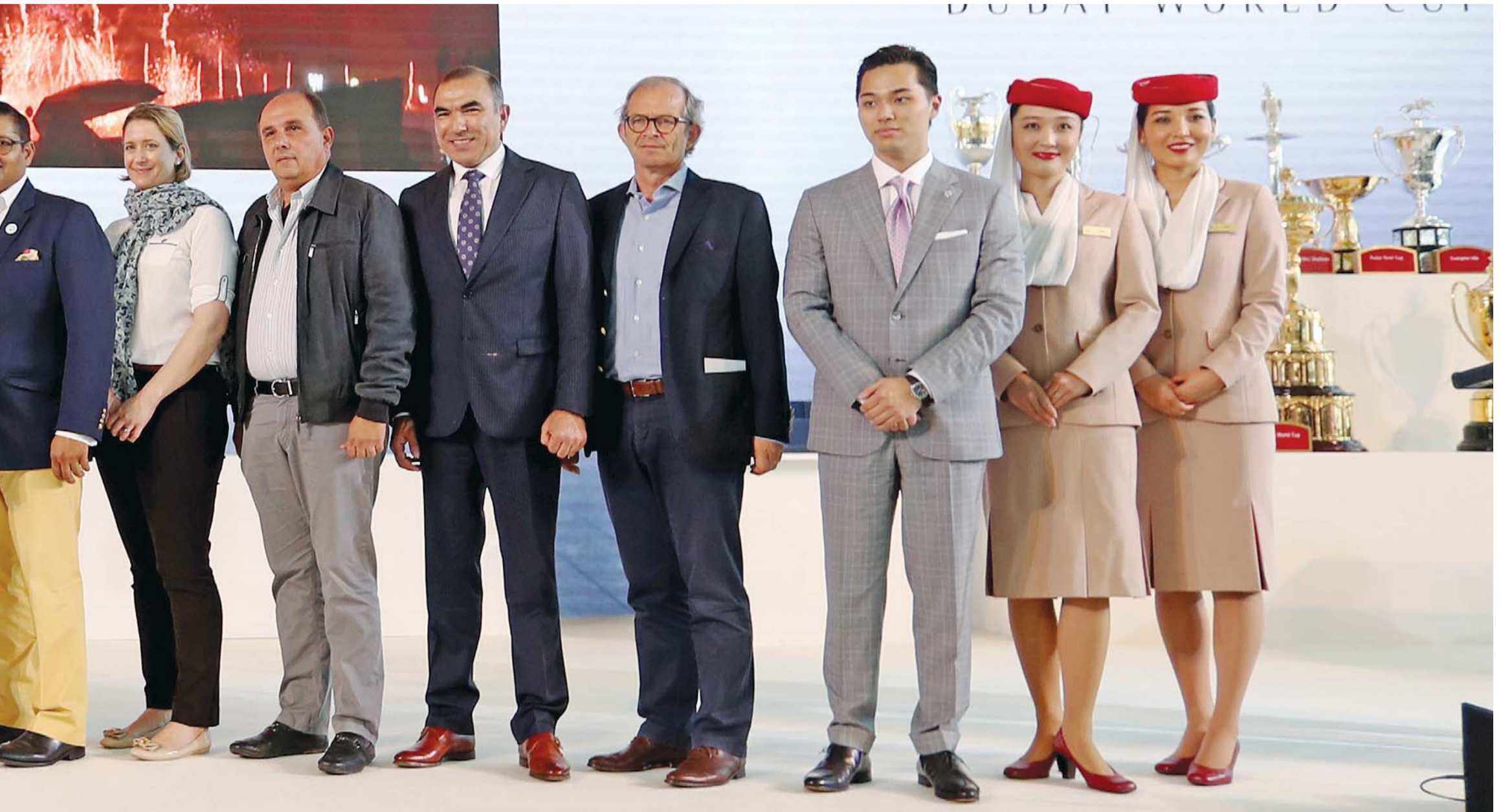
■ محمد بن راشد في لقطة جماعية مع مدربي الشوط الرئيسي