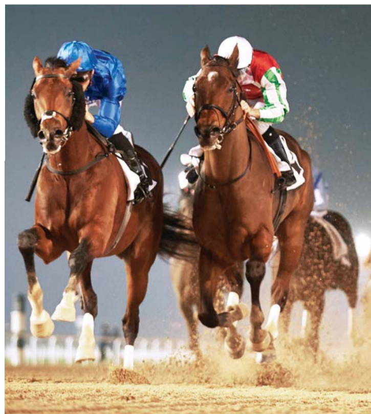
«ثندر سنو» تفوق على «نورث أميركا» في الجولة الثانية لكأس آل مكتوم | أرشيفية

ويعاون مدرب جودلفين، طاقم فني متميز، ويحتفظ بسجل ناصع من الإنجازات في البطولات الكبرى، التي توجتها المهرة الرائعة والخطيرة «كيب فيردي»، بفوزها الساحق بسباق 1000 جينيز الإنجليزي عام 1998، لتكتمل حلقة الفوز لإسبيل الأزرق في